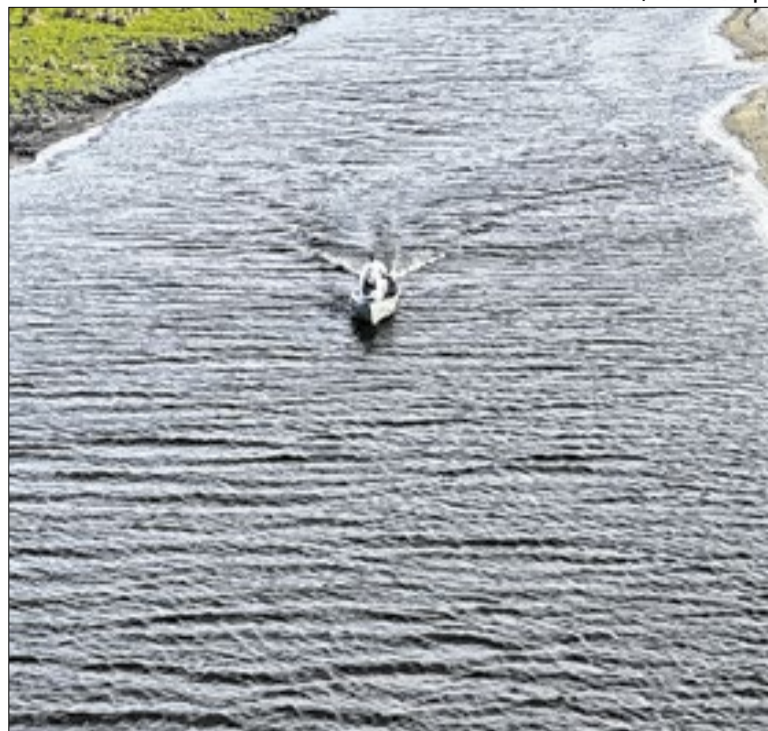
Equipes utilizaram barcos para intensificar vigilância

Londrina (PR) é finalista do XIII Prêmio Sebrae Prefeitura Empreendedora, na categoria Gestão Inovadora, com o programa Acelera Londrina. A ferramenta da prefeitura simplifica a abertura de empresas. A premiação ocorrerá na quarta-feira (22), em Curitiba (PR), reunindo projetos de outros municípios.