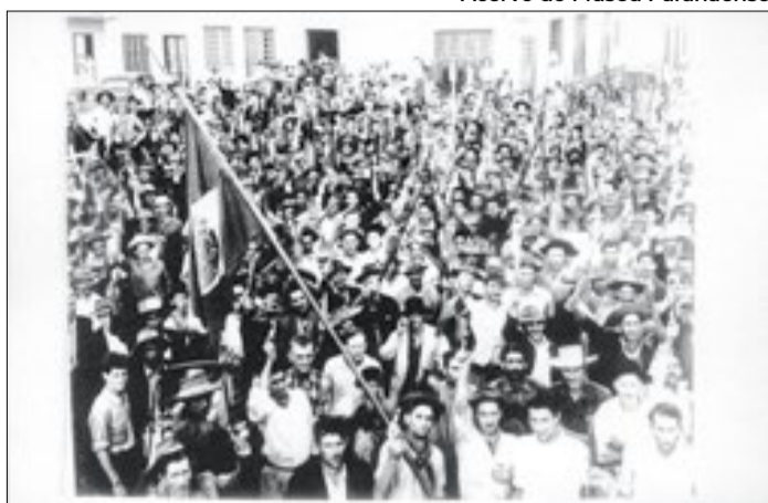
Colônia paranaense é um marco no direito a terras