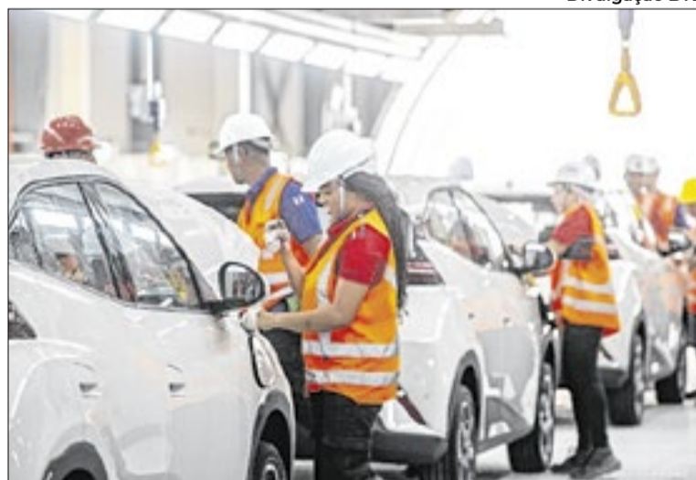
BYD em Camaçari/BA tem mais de 2 mil trabalhadores

A recente redução da taxa Selic para 14,75% ao ano pelo Comitê de Política Monetária (Copom) pode favorecer novas operações de financiamento, embora bancos e financeiras ainda mantenham cautela na