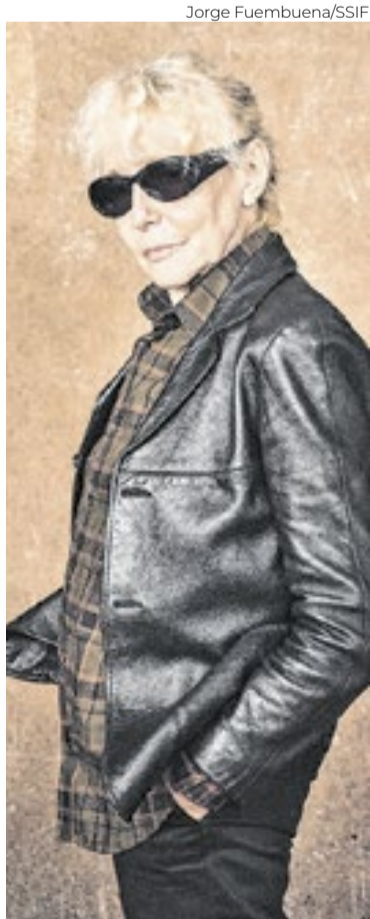
Aos 79 anos, a diva autoral Claire Denis receberá a Carroça de Ouro de Cannes