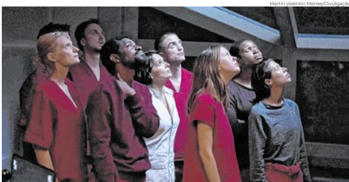
'Vida Celeste' tem Robert Pattinson, Mia Goth, Juliette Binoche e André Benjamin no elenco