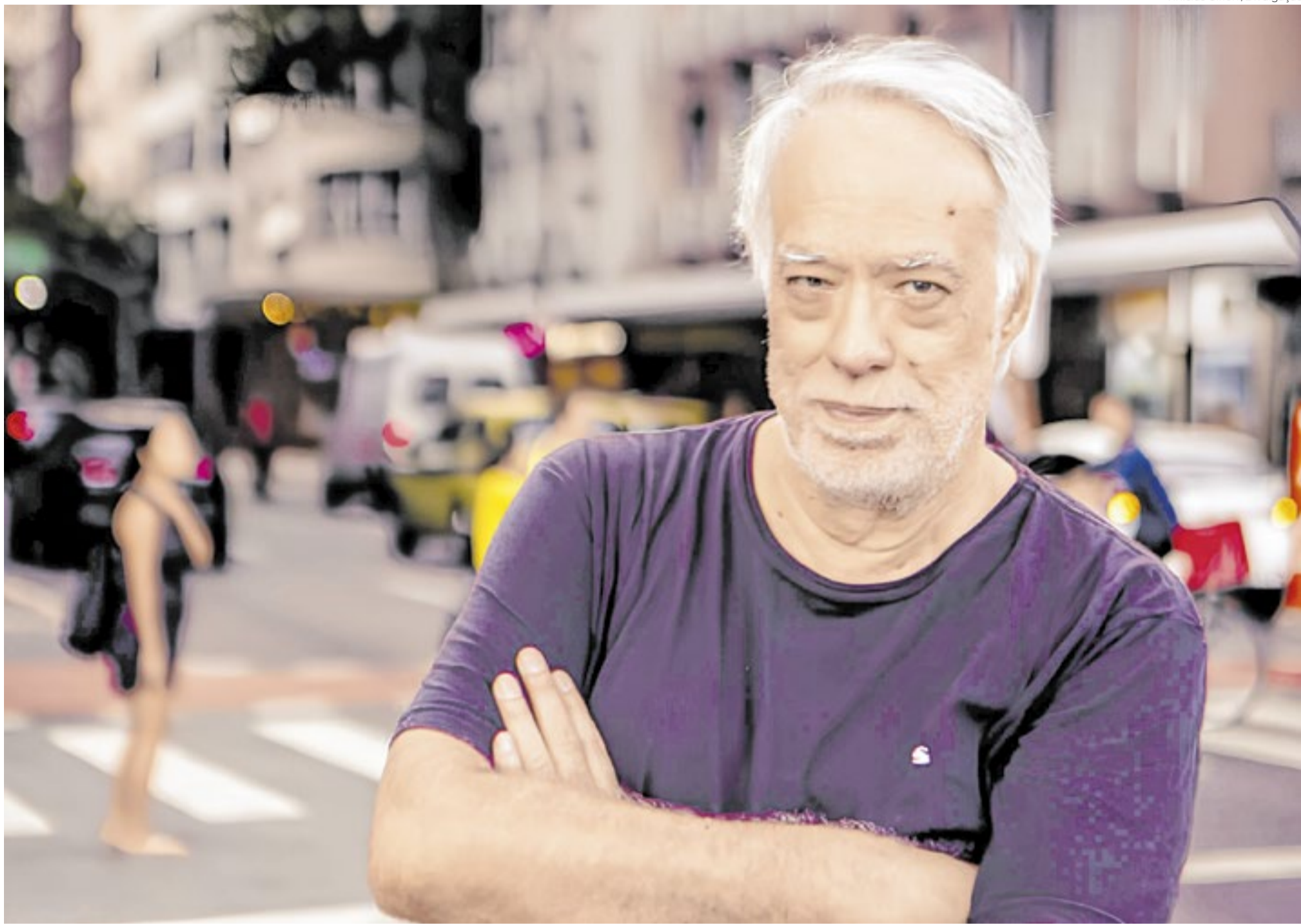
Fausto Fawcett em Copacabana, seu habitat natural, personagem e fonte de inspiração de uma vasta obra que engloba música, literatura, teatro e performance