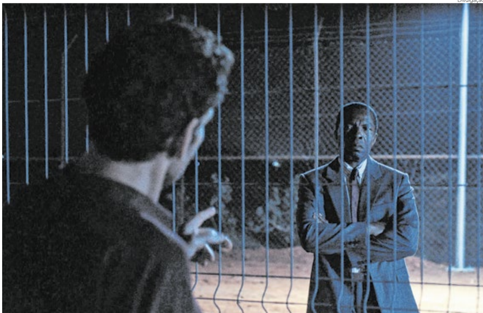
Isaach De Bankolé encara Matt Dillon em 'A Cerca', indicada à Concha de Ouro de San Sebastián

Integrante do coletivo de diretoras celebradas na mostra Mestras do Macabro, no CCBB, a realizadora francesa agita o maior festival da Argentina com estudo sobre ranços coloniais