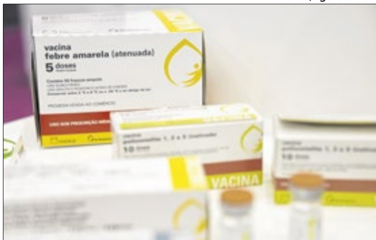
Vacinação é a melhor maneira de evitar a doença

A Secretária Municipal de Cunha informou que o homem que morreu trabalhava no setor de celulose em uma cidade próxima. A prefeitura diz que vai investigar onde aconteceu a infecção.