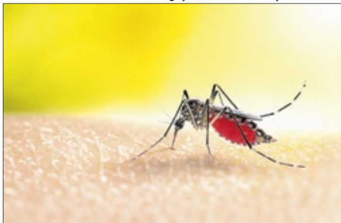
Aedes aegypti , principal alvo das ações de prevenção