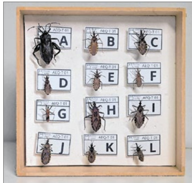
Painel enviado para identificação nos municípios pernambucanos

O resultado é uma fraqueza muscular que pode afetar pernas, braços, o rosto e, em casos graves, dificultar a respiração. Nessas situações, o paciente pode ficar completamente paralisado e precisar de ajuda de aparelhos para respirar. A maioria das pessoas se recupera, mas alguns pacientes ficam com sequelas permanentes.