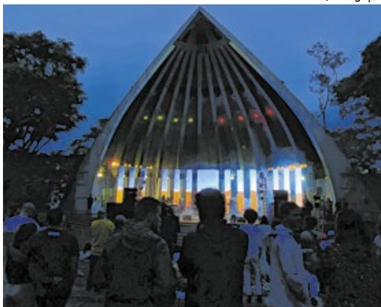
Concha Acústica é um dos palcos mais vibrantes da cidade