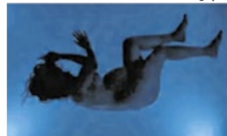
Uma das fotos da exposição

A exposição “Prazer” explora a percepção de Brivic sobre a relação entre seres humanos em trânsito, destacando a fluidez e a necessidade de presença nesse movimento. Divi-