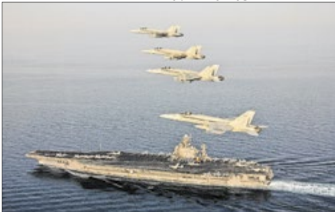
Embarcações americanas seguem à postos na região