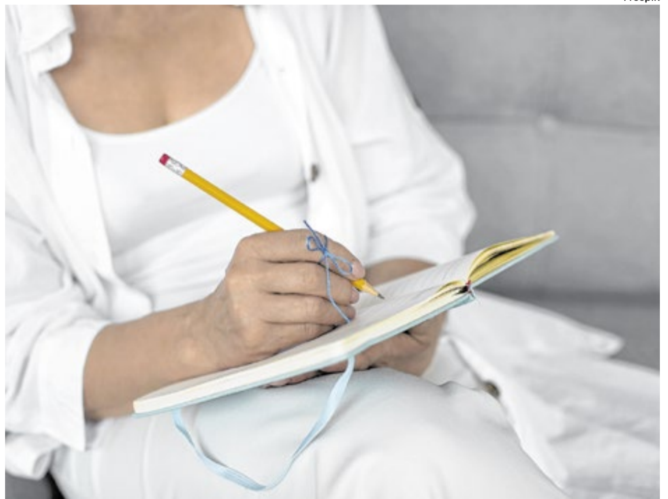
Para quem vive com transtornos mentais, o registro frequente pode ser uma ferramenta de cuidado, afirma o psiquiatra

A relação com a escrita começou cedo. Aos 14 anos, diante da dificuldade de expressar o que sentia, passou a