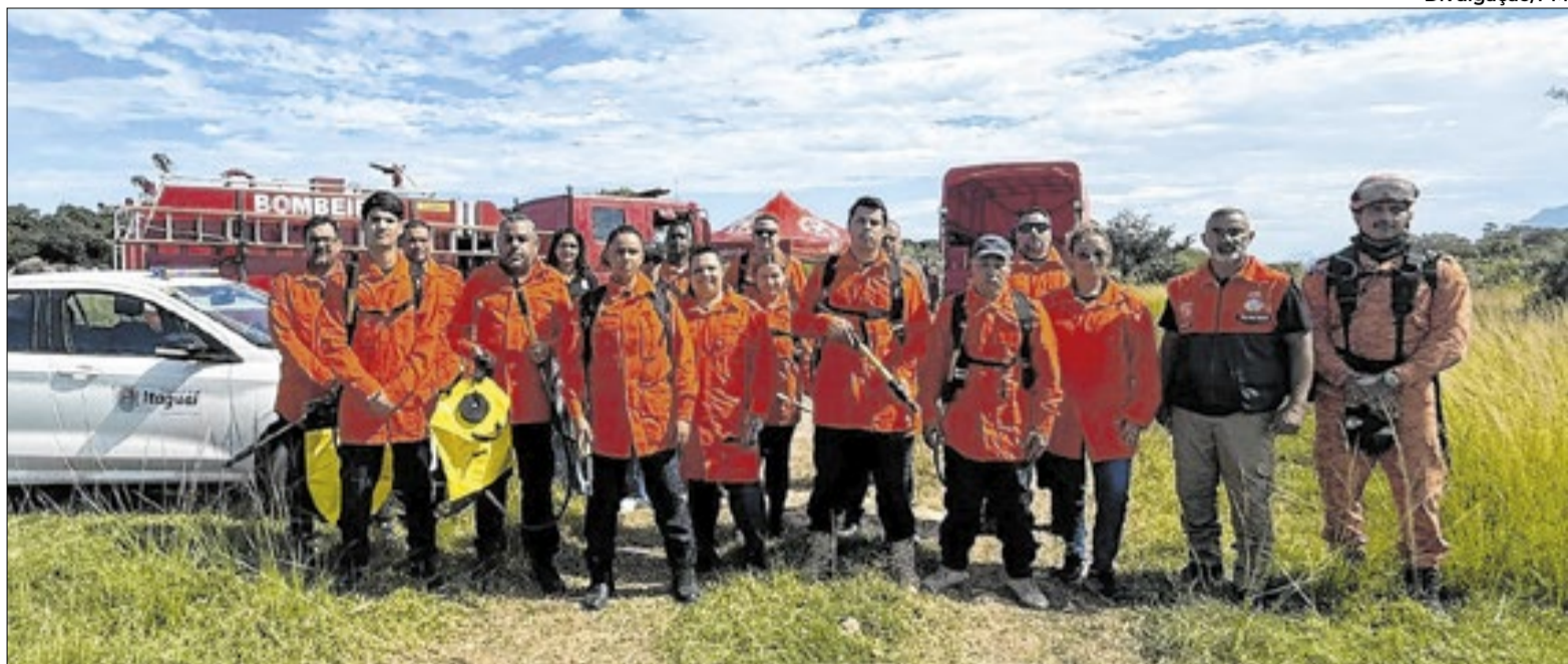
O objetivo da capacitação é saber como agir diante de fogo em vegetação

É por esta razão que a Defesa Civil de Itaguaí investe na qualificação dos seus agentes e