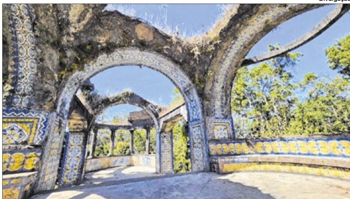
Não há risco de desabamento, mas é necessário trabalho de restauração