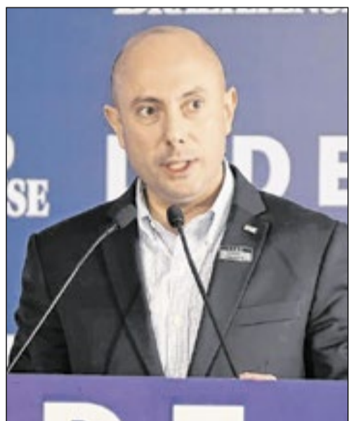
Samuel Kinoshita, secretário de Estado da Fazenda e Planejamento de São Paulo