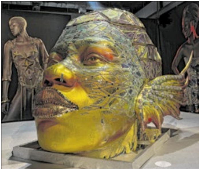
Peça de Carnaval exposta no Rio Fashion Week