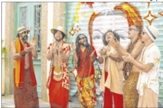
Atrações para todos os estilos musicais