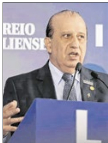
Augusto Nardes, ministro do Tribunal de Contas da União do Brasil