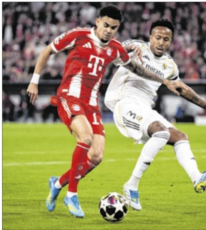
Em jogo de sete gols, Bayern virou sobre o Real e avançou na Champions League

gundo amarelo por retardar o início da partida após uma falta em seu campo de defesa.