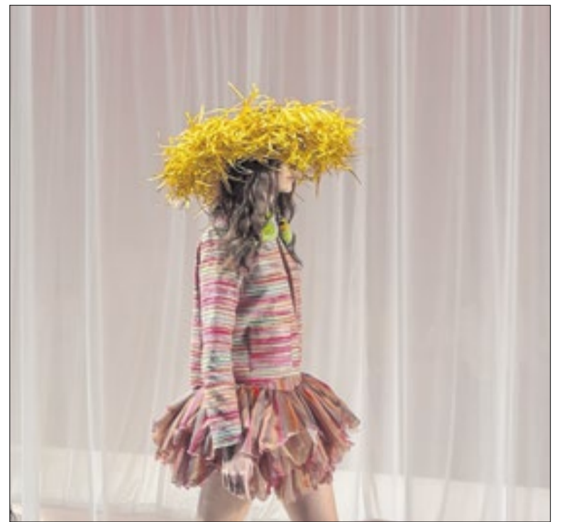
Desfile da Salinas para o Rio Fashion Week

A Igreja Matriz de São Jorge, em Quintino, Zona Norte, anunciou a programação da tradicional alvorada no dia do santo, em 23 de abril. Este ano, haverá um show de drones no local, a partir das 4h. A apresentação envolverá 300 drones e está prevista para a madrugada do dia 23, antes da tradicional Missa.