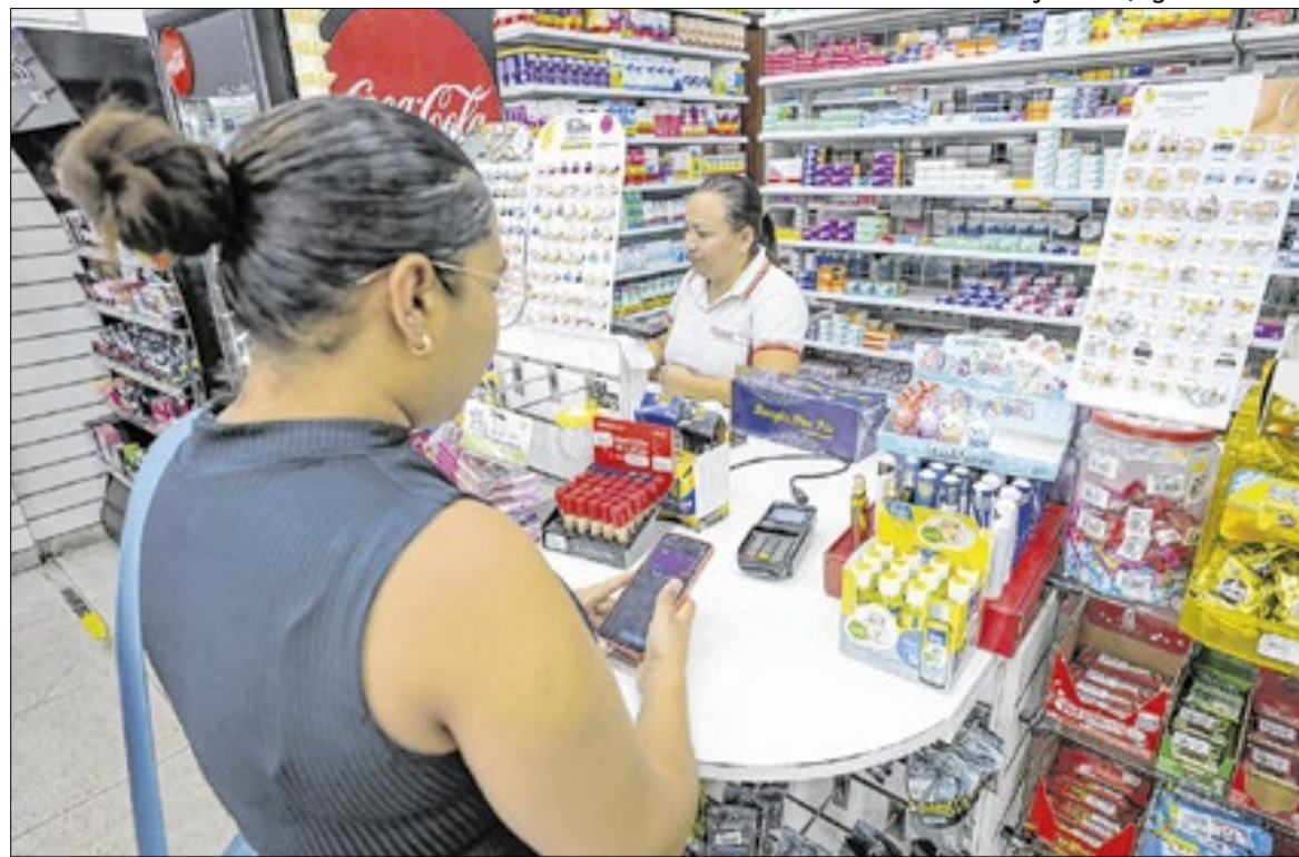
Artigos farmacêuticos lideraram em fevereiro no varejo ampliado, com alta de 2,1%

Por outro lado, quatro dos oito segmentos pesquisados fecharam fevereiro em queda. O recuo mais intenso ocorreu em equipamentos e material para