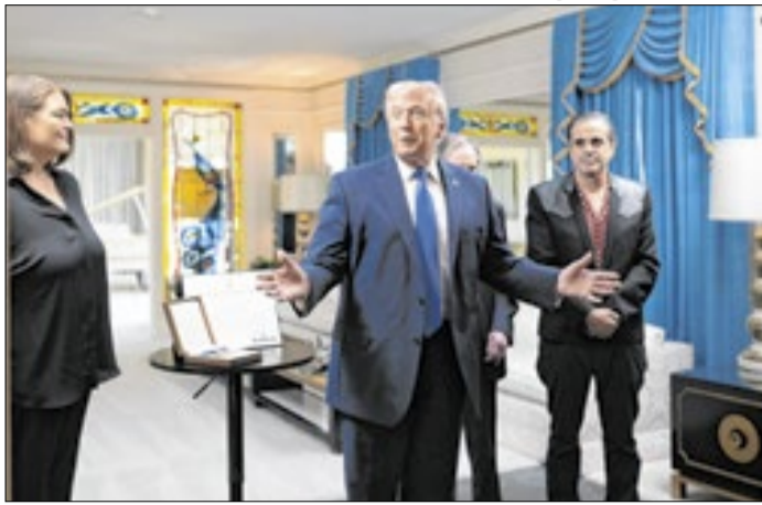
Trump aumenta pressão sobre Irã com prazo terminando