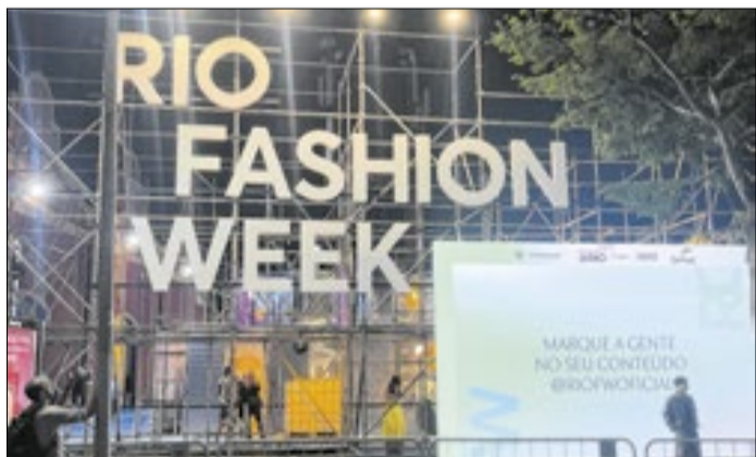
Rio de Janeiro volta a ser a capital da moda