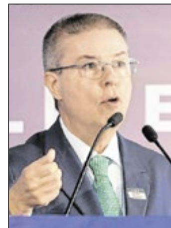
Antonio Anastasia, ministro do Tribunal de Contas da União

■ O ministro Saldanha, durante a sessão da 3ª seção do STJ desta quarta-feira, 8, recebeu homenagens dos colegas que exaltaram a sua atuação na área penal e sua postura equilibrada no colegiado ao longo de dez anos.