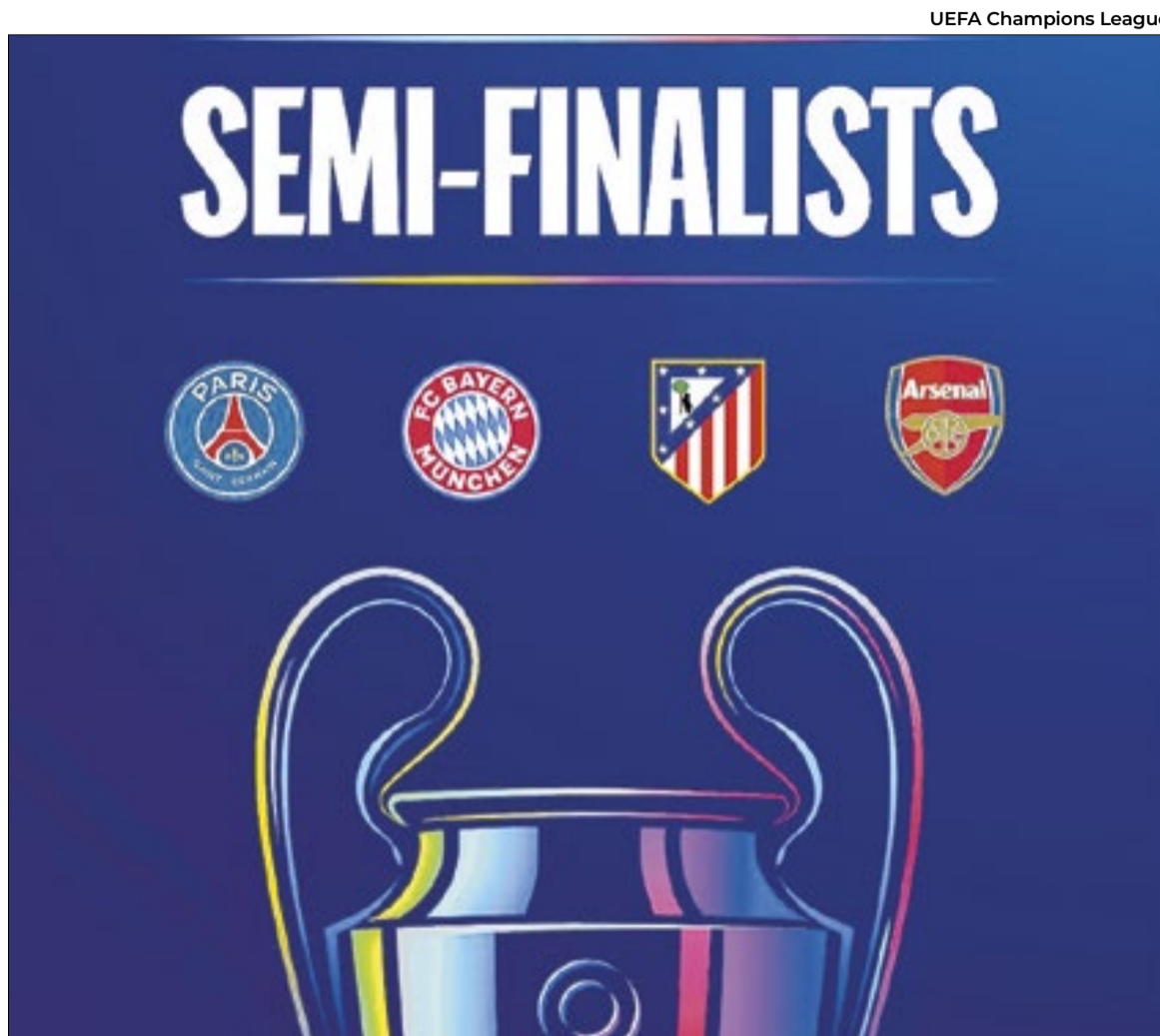
Final está marcada para o dia 30 de maio, no estádio Puskas, em Budapeste, Hungria

O time espanhol vencia por 3 a 2 em Munique, e ambas as equipes pareciam ter aceitado a disputa da prorrogação -a essa altura, o agregado apontava 4 a 4-, quando o francês Camavinga recebeu o se-