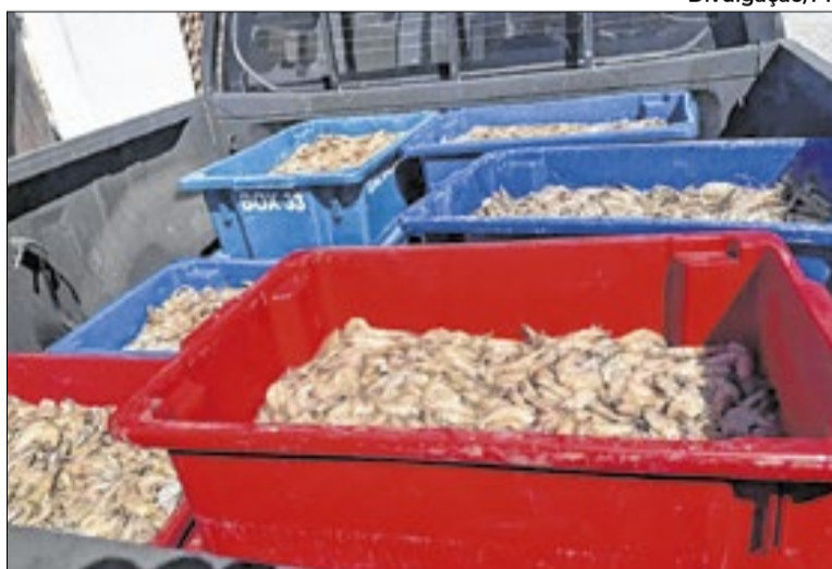
O camarão apreendido foi doado à Associação Pestalozzi

Com a interceptação das embarcações, foi possível liberar os camarões que ainda estavam vivos. A constatação das irregularidades permitiu a prisão em flagrante dos quatro pescadores, cada um deles responsável por uma embarcação.