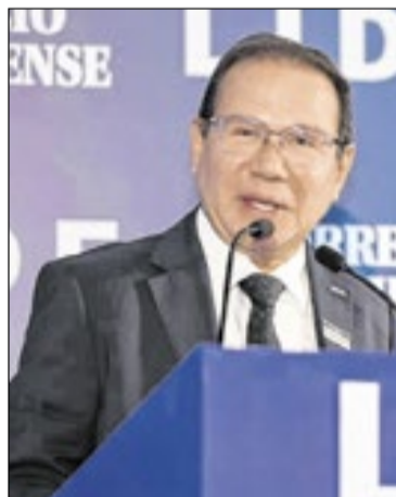
Nelson de Souza, presidente do BRB