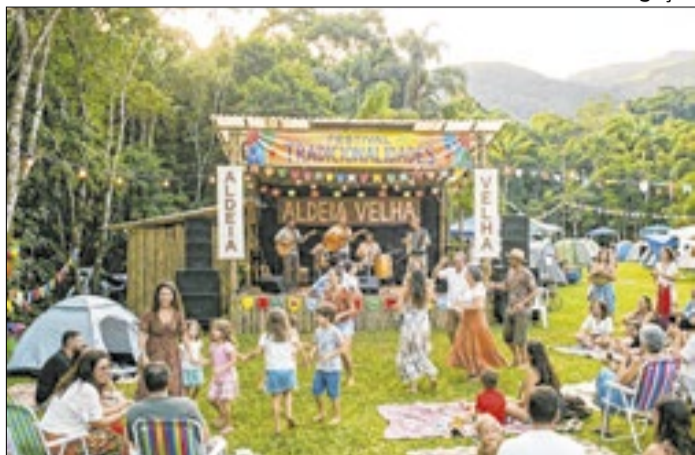
Evento no fim de semana para toda a família