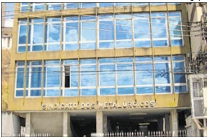
Diretor de Comunicação do Sindmetal é criticado por perfil