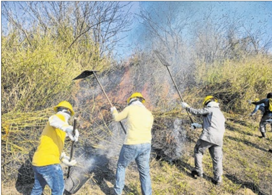
Com 80 vagas disponibilizadas, o curso é realizado pela Guarda Municipal Ambiental

A primeira turma será capacitada entre os dias 9 e 12 de junho. Já a segunda turma passará pelo