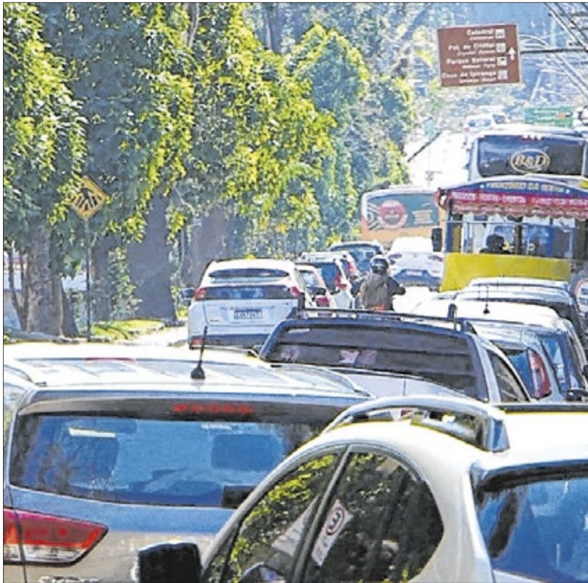
Com menos de 300 mil habitantes, Petrópolis já ultrapassa a marca de 200 mil veículos registrados

Planejada há quase 200 anos, Petrópolis não foi estruturada para o volume atual de veículos. Além disso, áreas tombadas e ruas estreitas dificultam intervenções mais amplas. “A cidade foi planejada em outro momento, com outra realidade de mobilidade, pessoas se locomoviam a pé ou de charretes. Não temos espaço para grandes obras como metrô ou novas vias expressas”, explicou Damaceno.