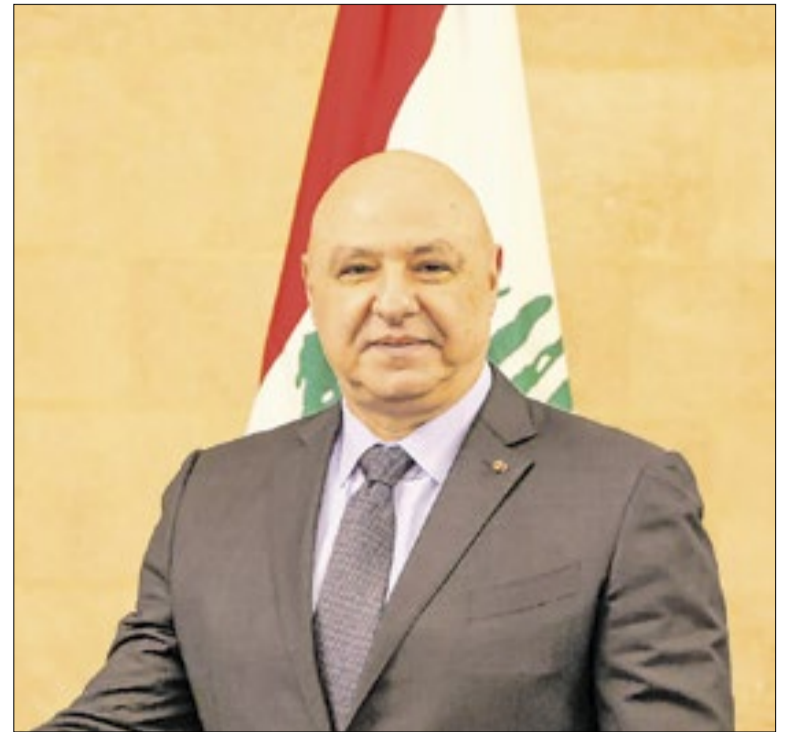
Joseph Aoun teve reunião proveitosa com Donald Trump