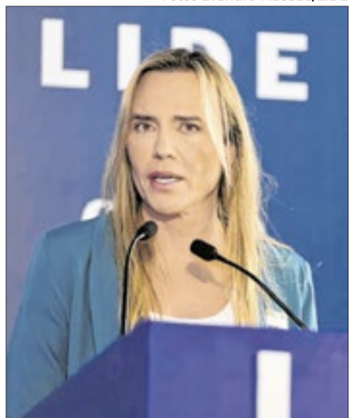
Celina Leão, governadora do Distrito Federal