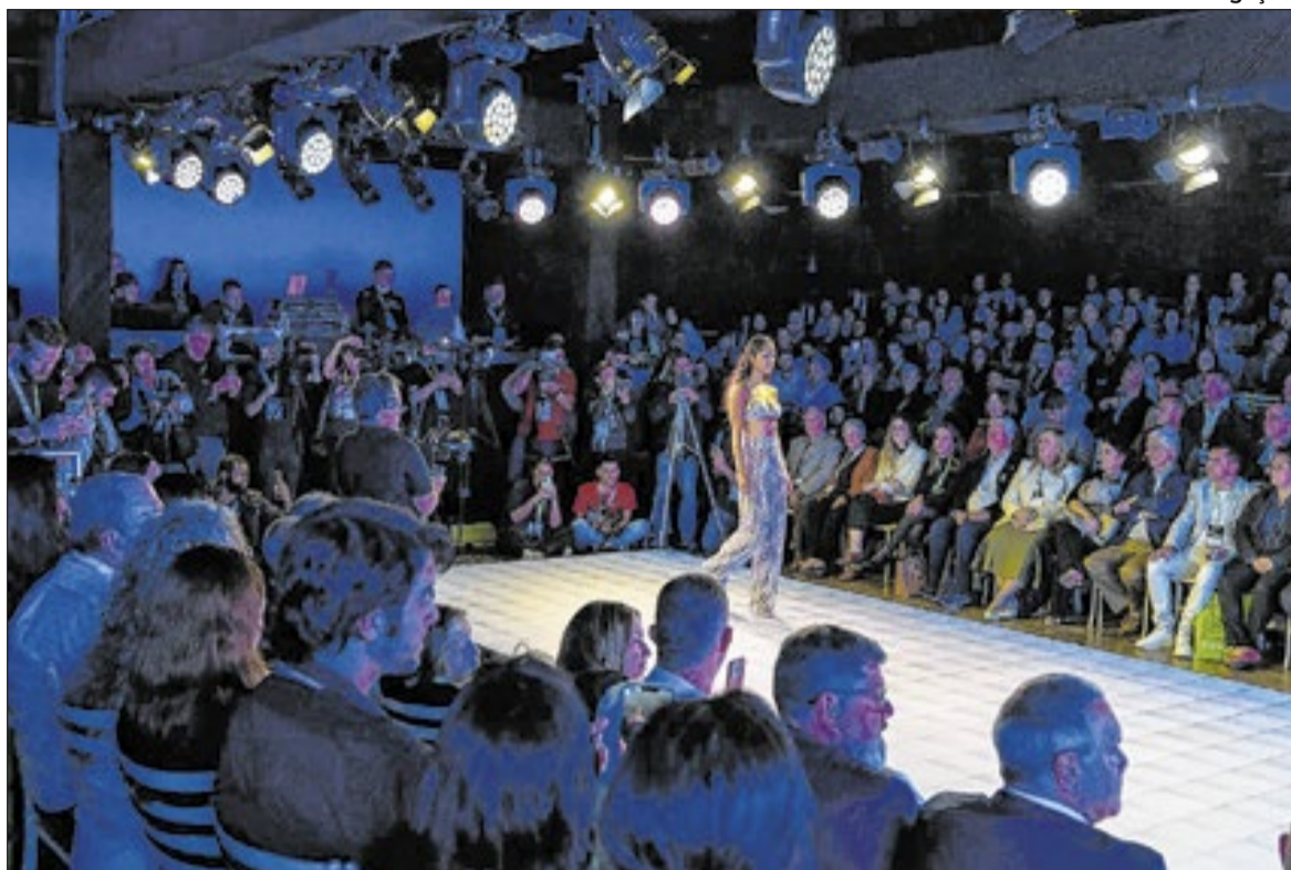
Selo concedido pelo INPI atesta qualidade de um produto ou serviço ligados ao local de produção

Nova Friburgo está a caminho de conquistar o selo de indicação geográfica (IG) como Capital da Lingerie. Este processo, fruto de uma parceria entre o Sebrae Rio,