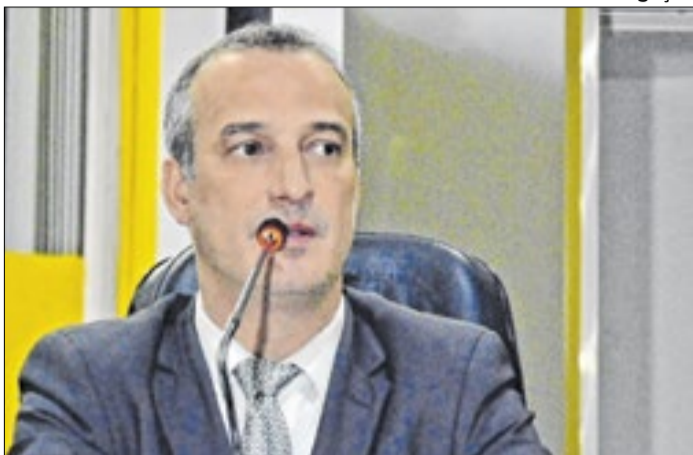
Vereador quer garantir que outro clube não seja fechado