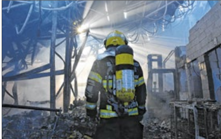
O índice de investigações em incêndios chegou a 90,46%

Por meio da Divisão de Investigação de Incêndio (DINVI), foram examinados 2.145 regis-