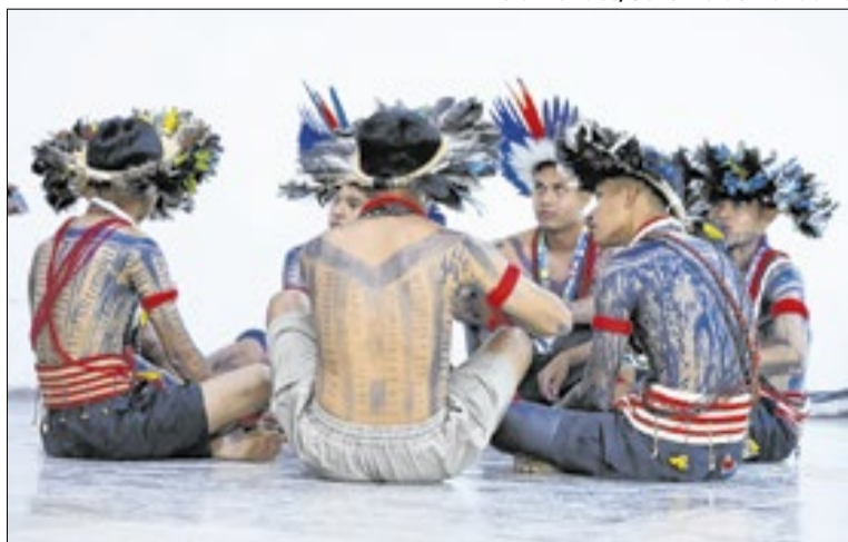
240 alunos e professores indígenas participam

A programação incluiu exposição de trabalhos dos estudantes, apresentações artísticas no período da manhã, performance interativa com o artista Bira Lou-