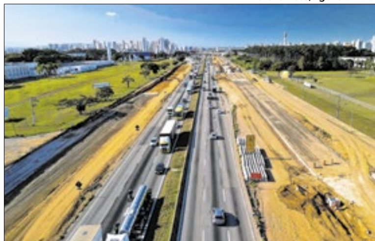
Pedido se refere a trecho que corta o município de Nova Iguaçu

Na solicitação enviada na segunda-feira (13), a promotoria defende a suspensão das intervenções no bairro da Posse e em áreas vizinhas, como o Canal Vígário Maranhão, em Comendador Soares.