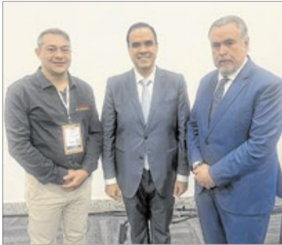
O ministro do Turismo, Gustavo Filiciano, ladeado pelo secretário de Turismo de Rio das Ostras (RJ), Pablo Kling (e); e pelo publisher do Correio da Manhã, Cláudio Magnavita

Após o encontro, autoridades e lideranças do trade turístico prestigiaram a World Travel Market Latin America (WTM). O estande do Rio, por sinal, o mais procurado de todo o pavilhão.