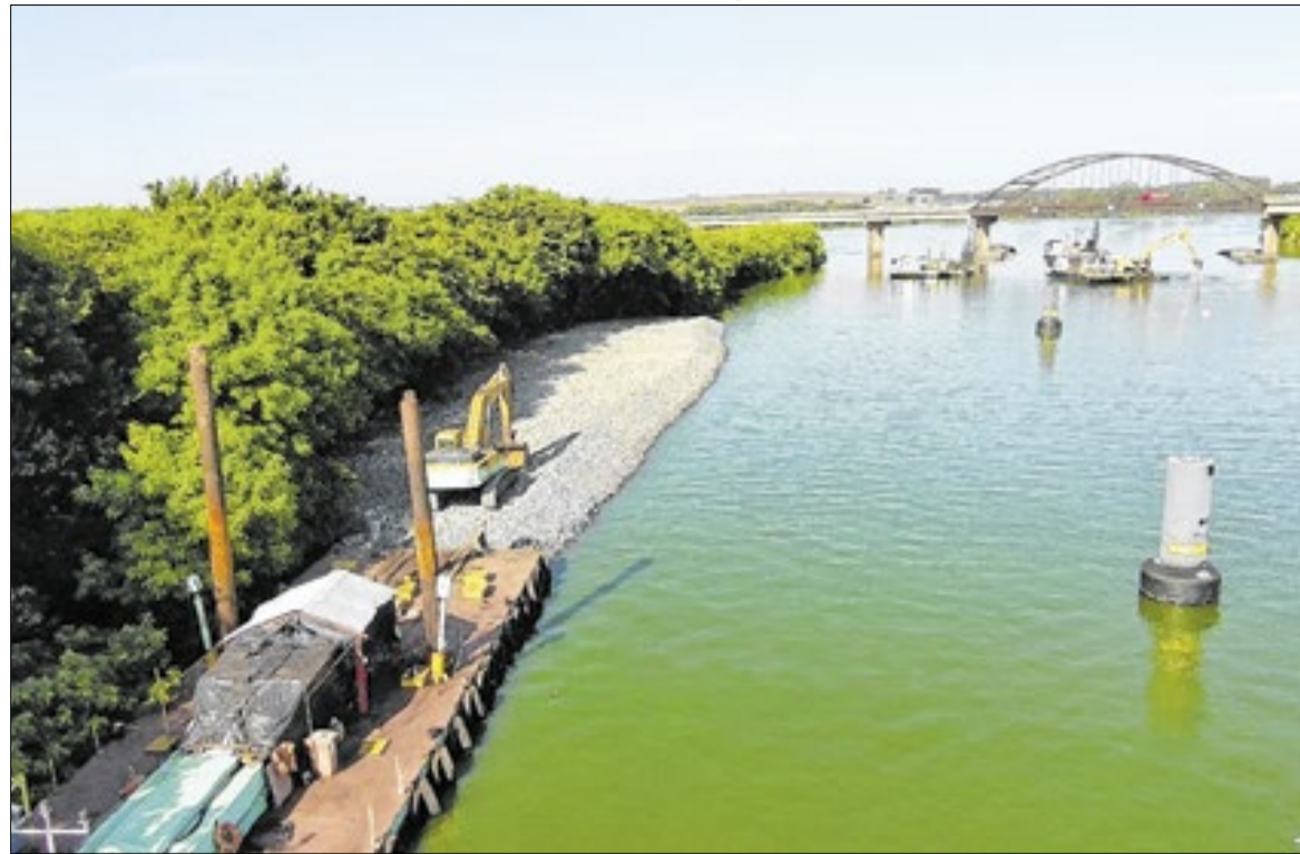
Localizada no Noroeste paulista, a hidrovia é um dos principais corredores logísticos do Brasil

A intervenção ocorre a jusante da eclusa de Nova Avanhandava, entre os municípios de Buritama e Brejo Alegre, e envolve o desmonte de rochas ao longo de cerca de 16 quilômetros de canal. Ao término das obras, aproximadamente 553 mil m 3 de rochas terão sido removidos — volume