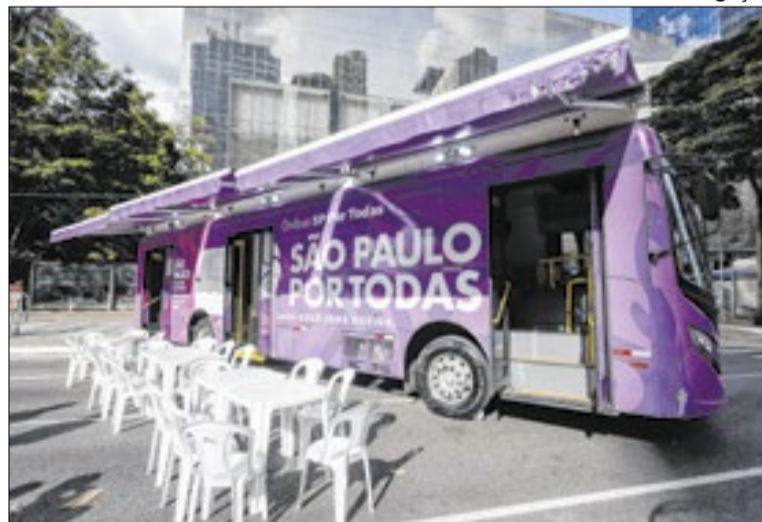
A ação reforça a estratégia de interiorizar políticas públicas;

No interior do equipamento, as mulheres têm à disposição uma equipe multidisciplinar especializada, composta por psicólogos e assistentes sociais. Os serviços integrados englobam as áreas psicossocial, jurídica e assistencial.