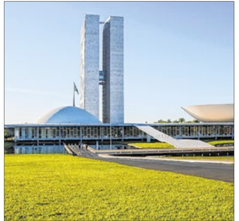
Senado tem 2.290 servidores efetivos, aprovados em concurso

O Ministério Público do ES conduz as apurações sobre as suspeitas envolvendo servidores da Secretaria de Saúde do Estado, que vão desde pedido de propina até vazamento de vídeos internos. O caso também conta com apoio da Polícia Civil. Mais de 100 processos já foram abortar em cinco anos para apurar irregularidades.