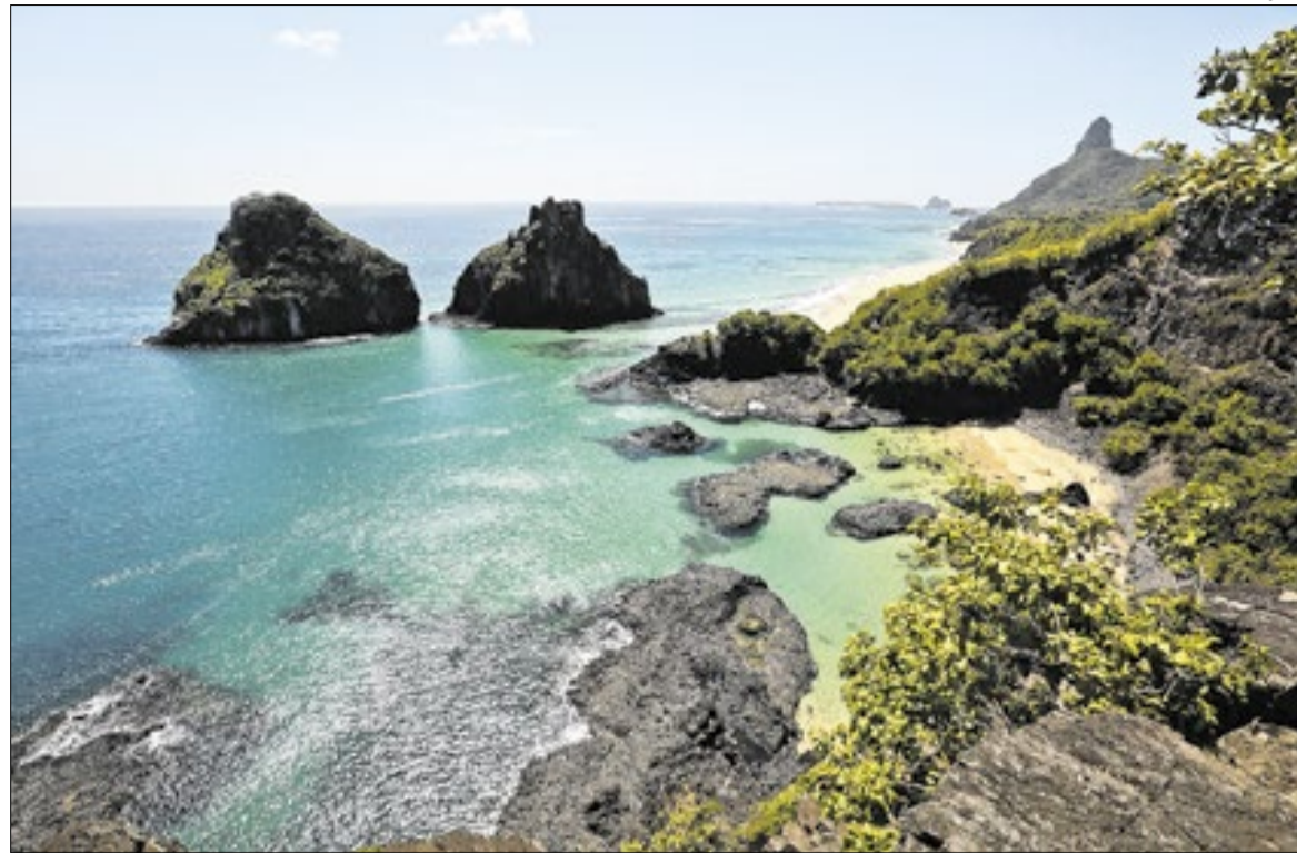
Minha Casa, Minha Vida chega de forma sustentável a Fernando de Noronha

Cada unidade habitacional terá área construída de 46,52 metros quadrados e será destinada a famílias com renda mensal de até R$ 2.850,00. As casas seguem o modelo Sub50 do Minha Casa, Minha Vida, modalidade volta-