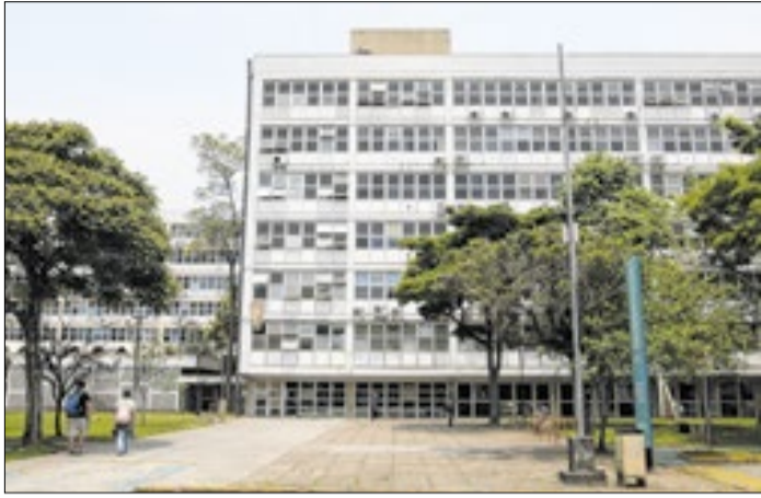
Servidores criticam gratificações exclusivas a docentes