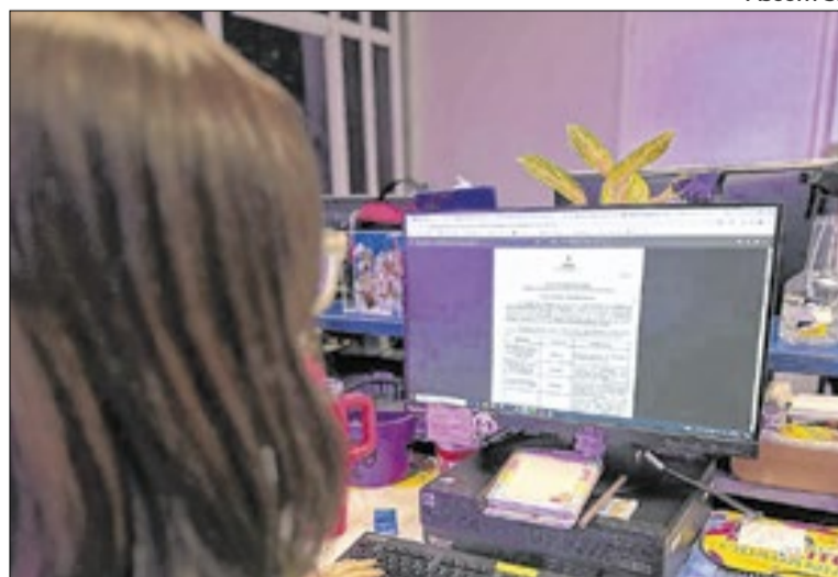
Os pedidos devem ser encaminhados para o e-mail

As entidades que desejarem contestar o resultado preliminar podem interpor recurso até esta quarta-feira, 16 de abril. Os pedidos devem ser encaminhados para o e-mail habitacao@seasic.