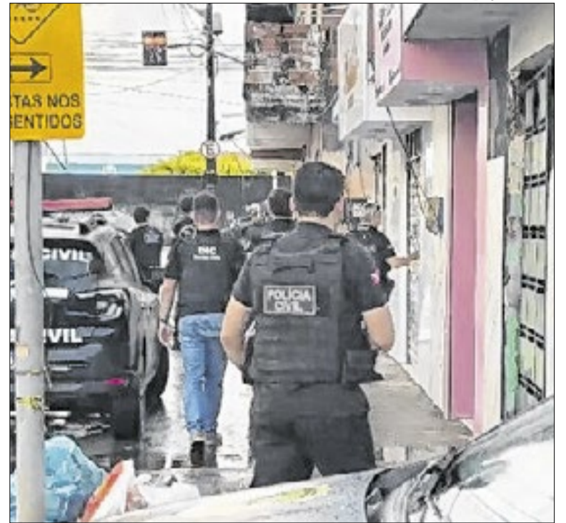
Os mandados foram cumpridos em sete cidades do país

A TV Paraná Turismo transmitirá no sábado (18), às 15h30, a partida entre os times Nacional e Batel, pela oitava rodada da Segunda Divisão do Campeonato Paranaense, em Campo Mourão (PR). A partida é decisiva para a classificação à próxima fase. O confronto ocorrerá no Estádio José Carlos Galbier.