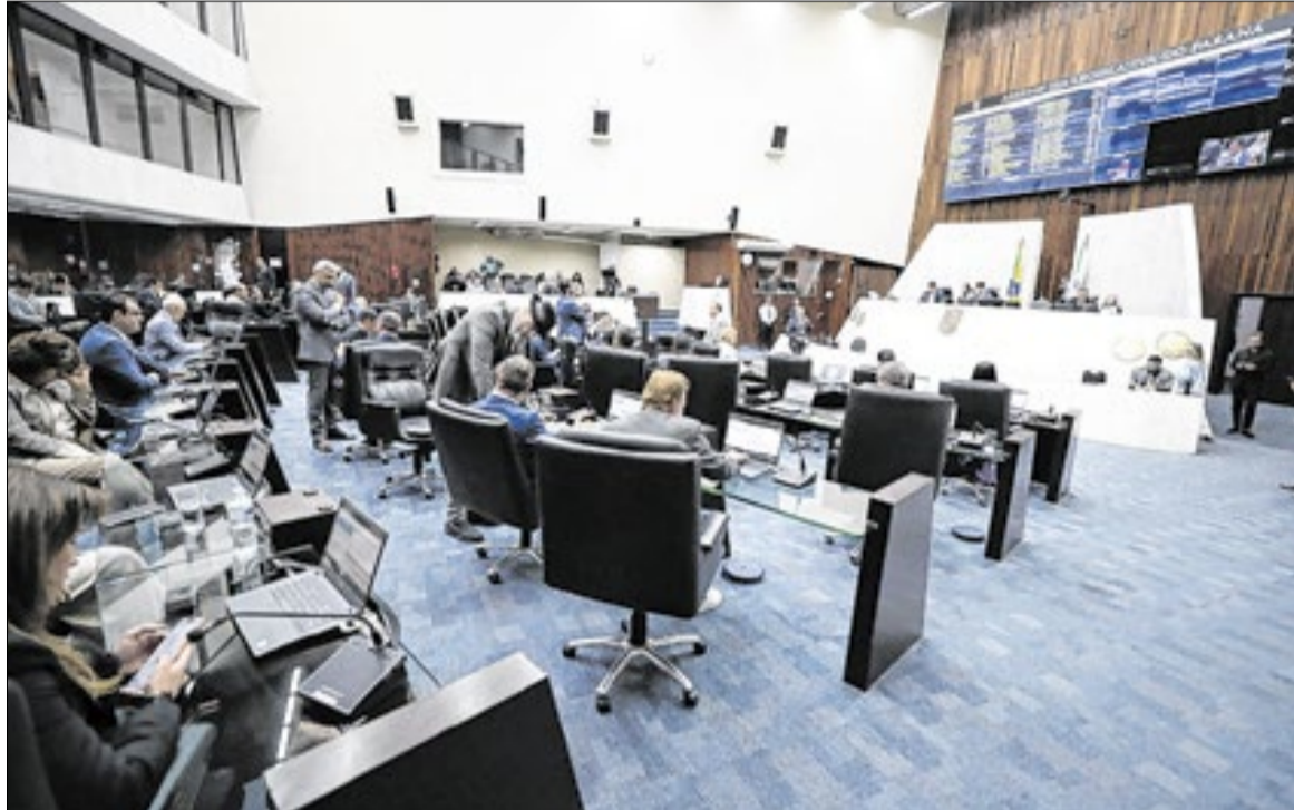
Critérios para destinação da verba incluem vistoria técnica e manutenção de vínculos formais

A concessão dos valores será baseada em critérios técnicos, incluindo o porte das empresas, vistorias presenciais e comprovação