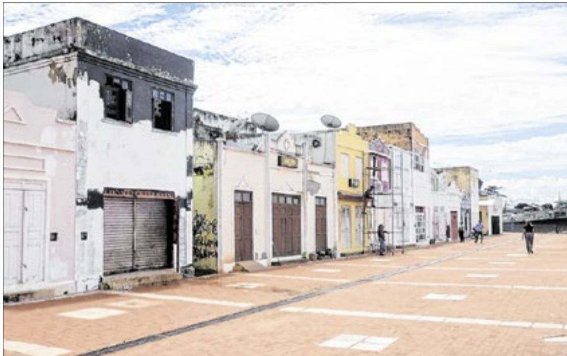
O Calçadão do Mercado é um dos principais pontos turísticos de Rio Branco

Durante o evento, a governadora destacou a importância da obra para a cidade e para a população. “Estamos dando um passo importante para revitalizar um dos espaços mais históricos de