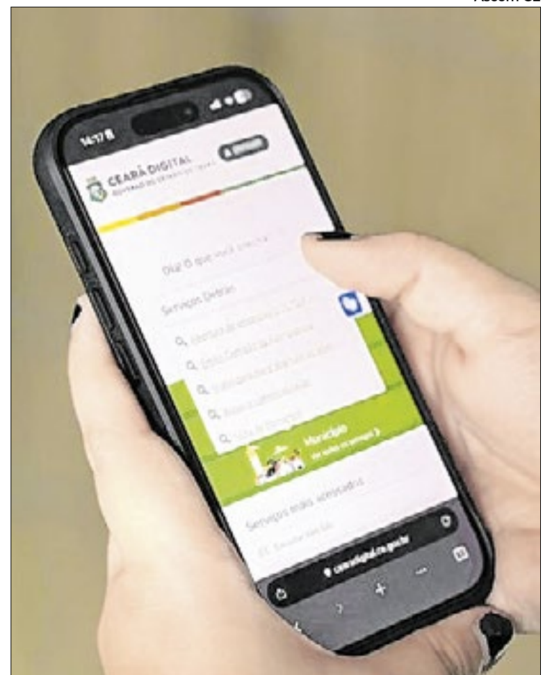
A iniciativa integra a plataforma Ceará Digital