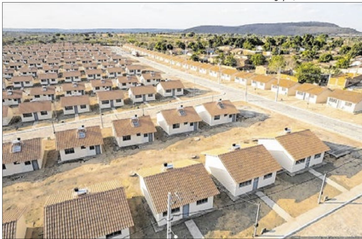
Programa Minha Casa Minha Vida deve totalizar 3 milhões de moradias em 2026

Além da renda, o teto do valor das unidades habitacionais também foi reajustado para acompanhar o mercado. O limite da Faixa 3 subiu para R$ 400 mil (+14%) e o da Classe Média saltou de R$ 500 mil para R$ 600 mil (+20%).