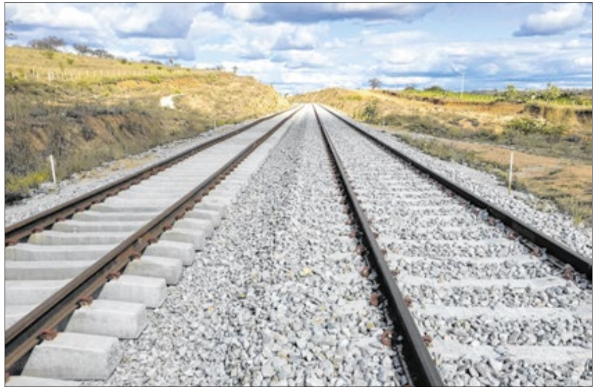
'Corredor Minas-Rio' conecta as cidades de Arcos, Lavras e Varginha até Barra Mansa e Angra

Como mostrou a Folha de S. Paulo, esse estudo preliminar, que será usado para embasar o planejamento logístico e definir prioridades de investimento, concluiu que há 7.412 quilômetros de trilhos em 37 trechos de ferrovias que teriam condições de