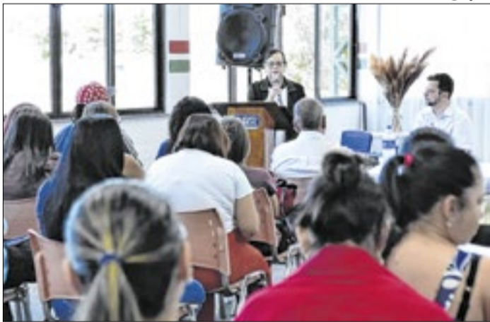
Encontro permitiu discutir políticas públicas educacionais