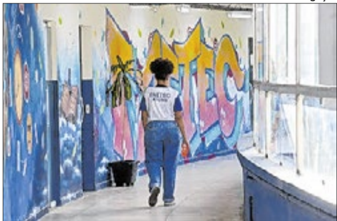
Pavão-Pavãozinho e Cantagalo na rota do turismo do Rio