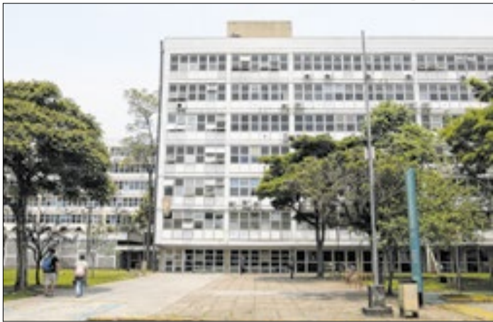
Servidores criticam gratificações exclusivas a docentes