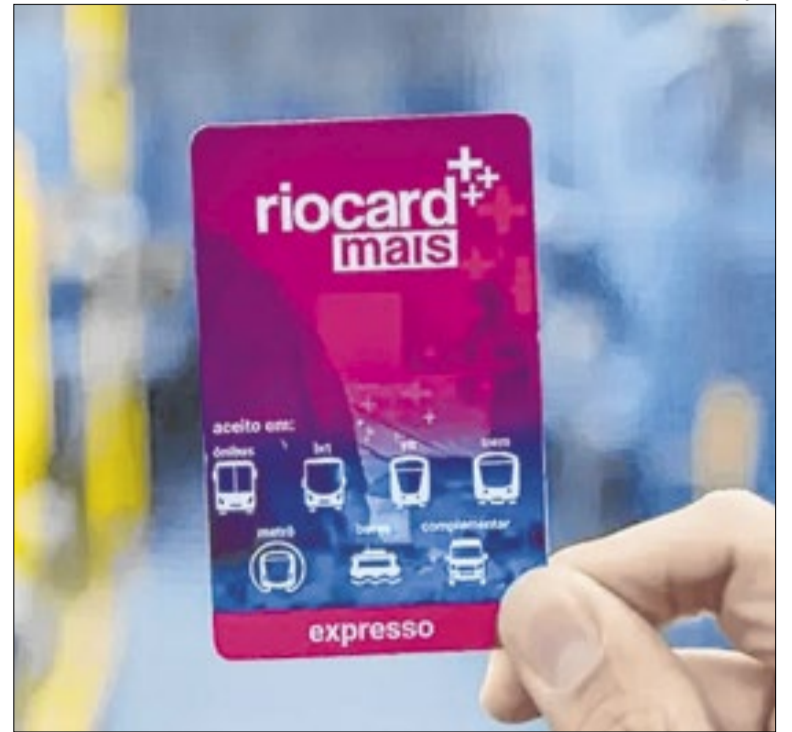
Projeto de expansão do Bilhete Único segue para sanção

Em reunião realizada nesta quarta (15), com a participação de todas as representações partidárias, o Colégio de Líderes da Alerj decidiu, por maioria, que a Casa reúne as condições necessárias para realizar a eleição para presidente do Parlamento. Em reunião da Mesa Diretora, a votação foi marcada para a próxima sexta (17), às 11h.