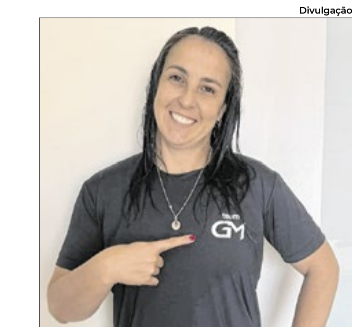
Bicampeã da Superliga leva experiência e conhecimento em busca de oportunidades para as novas gerações

“Estou muito feliz com essa nova fase da minha vida. Foram 30 anos dentro de quadra e agora sigo fora das linhas, atenta a essa nova geração de muita qualidade que está surgindo. Estar ao lado de profissionais tão qualificados, em uma empresa sólida, facilita muito