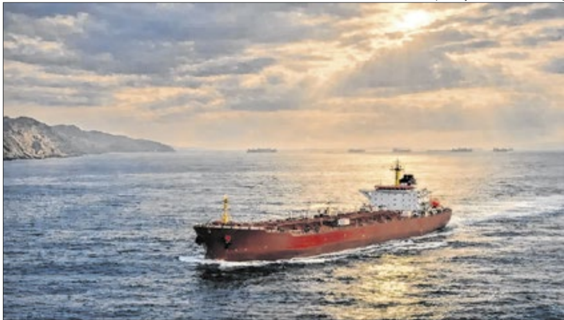
Sob sanções americanas, o navio chinês Rich Starry deu meia volta e se ancorou próximo ao Irã

O comando militar do Irã ameaçou nesta quarta-feira (15) agir para conter o comércio pelo mar Vermelho caso o bloqueio naval imposto pelos Estados Unidos aos portos do país não seja levantado.