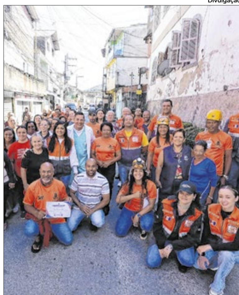
Atividades de resgate e evacuação foram realizadas no bairro Beira Linha

A recomendação é que a população fique sempre atenta aos alertas oficiais e participe das ações educativas promovidas pelos órgãos competentes. Em caso de necessidade, o órgão pode ser acionado pelo telefone 08002021066