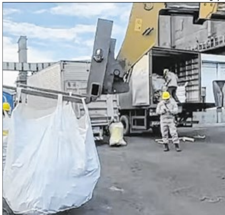
Polícia inicia incineração do carregamento de drogas

O Centro Carioca do Olho recebeu habilitação para realizar o transplante de córnea. Trata-se da primeira unidade a ofertar o procedimento na rede municipal de saúde. A novidade representa um avanço para o Rio, ampliando a quantidade de vagas disponíveis para o procedimento aos casos indicados