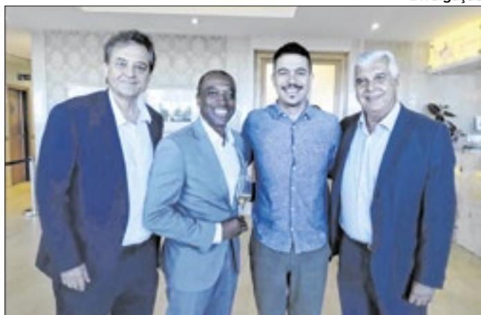
HotéisRio reúne gerentes gerais dos cinco estrelas