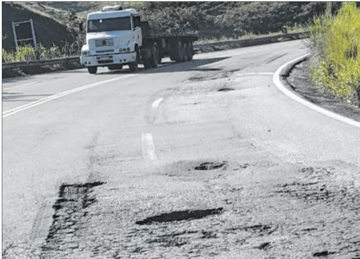
Há cerca de 10 meses, a BR-393, entre Sapucaia e Volta Redonda, está sob gestão do Dnit

Há cerca de 10 meses, a BR-393, entre Sapucaia e Volta Redonda, está sob gestão do Departamento Nacional de Infraestrutura de Transportes (DNIT) por conta da descontinuidade da concessão anterior. Desde então, a rodovia está em processo de deterioração e tornou-se perigosa, apresentando hoje o pior nível de qualidade entre as rodovias administradas pelo DNIT, em especial, no trecho entre Barra do Pirai e Vassouras. As reclamações vão desde a péssima qualidade do asfalto, que representa riscos de acidentes fatais, até a ausência de radares de fiscalização de velocidade, guinchos e ambulâncias.