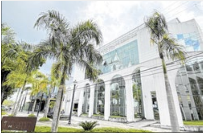
Ação prevê formação e incentivo a práticas sustentáveis