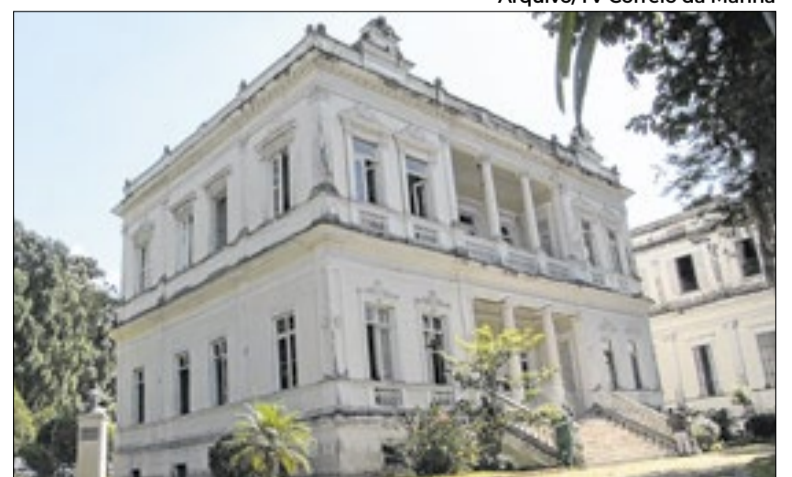
Pagamento pode ser feito em até 24 vezes no cartão

Para realizar o pagamento via cartão, o interessado deve comparecer à sede da Secretaria de Fazenda, localizada na Avenida Koeler, 260, no Centro. O atendimento ocorre de segunda a sexta-feira, das 9h às 17h. Após a confirmação da operação financeira, a certidão de quitação do ITBI é liberada em um prazo de até cinco dias úteis.