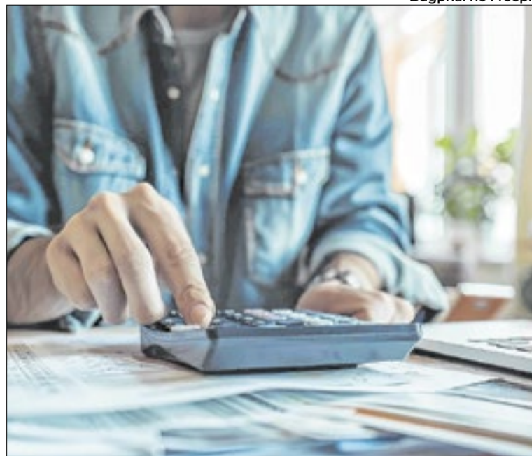
Ação gratuita acontece na Estácio Volta Redonda

Ainda segundo ele, a ação tem caráter educativo e busca orientar os contribuintes para que realizem sua declaração com mais segurança, evitando erros comuns como omissão de rendimentos,