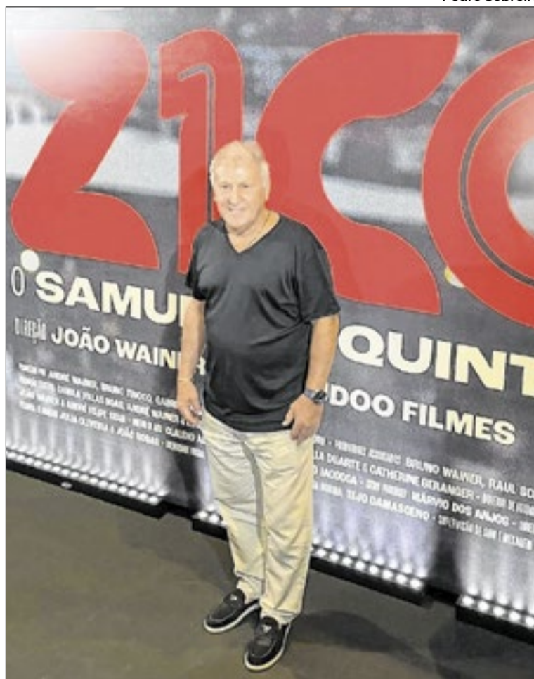
Zico fez questão de passar em cada uma das salas, todas lotadas, para agradecer a presença dos amigos e fãs na pré-estreia de sua cinebiografia