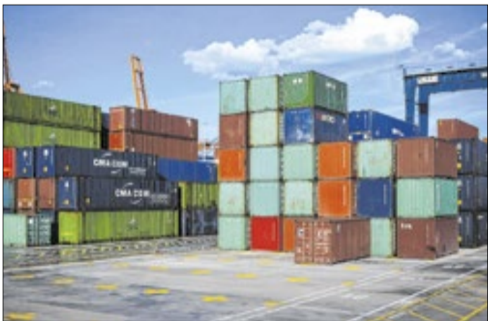
Medida é essencial para desempenho da indústria naval