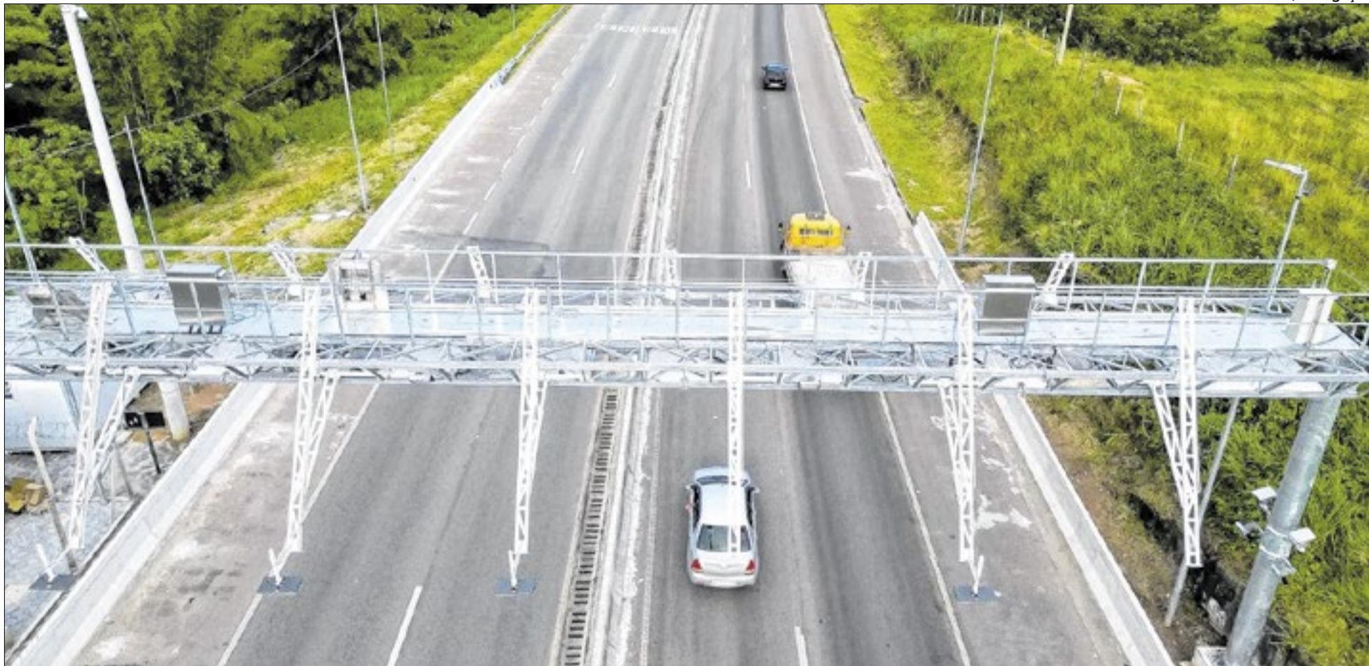
CCR Rio SP prevê aumento significativo no fluxo da Dutra e da Rio-Santos ao longo dos feriados de São Jorge e Tiradentes