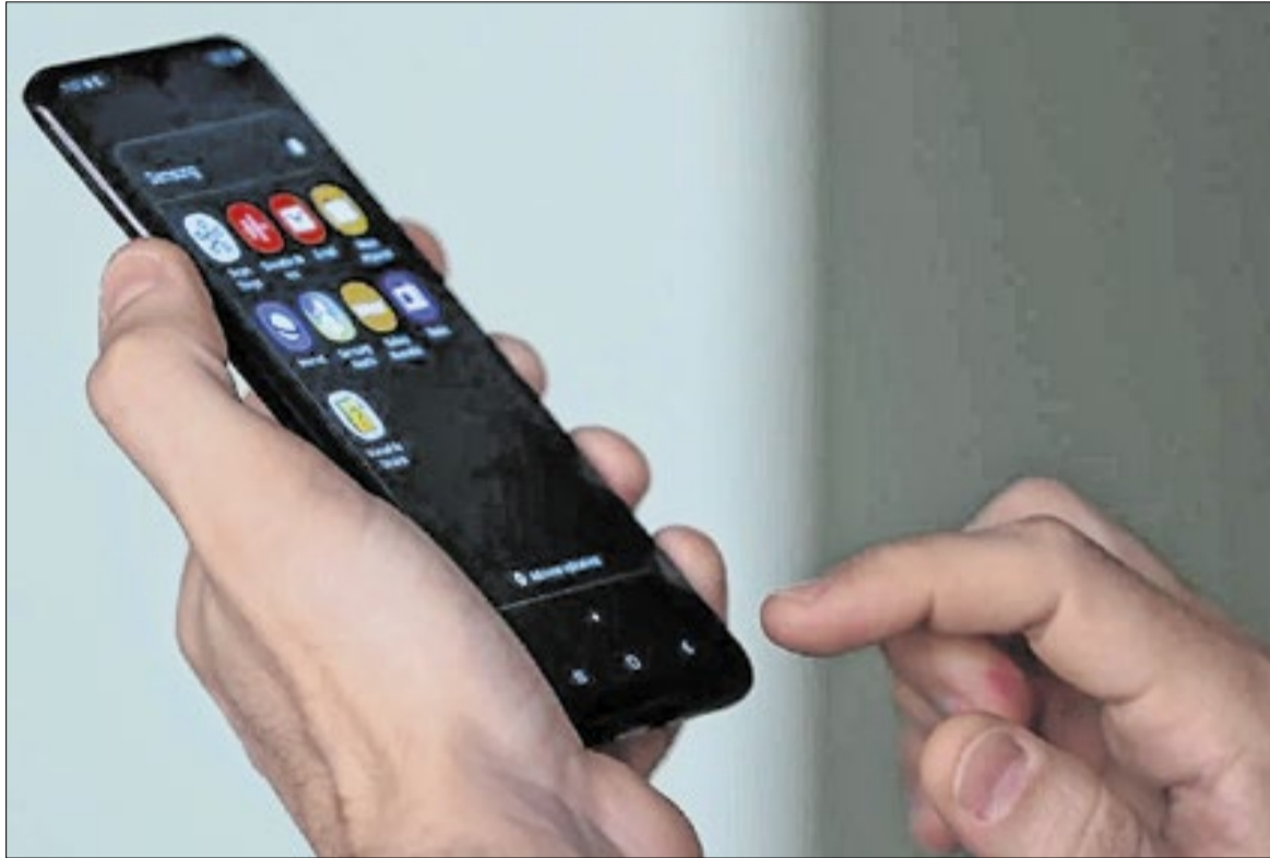
Em Teresópolis, os casos aumentaram em 29,7% no período analisado