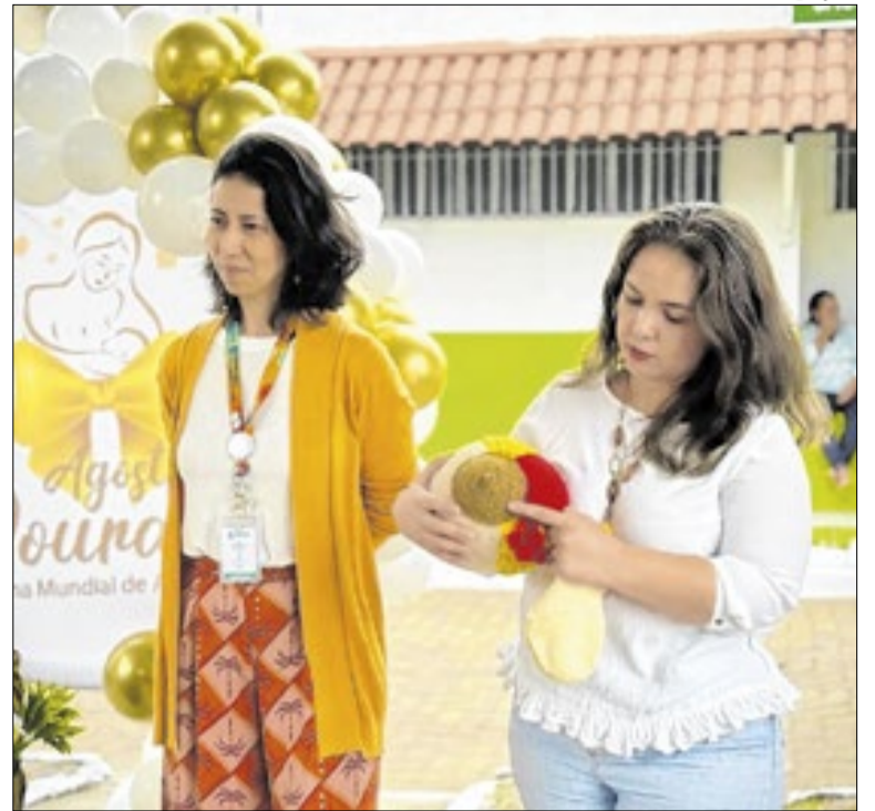
Projeto estrutura fluxo desde o pré-natal ao pós-parto