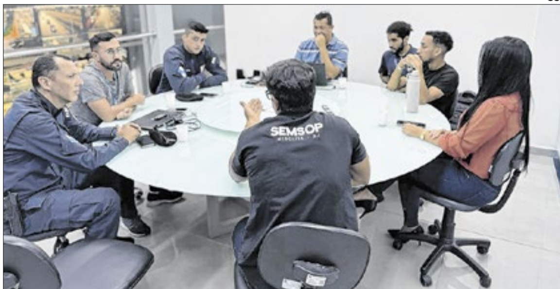
Seguranças unem forças para expandir alcance em Mesquita

Além do compartilhamento de imagens e alertas, também será