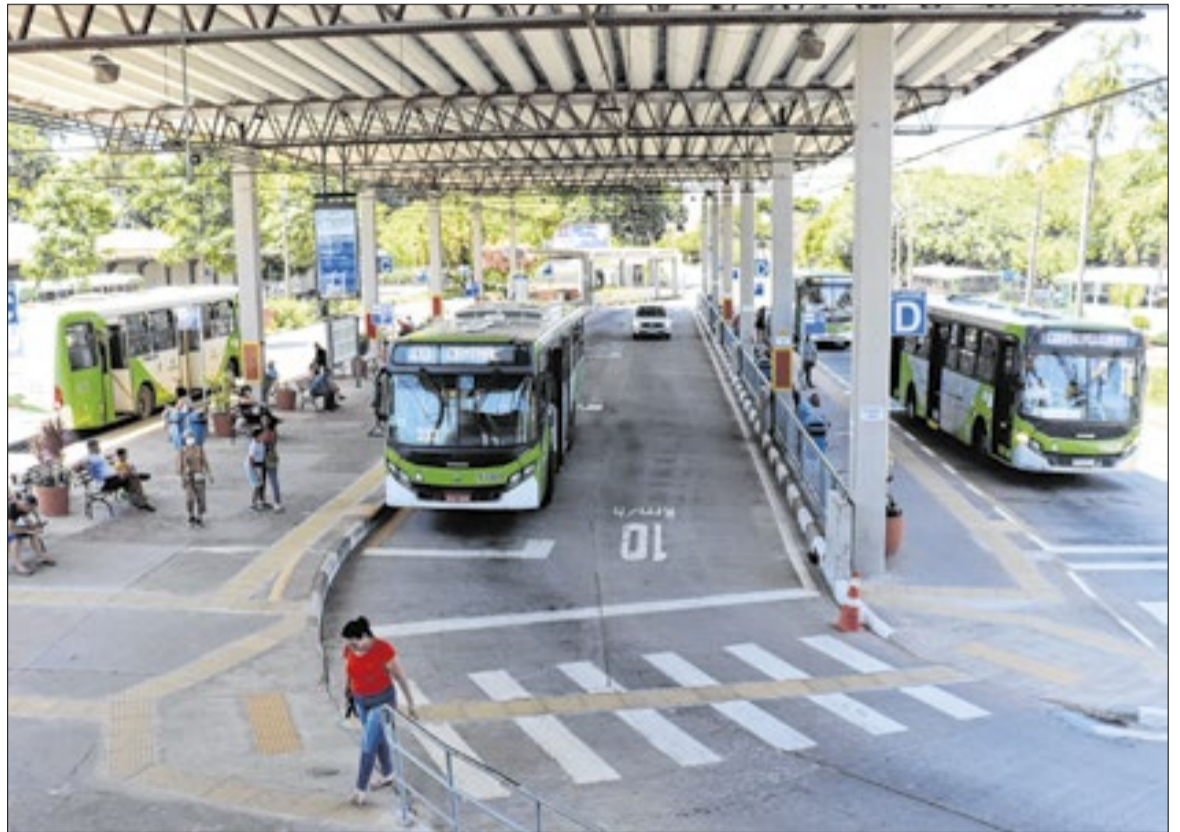
Projeto estende os contratos atuais sem modificar o padrão da frota ou o formato da operação

O leilão da nova concessão foi concluído em 5 de março, definindo os responsáveis pelos ser-