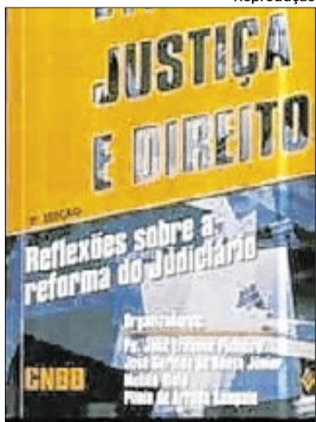
Livro de 1996 já discutia reforma do Judiciário

O atual momento isola Cármen Lúcia e o presidente do STF, Edson Fachin, a partir de sua ideia de criação de um código de ética para os magistrados. Em outros tempos, muito provavelmente o relatório apresentado pelo senador Alessandro Vieira (MDB-SE) pedindo o indiciamento de três ministros do STF – Alexandre de Moraes, Dias Toffoli e Gimar Mendes – uniria imediatamente os demais numa resposta corporativa da Corte. A nota de repúdio do presidente do STF, Edson Fachin, só foi divulgada já na noite de terça.