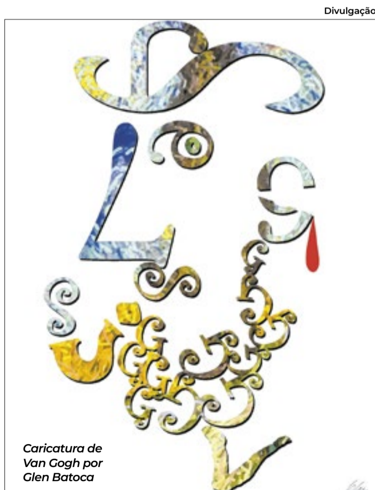
Caricatura de Van Gogh por Glen Batoca

No centro da mostra estão retratos caricaturais profundamente autorais, que extrapolam os limites da caricatura tradicional. Intensas e diretas, as obras revelam forte carga emocional e buscam expor, com crueza e