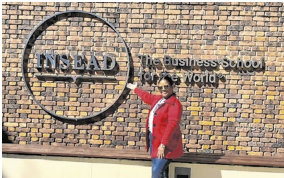
Reunião teve imersão presencial em uma das principais escolas de negócios do mundo

“O conhecimento adquirido nessa formação retorna para a cidade em forma de aprimoramento