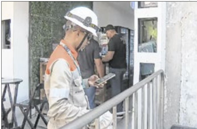
Light e Iguá fazem operação contra irregularidades