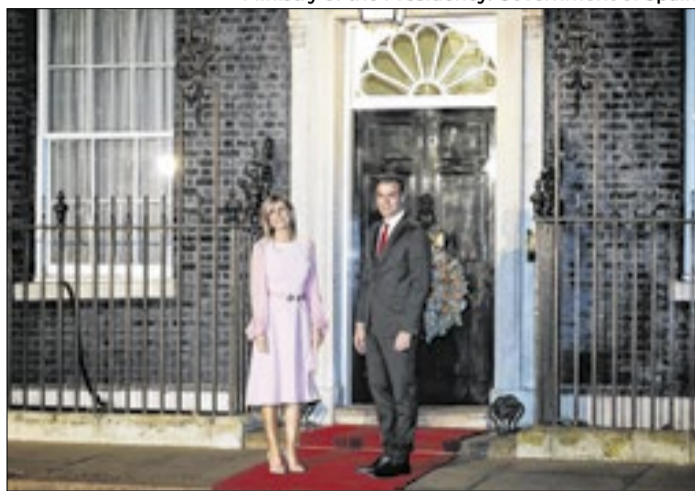
Begoña é acusada de de peculato e tráfico de influência