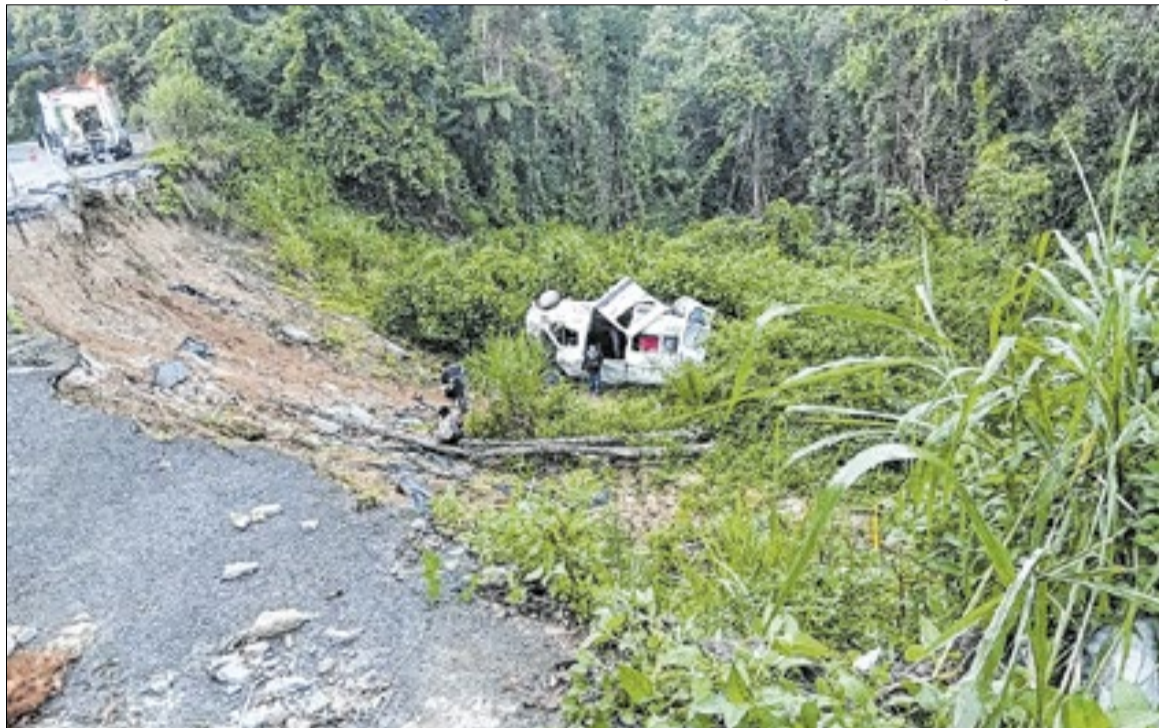
Rodovia é alvo de críticas por buracos e falhas na sinalização em diversos trechos

O caso ocorre em meio a críticas recorrentes sobre as condições das rodovias que cortam o Sul Flu-