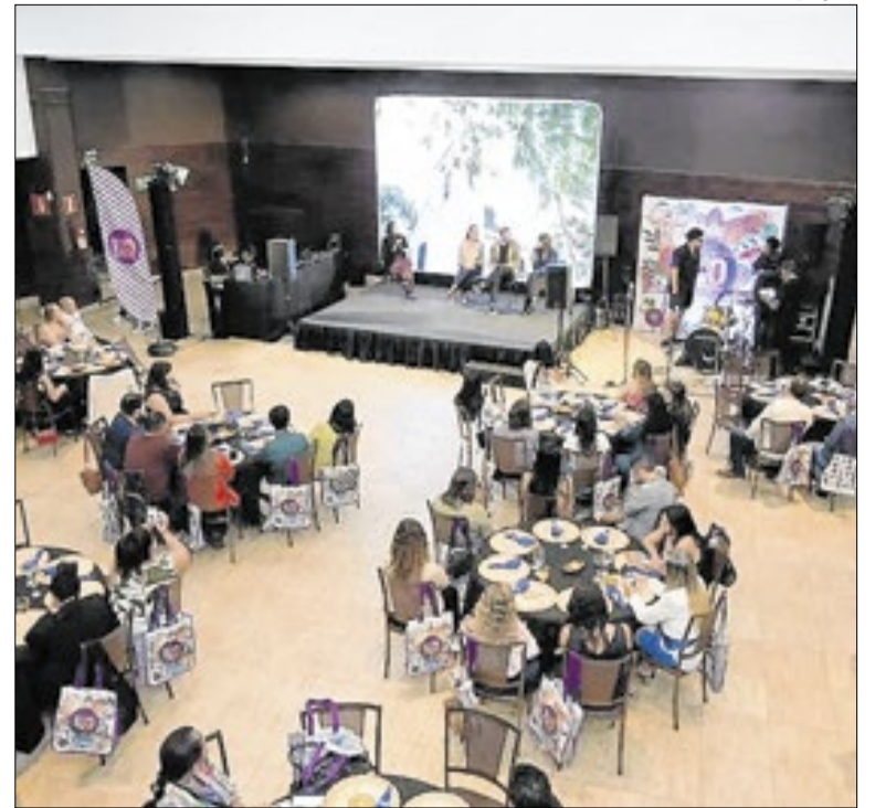
Evento reúne profissionais e empresas do setor turístico

A Prefeitura de Resende iniciou a revitalização da praça do bairro Barbosa Lima. As equipes já atuam na concretagem da academia da terceira idade e em trechos do meio-fio, com etapa seguinte de execução das calçadas. O projeto prevê nova iluminação, acessibilidade, parquinho e espaço de lazer para moradores da região.