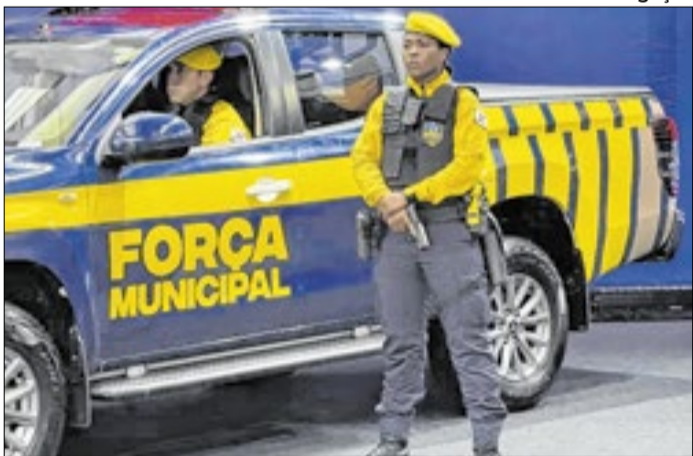
Força Municipal inicia patrulhamento na Tijuca