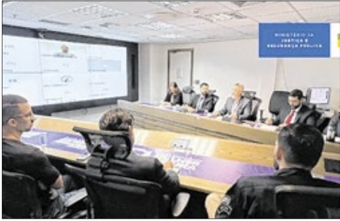
Encontro reuniu MJSP, PF, PRF, Defesa, TSE e Abin