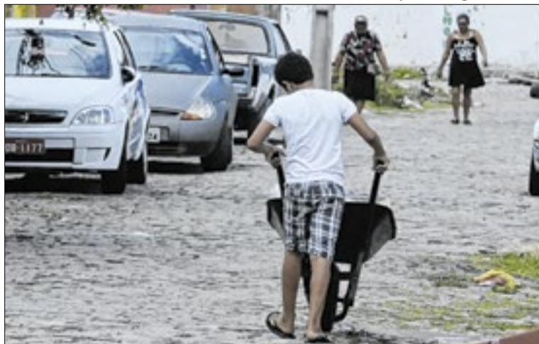
A decisão partiu da análise de uma ação civil do MPRJ

destacou que, apesar de recomendações e tentativas de diálogo com o Executivo municipal e