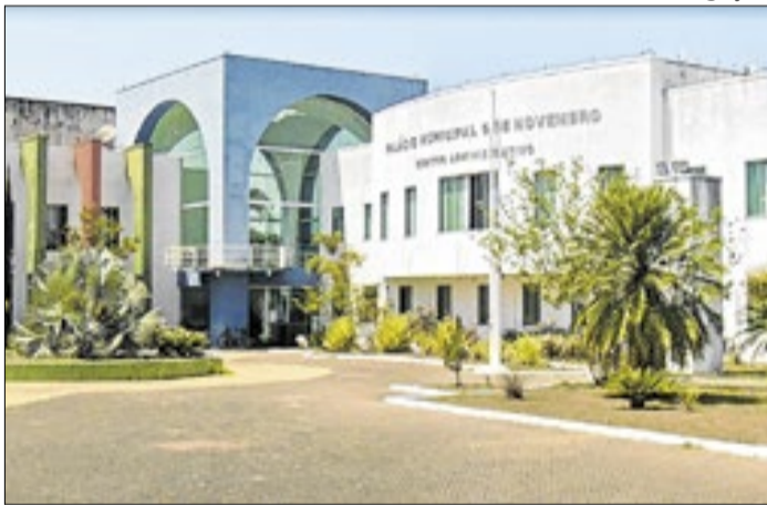
Secretaria orienta população sobre abordagens