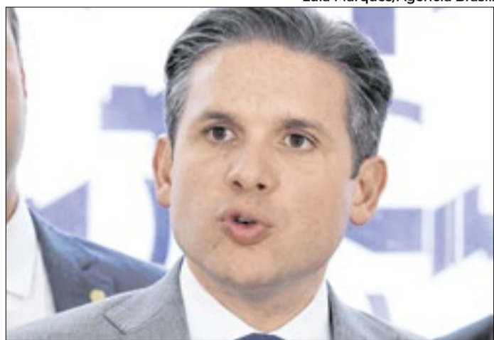
Motta destaca papel da Câmara na formulação