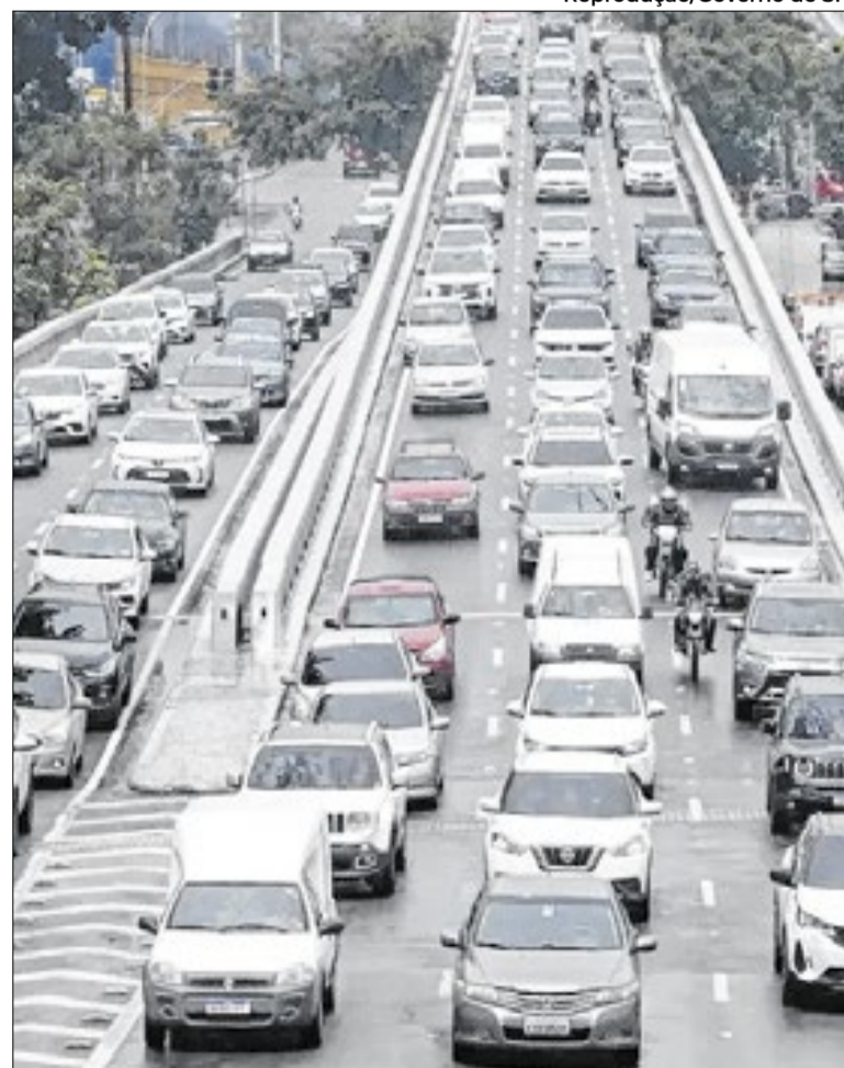
Contribuintes ainda podem quitar débitos com opções online

O atraso no pagamento do imposto gera multa diária de 0,33%, limitada a 20% do valor devido, além da incidência de juros com base na taxa Selic.