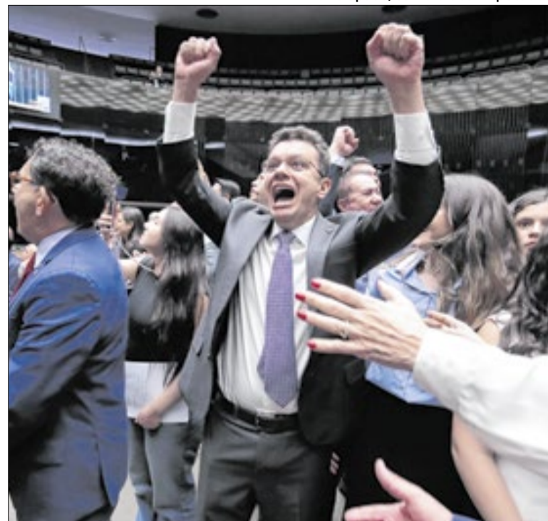
Odair Cunha comemorou sua vitória para vaga no TCU

Os ministros do STJ já receberam o relatório da sindicância interna da Corte sobre Buzzi e devem confirmar a instauração de um procedimento. A tendência é de que o caso possa vir a ter uma punição administrativa e, numa punição mais severa, a aposentadoria compulsória do ministro.