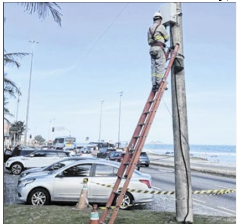
83 câmeras de vigilância chegam à Barra da Tijuca

O transplante de córnea agora também pode ser feito na rede municipal do Rio. A fila de espera no estado tem mais de 5,5 mil pessoas. O desafio é aumentar o número de doadores. Hoje, a fila, que é regulada pelo Programa Estadual de Transplantes, reúne 5.559 pessoas à espera de uma chance de voltar a enxergar.