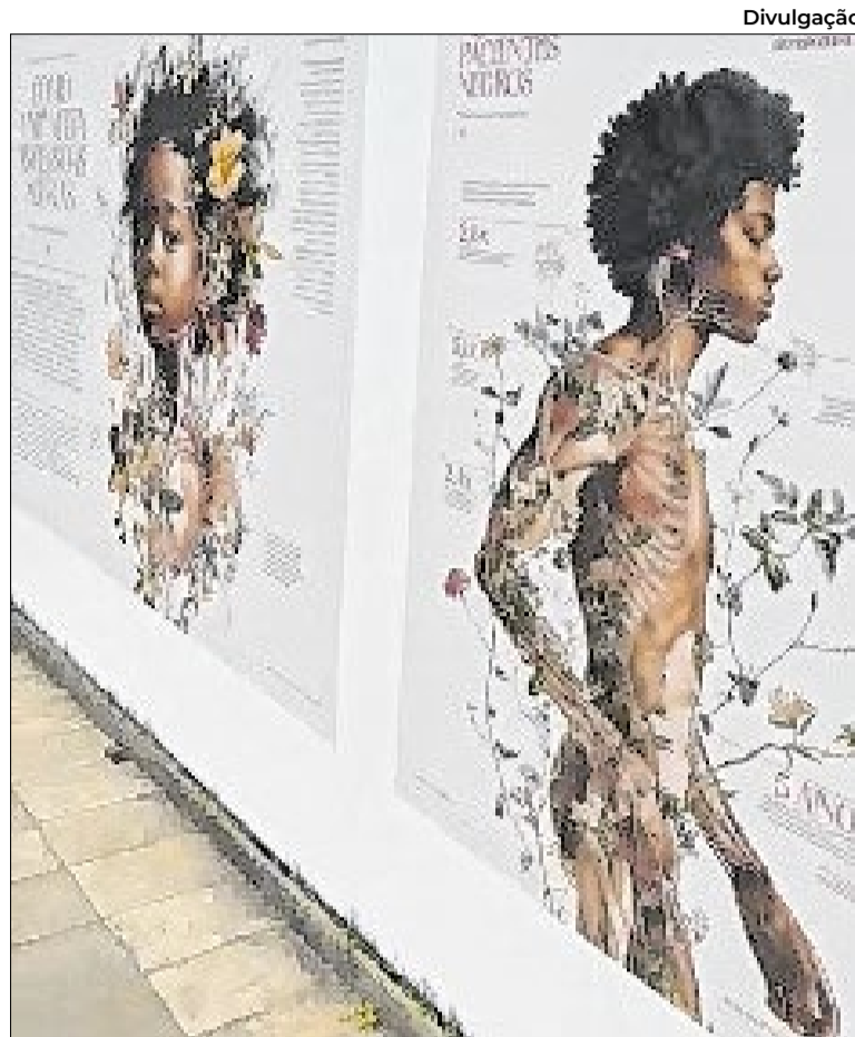
Exposição está até 21 de abril no Hospital Samaritano Barra