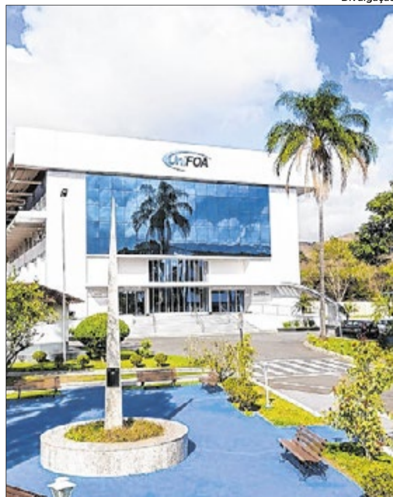
Centro Universitário de Volta Redonda discute inclusão

“A evasão escolar, muitas vezes associada a fatores socioeconômicos e à falta de engajamento, e a defasagem de aprendizagem, agravada pelas desigualdades no acesso a recursos, são desafios centrais. Soma-se a isso a precarização da profissão, que limita o tempo e as condições para a formação continuada.”