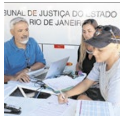
A ação conta com apoio da Corregedoria-Geral de Justiça