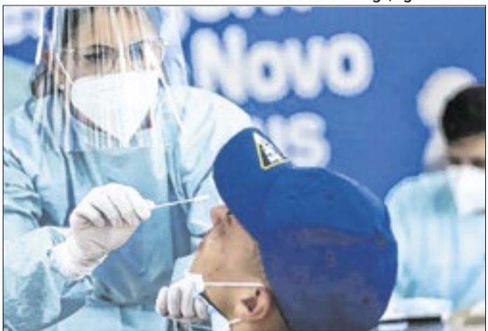
Brasil registrou 711 mil mortes durante a pandemia