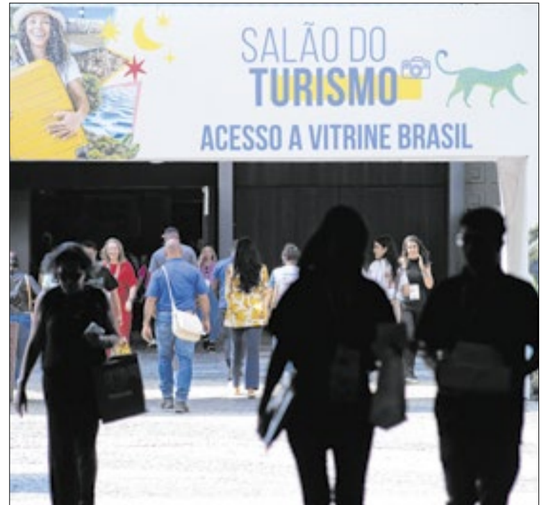
Evento do MTur reunirá destinos, capacitações e cultura

O ministro Gustavo Feliciano reforçou o diálogo com o Congresso ao se reunir com Daniela Reinehr, da Comissão de Turismo da Câmara, e Professora Dorinha Seabra, da comissão do Senado. O encontro incluiu convite para o Salão do Turismo e sinaliza convergência institucional em pautas estratégicas do setor.