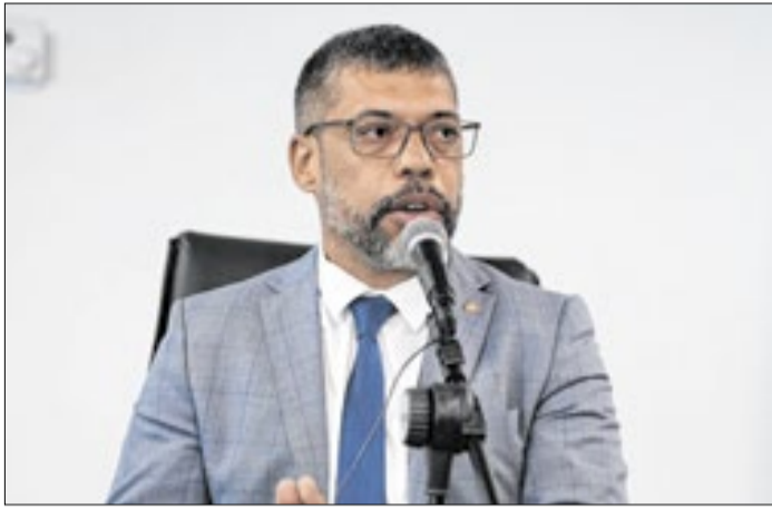
Deputado estadual aponta descaso quanto à manutenção