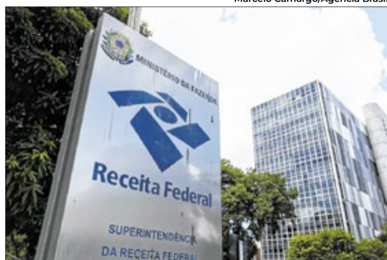
Carga tributária no país em 2025 foi de R$3,5 tri (32,4% do PIB)

Carga tributária é o total de impostos, taxas e contribuições arrecadados pelo governo em relação à riqueza gerada pelo país, medida pelo Produto Interno Bruto (PIB). O indicador mostra qual parcela de tudo o que a economia produz é destinada ao pagamento de tributos, sendo uma das principais referências para avaliar o peso dos