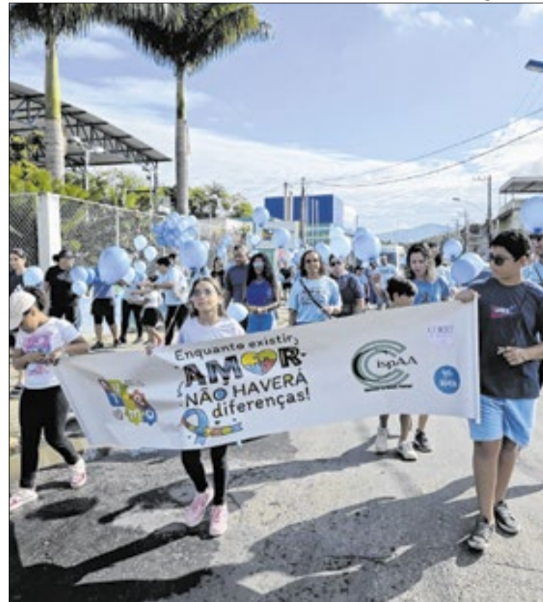
Caminhada reforçou mensagem de empatia no município

“O esporte também é uma ferramenta de inclusão, e estar aqui hoje reforça o nosso compromisso com uma cidade mais participativa e acessível para todos”, afirmou.