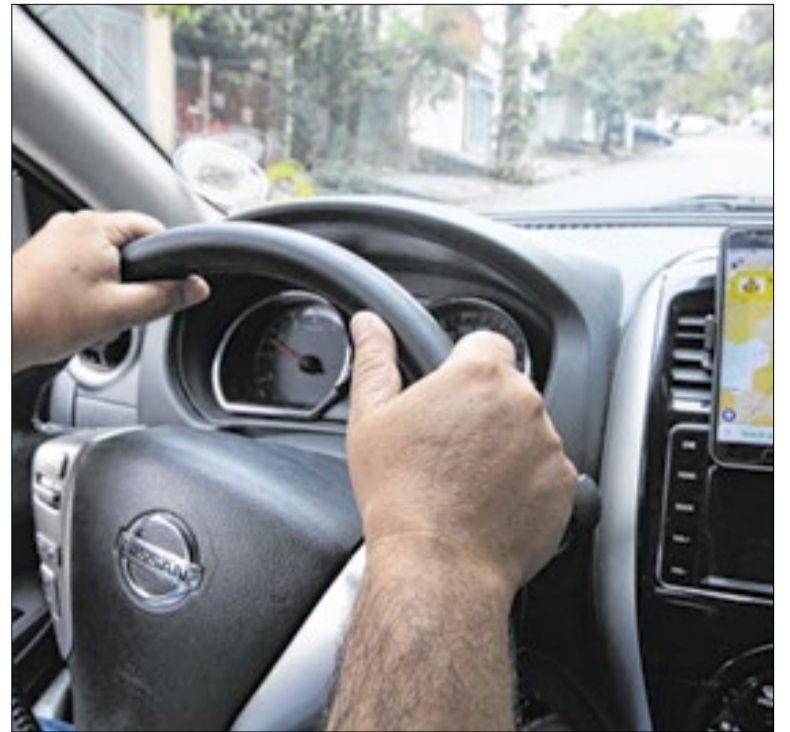
Decisão reacende debate sobre direitos a motoristas de APPs

As legendas afirmam que a norma pode estimular a migração partidária sem perda de mandato e enfraquecer a fidelidade partidária no sistema político brasileiro. Também apontam risco de impactos na organização das federações partidárias e na previsibilidade do processo eleitoral. O caso será analisado pelo STF.