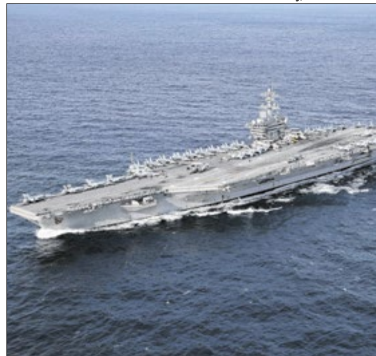
Teerã e Trump falam em atacar navios militares adversários