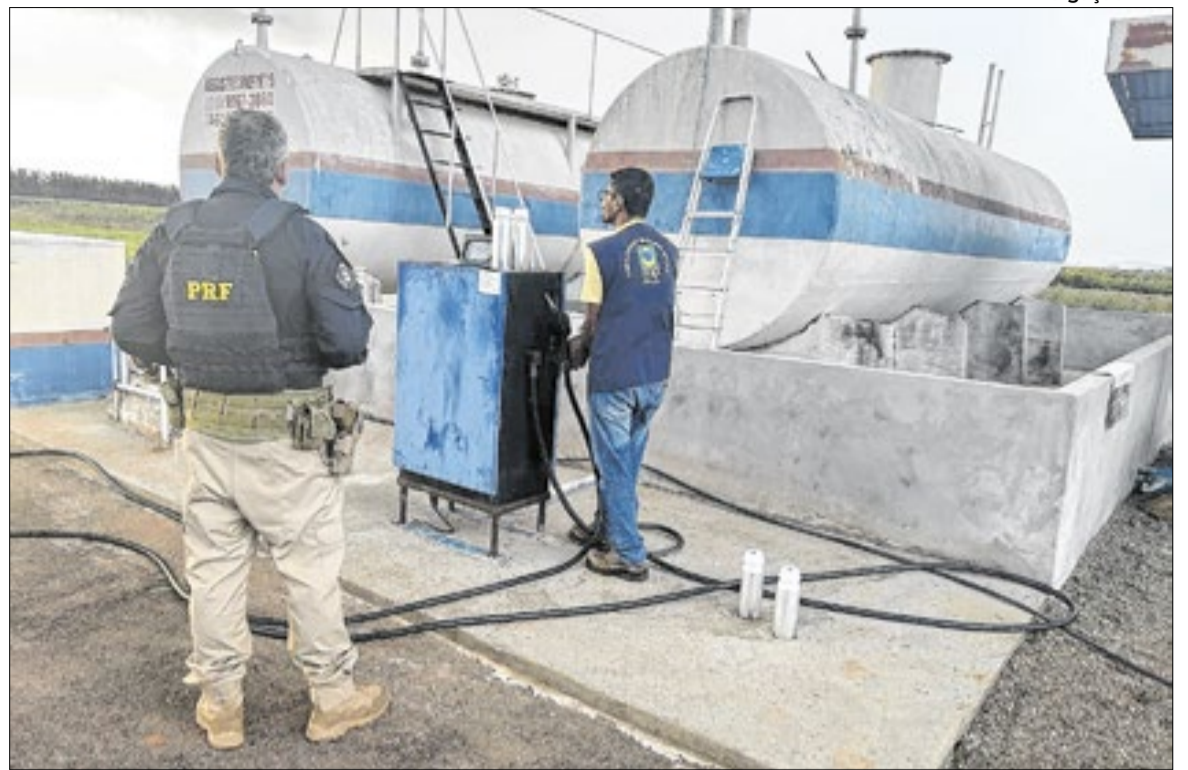
Iniciativa integra a força-tarefa nacional para monitoramento e fiscalização de combustíveis

Na Bahia, as ações ocorreram em cinco postos e uma distribuidora de GLP nas cidades de Feira de Santana e São Francisco do Conde, com dois autos de infração e um de interdição. No Ceará, foram fiscalizados sete postos, duas distribuidoras de combustíveis, três distribuidoras e uma revenda de GLP em Fortaleza, com seis autos de infração. No Maranhão, cinco postos, seis distribuidoras e duas estações de distribuição de gás foram fiscalizados em cidades como São Luís e São José de Ribamar, sem infrações registradas. Em Pernambuco, ações em nove postos, sete distribuidoras e seis revendas de GLP em cidades