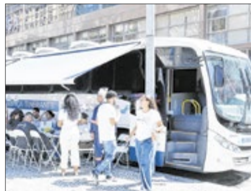
Tendas do mutirão de atendimento, dialogando com quem buscava acesso à documentação e a outros serviços