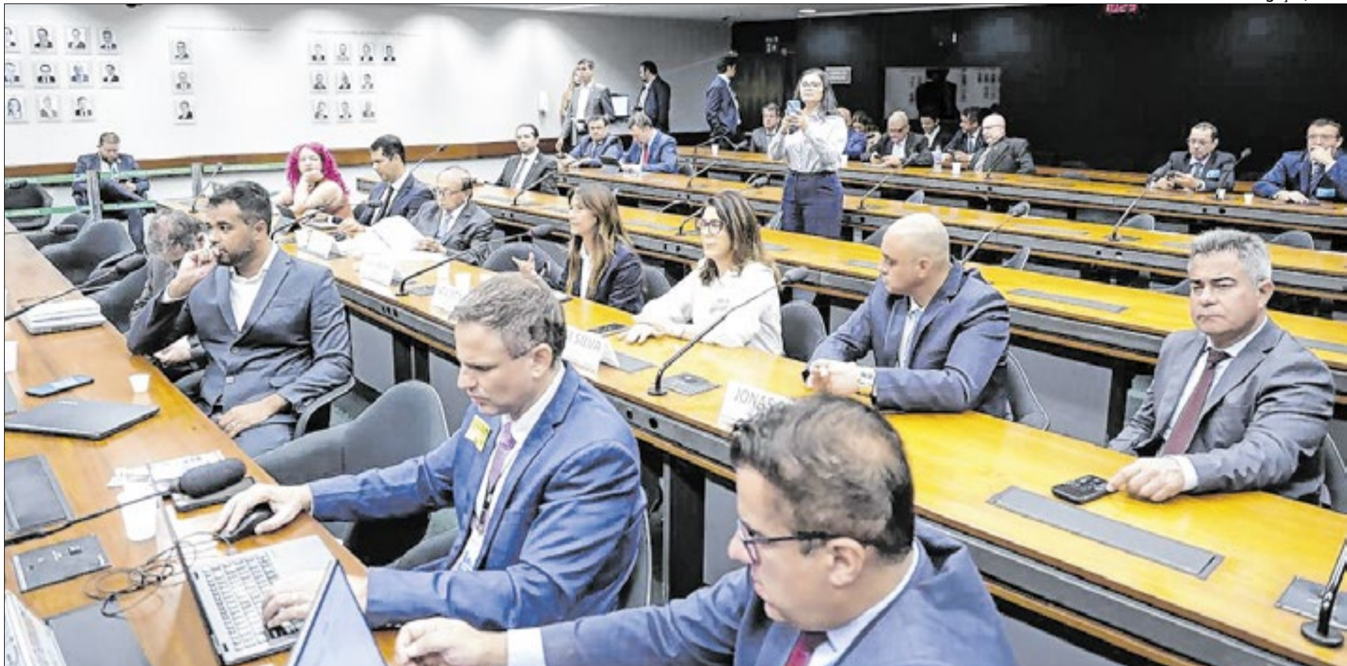
Prefeitos falaram sobre situação crítica da rodovia e reforçaram a cobrança por ações emergenciais no trecho que liga Sapucaia a Volta Redonda

N a Câmara dos Deputados, foi realizada na manhã desta terça-feira (14) a audiência pública para discutir sobre a situação da BR-393, a Rodovia do Aço. Durante o encontro, que aconteceu em Brasília por meio da Comissão de Viação e Transportes, diversas autoridades denunciaram o cenário crítico da rodovia e cobraram medidas urgentes para evitar novos acidentes e mortes.