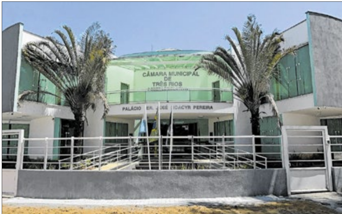
Teto de gastos pode chegar no máximo a 54% e atualmente chega aos 50,71%

vale será de aproximadamente R$ 42,52. Os custos podem ultrapassar R$ 150 mil por ano, considerando os dias úteis e a quantidade de cadeiras ocupadas da Câmara, que são 15 no total.