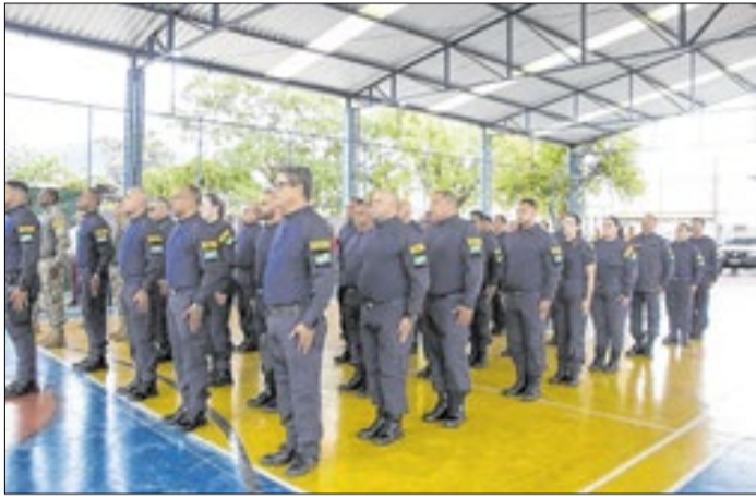
Agentes iniciam curso com foco em segurança pública