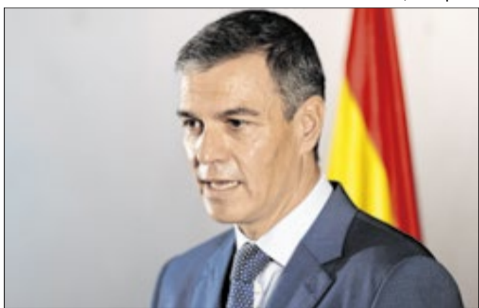
Pedro Sánchez ponderou sobre renúncia por vários dias