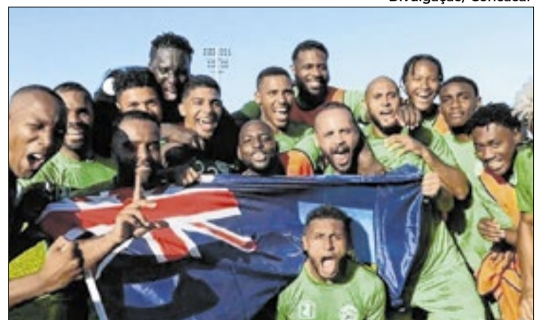
Seleção de Montserrat disputa jogos da Concacaf

O processo foi iniciado no começo deste ano em meio a escândalos envolvendo a associação. Historicamente, ela recebia verbas da Fifa para desenvolver projetos locais no futebol e ajudar na prática do esporte na ilha.