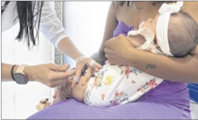
Reforça na vacinação de grupos prioritários