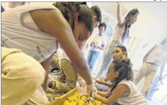
Crianças descobrem o mundo da arqueologia