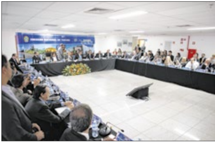
Reunião do CNT ocorrerá durante a WTM Latin America