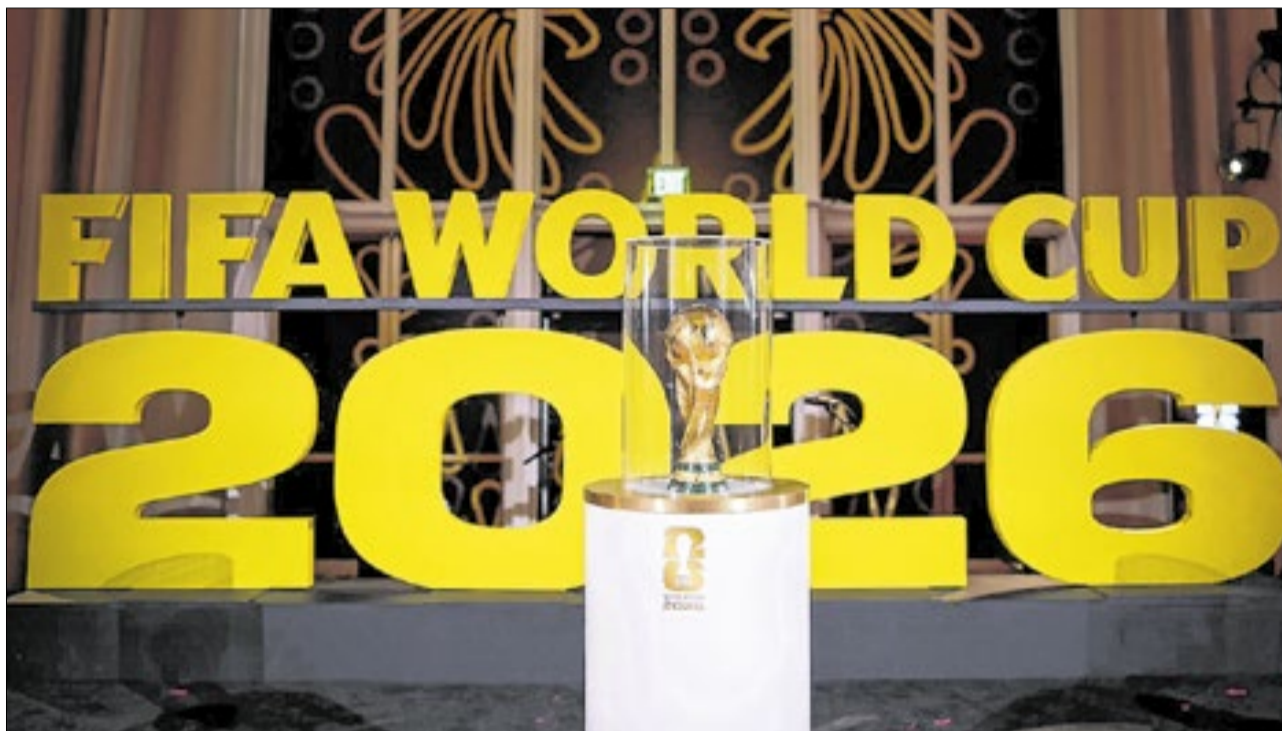
Além da taça e da glória, seleção que sair vencedora levará uma fortuna para casa

Em meio a isso, algumas divisões de arquibancadas e setores sofreram mudanças durante os processos de vendas. Por exem-