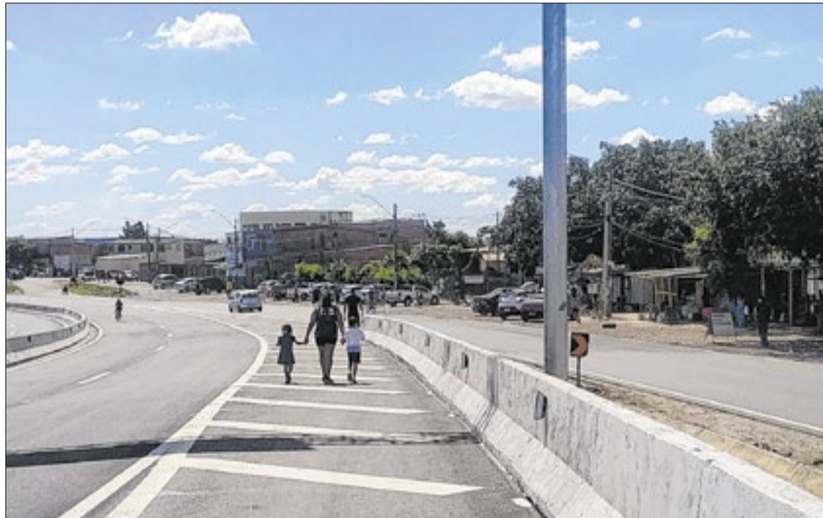
Pedestres na Miguel Melhado após a inauguração feita pelo governador Tarcísio