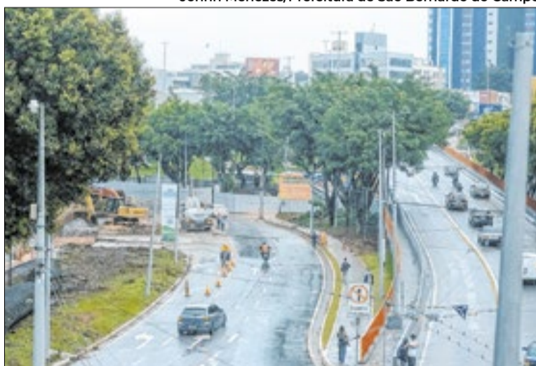
Motoristas devem utilizar rotas alternativas durante as obras

Nos primeiros 30 dias, o acesso do trólebus continuará ativo