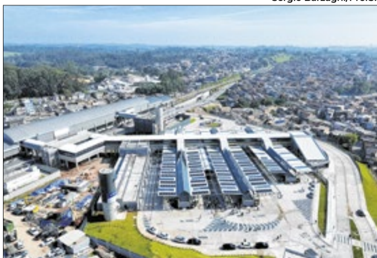
Inauguração do Terminal Estação Varginha

prevê que o terminal antigo continue operando linhas estruturais, enquanto o novo concentrará linhas alimentadoras, que levam passageiros dos bairros até o sistema de trilhos.