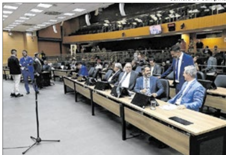
Aprovação ocorreu durante 20ª Reunião Ordinária

Outro eixo da proposta trata da transferência das permissões. Pelo projeto, a transferência só poderá ocorrer após um prazo mínimo de três meses da concessão ou da última transferência. Além disso, o permissionário que transferir seu ponto ficará impedido de solicitar nova autorização pelo período de dois anos. A proposta também veda mudanças sem autorização prévia do poder público e estabelece regras espe-