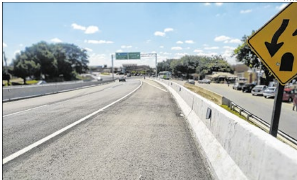
Obra foi inaugurada pelo governador sem sinalização de trânsito nas pistas

“vai solicitar à Prefeitura de Campinas a alteração do local do ponto de ônibus para perto da passagem inferior de pedestres construída na Miguel Melhado, a 300 metros do local que receberá uma passarela”.