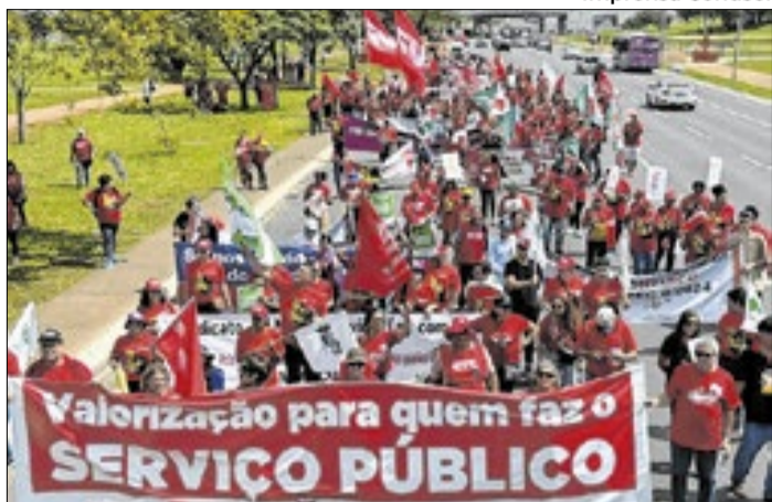
Marcha de trabalhadores do serviço público em 2025