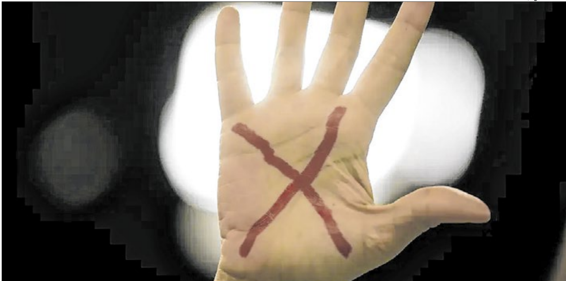
Pacote sancionado prevê monitoramento eletrônico de agressores, tipifica violência vicária e cria data nacional voltada à proteção de mulheres indígenas

M ulheres de todo o país passam a contar nesta sexta-feira (10) com leis de proteção mais abrangentes para casos de violência. O Diário Oficial da União desta sexta-feira (10) traz publicadas normas que tipificam crimes e ampliam a vigilância sobre agressores.