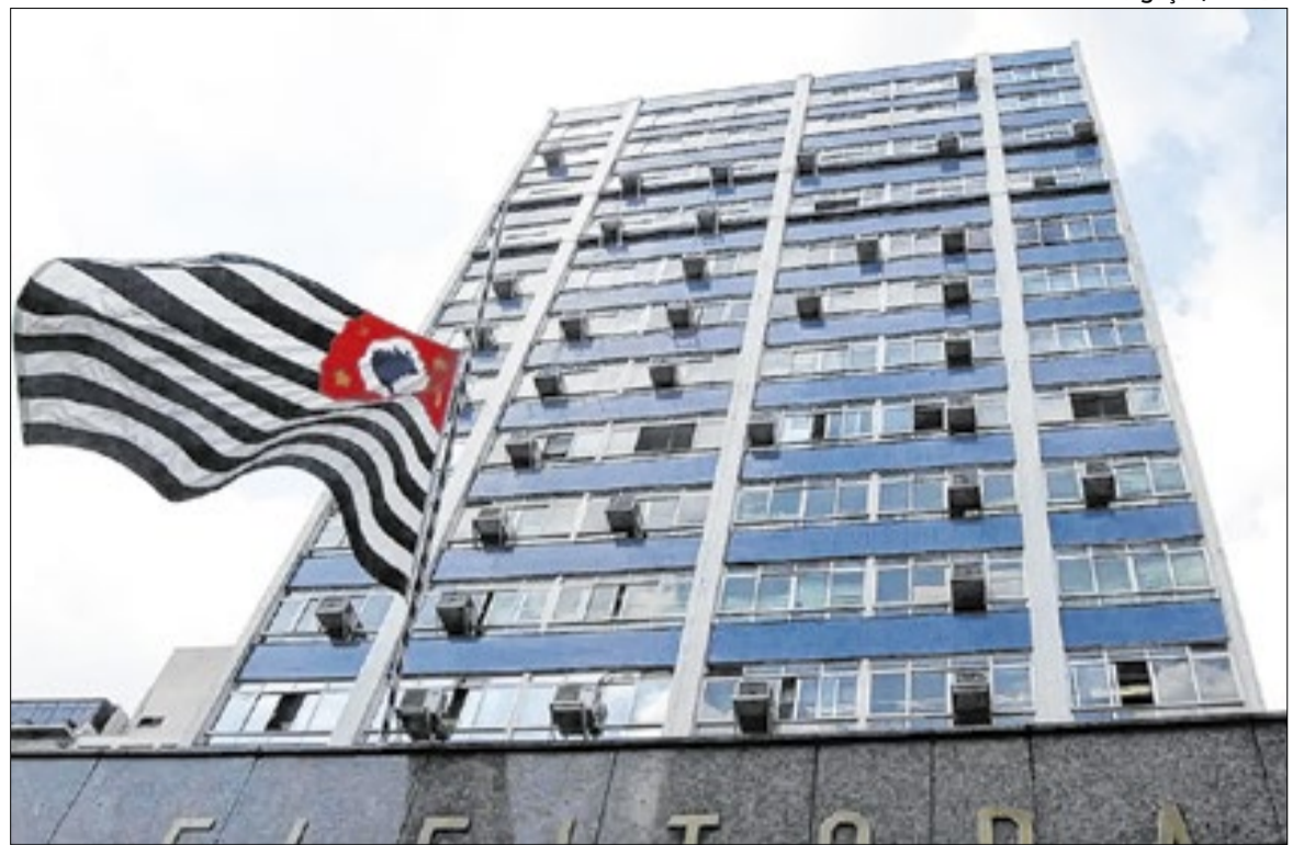
Em todos os casos analisados pelo TRE-SP, ainda cabe recurso por parte das agremiações

As falhas totalizaram R$ 362.968,29, mais de 50% da movimentação financeira do