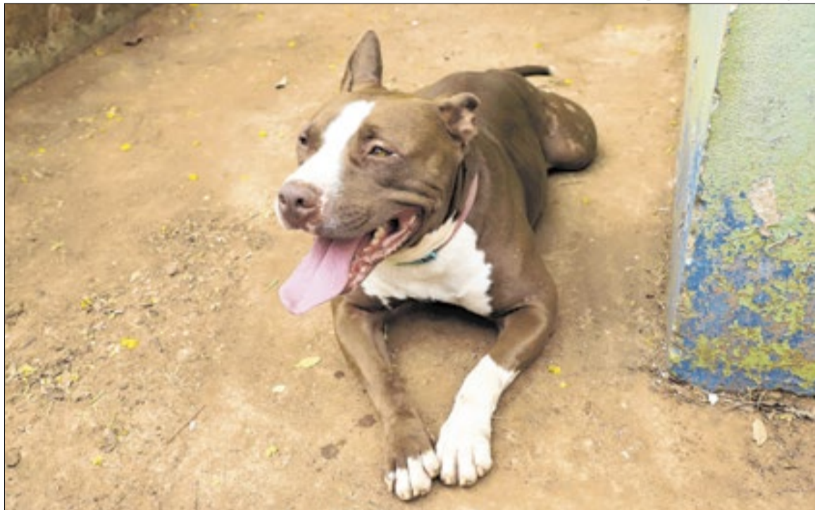
Cão da raça pitbull abrigados no Departamento de Proteção e Bem Estar Animal

A ação também destaca problemas no envio de animais para abrigos em outros municípios, localizados a mais de 100 quilômetros de Campinas, onde permaneceriam em confinamento pro-