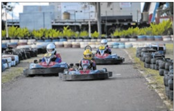
Foco é moldar talentos e formar motoristas conscientes