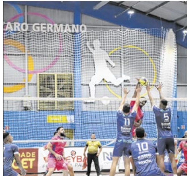
Competições reúnem atletas de diferentes idades e cidades

O contribuinte receberá o login e senha para o acesso ao portal Cajamar GeoPixel, onde ele poderá ver as medidas do imóvel. Se o usuário discordar da área, ele tem até 30 dias para contestar, de forma presencial a decisão. O objetivo dessa medida é garantir justiça fiscal e atualizar o planejamento urbano.