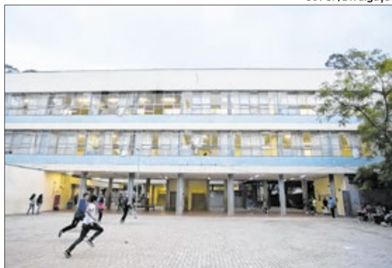
Nas reivindicações estão reajuste salarial e abertura de classes

A pauta da mobilização inclui ainda outros pontos, como a retirada de pauta do PL 1.316, que