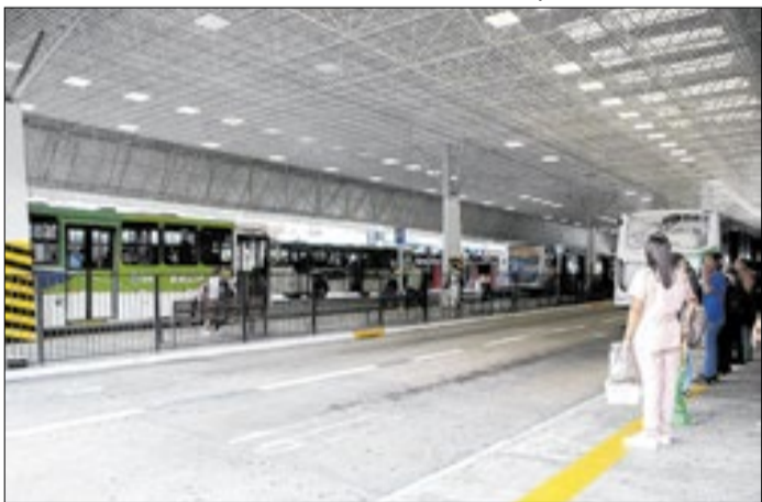
A linha passa pelas avenidas Trindade, Anápolis e mais