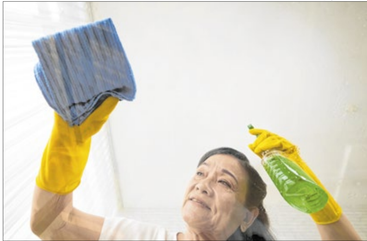
Mulheres representam cerca de 88% dos trabalhadores domésticos no Brasil.

O Dia das Empregadas Domésticas é celebrado em 27 de abril. A data faz referência a Santa Zita, reconhecida como padroeira das trabalhadoras domésticas. A comemoração é usada para dar visibilidade à categoria e às mudanças trazidas pela legislação ao longo dos anos no país.