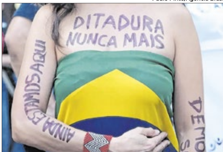
Ex-estudante da USP receberá indenização de R$ 300 mil

“O dano moral comprovado resultou da conduta de policiais do Departamento de Ordem Política e Social (Dops), servidores do Estado de São Paulo, e do próprio regime militar, que possibilitou arbitrariedades, privações e