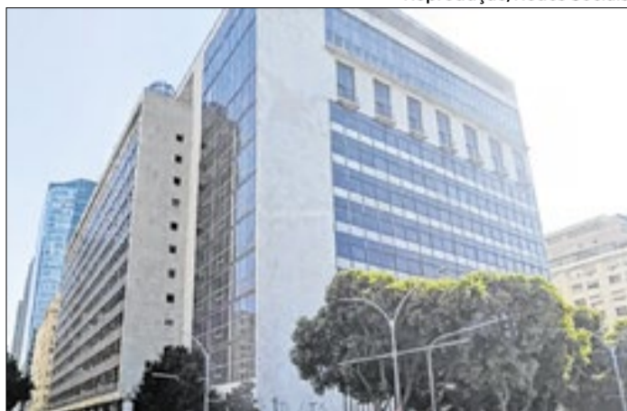
Prédio do Jockey, usado na quitação de dívida