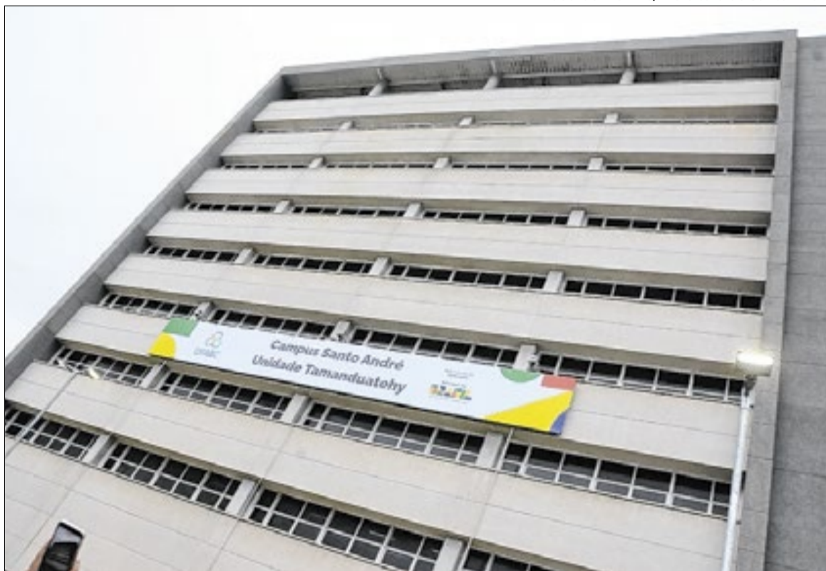
Com grande investimento, a Unidade Tamanduatehy foca em cursos de engenharia

“A inauguração da unidade Tamanduatehy da UFABC representa um marco histórico para Santo André e para todo o ABC. Estamos falando de um investimento estruturante, que amplia a capacidade da universidade de formar milhares de estudantes,