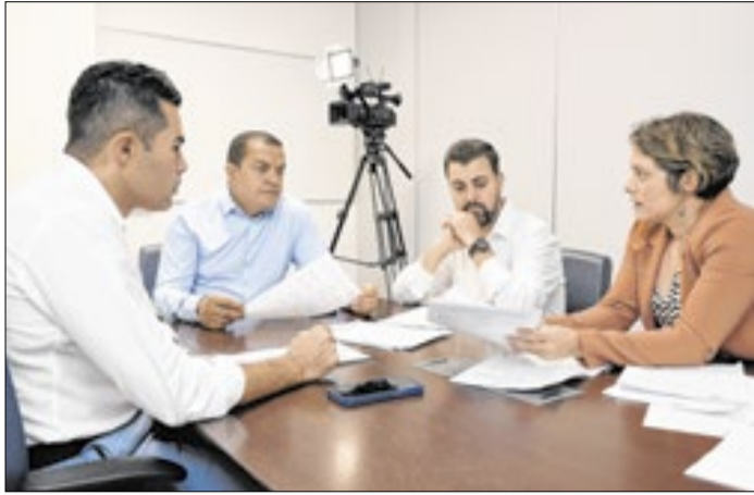
Proposta permite multa automática para o barulho