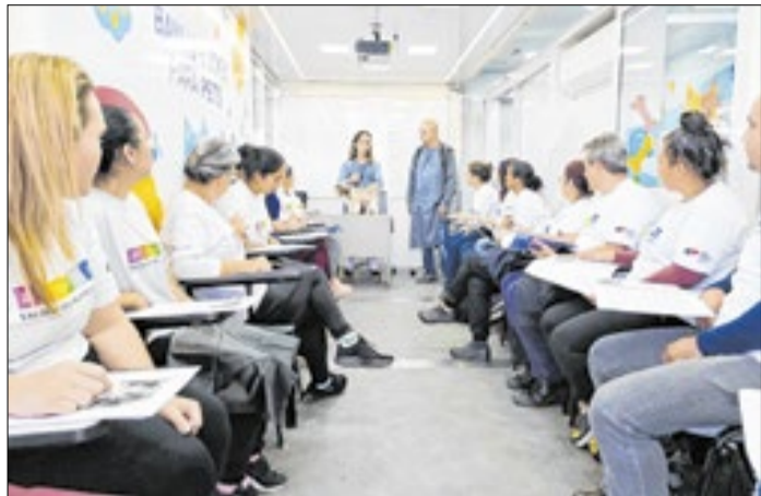
Programa passa pela região pela primeira vez