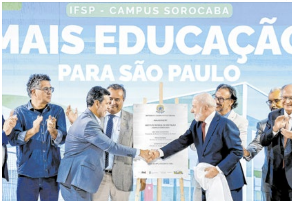
Com a entrega, campus passa a oferecer melhores condições para estudantes e servidores

A nova sede do Campus Sorocaba possui 4,6 mil metros quadrados de área construída. O espaço inclui blocos de salas