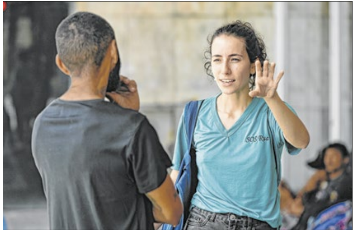
Na região Central, onde se concentra a maior demanda, foram registradas 145 abordagens

Nas demais regiões da cidade, o trabalho também se manteve contínuo. Na região Sul, foram 30 abordagens, 12 articulações e seis buscas ativas, com inserções em instituição de acolhimento, acompanhamentos ao CAPS AD e à UPA (Uni-