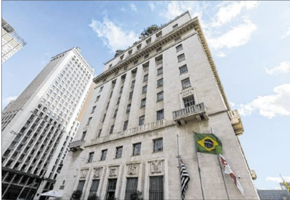
Decreto da Prefeitura envolve tanto a criação quanto a reformulação de áreas

Na prática, a medida é uma tentativa de ampliar a eficiência na execução de serviços descentralizados, aproximando a tomada de decisão das regiões administrativas. Ao redistribuir competências e ajustar funções estratégicas, a Prefeitura quer dar mais autonomia operacional às subprefeituras, que passam a