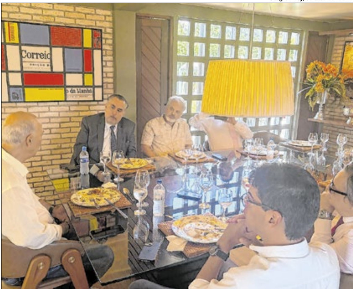
Arruda almoçou na Casa Correio da Manhã

Mesmo com a crise do Master. Antes, tínhamos alguém que tomava um vinho no almoço e não aparecia para trabalhar à tarde. Agora, temos alguém que trabalha muito. E que não tem muitos limites na sua atuação.