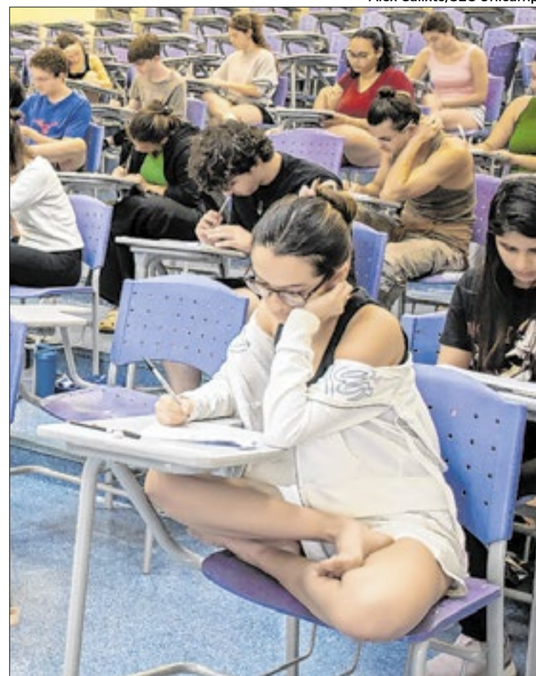
Vestibular Unicamp 2026: inscrições de 22/4 a 8/5

Além do simulado presencial, a Comvest mantém provas online gratuitas com questões aplicadas entre 2017 e 2026, que também podem ser utilizadas como ferramenta de estudo. A comissão destaca que a prática com diferentes formatos de prova é fundamental para o desempenho no vestibular, especialmente na gestão do tempo e na familiaridade com o estilo das questões.