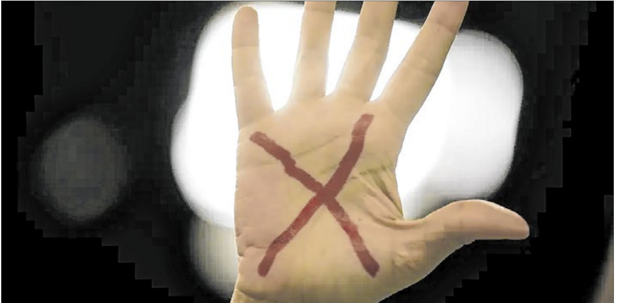
Pacote sancionado prevê monitoramento eletrônico de agressores, tipifica violência vicária e cria data nacional voltada à proteção de mulheres indígenas

M ulheres de todo o país passam a contar nesta sexta-feira (10) com leis de proteção mais abrangentes para casos de violência. O Diário Oficial da União desta sexta-feira (10) traz publicadas normas que tipificam crimes e ampliam a vigilância sobre agressores.