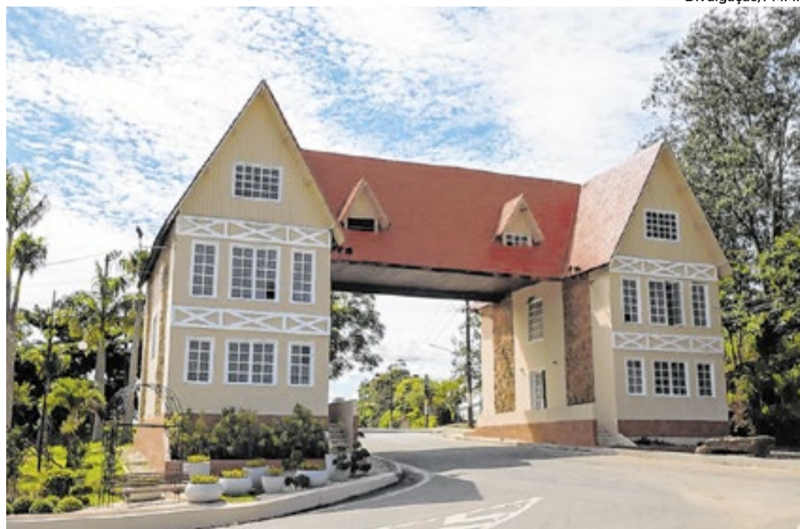
Tradicional Miguel Pereira sedia discussões que seguem até quinta-feira