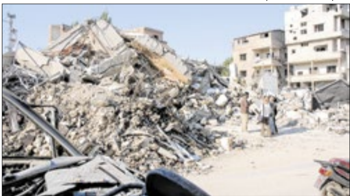
Grupo Hezbollah complica acordo de trégua