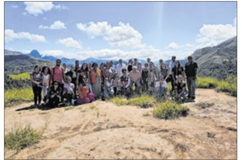
Objetivo é a elaboração de um manual de Desenvolvimento

Além das oficinas e palestras, haverá troca de lâmpadas incandescentes ou fluorescentes por modelos LED. A Enel Rio atende 66 municípios do estado do Rio de Janeiro, abrangendo 73% do território estadual. Para participar, basta levar um documento com foto, a última conta de energia paga e as lâmpadas usadas para troca.