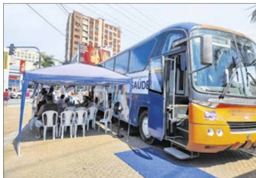
Ônibus vai atuar por mais uma semana no Centro

“Os resultados mostram que estamos no caminho certo ao levar o serviço do Ônibus da Saúde para áreas de grande circulação”, afirmou.