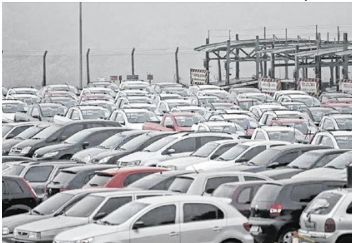
Regulamentação entrou em vigor no dia 31 de março deste ano

Além disso, deve receber todo e qualquer veículo, conforme classificação constante do Código Nacional de Trânsito (CTB), quando devidamente apreendi-