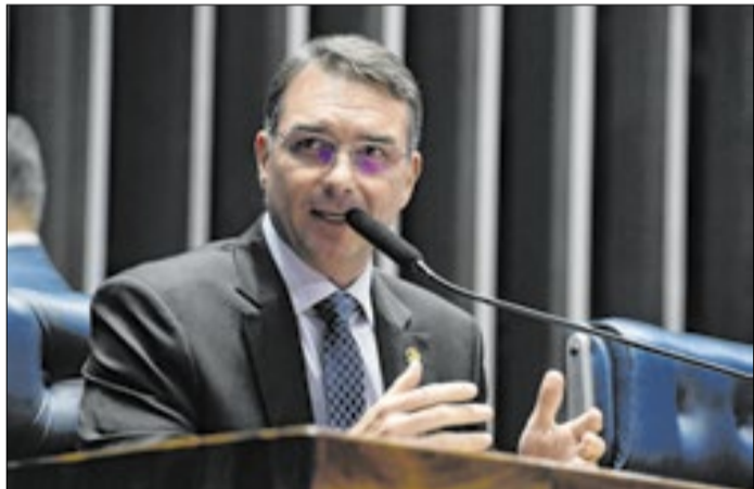
Senador, hoje, está indo bem nas pesquisas