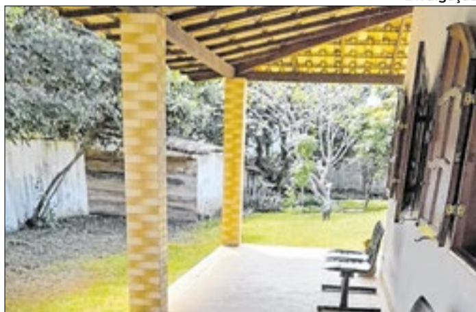
Nova Residência Inclusiva, em Conceição de Macabu.