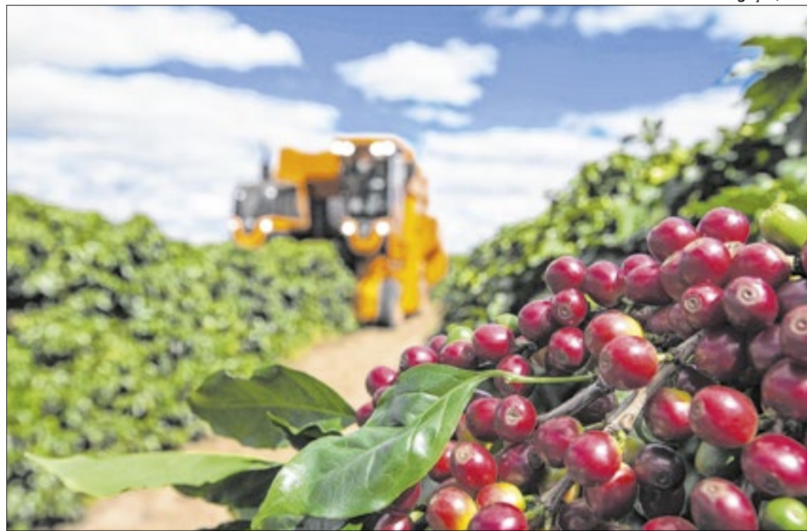
CSN marca presença em Encontro Técnico de Cafeicultura “Mãos no Grão”