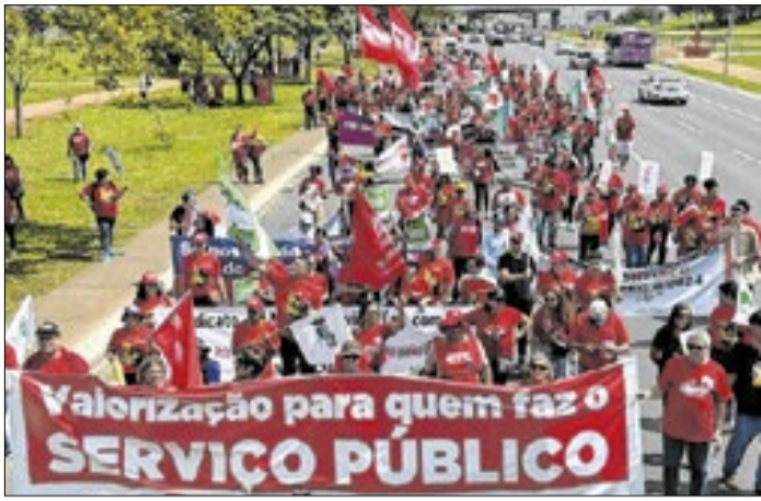
Marcha de trabalhadores do serviço público em 2025