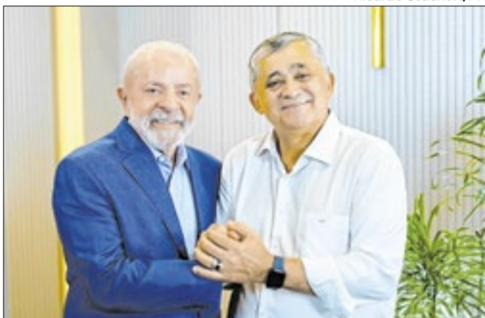
Guimarães toma posse hoje como ministro