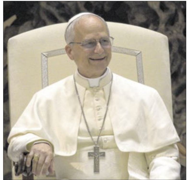
Papa não quer entrar em debate com Trump

Em nota, o governo brasileiro afirmou ter recebido "com profundo pesar" a notícia do acidente e manifestou solidariedade ao povo haitiano, além de condolências às famílias das vítimas e votos de pronta recuperação aos feridos.