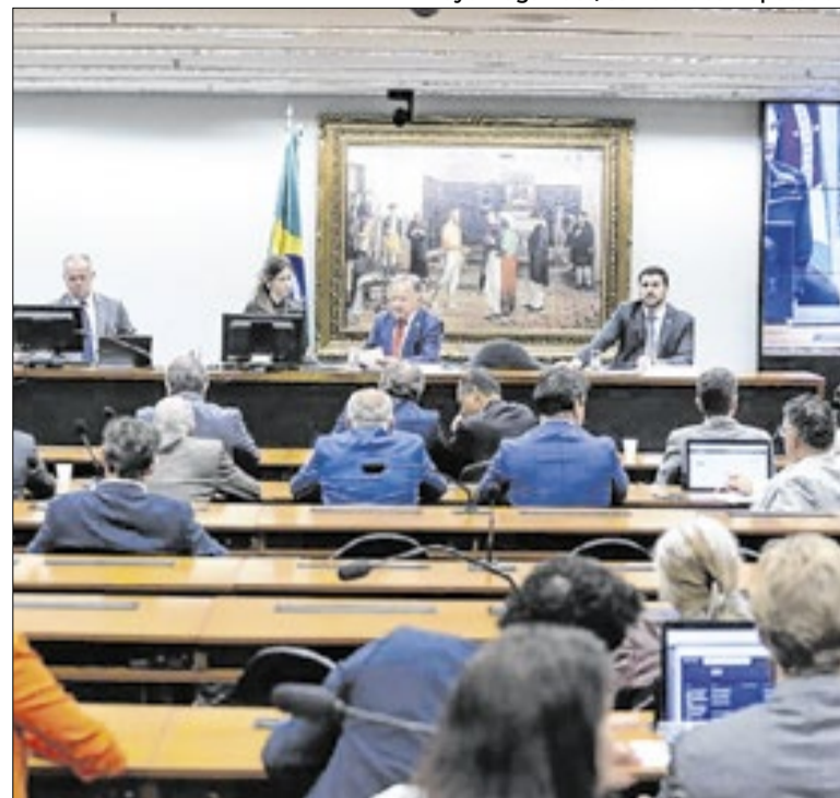
Sabatina aconteceu na Comissão de Finanças e Tributação

As denúncias envolvem dois episódios de natureza sexual. A primeira foi feita por uma jovem que o acusa de agressão durante um banho de mar em Santa Catarina. A segunda parte de uma ex-funcionária terceirizada, que afirma ter sido vítima de assédio em diferentes ambientes do gabinete, com impacto em sua saúde física e mental.