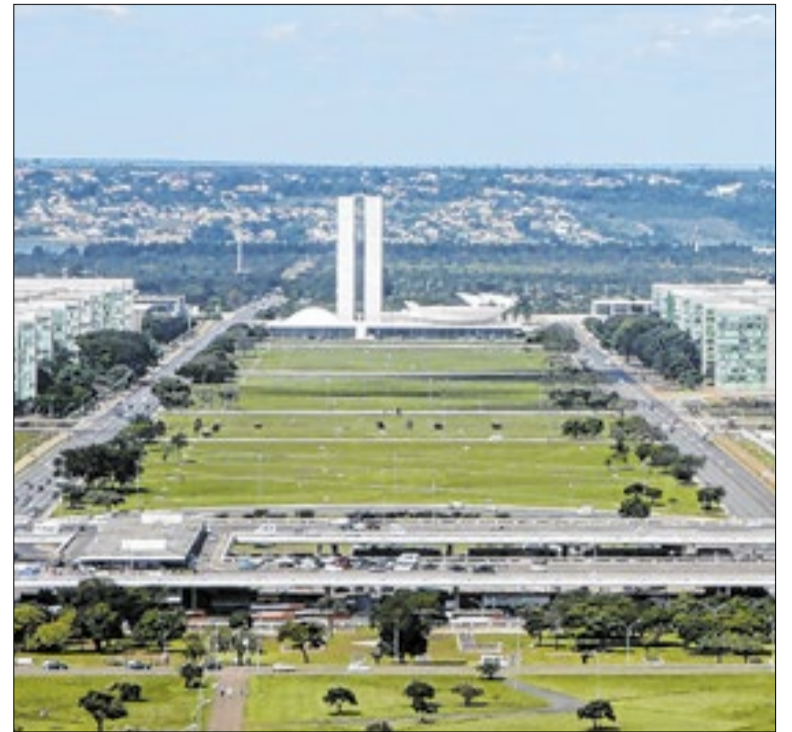
Teto de 35% destinados a empréstimos pessoais não mudou

A proposta amplia as fontes do Fundo para Aparelhamento da Polícia Federal (Funapol) e permite uso de recursos para auxílio-saúde de servidores. O texto também destina até 3% da arrecadação de apostas esportivas ao fundo e autoriza reforço de verbas do Tesouro em 2026. MP tem prazo de até 120 dias para análise.