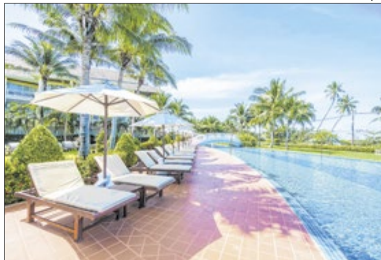
Turismo representa 5% de toda a força de trabalho do país

Segundo avaliação do governo, o avanço está diretamente ligado ao fortalecimento do turismo doméstico e regional, es-