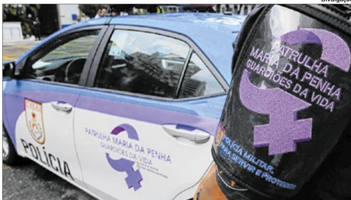
Pacote legal atualiza Lei Maria da Penha e amplia alcance das medidas de proteção

Leis preveem monitoramento e penas mais duras para crimes