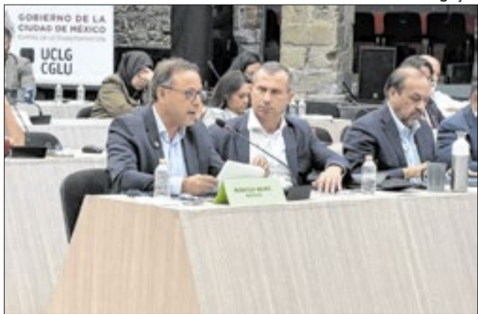
Rodrigo Neves, prefeito de Niterói, no CGLU