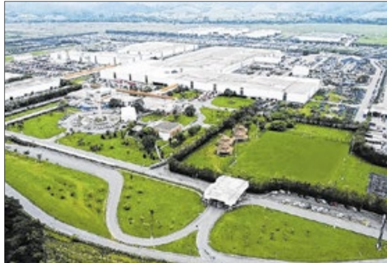
Fábrica da Volkswagen que produz Meteor 28.480 6x2

As 50 unidades adquiridas do Meteor 28.480 6x2 são equipadas com o motor MAN D26 de 13 litros, que entrega 475 cv de potência