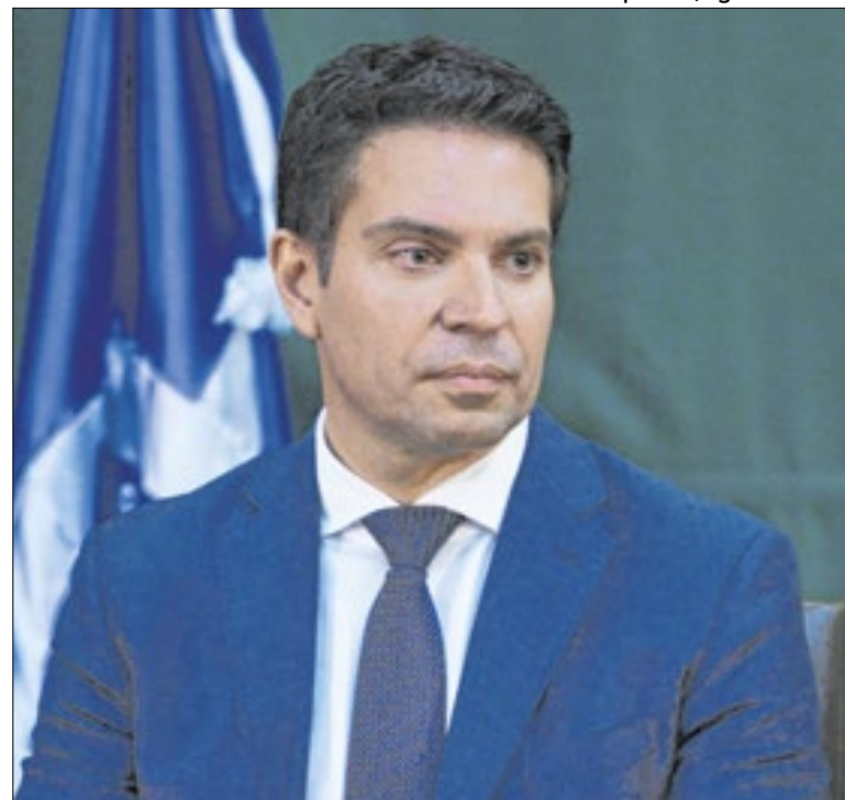
Ramagem fugiu do país após a condenação pelo STF

Mas, no caso, interessará à federação estar formalmente na chapa de Flávio? Andam desconfiados com a forma como o PL atua. Agora mesmo foi o partido que mais cresceu na janela partidária ganhando deputados do União. E escanteia possíveis aliados, como Esperidião Amin (PP) em Santa Catarina.