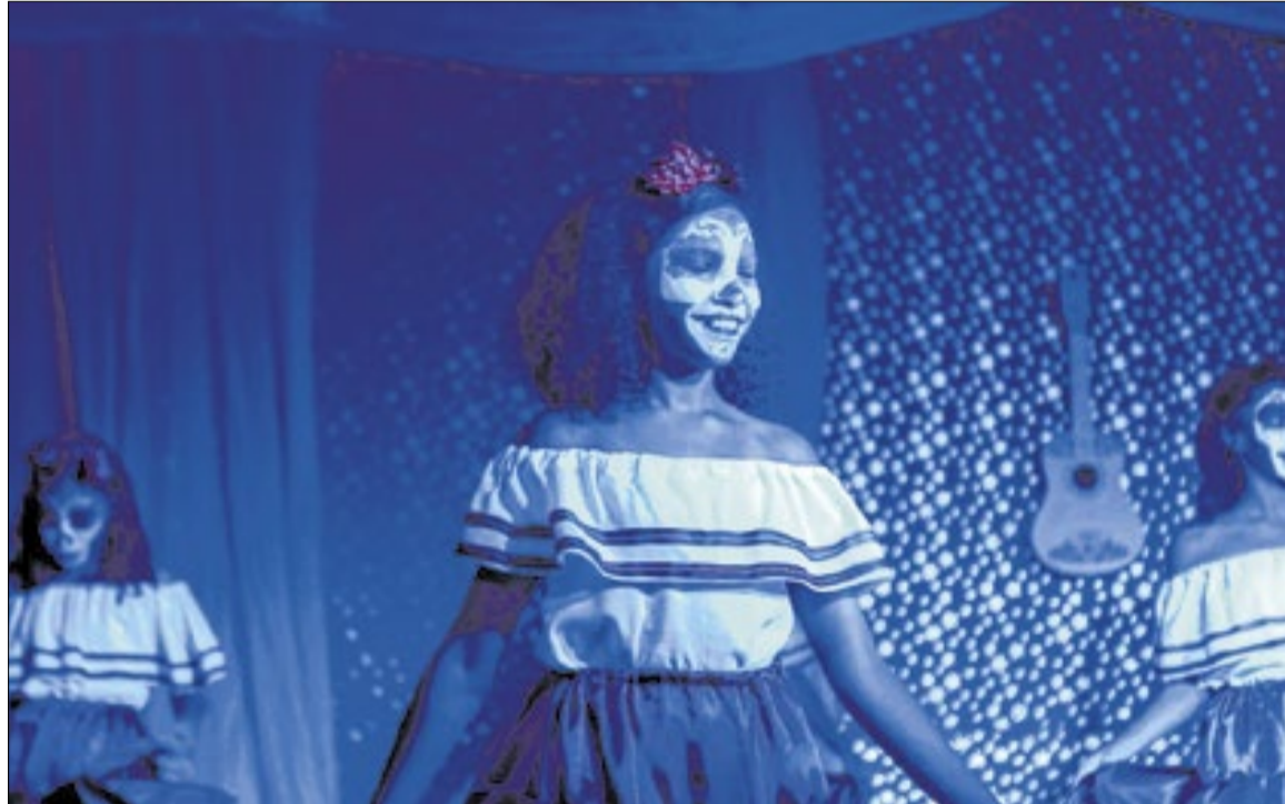
As inscrições serão feitas pelo site da Prefeitura Municipal e irão de 17 de abril a 10 de maio, com 30 vagas no total

No edital Culturas Negras, Culturas Populares e Tradicionais, o objetivo é fomentar a criação, a produção, a difusão de saberes e a circulação de manifestações vinculadas às culturas negras e às culturas populares e tradicionais