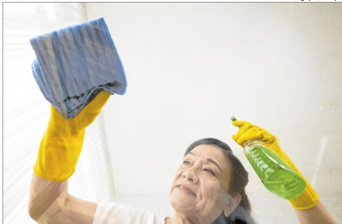
Mulheres representam cerca de 88% dos trabalhadores domésticos no Brasil.

O Dia das Empregadas Domésticas é celebrado em 27 de abril. A data faz referência a Santa Zita, reconhecida como padroeira das trabalhadoras domésticas. A comemoração é usada para dar visibilidade à categoria e às mudanças trazidas pela legislação ao longo dos anos no país.