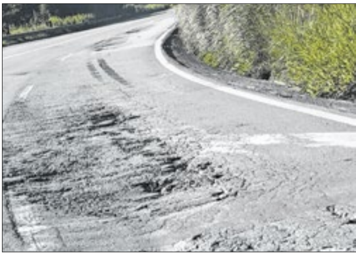
BR-393 coleciona buracos e acidentes são semanais