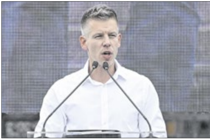
Péter Magyar em discurso à população húngara