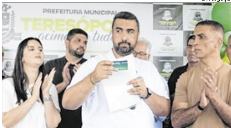
Empresa que vai gerir o serviço ainda não foi contratada