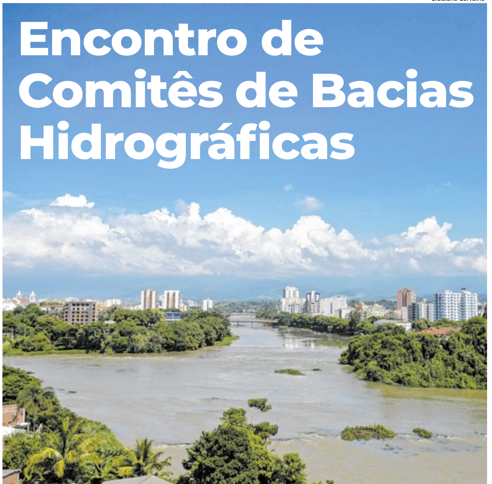
Rio Paraíba do Sul abastece mais de 18 milhões de pessoas e atravessa 184 municípios em São Paulo, Minas Gerais e Rio de Janeiro

O evento é promovido pelo Fórum Fluminense de Comitês de Bacias Hidrográficas (FFCBH) e tem execução da Associação Pró-Gestão das Águas da Bacia Hidrográfica do Rio Paraíba do Sul (AGEVAP), reunindo a participação ativa de diversos comitês de bacias do estado, como os das regiões do Guandu, da Baía de Guanabara, Baixo Paraíba do Sul e Itabapoana, Baía da Ilha Grande, Médio Paraíba do Sul, Rio Macaé, Lagos São