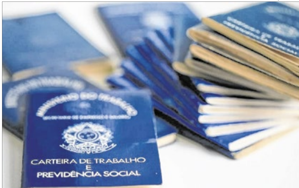
Vagas formais nas regiões Metropolitana, Serrana e Médio Paraíba

Na Região Metropolitana, estão concentradas 74,2% das vagas: são 611 chances de trabalho, sendo 101 destinadas, exclusivamente, a pessoas com deficiência (PcD). Para esse público, destacam-se oportunidades como ajudante de padeiro, armazenista, auxiliar de orientação pedagógica, auxiliar de escritório e auxiliar de logística, com salários que variam de um a dois (R$ 1.621 a R$ 3.242). Também se destacam vagas com maiores faixas salariais, como as de encarregado de obras, com remuneração de três a quatro salários mínimos (R$ 4.863 a R$ 6.484), além de oportunidades para