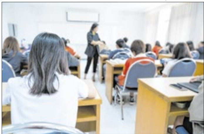
Benefício é baseado no desempenho das escolas no Saesp