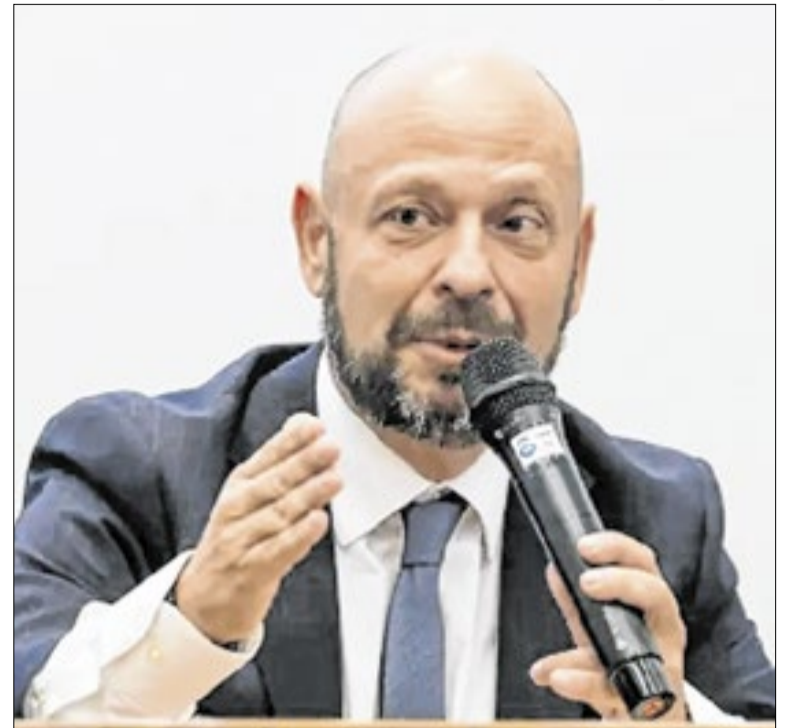
Gilberto Waller assumiu o comando do INSS em abril de 2025

Relatório de Cidadania Financeira (RIF) 2025, divulgado pelo Banco Central na segunda (13), aponta avanço no acesso ao sistema financeiro, com mais de 80% dos adultos com relacionamento bancário. O documento também alerta para o alto nível de endividamento das famílias e riscos de inadimplência.