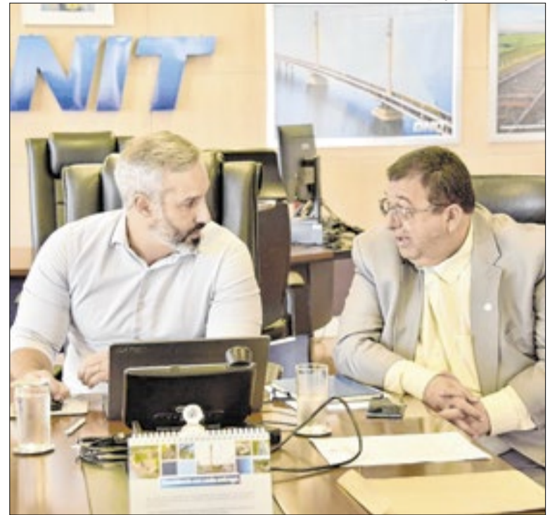
Diretor-geral do DNIT garantiu reforço para ações na BR-393

Na Rodovia do Contorno, aliás, o prefeito Neto anunciou na última semana que foram iniciadas as instalações de iluminação no trecho com objetivo de proporcionar mais segurança. "São quase 500 postes com lâmpadas de LED, em um investimento de mais de R$2 milhões com recursos próprios", afirmou.