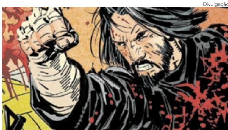
Keanu em versão quadrinhos em ‘BRZRKR’, HQ que ele próprio escreveu

Celebrizado em bonecos e na HQ ‘BRZRKR’, que escreveu, o astro amplia seus domínios via streaming, com o sucesso ‘Consequência’, e via animação, atuando em Sonic’ e ‘Toy Story’