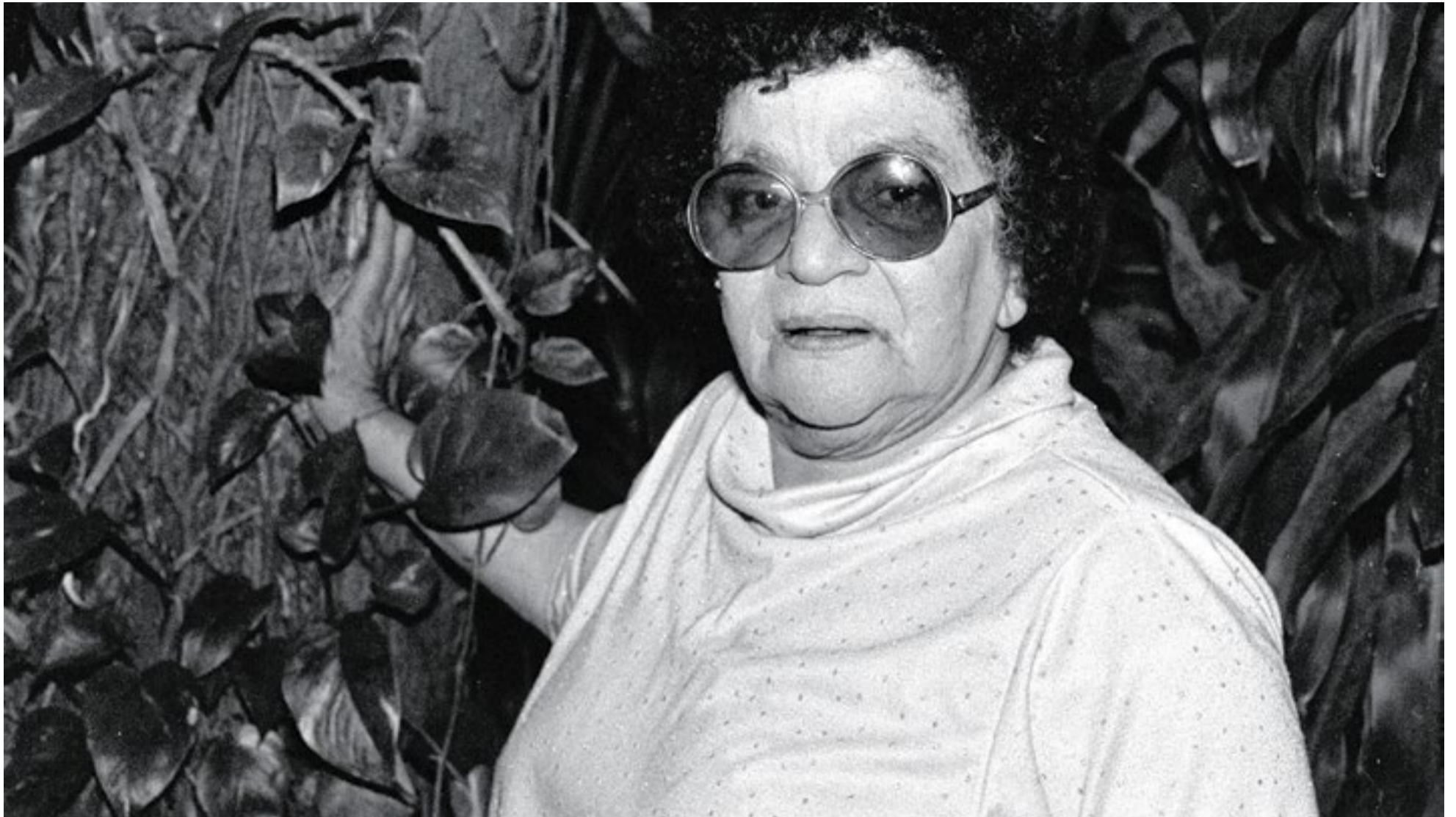
Aracy de Almeida foi a grande intérprete de Noel Rosa e a maior responsável pela popularização de sua obra