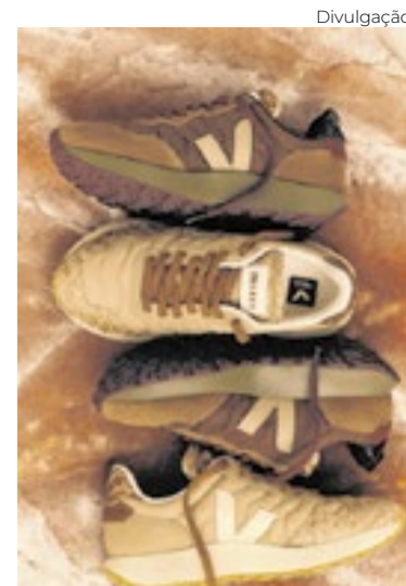
Tênis em colab da Veja com a Misci

Há três estreias. A Argalji, marca mais experimental que exagera nos volumes para brincar com as silhuetas; a Hisha, com peças artesanais feitas por bordadeiras mineiras; e Karoline Vitto, brasileira que já desfilou em Londres e aporta no Rio com seus modelitos criados para corpos diversos. Fora isso, a Blue Man, grife de moda praia na ativa desde os anos 1970, põe na passarela Helô Pinheiro, a musa inspiradora de "Garota de Ipanema".