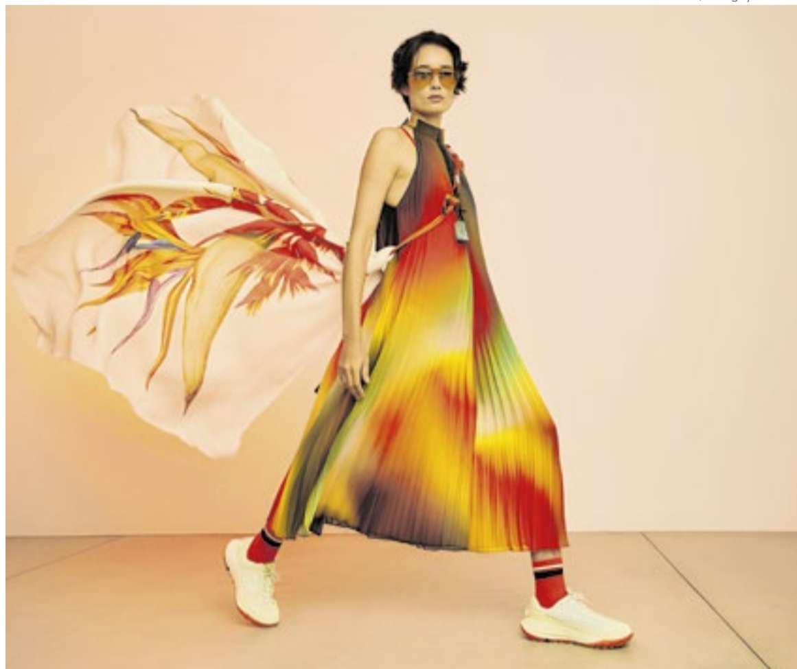
Look da Osklen com vestido plissado de seda e lenço a ser desfilado na Rio Fashion Week

No caso da Osklen, a mais conhecida marca de moda carioca, o desfile terá 36 looks urbanos e de praia que, de acordo com Metsavaht, serão uma homenagem ao Rio - basicamente o que a grife faz desde sua criação, há 36 anos. As roupas e acessórios captam o "hedonismo saudável do Rio de Janeiro, um estilo de vida expresso pelos corpos