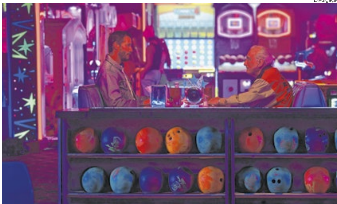
Ameaçado de cancelamento, o ator Reef (Keanu Reeves) pede desculpas a seu velho agente, vivido por Martin Scorsese, em ‘Consequência’ (Outcome)

“Éramos um set de cinema independente, trabalhando com pouco, filmando à moda europeia, e, de re-