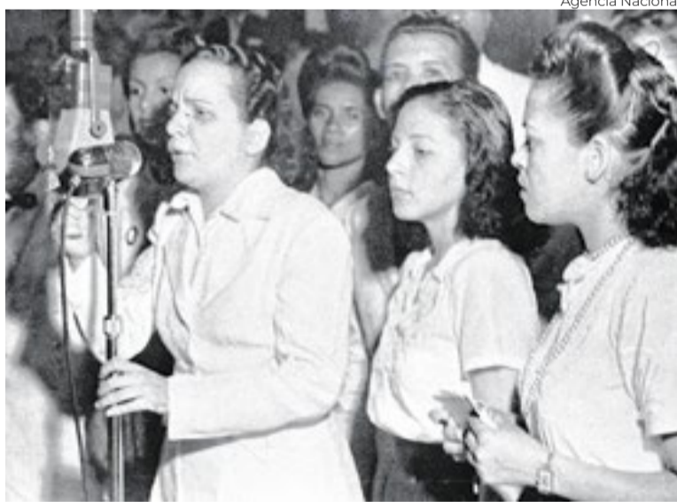
A cantora durante gravação do samba ‘Eu Não Sou Daqui’, de Wilson Batista e Ataulfo Alves, em 1941, em festival de uma rádio

O álbum que agora retorna foi capitaneado por Aloysio de Oliveira para seu lendário selo Elenco — o