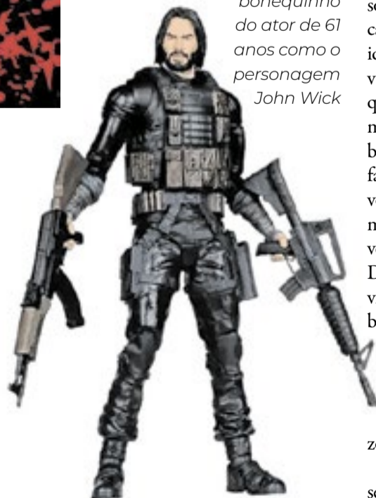
A porção bonequinho do ator de 61 anos como o personagem John Wick

pente, olhávamos uns para os outros a dizer: ‘Gente, é o Keanu Reeves, e ele está aqui conosco’. Keanu mudou a forma de se fazer muitas vertentes de gênero de Hollywood. O que se vê hoje na ação não existiria