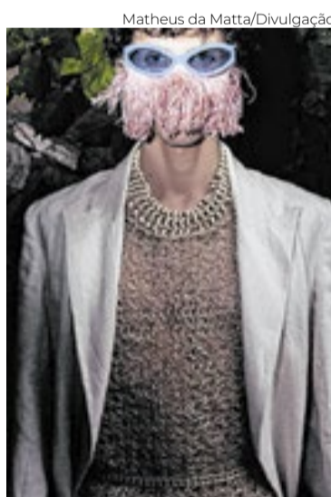
Look da Misci a ser exibido no evento

bem cuidados, saudáveis e belos", diz ele, "os gestos da capoeira, da embaixadinha, da menina sentada na areia, do mergulho no mar, dos coqueiros ao vento".