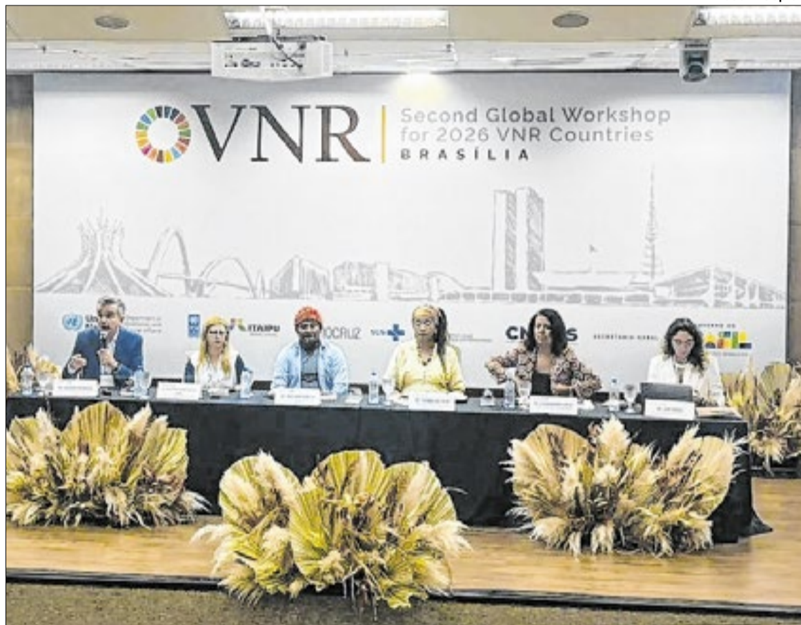
Piauí apresentará sua agenda para cumprimento das metas de desenvolvimento sustentável

resultados em áreas como educação, saúde, geração de emprego e energia, com avanços nos indicadores sociais e destaque na produção de energia a partir de fontes renováveis, especialmente nas cadeias de energia solar e eólica. Esses avanços refletem investimentos em infraestrutura, inovação tecnológica e qualificação profissional, fortalecendo a economia e ampliando oportunidades para a população.