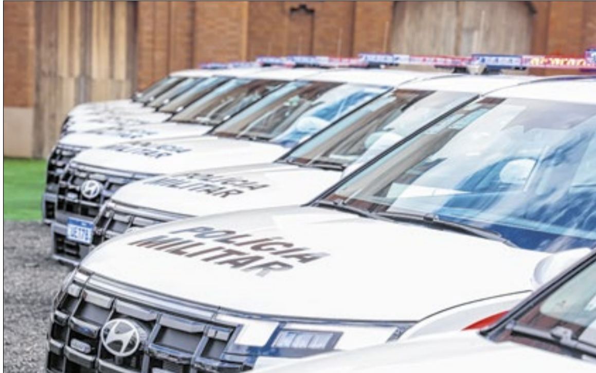
A Defesa Civil também anunciou R$ 11,7 mi, incluindo entrega de veículos para diversas cidades

A Defesa Civil estadual também anunciou R$ 11,7 milhões para ampliar a capacidade de resposta a eventos climáticos extremos, incluindo entrega de veículos e equipamentos a diversas cidades. Na área de saneamento, intervenções financiadas pelo Fehidro somam R$ 8,3 milhões,