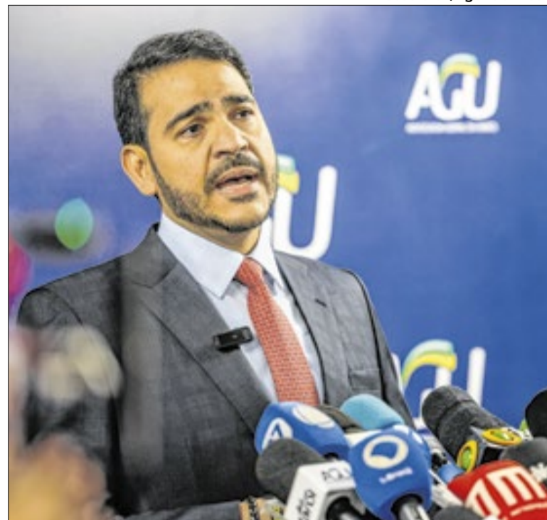
Apoio de Mendonça ajuda no caminho de Messias

Para os casos em que há vigência de direitos autorais, foram feitos contratos que estabelecem limites de empréstimo de acordo com as licenças digitais adquiridas de cada obra. Quando o número é atingido, o usuário é levado para uma fila de espera virtual. A biblioteca já conta com mais de 291 mil usuários.