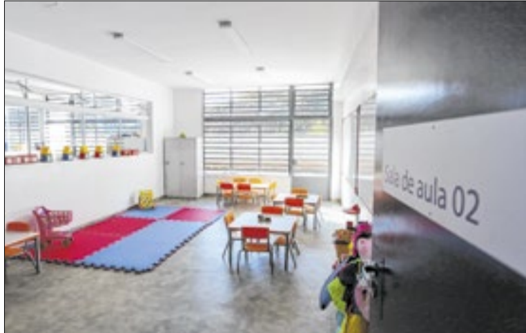
Unidade escolar atende até 130 crianças do município

Com mais de 813 metros quadrados de área construída, o CMEI conta com seis salas de atividades, berçários, fraldário, lactário, solário, além de pátios coberto e descoberto. A estrutura segue normas de segurança