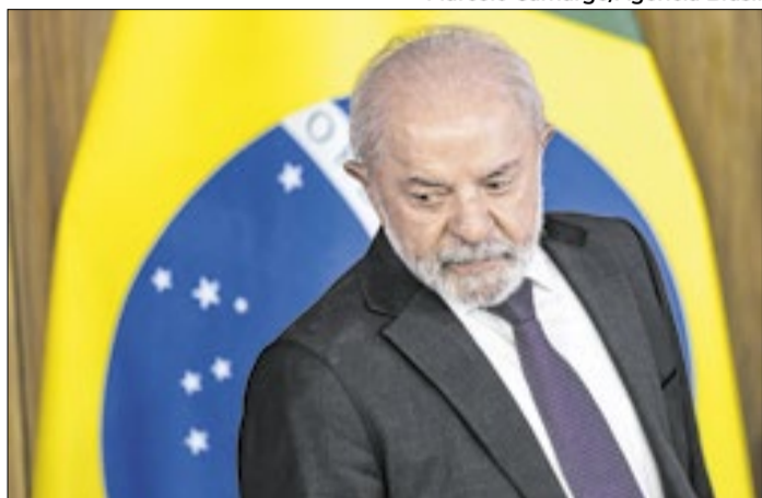
Petistas esperam reação do presidente em pesquisas