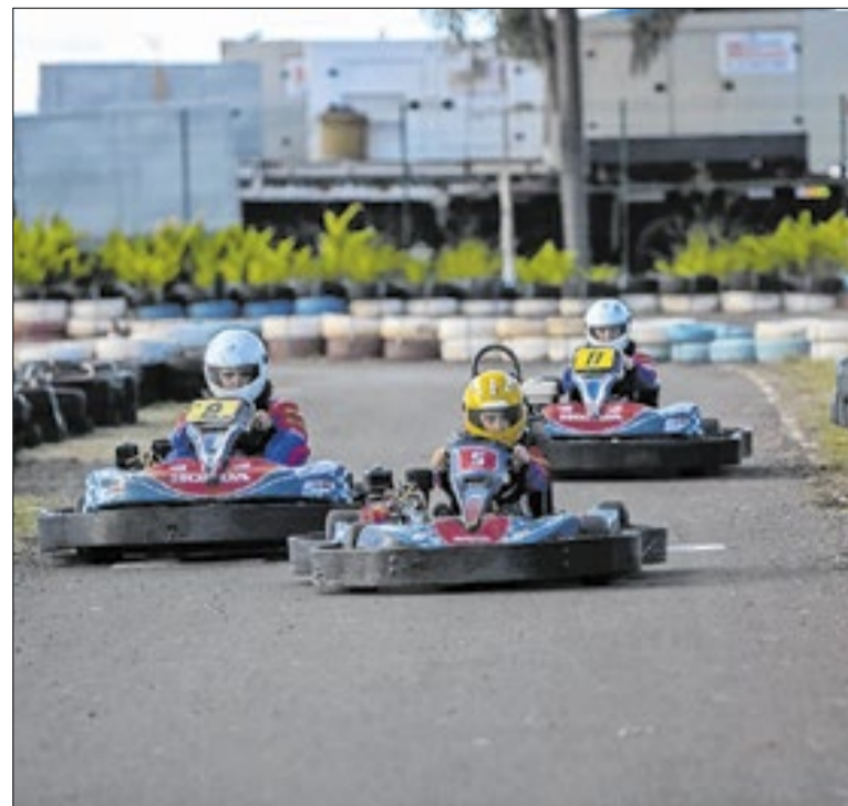
Próxima geração de pilotos pode começar em São Paulo

"Ainda não temos a marcha atlética nos programas de todos os estaduais. Acredito que teremos e isso vai estimular. É uma construção: inserimos a marcha atlética nos Jogos Escolares Brasileiros. Foi legal. Depois, nos Jogos da Juventude. Quis o destino que desse certo a realização desse Mundial", concluiu.