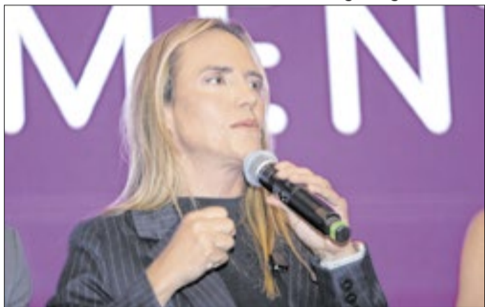
Celina: oposição ao que era seu próprio governo