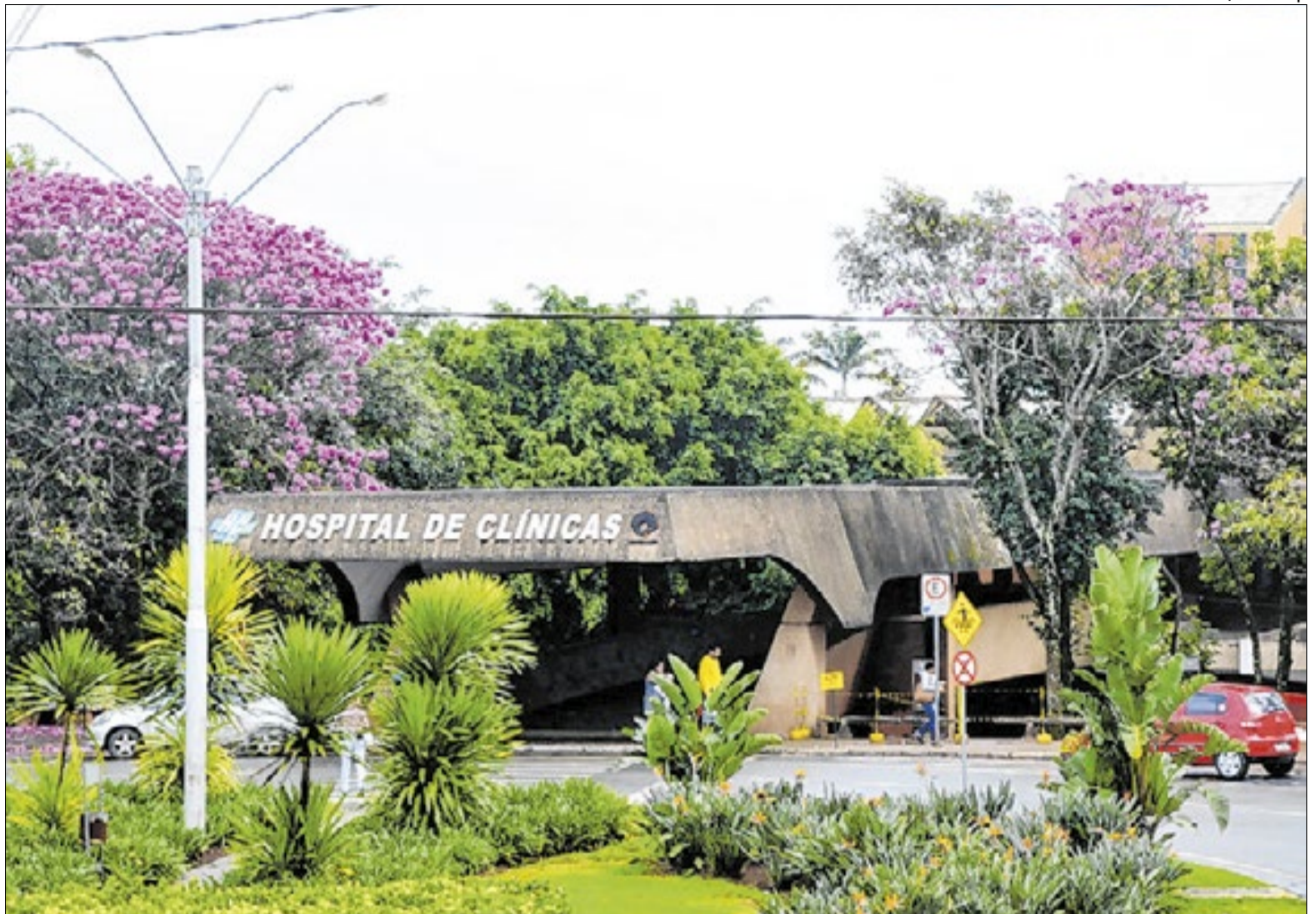
Entrada do HC-Unicamp, hospital que recentemente foi mencionado no ranking World's Best Hospitals 2026, da Newsweek

Um dos pilares dessa estruturação é a sua resposta a situações críticas graves. O HC assume um