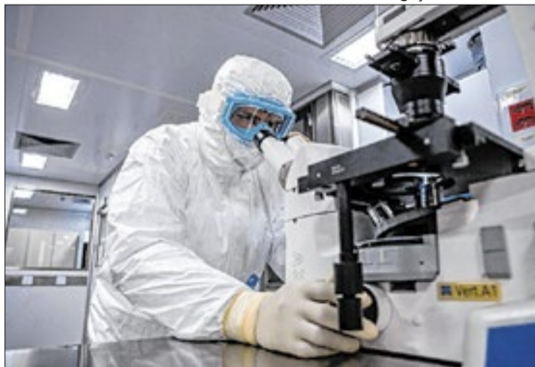
Parceria prevê que células sejam desenvolvidas no Nutera-SP

Além da redução de custos, a internalização da tecnologia representa um avanço estratégico para a autonomia científica e produtiva do país. Com a produção nacional, o Brasil reduz a dependência de terapias importadas e amplia a capacidade de resposta do sistema público diante de doenças complexas. A iniciativa também deve impulsionar a formação de profissionais especializados e o desenvolvimento de novas pesquisas na área de