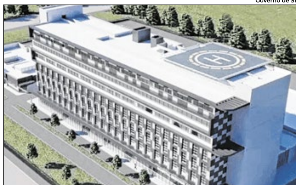
Governo de SP

A execução do empreendimento exige que a empresa vencedora apresente garantia contratual correspondente a 5% do valor inicial, mediante caução em dinheiro, ou fiança bancária, ou seguro-garantia, para assegurar o pagamento de multas e a reparação de prejuízos e o cumprimento de obrigações. O escopo contratual compreende a totalidade das fases construtivas entre a fundação e a entrega do edifício operacional. Direciona R$ 163 milhões para a estrutura hospitalar, R$ 67 milhões para instalações elétricas