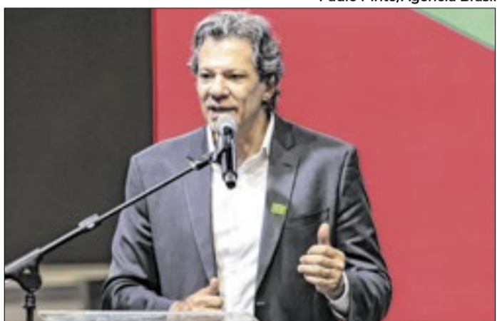
Fernando Haddad é a alternativa mais óbvia