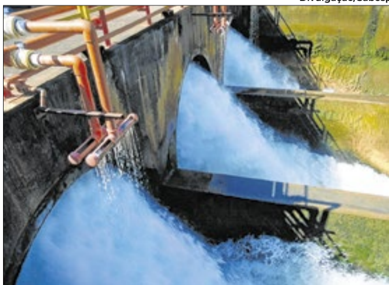
Unidades serão instaladas pela Região Metropolitana

Essa tecnologia foi adotada pela Sabesp, e seu funcionamento é imediato após a conclusão da instalação. Todo o processo de implantação do equipamento durou 8 horas e incluiu etapas como a abertura da vala, o posicionamento do equipamento entre outros.