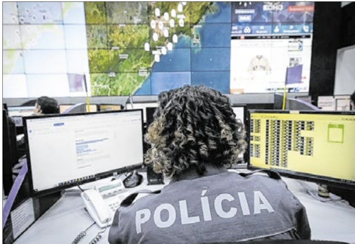
Integração de tecnologia, segurança e gestão municipal busca acelerar atendimento às vítimas

Outro ponto relevante é a ampliação do acesso das vítimas aos seus direitos. Ao permitir