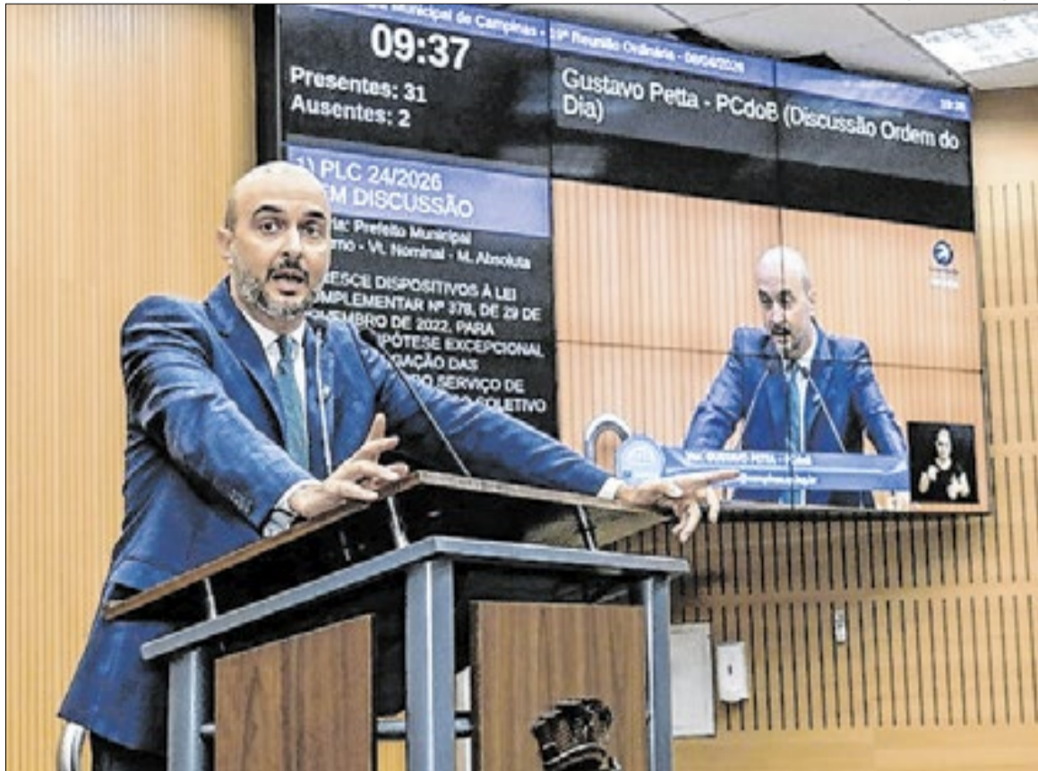
Câmara Municipal de Campinas

“O número de feminicídios no Brasil tem apresentado crescimento preocupante, com recordes recentes de registros desse tipo de crime, conforme dados divulgados pelo Ministério da Justiça e Segurança Pública. O Fórum Brasileiro de Segurança Pública alerta que o feminicídio é um crime evitável, o que impõe ao Estado o dever de atuar de forma efetiva na elaboração e implementação de políticas públicas voltadas à prevenção, proteção e acolhimento de mulheres em situação de violência”, afirma Petta.