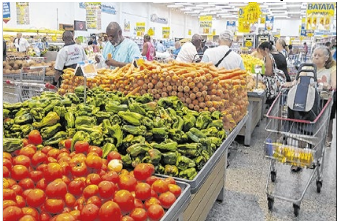
Principais aumentos foram da cenoura (+28,44%), abobrinha (+23,53%) e tomate (+20,27%)

O grupo Transportes também colaborou com a alta do IPCA, com 1,64%. Os combustíveis foram o principal fator de pressão, impactados pela Guerra no Oriente Médio entre EUA e Irã: a gasolina subiu 4,59%, o diesel avançou 6,72% e o etanol registrou alta de 3,12%. Esses aumentos impactam não apenas o consumo direto, mas também custos logísticos, com efeitos sobre outros preços da economia.