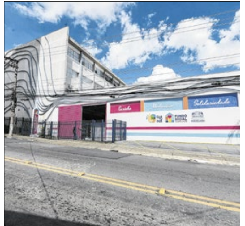
Sede conta com mais de 700 metros quadrados

Os moradores de Mauá podem participar da consulta pública do planejamento municipal pelo site da Prefeitura. A iniciativa reúne programas e ações do PPA, que definem metas e prioridades que a gestão possui para os próximos anos, incluindo áreas como saúde, educação, assistência social e turismo.