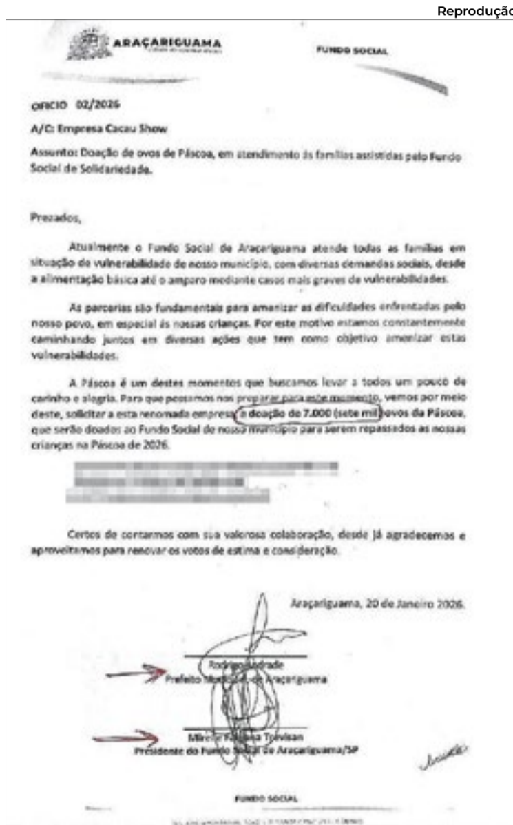
Em ofício assinado pelo prefeito e a primeira-dama, Fundo Social solicita ao Instituto Cacau Show ‘Doação de ovos de Páscoa, em atendimento às famílias assistidas pelo Fundo Social de Solidariedade’ de Araçariguama

sobre o destino final dos itens, mas lamentou eventual desvio de finalidade. “Não podemos nos manifestar sobre eventual desvio de finalidade na distribuição dos ovos de Páscoa, o que deve ser feito pelos órgãos de controle competentes. Podemos, entretanto, lamentar tal atitude se, de fato, ela ocorreu”, diz outro trecho da nota.