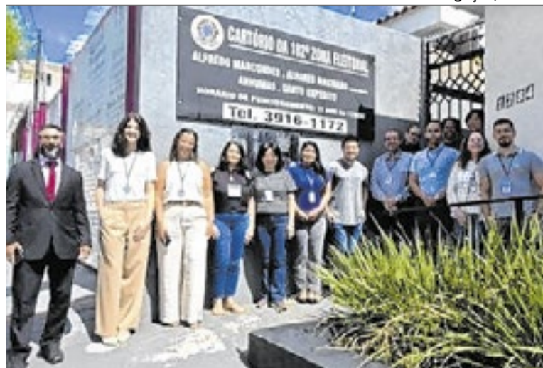
Até julho, a previsão é inspecionar 21 zonas eleitorais do estado

O cadastro eleitoral é encerrado 150 dias antes do pleito, conforme a legislação, para viabilizar a organização das eleições. As inspeções contam com equipes do Tribunal Regional Eleitoral de São Paulo (TRE-SP) e acompanhamento da Corregedoria. Neste ano, o cronograma foi reduzido e segue