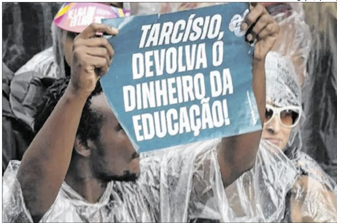
Paralisações aconteceram nos dias 9 e 10 de abril com críticas às políticas educacionais

A política de bônus, criada em 2008 durante a gestão de José