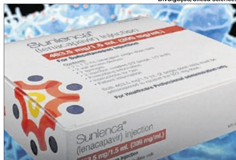
Lenacapavir: medicamento eficaz na prevenção do HIV

O caso do lenacapavir é singular. Sua entrada no Brasil ocorre em meio a uma preocupação sobre valores. Nos Estados Unidos, o medicamento tem preço tabelado em US$ 25,3 mil por pessoa ao ano (cerca de R$ 136 mil), podendo chegar a US$ 44,8 mil (R$ 241 mil) em algumas si-