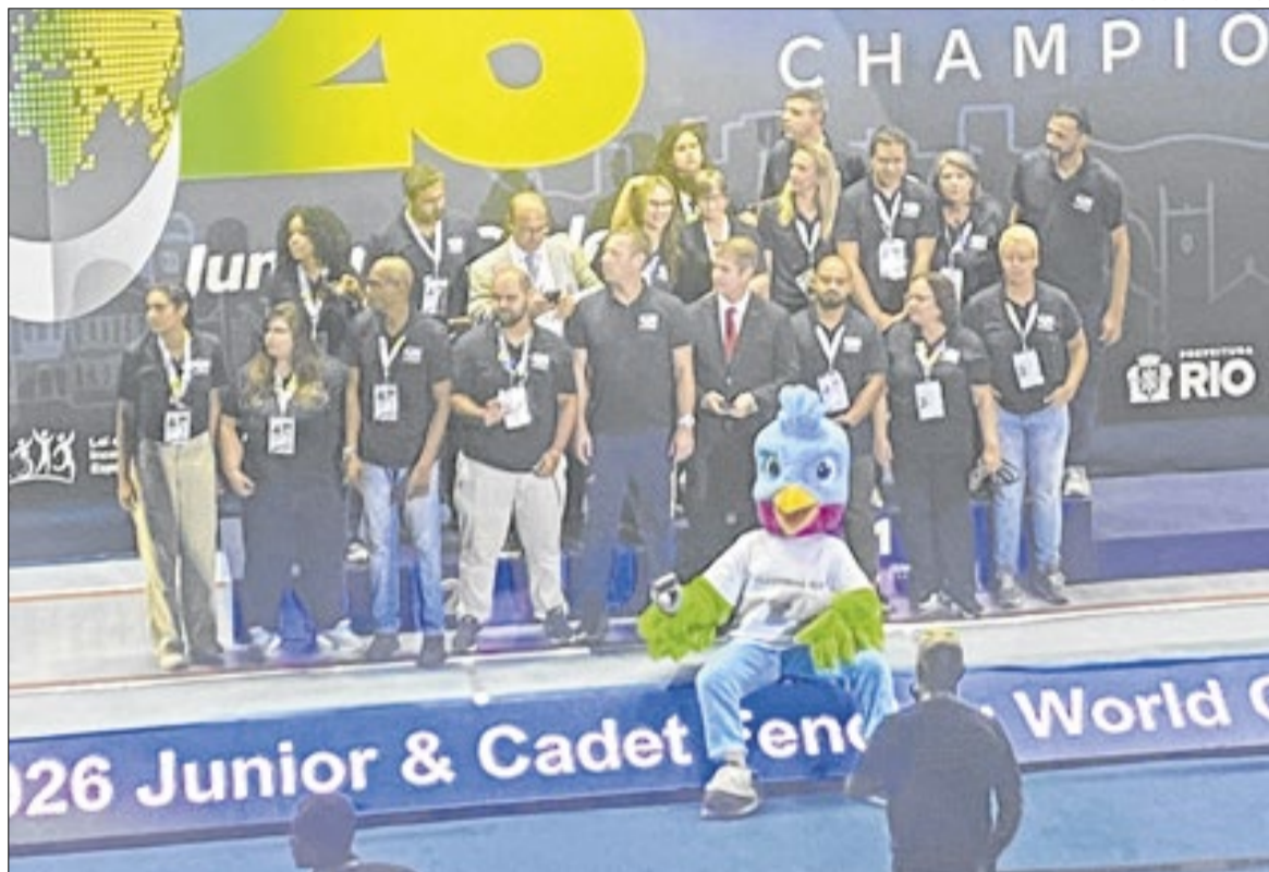
Equipe da confederação celebrou a organização do mundial

Mesmo com o incêndio na cobertura do Velódromo, a compe-