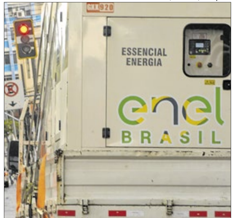
Distribuidora ressaltou que ampliou os aportes financeiros

Essas áreas são da zona norte da capital, com mais de 50 anos de atuação ligada ao esporte, cultura e convivência comunitária. O debate pretende ouvir moradores e frequentadores sobre possíveis consequências da desapropriação. A reunião será aberta ao público e acontecerá na Rua Marambaia, 802.