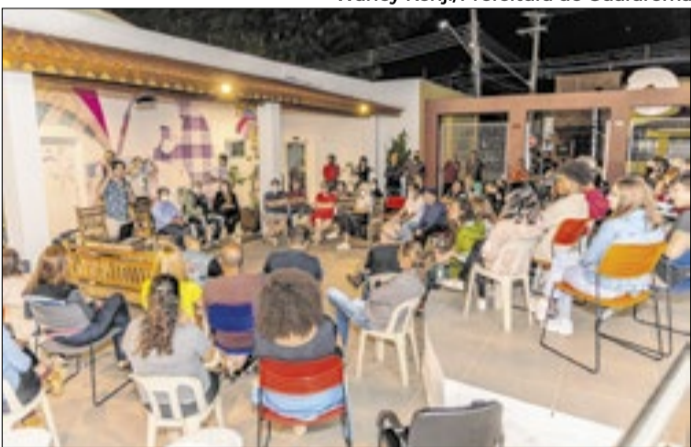
Projeto busca agentes culturais e a população em geral