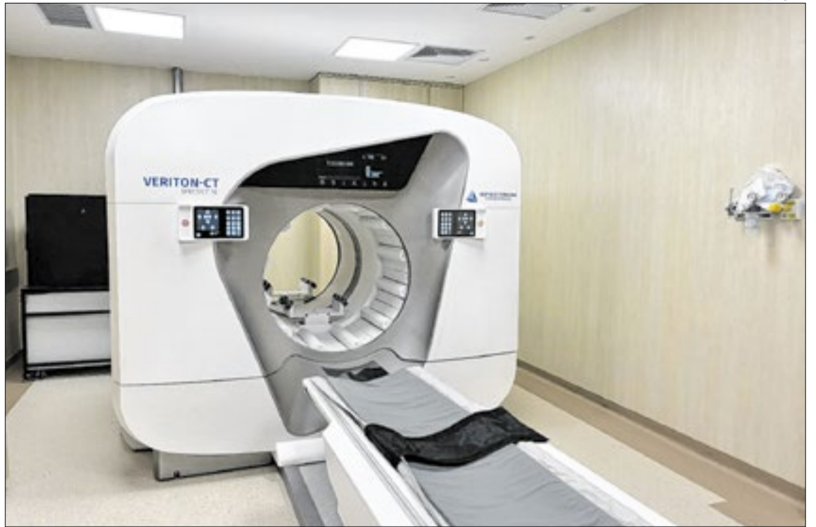
Área de Medicina Nuclear do HC da Unicamp com equipamento inédito na América Latina

Equipamento com IA está disponível em hospital público pela primeira vez no país