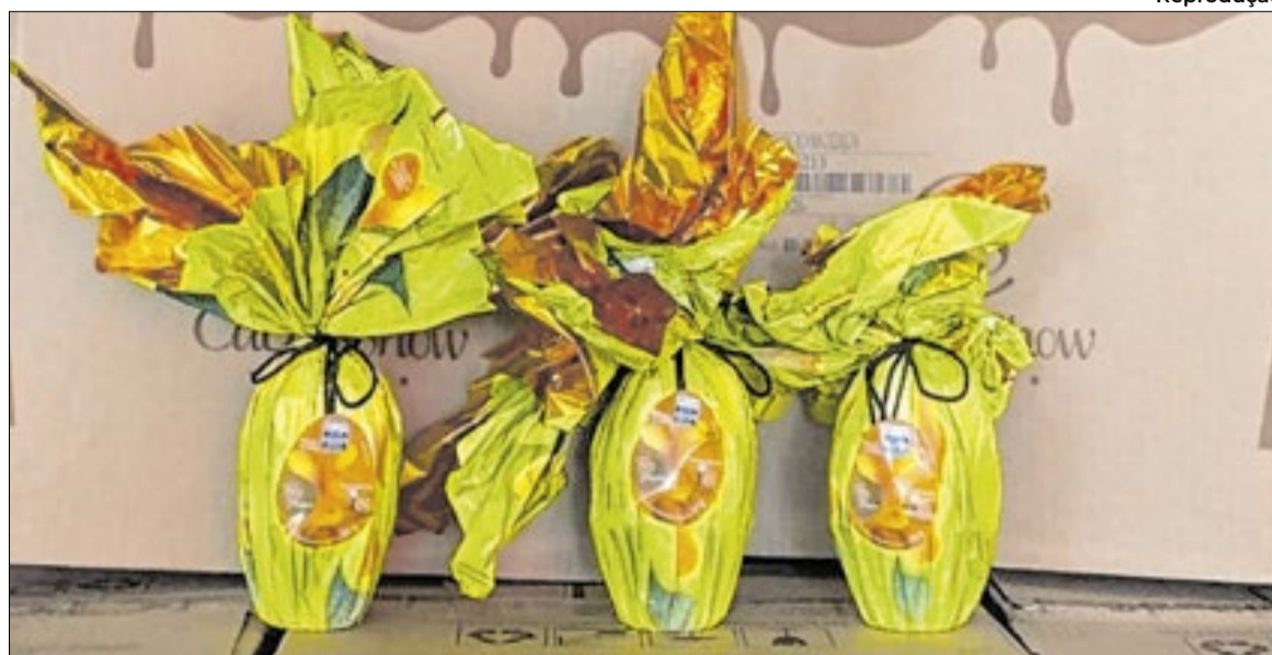
Nem todos os produtos doados pelo Instituto Cacau Show para o município ficaram por lá

O Instituto também ressaltou que não tem como se manifestar