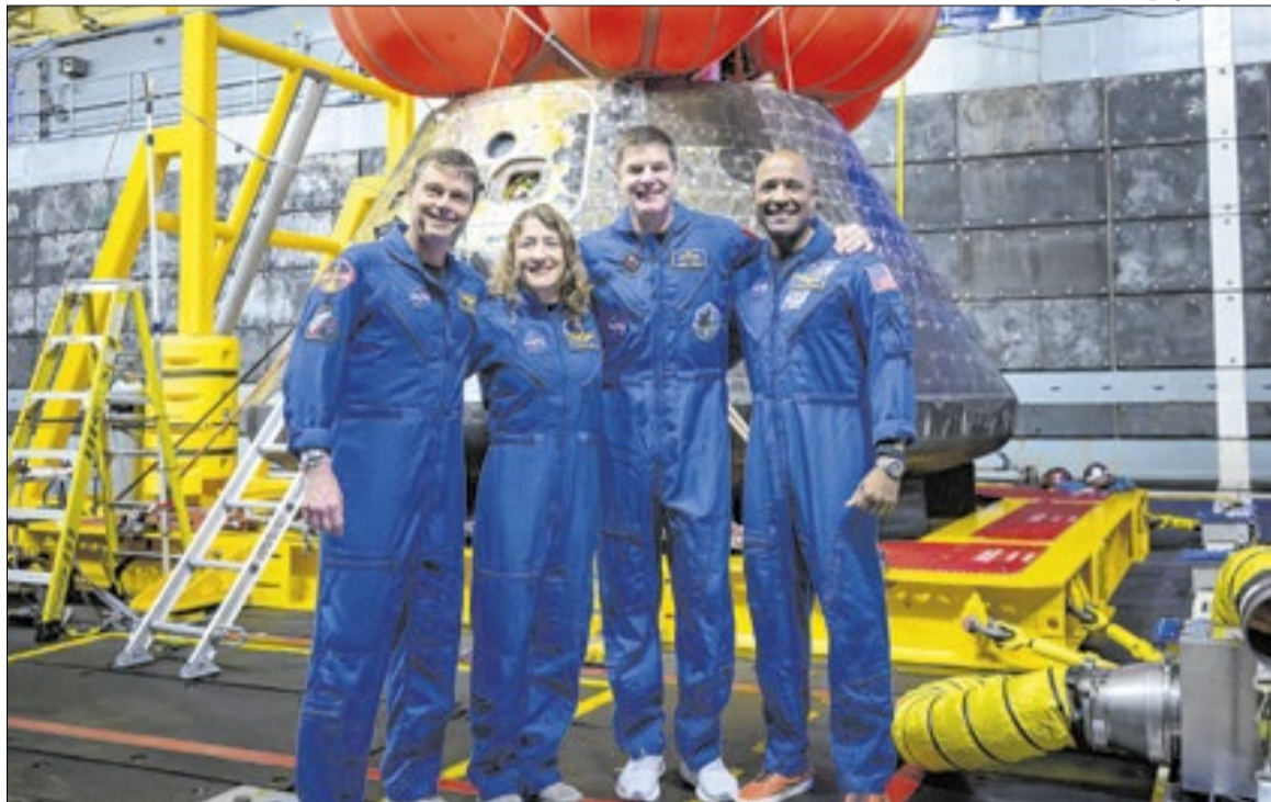
Astronautas voltaram para a Terra em segurança, após contorno à lua

O que em um filme ou uma postagem em rede social poderia ser uma inserção publicitária, na