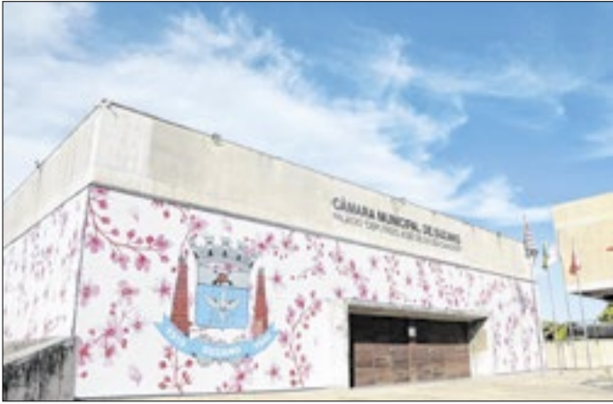
Lei protege crianças e adolescentes de práticas adultas