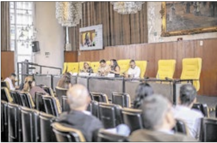
Agendamento foi um pedido de Rubinho Nunes (UNIÃO)