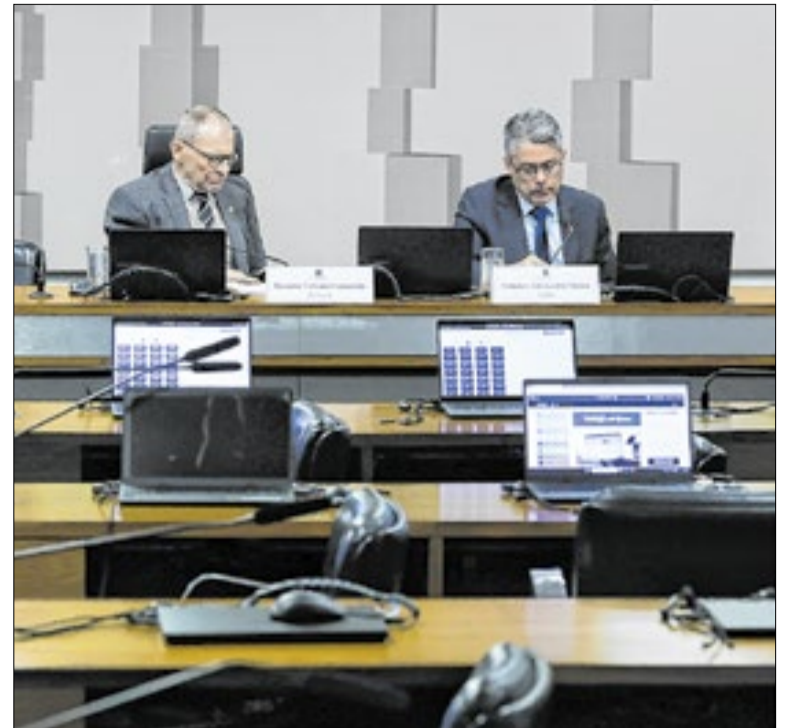
Alessandro Vieira deve apresentar seu relatório na terça

“Eu tenho voto à esquerda e à direita. Talvez fechar alianças, em vez de ampliar, me limite”, raciocina Arruda. Para ele, o jogo no DF vai passar pelo maior escândalo financeiro da história. “a coisa mais grave que já aconteceu no sistema bancário nacional”.om suas consequências. E Arruda está no jogo.