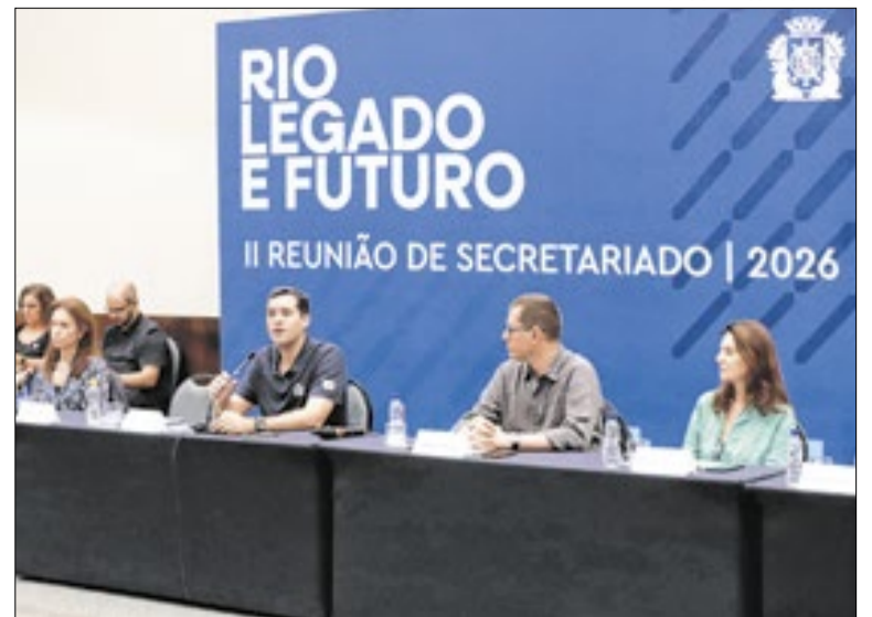
Reunião é a segunda de 2026

As atividades incluem oficinas de cultura, esporte e sustentabilidade, além de pesquisas locais. Moradores do Alemão, Maré e Rocinha podem se inscrever pelo site da Prefeitura. A seleção envolve entrevista presencial nos polos. O objetivo é transformar a realidade das favelas do Rio.