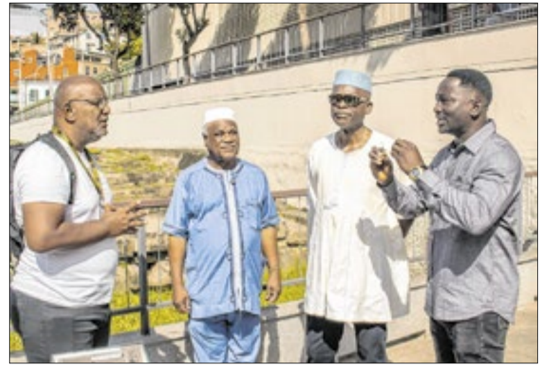
Encontro teve visita ao Cais do Valongo

Além de troféus e medalhas, os vencedores ganham a oportunidade de representar o Rio de Janeiro no Jebs, organizado pela Confederação Brasileira do Desporto Escolar, e nos Jogos da Juventude, organizado pelo Comitê Olímpico Brasileiro. O projeto não tem custo para as escolas e os alunos recebem um kit participante cedido pela secretaria, que também presta apoio logístico.