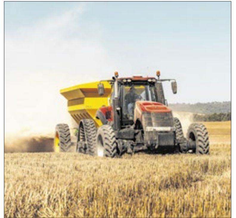
Impactos econômicos e climáticos pressionam produtores