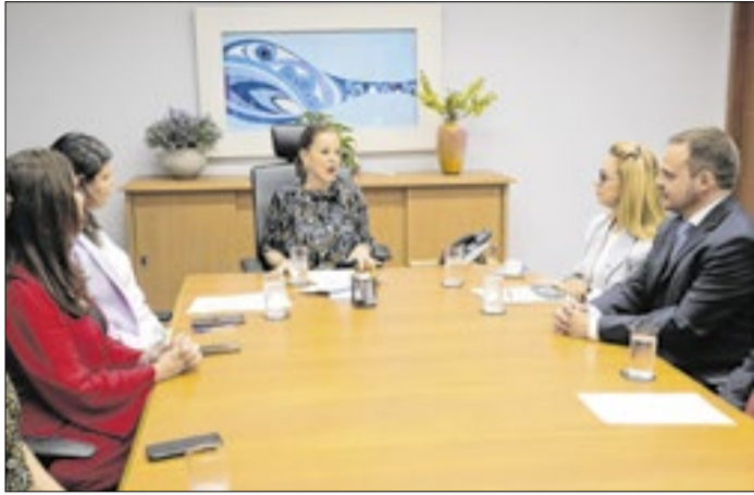
Reunião das equipes da Justiça e da Saúde fluminense