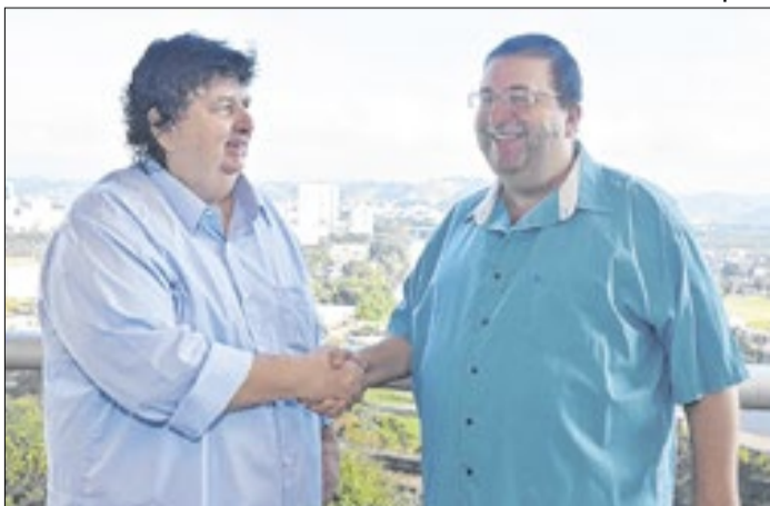
Prefeito de Volta Redonda, Neto, e seu irmão Munir Neto