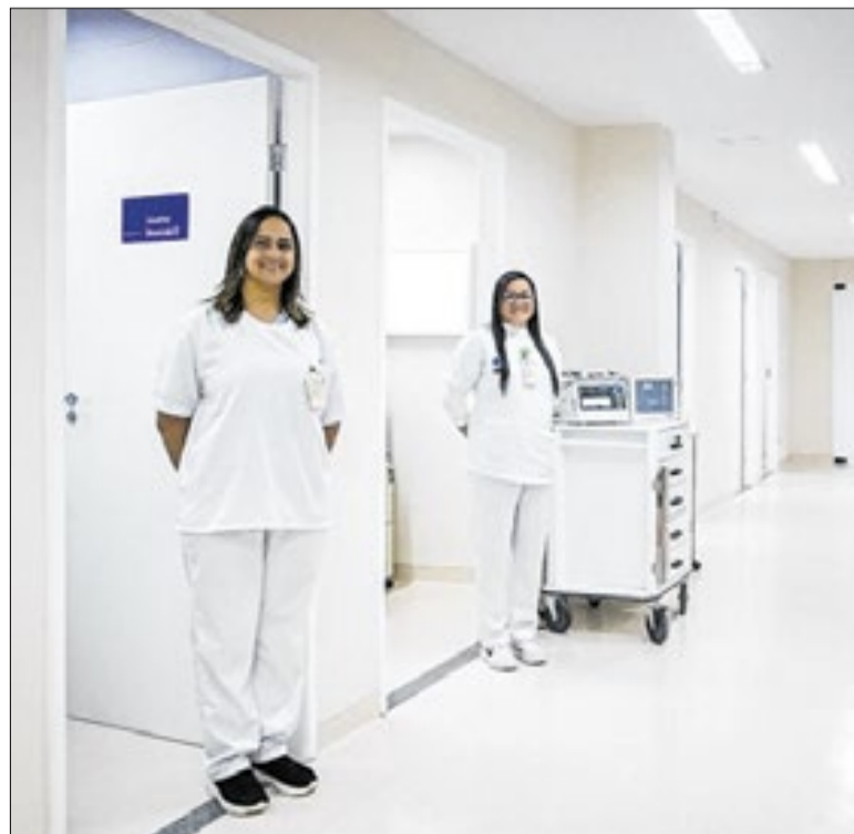
Qualificação deve envolver mais de 11 mil profissionais

O Ministério da Saúde iniciou a segunda fase das oficinas de qualificação para a inserção do implante contraceptivo subdérmico de etonogestrel no SUS, conhecido como Implanon. A previsão é qualificar mais 11 mil profissionais, entre médicos e enfermeiros, para ampliar a oferta do método na rede pública. Serão mais 32 treinamentos em todo o país, com foco em municípios com menos de 50 mil habitantes.