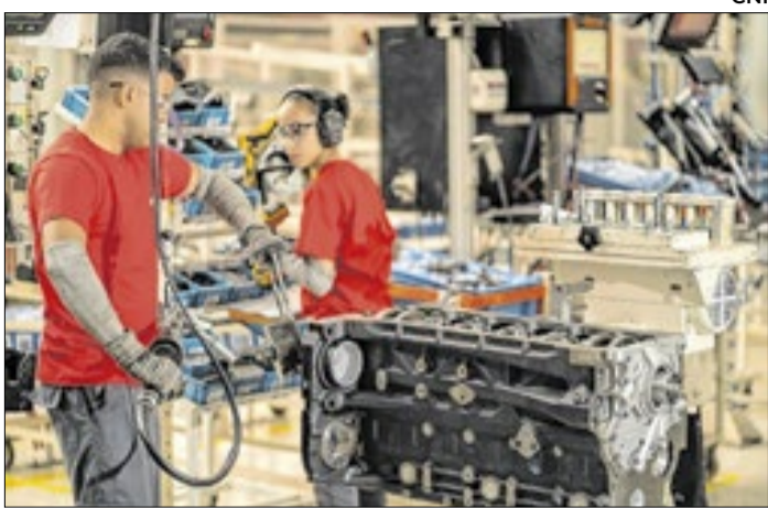
CNI Maiores avanços da indústria foram no ES(11,6%) e RS(6,7%)