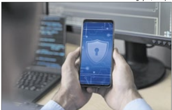
Tecnologias mantém operações ativas mesmo sob ataque.