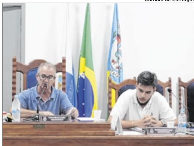
Câmara de Cantagalo