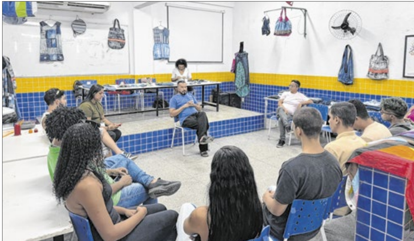
Participantes tiveram formação, criatividade e fortalecimento da diversidade

cola de Divines, com apoio da Coordenadoria LGBTIQA+ e da Secretaria Municipal de Direitos Humanos, Pessoa com Deficiência, Mulher e Cidadania, reforçando o compromisso com políticas públicas inclusivas e de fortalecimento social.