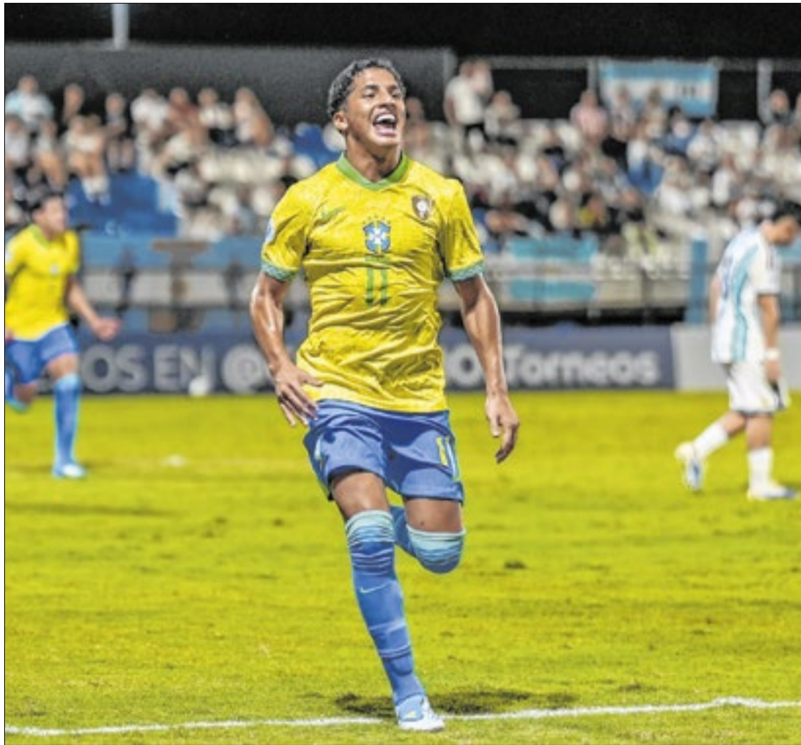
A felicidade estampada no rosto do atacante Riquelme, após marcar dois gols sobre a Argentina