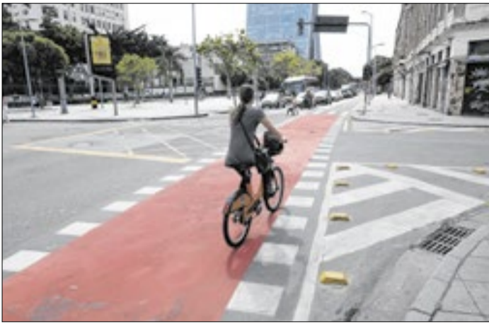
Rota cicloviária no Centro do Rio