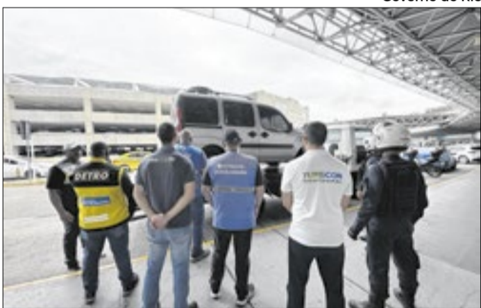
Equipes na fiscalização e autuação de veículos