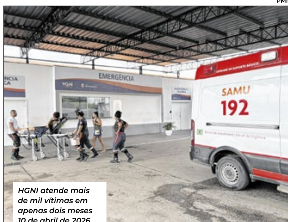
HGNI atende mais de mil vítimas em apenas dois meses 10 de abril de 2026

“Estamos falando de um volume muito alto de vítimas em um intervalo muito curto de tempo. Acidentes de moto