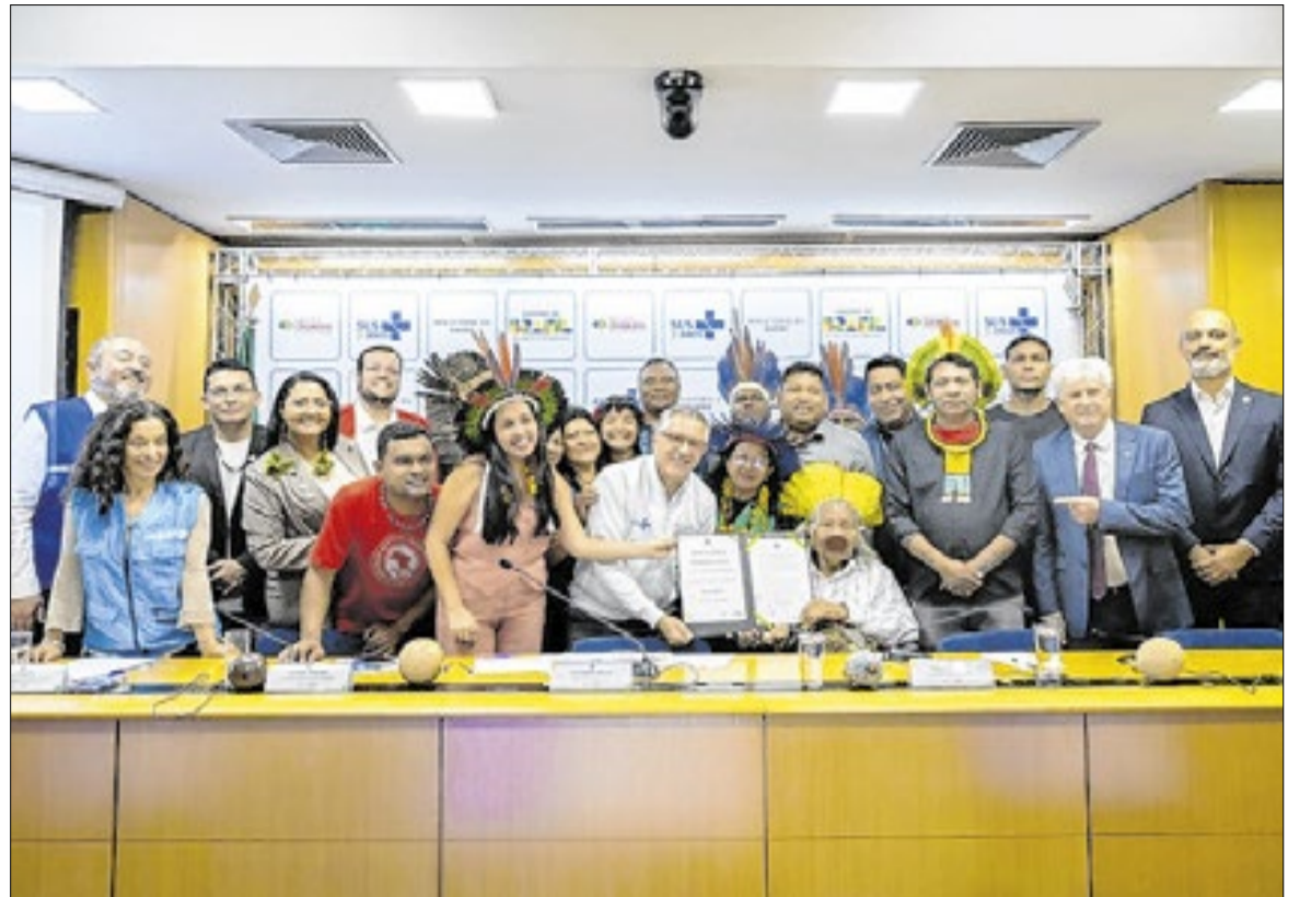
Encontro do ministro da Saúde, Alexandre Padilha, com lideranças indígenas

Além dos mutirões, o programa também conta com as Carretas de Saúde, que ampliam o acesso a