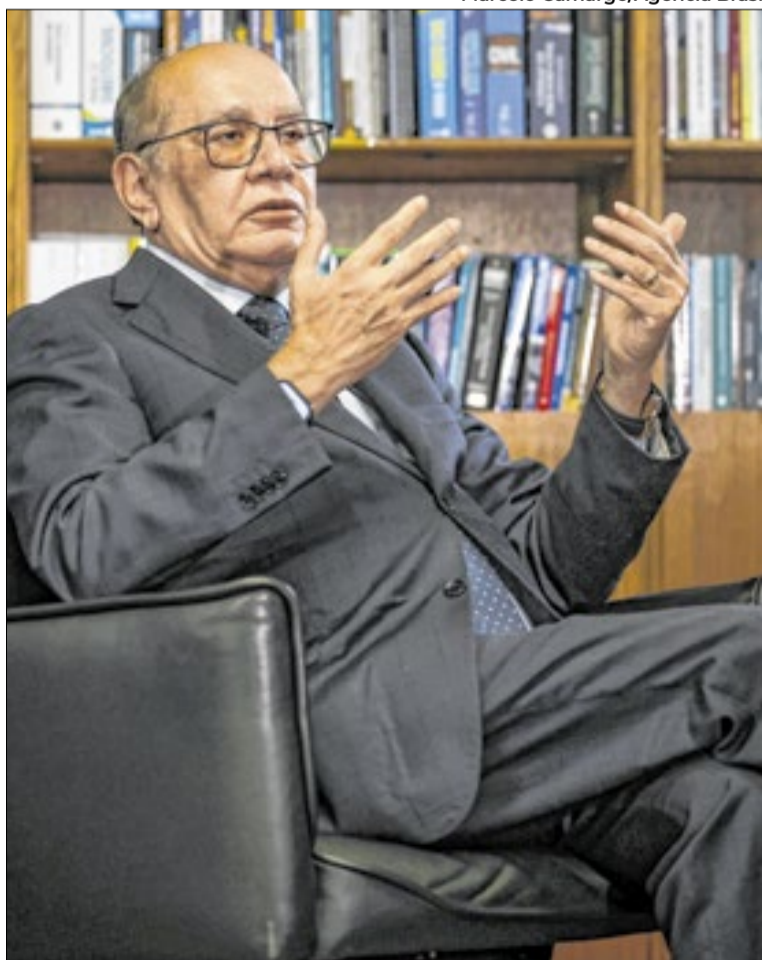
Sem comprovar, Gilmar disse que deputados recebem propina

Foi uma acusação grave feita durante uma sessão da Suprema