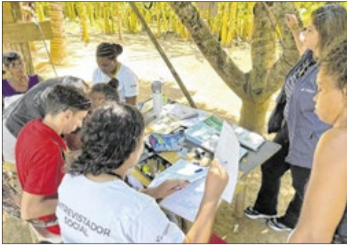
Ação atendeu agricultores familiares