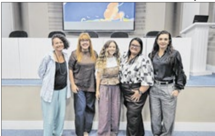
Treinamento da equipe da Atenção Primária à Saúde