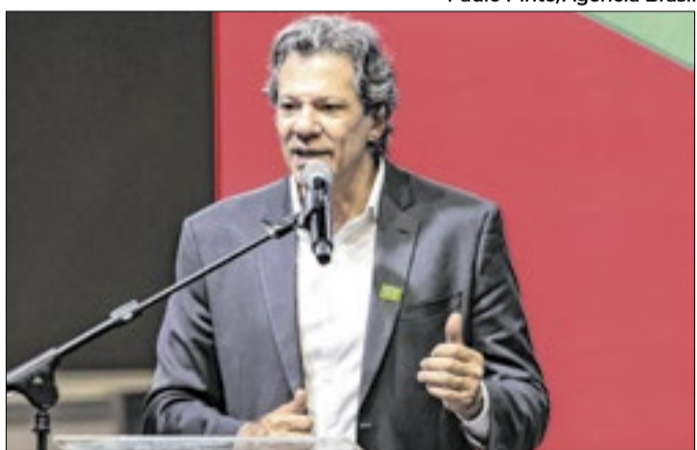
Fernando Haddad é a alternativa mais óbvia