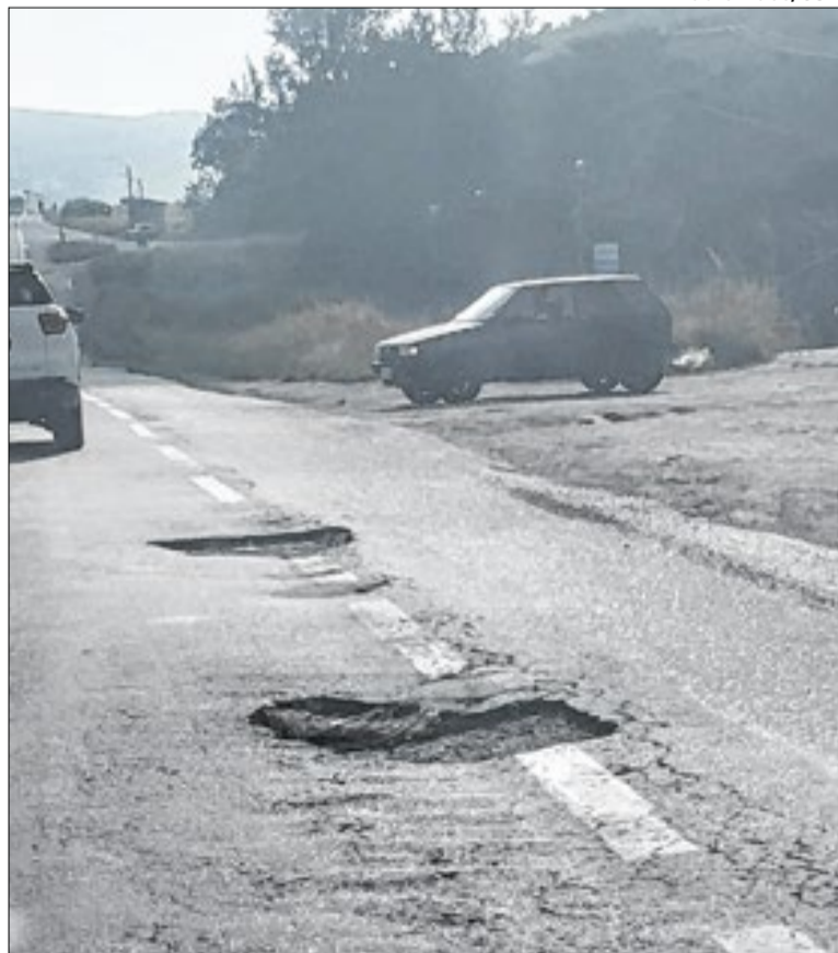
Trecho carece de manutenção e registra acidentes semanais

Nesta semana, a prefeita também estará em Brasília para participar de uma audiência pública sobre a BR-393.