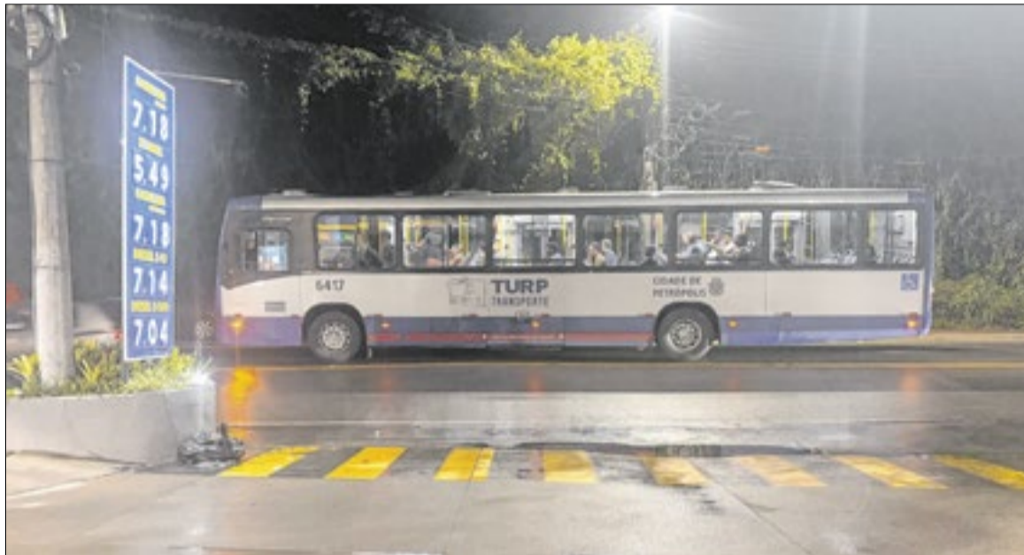
Reestruturação completa do sistema de transporte público está prevista apenas para 2032

A falta de controle sobre o licenciamento ocorre em meio a outros problemas no sistema. Dados obtidos via LAI mostram que cerca de 32% da frota de ônibus em Petrópolis tem mais de 12 anos de uso, acima do limite reco-