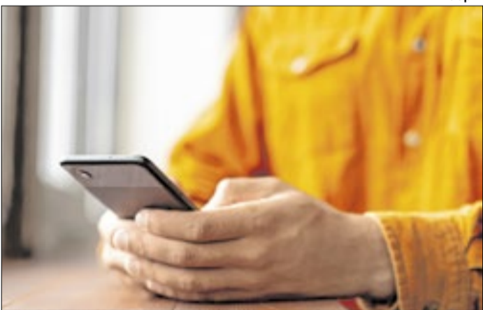
Atendimento sana principais dúvidas dos eleitores