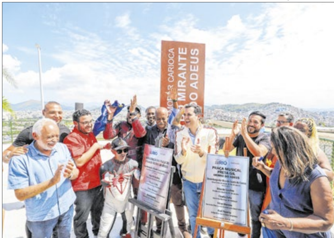
Cavaliere inaugura a praça com secretários e moradores

“Esse projeto representa a inclusão. Conseguimos fazer com que essas pessoas, realmente, tivessem voz, vez e a oportunidade de estar sendo beneficiadas com uma iniciativa grandiosa. É importante a prefeitura, o poder público, atuar aonde o povo precisa, que são nos becos e vielas e, principalmente, em locais que a gen-