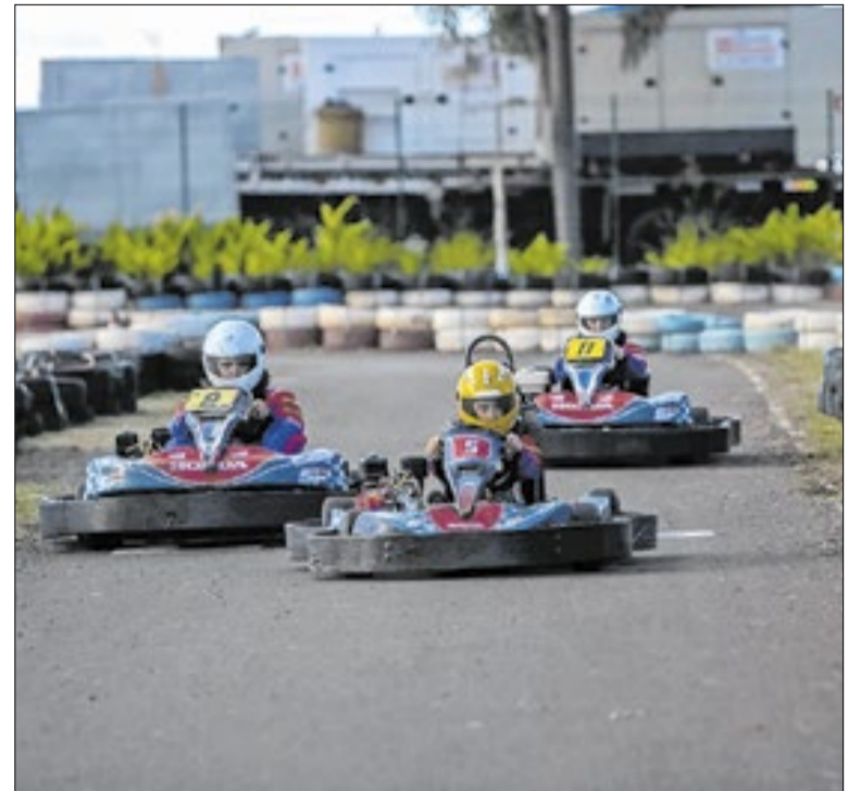
Próxima geração de pilotos pode começar em São Paulo

“Ainda não temos a marcha atlética nos programas de todos os estaduais. Acredito que teremos e isso vai estimular. É uma construção: inserimos a marcha atlética nos Jogos Escolares Brasileiros. Foi legal. Depois, nos Jogos da Juventude. Quis o destino que desse certo a realização desse Mundial”, concluiu.