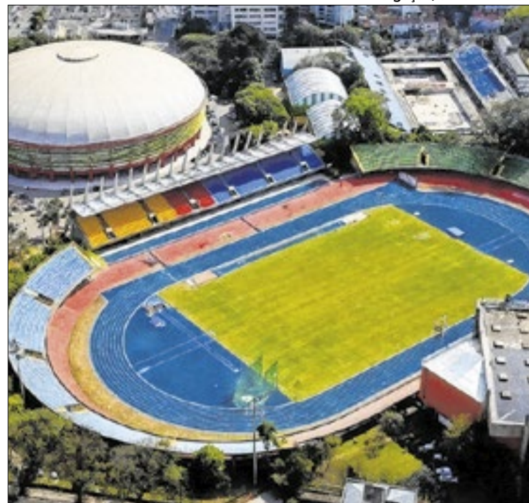
Projeto permanece aberto a contribuições até o dia 24 de abril

A Comissão de Infraestrutura da Alesp aprovou Adriano Arrepia de Queiroz para diretor da SP-Águas até 2031. Indicado pelo governo, ele foi sabatinado e teve aval unânime. O projeto segue ao plenário. Engenheiro tem mais de 20 anos de experiência e atuou na Cetesb e no Ibama. Mandato depende de votação final dos deputados.