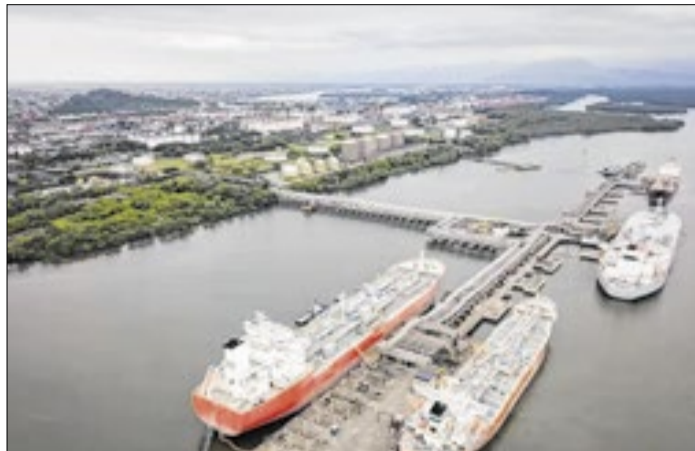
Embarcação trouxe o combustível de terminal na Bahia