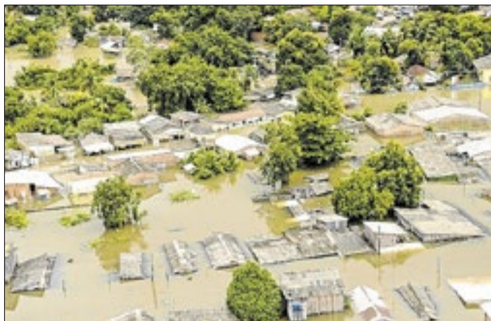
Reunião alinhou ações de prevenção com chuvas