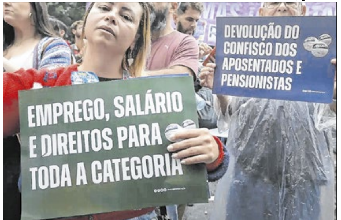
Eles pedem melhores condições de trabalho nas escolas, incluindo redução da sobrecarga

Parte dessas discussões também tem repercussão na Assembleia Legislativa de São Paulo (Alesp), onde parlamentares acompanham as demandas da categoria e cobram posicionamentos do Executivo. Projetos e