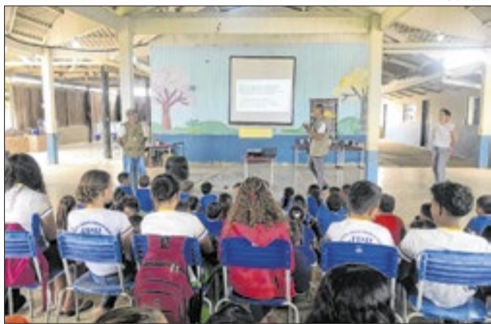
Ações visam conscientizar a população