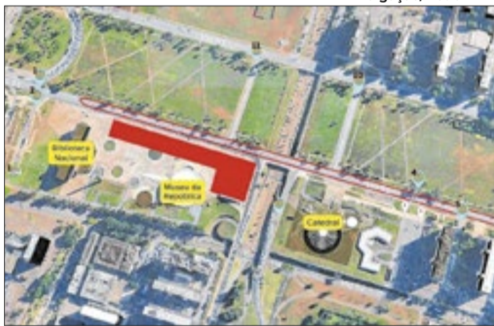
Mundial de Marcha Atlética acontecerá no fim de semana