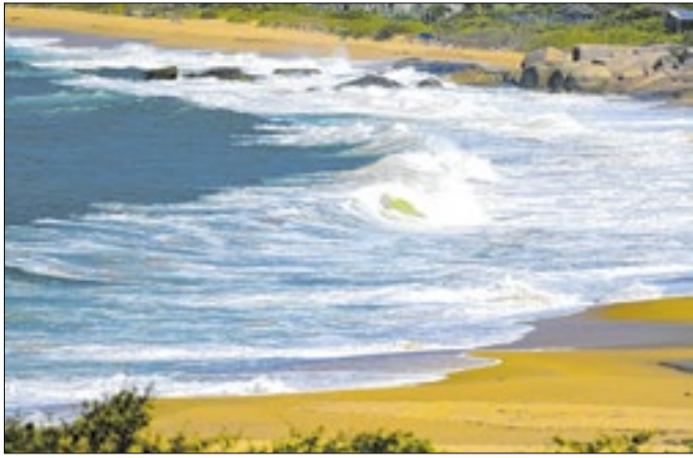
Frente fria se afasta e ciclone altera o tempo