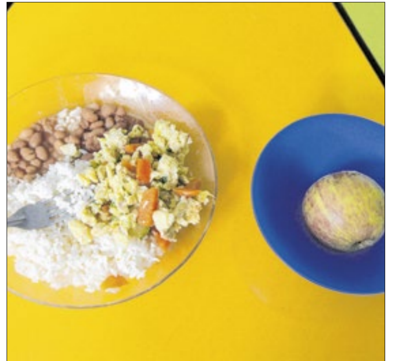
Produtos higienizados, processados e embalados na merenda

As poltronas possuem um design ergonômico, reduzindo tensões musculares e facilitando o posicionamento do bebê, além disso, o equipamento conta com laterais elevadas para criar um espaço mais reservado e aconchegante. A proposta é garantir mais segurança e tranquilidade durante a amamentação.