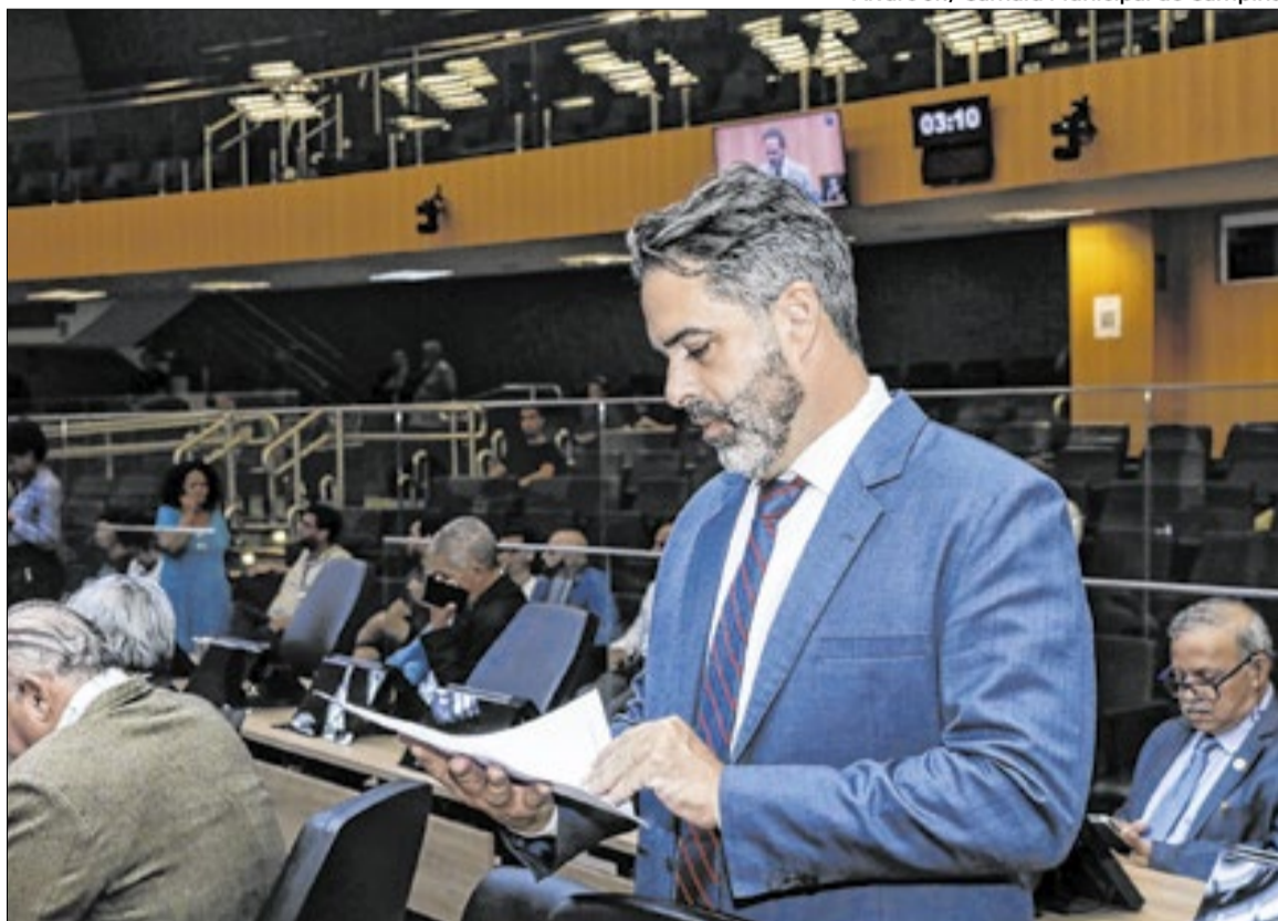
Segundo autor da proposta, projeto pretende assegurar segurança das mulheres de forma efetiva

O projeto admite, em situações graves e excepcionais, o apoio para obtenção de armas de