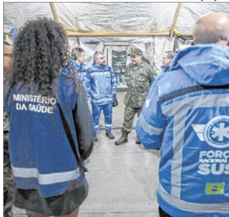
Áreas indígenas concentram a maior parte dos casos

O Tribunal de Justiça de Mato Grosso do Sul (TJMS) registrou cerca de 11,4 mil processos distribuídos em março de 2026 e mais de 11,3 mil julgados no mesmo período. Foram 8,5 mil casos novos e 2,9 mil recursos internos. Ao todo, 5,4 mil ações estão paudadas e aguardam análise em sessões presenciais e virtuais.