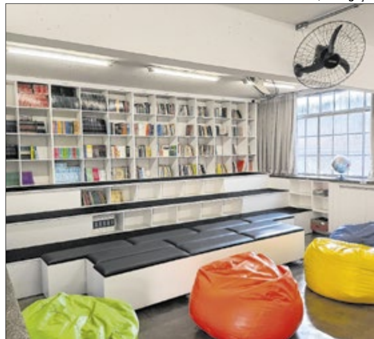
Biblioteca da Escola Estadual Doutor Tancredo de Almeida Neves