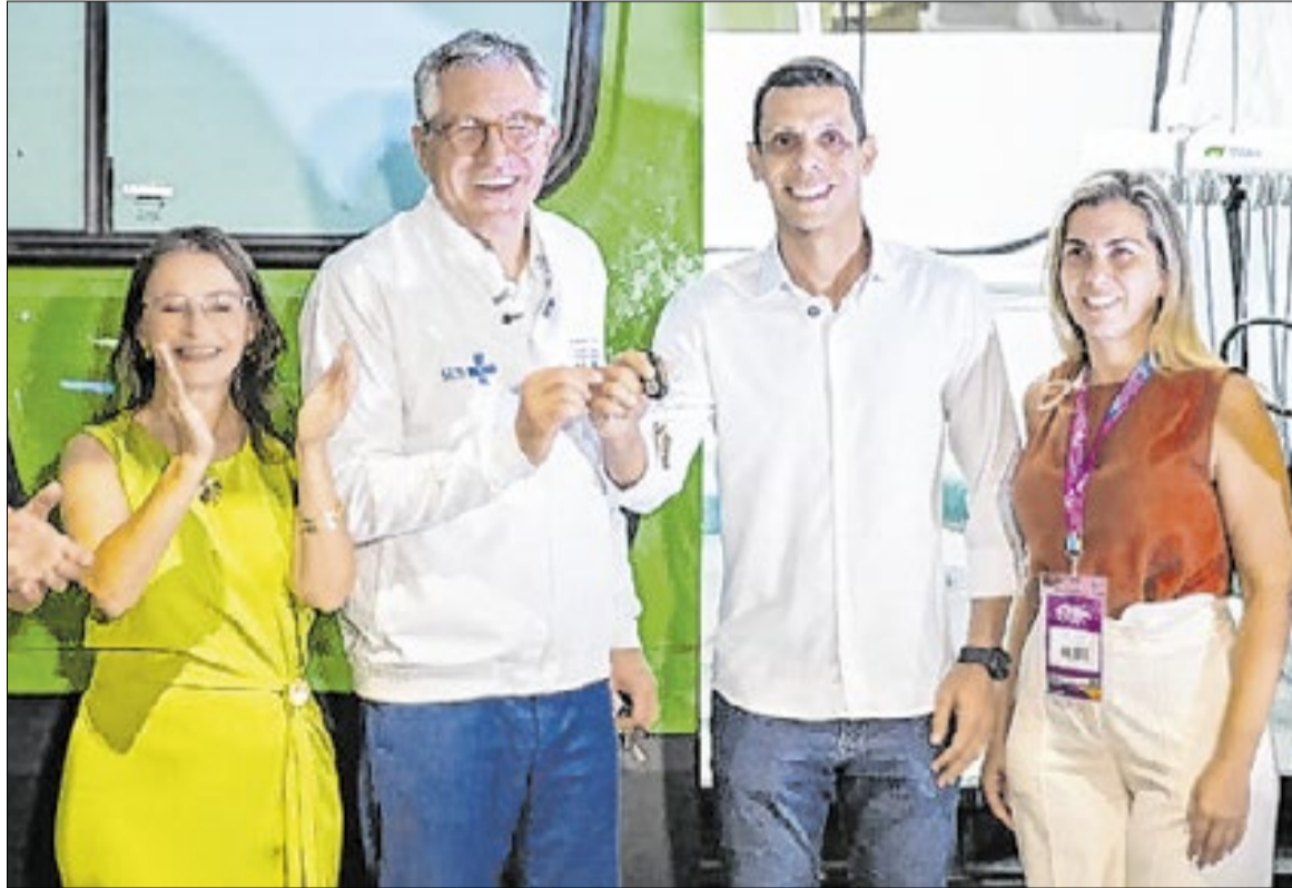
O congresso reúne secretários municipais de saúde, gestores e representantes do setor

O congresso reúne secretários municipais de saúde, gestores e representantes do setor e conta, ainda, com a 22ª Mostra de Experiências Exitosas dos Municípios e o 15º Prêmio David Capistrano.