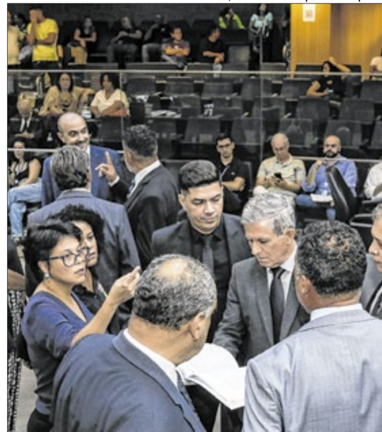
Projeto já foi aprovado em 1ª votação pela Câmara Municipal

O Imposto sobre Bens e Serviços surge como o novo pilar da tributação sobre o consumo no Brasil, integrando a reforma tributária aprovada para simplificar o sistema nacional. Substitui o ISSQN municipal e o ICMS estadual. Para as prefeituras, a mudança altera drasticamente a gestão arrecadatória. Atualmente, os municípios detêm autonomia total sobre o ISSQN, mas, com o IBS, a arrecadação passa a ser coordenada por um Conselho Federativo. O impacto principal reside na redistribuição de receitas: cidades que são polos de serviços podem enfrentar perdas imediatas, enquanto municípios com alto consumo ganham fôlego financeiro.