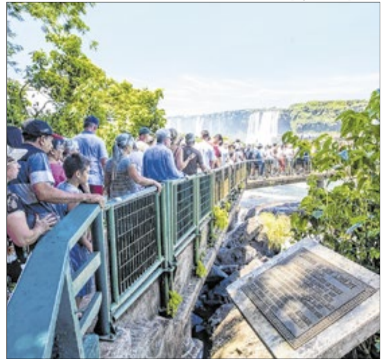
Aeroporto Afonso Pena registrou 11% a mais de viagens

A Rede de Proteção Animal de Curitiba (PR) realiza no sábado (11), das 10h às 16h, a 6ª edição do Amigo Bicho 2026 no Parque Barigui, em frente ao estacionamento do Complexo Imap. Serão disponibilizados 40 cães para adoção, vindos do Centro de Referência de Animais em Risco e de protetores independentes.