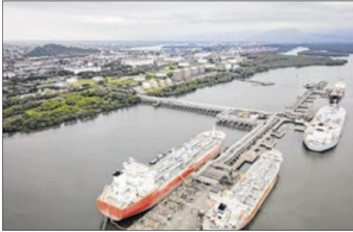
Embarcação trouxe o combustível de terminal na Bahia