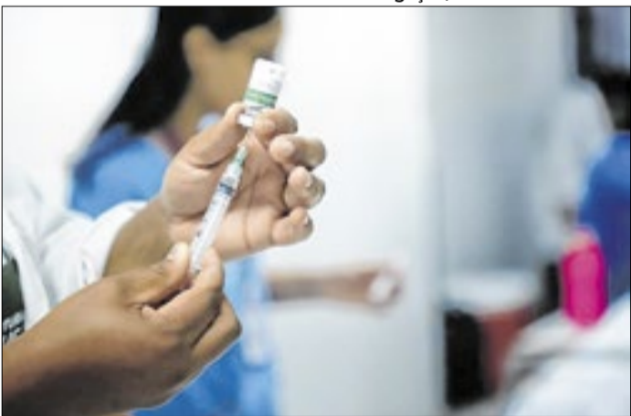
Ação acontece em diversas escolas da cidade