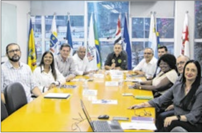
Representantes dos municípios durante a reunião