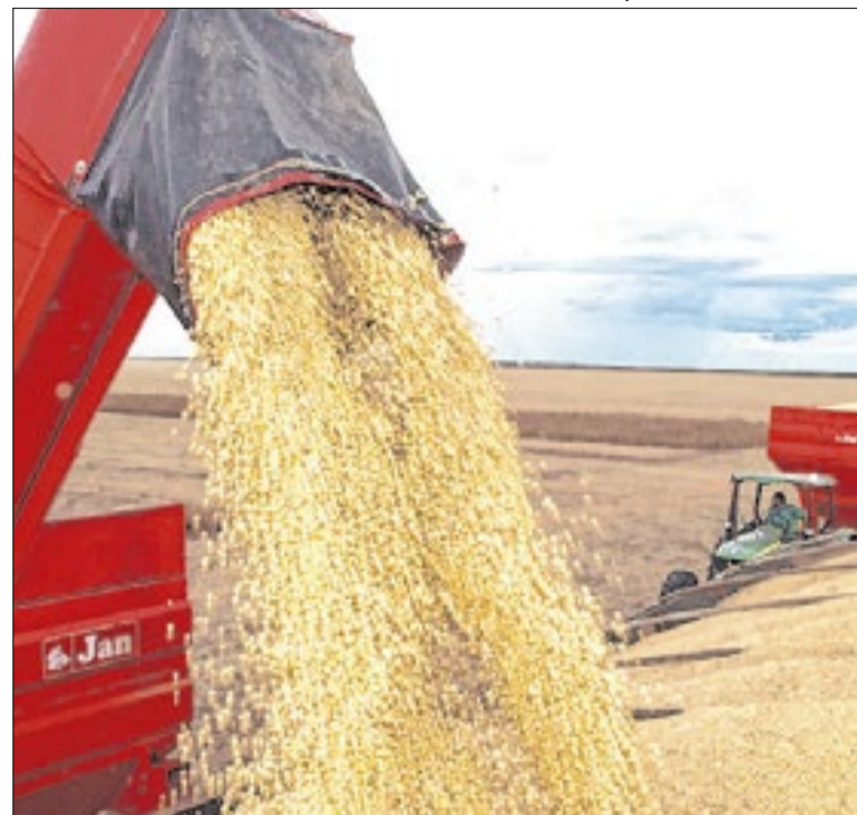
Soja é o carro-chefe da produção agrícola do estado

Para enfrentar o desafio rápido em caso de acidentes, o município de Porto Velho (RO) passará a contar com motolâncias, que são motos equipadas especialmente para atendimentos de emergência. Com maior mobilidade, elas conseguem chegar mais rápido ao local da ocorrência.