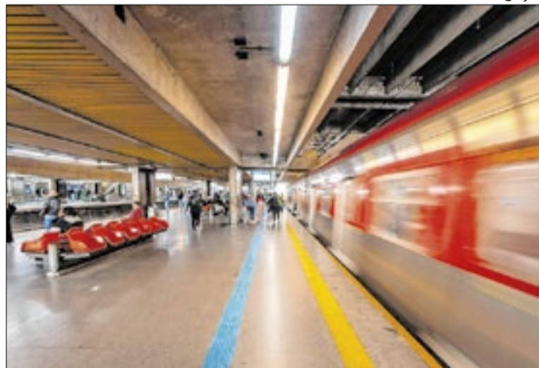
A nova tecnologia estará em todas as estações da CPTM

A implementação total ocorre após ciclos bem-sucedidos de expansão iniciados em pontos de alto fluxo, como as estações Aeroporto-Guarulhos, Brás e Palmeiras-Barra Funda. Ao longo do mês de março, o sistema avançou