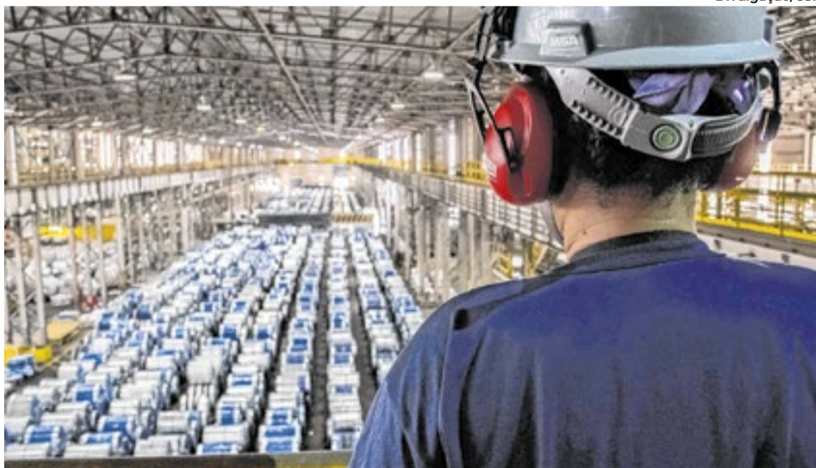
A atuação da CSN se estende por todo o Sul Fluminense

tes têm como foco a sustentabilidade, a inovação tecnológica e o aumento da competitividade.