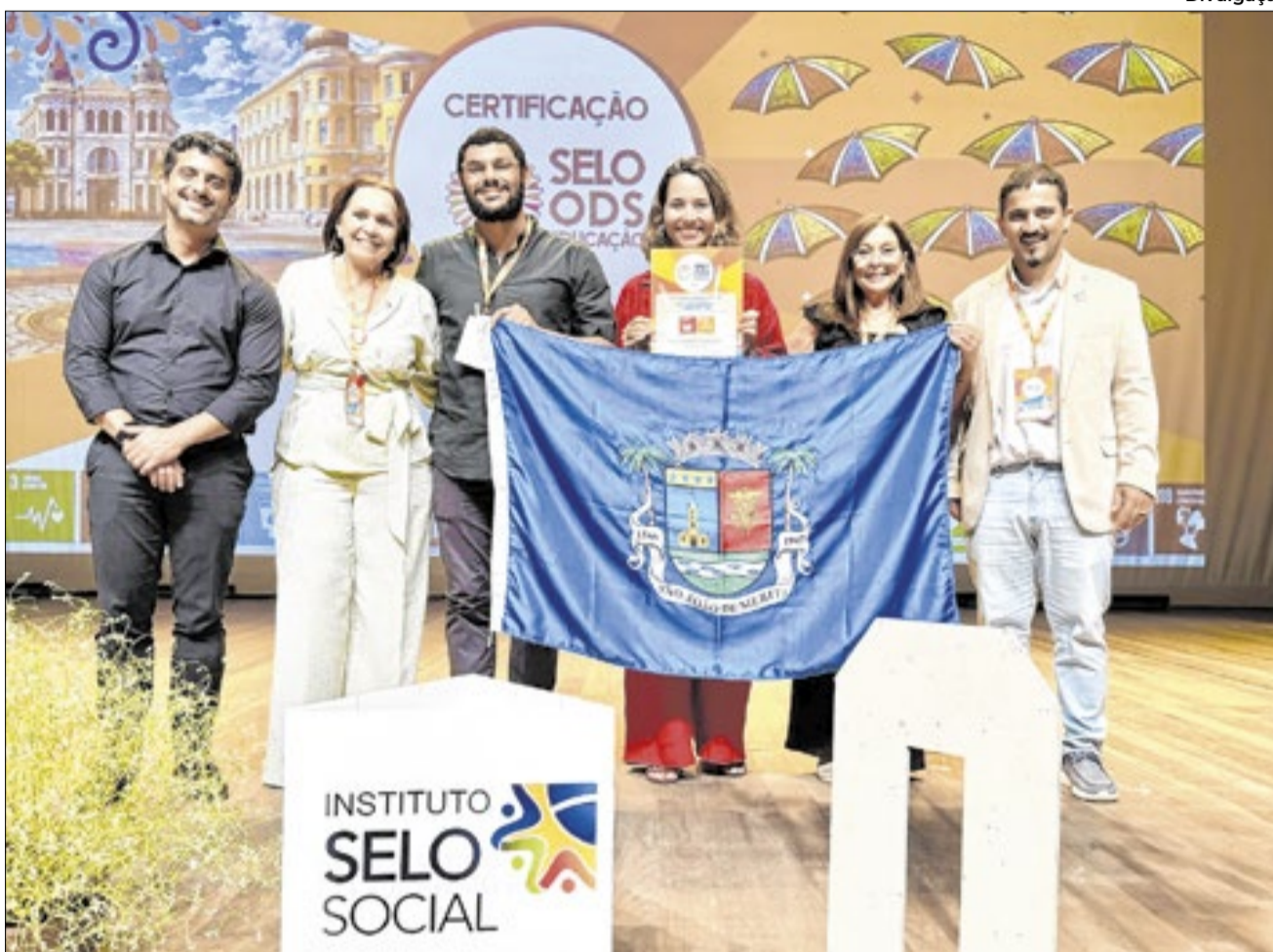
Com a bandeira de São João de Meriti, os representantes da escola vencedora receberam o prêmio em Recife

A certificação foi entregue durante cerimônia realizada nos dias 17 e 18 de março, na Universidade Federal Rural de Pernambuco (UFRPE), em Recife.