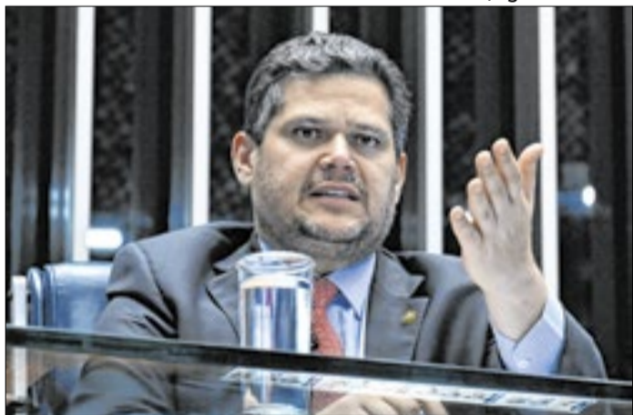
Alcolumbre chega mais desgastado a 2027