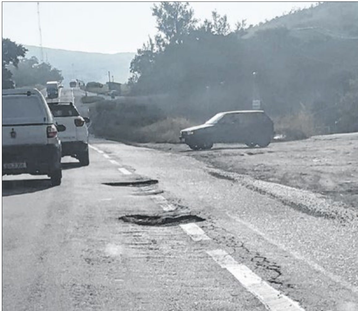
Ana Luiza Rossi/CSF

Além das condições do asfalto, usuários também apontam falhas na sinalização e vegetação avançando sobre as margens da rodovia, o que pode comprometer a visibilidade em alguns pontos, principalmente em trechos de curva ou com menor iluminação.