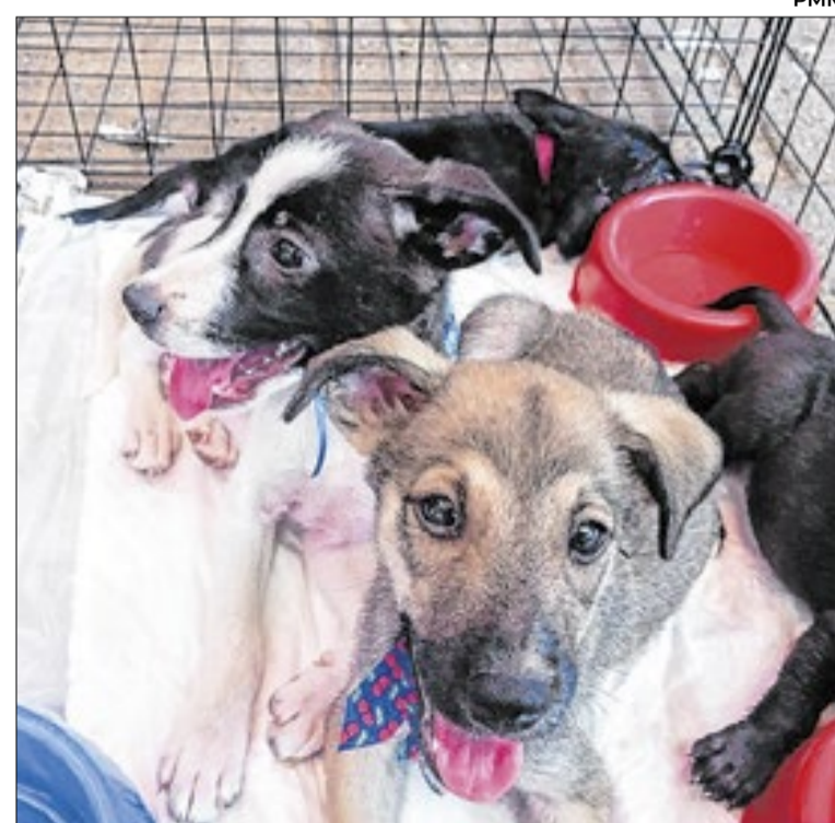
Pets ganharam novos lares na feirinha de adoção