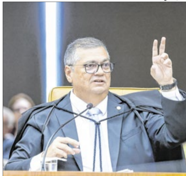
Dino pediu vista até publicação do acórdão do TSE

Finalmente, pode não ser somente a senadora quem não quer oficializar um apoio a Flávio. Essa pode ser a opção do seu partido. Por conta das limitações nas alianças estaduais, como aconteceu com o escanteamento do senador Esperidião Amin em Santa Catarina. “Um erro caro para o estado”, disse Amin.