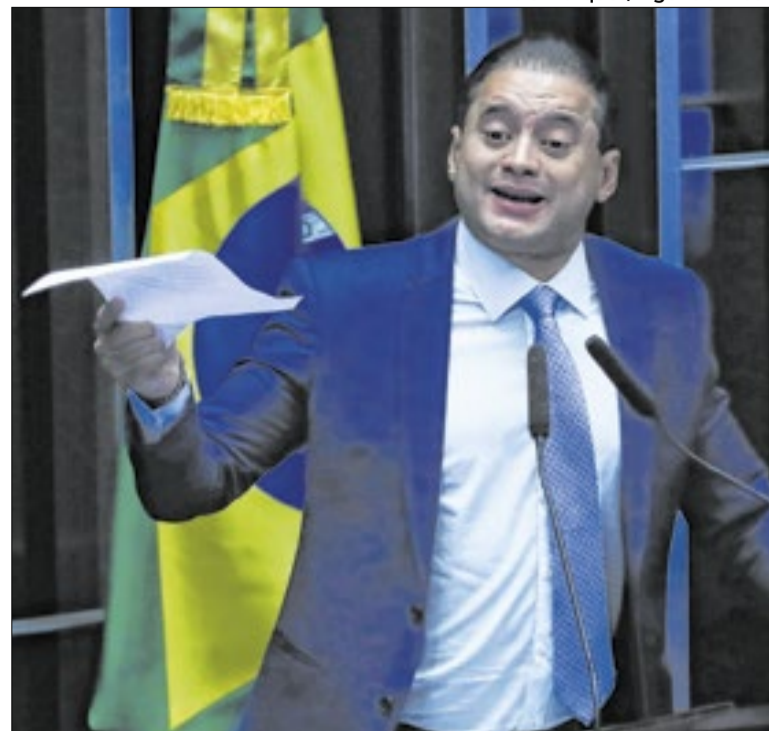
Parecer de Weverton Rocha será favorável a Jorge Messias

O voto de Cármen Lúcia, na mesma linha dos três colegas, foi motivado por outra razão. Presidente do TSE, ela se sentiu desrespeitada com a decisão do STF de julgar o caso antes da publicação de acórdão da Justiça Eleitoral. Ontem, Dino tentou consertar sua posição manifestada na véspera, mas não colou.