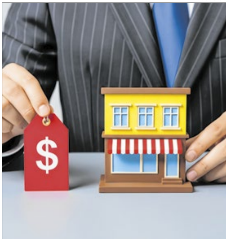
Setor atingiu faturamento recorde de R$ 301,7 bilhões em 2025

“O Rio reúne características muito favoráveis para o franchising, como alta densidade populacional, forte atividade turística e grande presença do setor de serviços. Isso cria um ambiente propício para expansão de redes e novos investimentos no estado”,