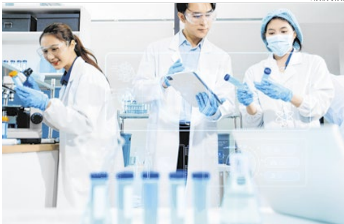
Desenvolvedores da ferramenta defendem que ela pode colaborar para o avanço científico