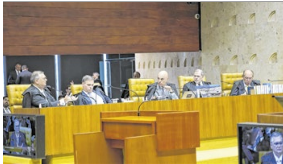
Sentindo que estava sendo perdida a tese jurídica apresentada pelo colega novato no STF, o relator Cristiano Zanin, Flávio Dino pede vista do julgamento