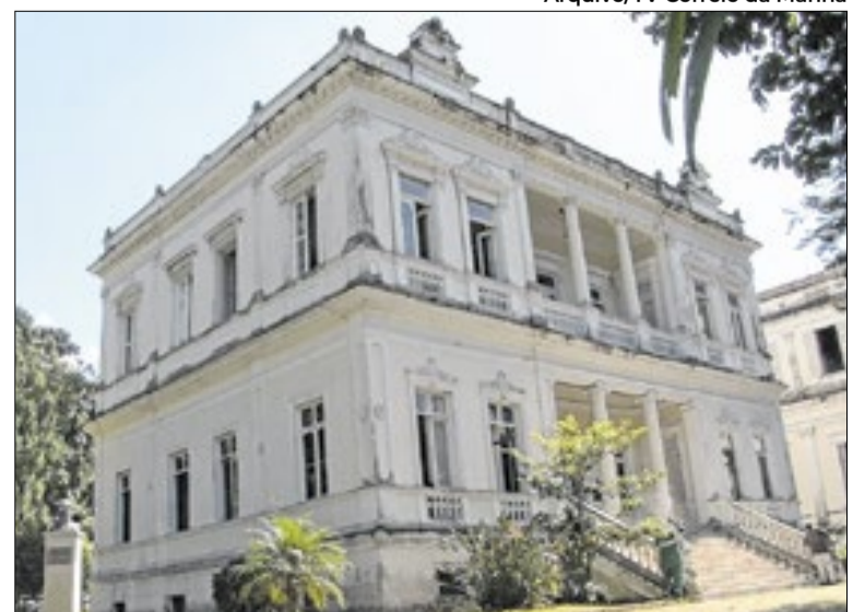
Prazo foi estendido até o mês de junho deste ano