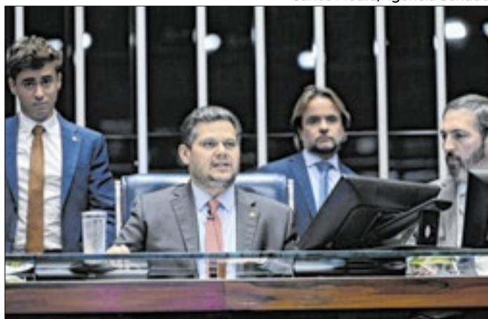
Presidente do Senado convocou sessão para o dia 30