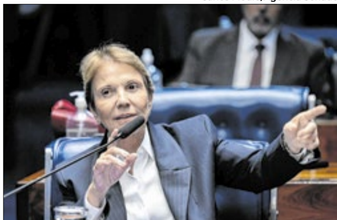
Tereza quer sentar na cadeira de Alcolumbre