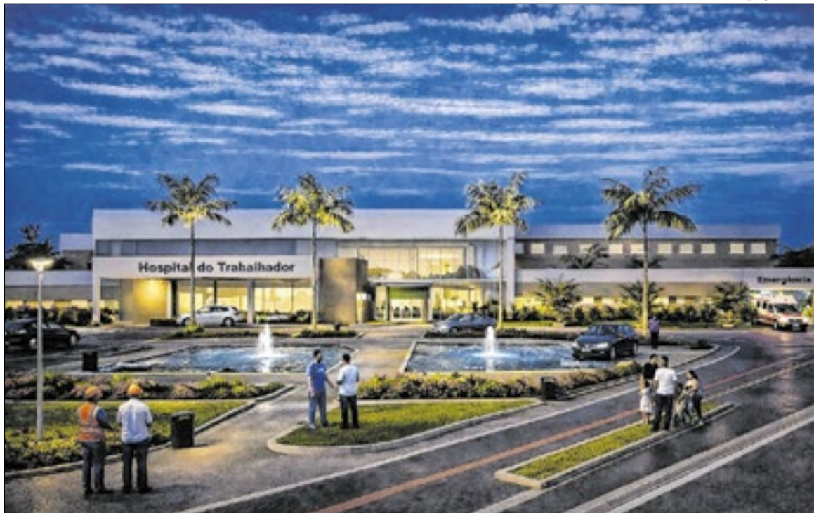
A unidade terá 124 leitos e capacidade de realizar, mensalmente, 1,2 mil cirurgias