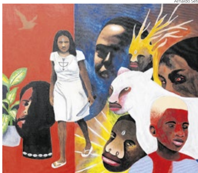
Para artista, seus quadros são um “reflexo” da sua vida