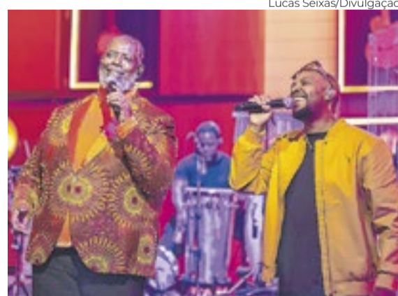
‘Anos 90’, documentário sobre pagode encerra as projeções do evento