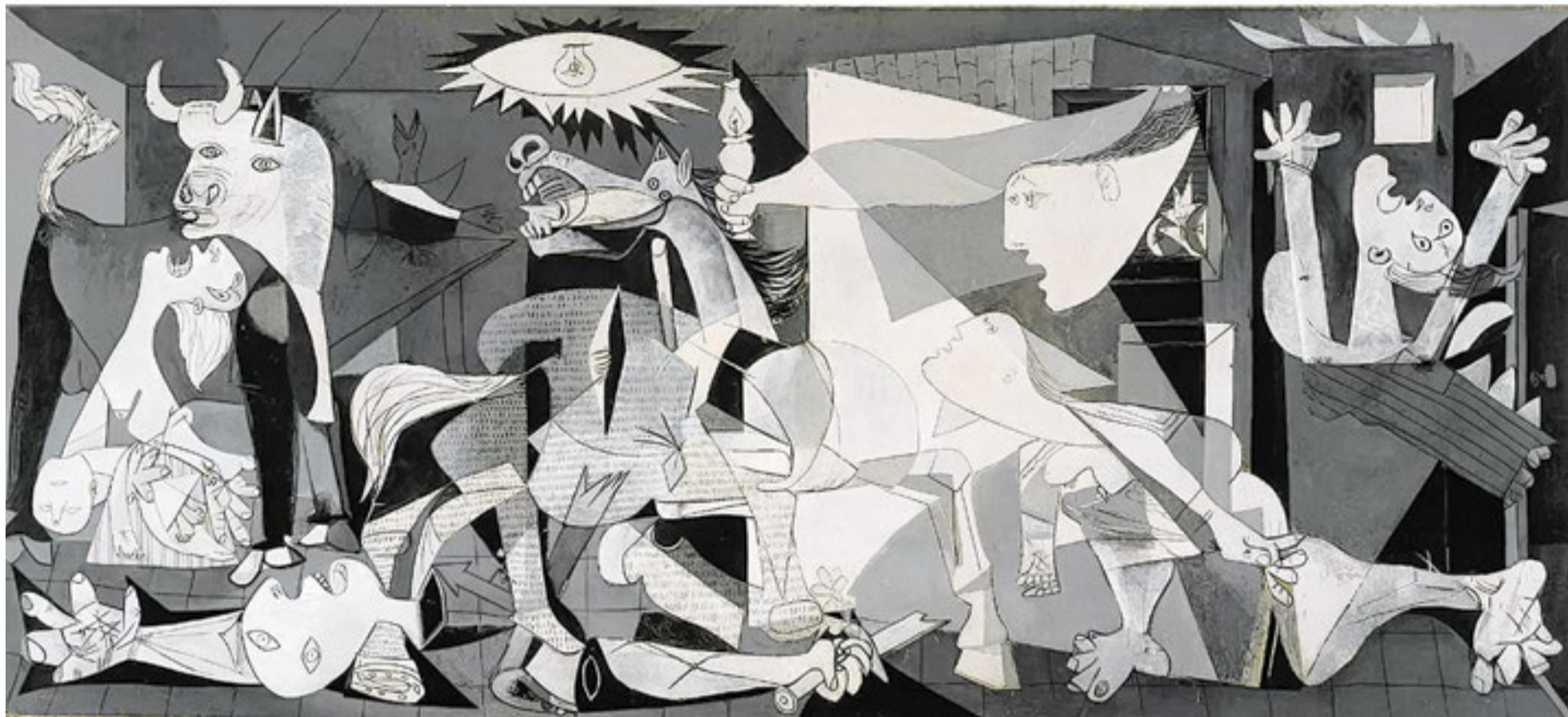
'Guernica', quadro pintado por Pablo Picasso em 1937, está no centro de mais uma disputa política entre o País Basco e o governo central espanhol