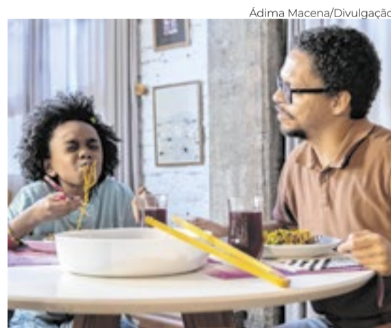
Dirigido por Rodrigo França, o curta ‘O Pai da Rainha da Angola’ passou pelo Open Air e chega ao festival