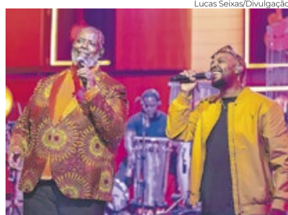
‘Anos 90’, documentário sobre pagode encerra as projeções do evento