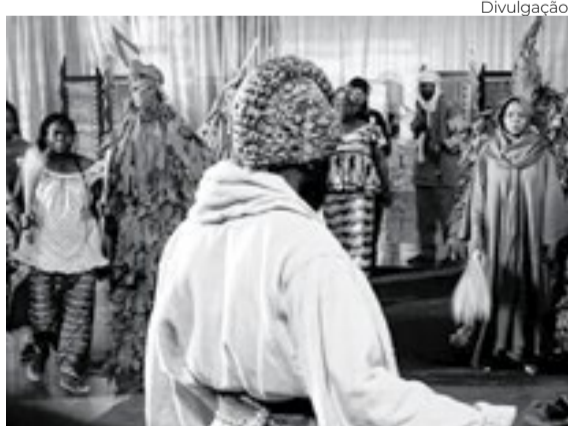
Burkina Faso pede passagem com ‘Katanga - La Danse des Scorpions’