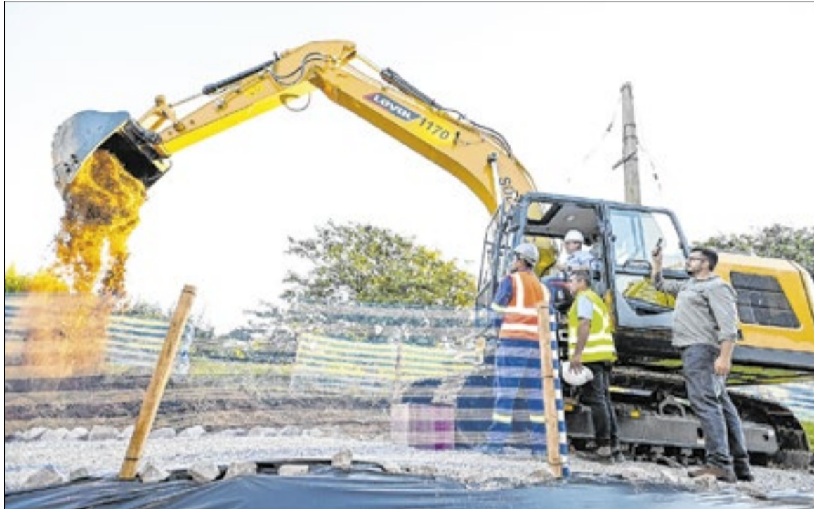
O governador Tarcísio de Freitas dirige trator em visita nas obras do Trem Intercidades