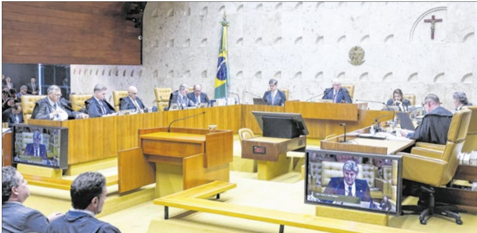
Julgamento retoma hoje com voto de Flávio Dino

De acordo com o Código Eleitoral, um processo de votação indireta ocorre caso a vacância ocorrer a menos de seis meses do final do mandato, o que não é o caso de Cláudio Castro. Por outro lado, a Constituição do Estado do Rio de Janeiro prevê uma eleição indireta quando a dupla vacância acontecer dentro de dois anos do final do