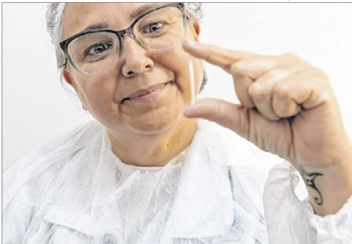
O Implanon é um método contraceptivo de longa duração

Esse método é voltado para mulheres em idade fértil que não se adaptam a medicamentos diários ou mensais. “Não doeu.