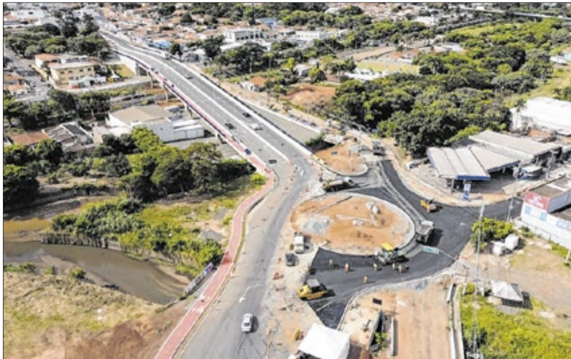
Obra conecta regiões e melhora mobilidade com quatro pistas, ciclovia e nova rota urbana

Ele complementa “Esse viaduto vai ajudar a integrar bairros, reduzir o tempo de deslocamento e dar mais fluidez ao tráfego, especialmente em um ponto que sempre teve grande movimentação. É uma conquista importante para os moradores da região e para toda a cidade. Tenho muito orgulho de ver essa obra, realizada em parceria, se tornar realidade. Sabemos que investir em mobilidade é investir em qualidade de vida, no crescimento da