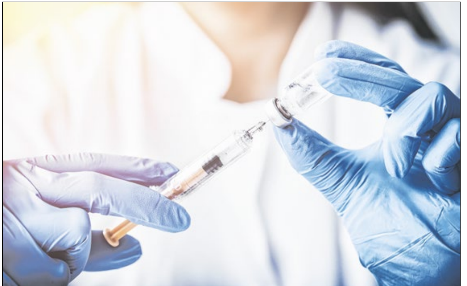
Ministério da Saúde rebate informações falsas nas redes sociais

— Pessoas vacinadas podem ser infectadas por outros vírus respiratórios no mesmo período