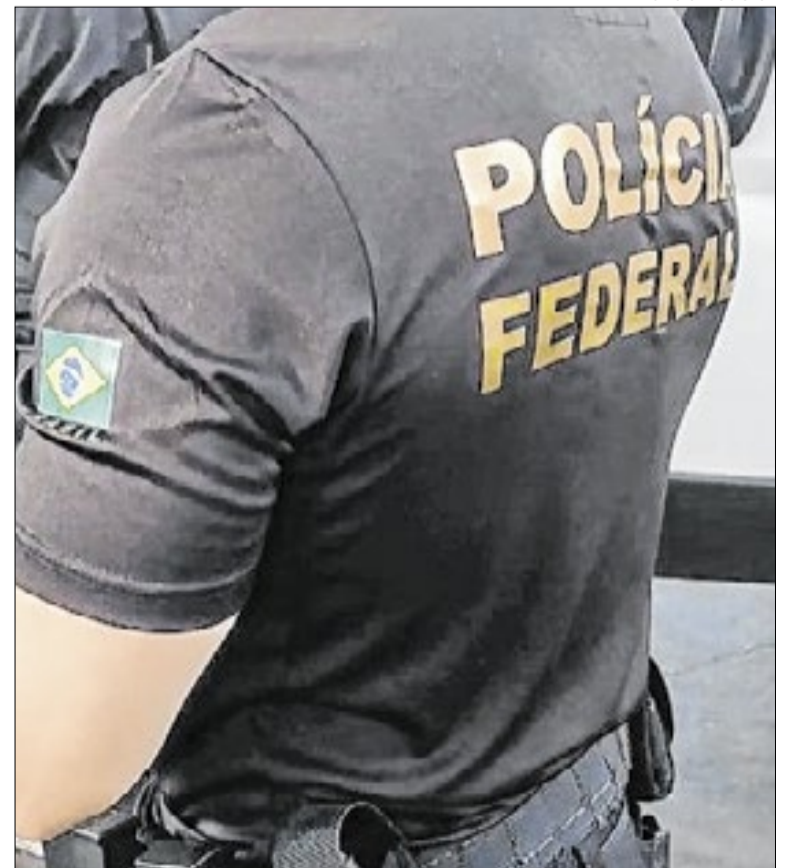
Substâncias foram apreendidas em 171 ocorrências no terminal

A Polícia Federal ressalta que a quantidade de objetos apreendidos e incinerados em cada evento não possui correspondência obrigatória com o ano em que a apreensão foi efetuada. A logística de destruição depende do andamento dos processos e das autorizações para o descarte final dos materiais ilícitos guardados pela corporação.