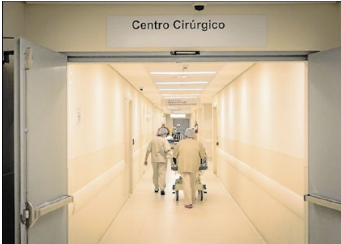
Governador Tarcísio de Freitas (Republicanos-SP) anunciou a autorização para licitação

O principal objetivo é que a nova unidade absorva parte da demanda regional que afoga o Hospital de Clínicas (HC) da Unicamp, que atende pacientes de outras cidades e opera sobrecarregado, apresentando episódios de superlotação (leia mais abaixo). O intuito é que a nova