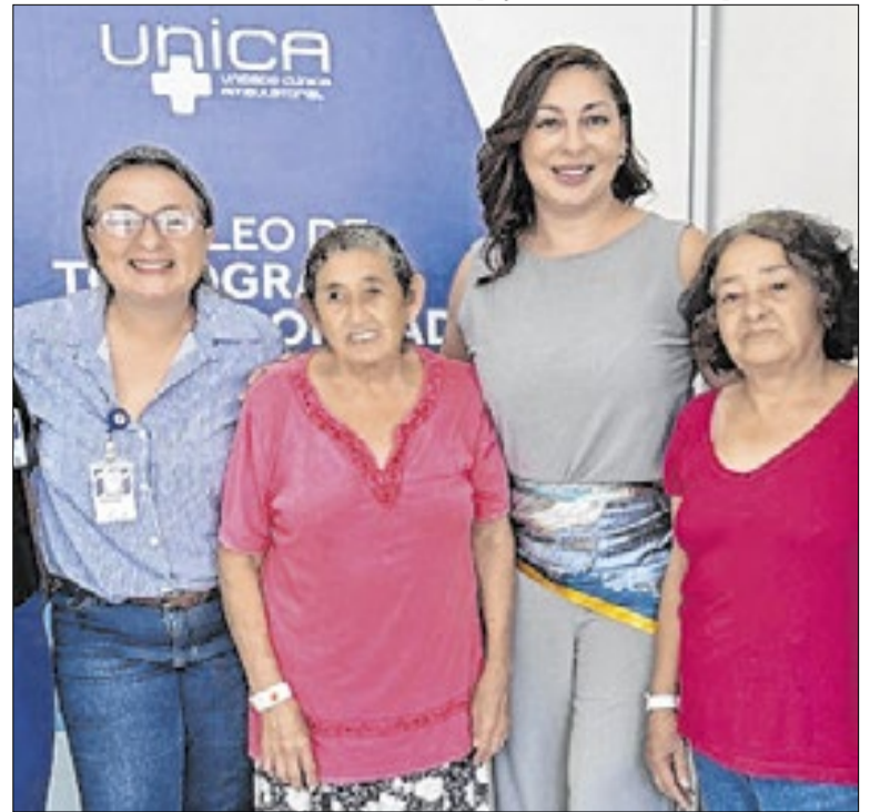
As primeiras pacientes do novo tomógrafo

A meta é alcançar ao menos 90% dos grupos prioritários, como crianças, idosos, gestantes, profissionais da saúde e da educação. A iniciativa reforça a importância da imunização para reduzir complicações, internações e riscos maiores causados pela gripe, principalmente em períodos com mais contágios.