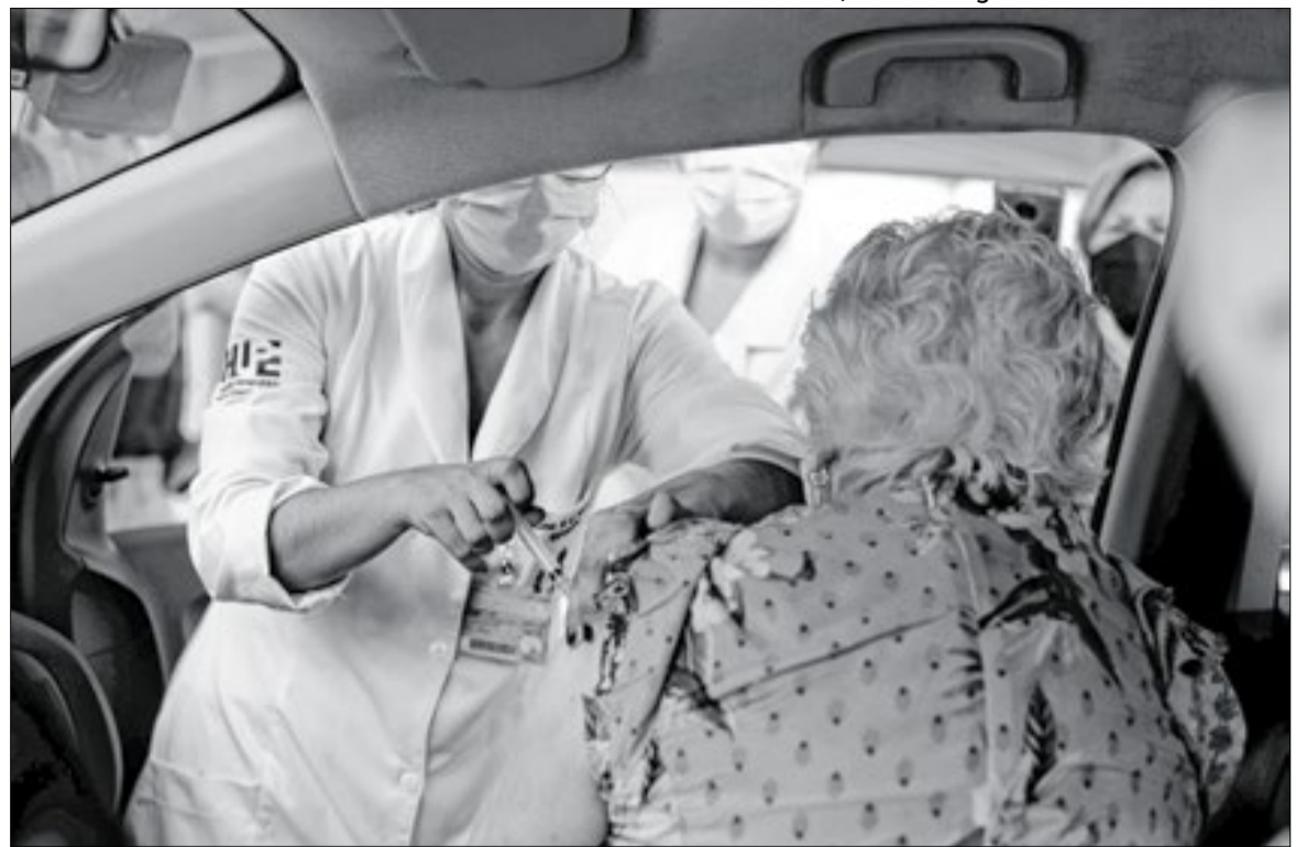
Pessoa idosa é vacinada contra a Covid-19 durante a pandemia, no Rio de Janeiro

As informações são da Agência Brasil e da unicamp.br