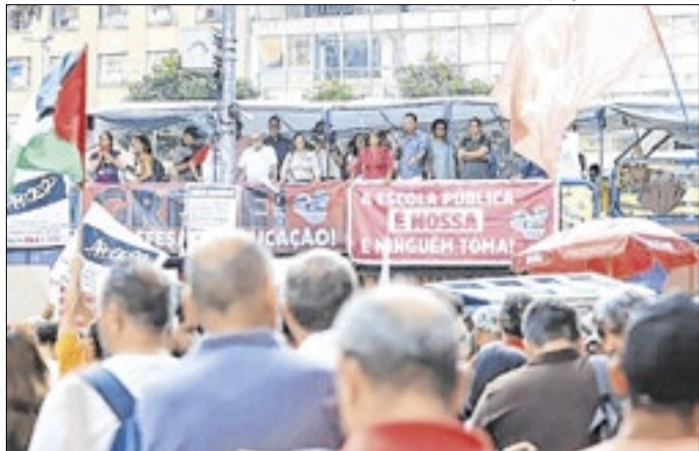
Professores devem participar de assembleia no Masp