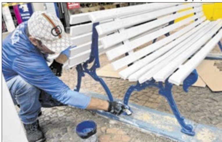
A ação fortalece o comércio e mantém o espaço organizado

Formado por servidores municipais, o grupo atua principalmente no calçadão, executando serviços como consertos em calçadas, manutenção de mobiliário urbano, pintura e limpeza. A proposta é garantir respostas mais rápidas às demandas cotidianas de