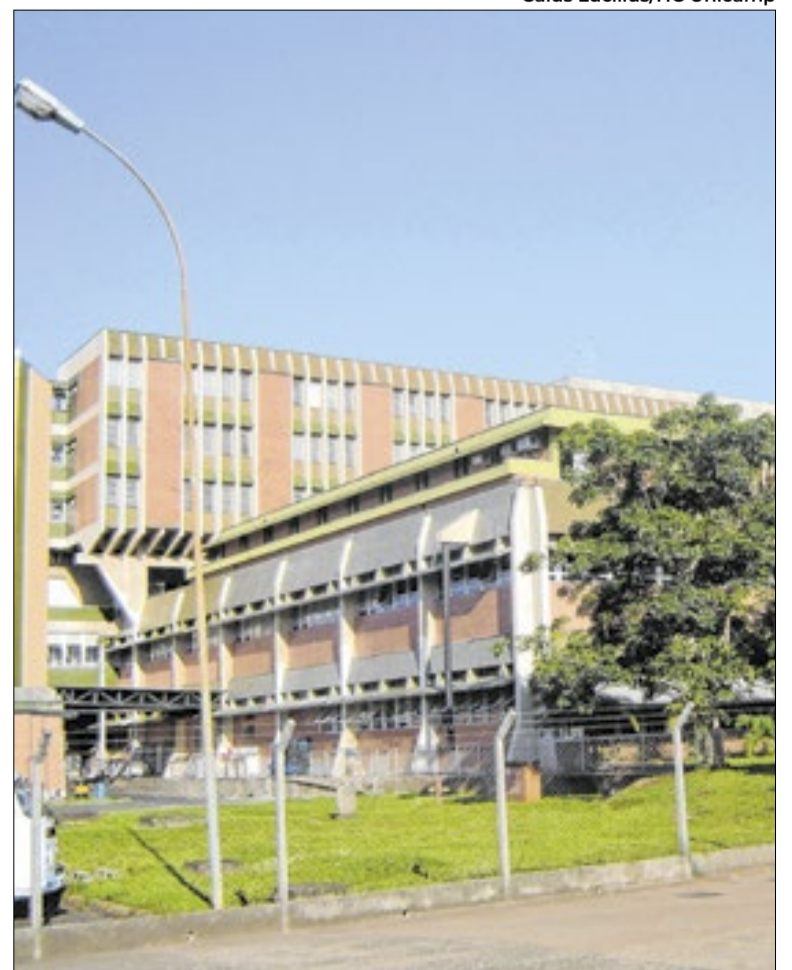
Investigação apura encaminhamentos ao HC da Unicamp

De acordo com a Promotoria, os médicos, valendo-se das funções que exerciam no hospital público, teriam facilitado o ingresso desses pacientes no serviço, criando um fluxo paralelo de atendimento que priorizava usuários vinculados à empresa. Para o MP, a prática viola princípios do SUS, como a universalidade e a equidade no acesso.