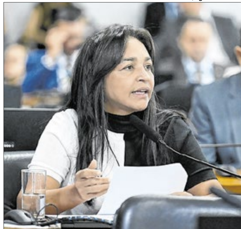
Senadora Eliziane Gama relatou a PEC sobre punição a juízes

O Inep(Instituto Nacional de Estudos e Pesquisas Educacionais), ligado ao MEC e responsável por avaliações como o Enem e censos escolares, abriu seleção para professores de cursos técnicos interessados em atuar como avaliadores. Inscrições vão até 12/abril. Aprovados recebem Auxílio de Avaliação Educacional (AAE).