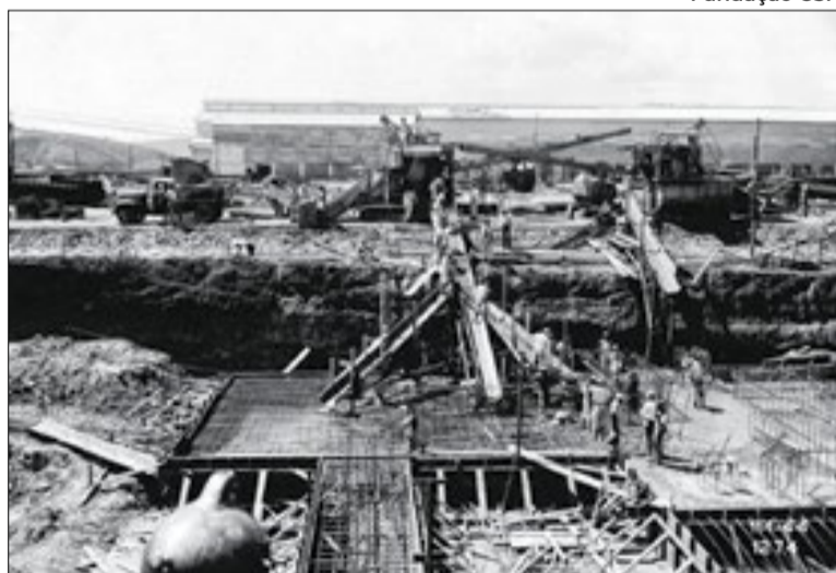
Construção da usina atraiu operários de todo país

administração Dutra. No auge das obras chegaram a trabalhar em Volta Redonda quase 10 mil homens e a usina ganhou status de instalação militar de "segurança nacional". A decisão de construir uma cidade foi uma necessidade de acomodar a imensa mão de obra necessária para construir e manter o funcionamento da usina.