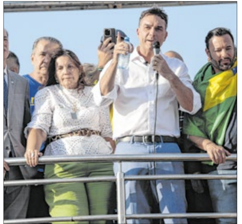
60% afirmam não ter certeza se votarão em Flávio Bolsonaro

A decisão indica que o STF não vai abrir mão da perda de posto e patente de Jair Bolsonaro e dos oficiais gerais com ele condenados. Isso, mesmo que o Superior Tribunal Militar decida o contrário. Para Moraes, essa punição é automática em caso de penas superiores a quatro anos de prisão.