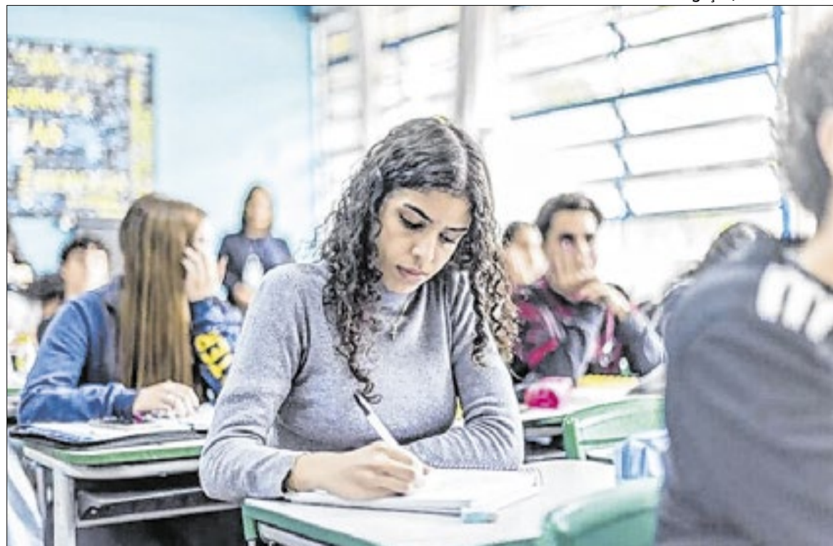
Projeto de Lei formaliza ações que mobilizaram mais de 4 milhões de alunos em 2024 e 2025

Com a proposta, o Governo pretende institucionalizar esse modelo, garantindo continuidade às ações ao longo dos próximos anos e consolidando uma política estruturada de incentivo ao desempenho acadêmico. A estratégia segue a linha de outros programas educacionais do