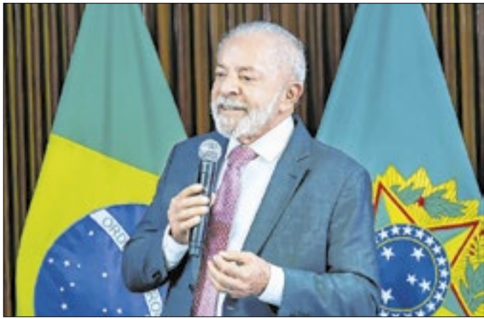
Presidente Luiz Inácio Lula da Silva (PT)