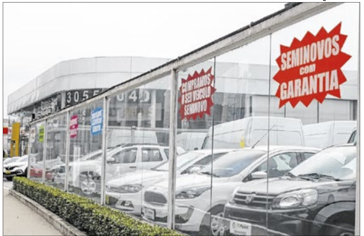
Vendas de automóveis despencaram na pandemia, mas voltaram a crescer nos anos seguintes

No mercado de usados, o primeiro trimestre alcançou 4.378.062 unidades vendidas, alta de 12,7% sobre igual período de 2025. Já o segmento de veículos novos acumulou mais de 1,25 milhão de unidades emplacadas entre janeiro e março, configurando um dos melhores inícios de ano da história do setor.