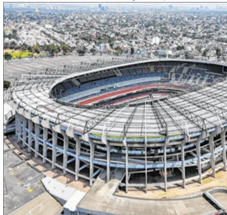
Azteca será o principal estádio da Copa do Mundo no México

Ainda assim, não chegaram a quebrar. As imagens foram conseguidas pelo jornalista David Reverter, do Sport. O lançamento das pedras aconteceu na rua anterior à entrada do Camp Nou, por vários torcedores que estavam nas calçadas. O ônibus do Atlético estava sendo escoltado pela polícia.