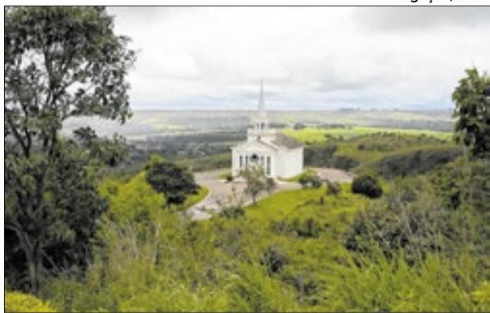
Debate sobre a Ponte Alta e a 26 de Setembro