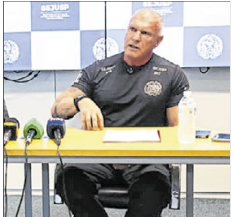
Controle restringe comunicação de lideranças criminosas