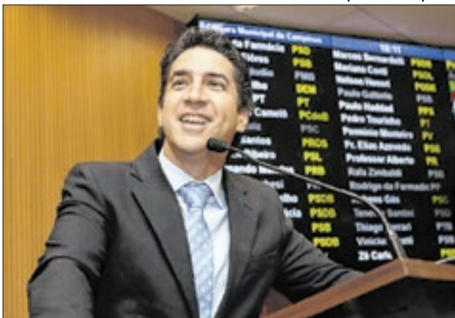
Ferrari mostrou civilidade acima de discordâncias