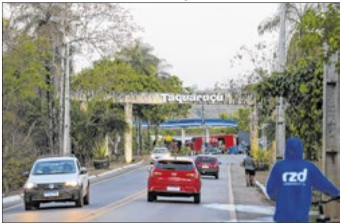
Fórum de Cultura aconteceu em Taquaruçu