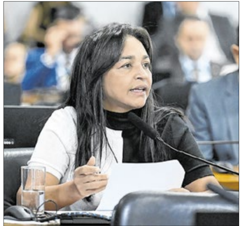
Senadora Eliziane Gama relatou a PEC sobre punição a juizes

O Inep(Instituto Nacional de Estudos e Pesquisas Educacionais), ligado ao MEC e responsável por avaliações como o Enem e censos escolares, abriu seleção para professores de cursos técnicos interessados em atuar como avaliadores. Inscrições vão até 12/abril. Aprovados recebem Auxílio de Avaliação Educacional (AAE).