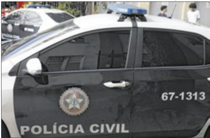
Produtos ilícitos eram distribuídos em São Paulo