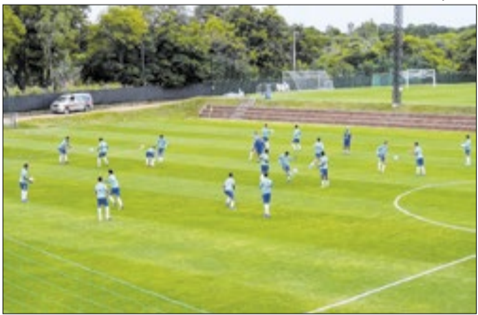
Seleção Brasileira se prepara para o clássico