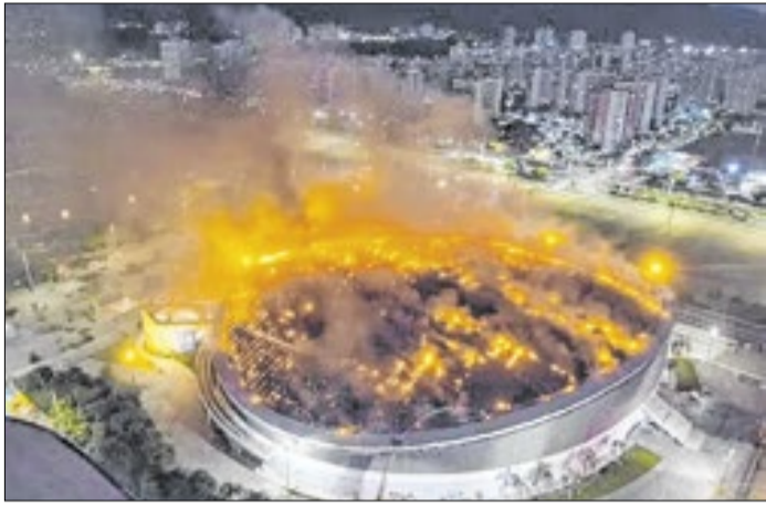
Equipamento fica no Parque Olímpico