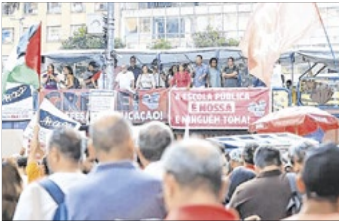
Professores devem participar de assembleia no Masp