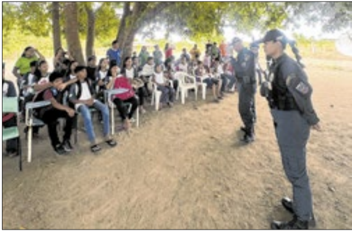
Ações do Escudo Feminino também foram educativas