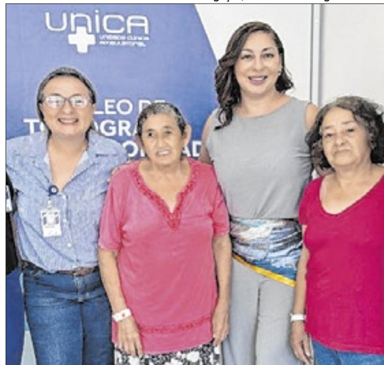
As primeiras pacientes do novo tomógrafo

A meta é alcançar ao menos 90% dos grupos prioritários, como crianças, idosos, gestantes, profissionais da saúde e da educação. A iniciativa reforça a importância da imunização para reduzir complicações, internações e riscos maiores causados pela gripe, principalmente em períodos com mais contágios.