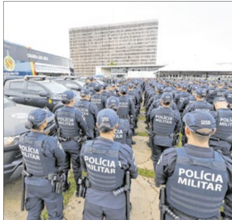
Operação terá policiamento ostensivo em todas as regiões