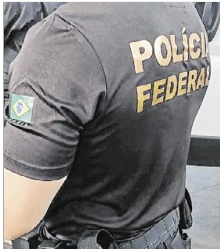
Substâncias foram apreendidas em 171 ocorrências no terminal

A Polícia Federal ressalta que a quantidade de objetos apreendidos e incinerados em cada evento não possui correspondência obrigatória com o ano em que a apreensão foi efetuada. A logística de destruição depende do andamento dos processos e das autorizações para o descarte final dos materiais ilícitos guardados pela corporação.