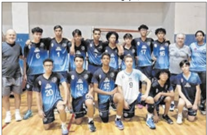
Equipe avança nos Jogos da Juventude após vitórias