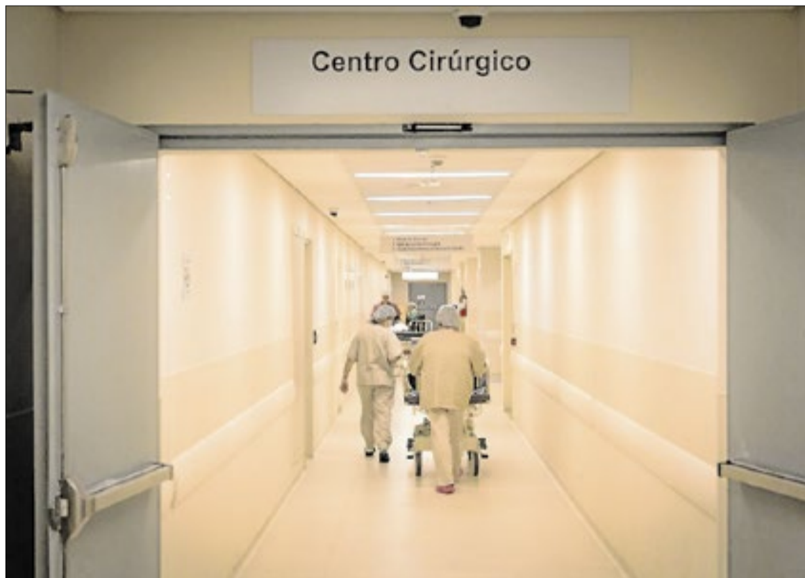
Governador Tarcísio de Freitas (Republicanos-SP) anunciou a autorização para licitação

O principal objetivo é que a nova unidade absorva parte da demanda regional que afoga o Hospital de Clínicas (HC) da Unicamp, que atende pacientes de outras cidades e opera sobrecarregado, apresentando episódios de superlotação (leia mais abaixo). O intuito é que a nova