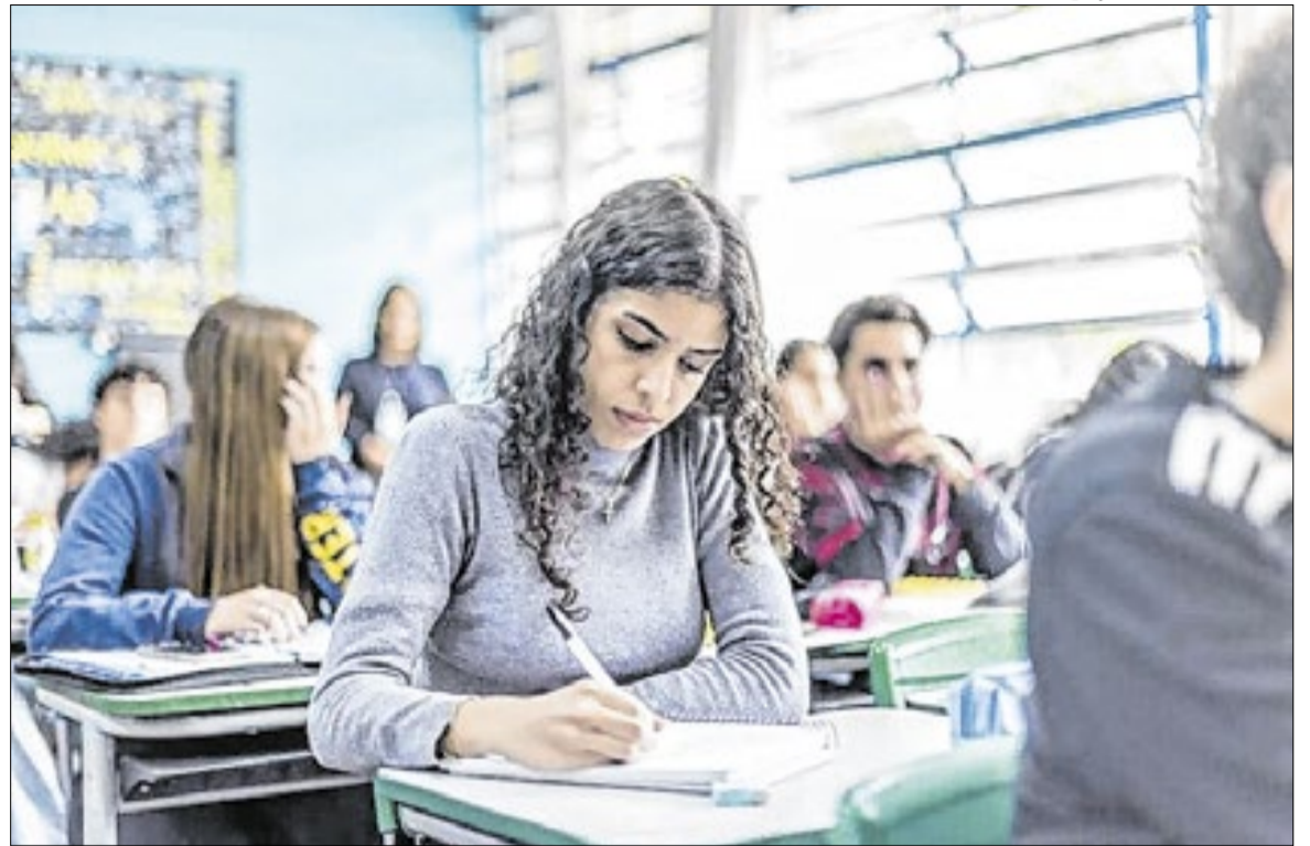
Projeto de Lei formaliza ações que mobilizaram mais de 4 milhões de alunos em 2024 e 2025

Com a proposta, o Governo pretende institucionalizar esse modelo, garantindo continuidade às ações ao longo dos próximos anos e consolidando uma política estruturada de incentivo ao desempenho acadêmico. A estratégia segue a linha de outros programas educacionais do