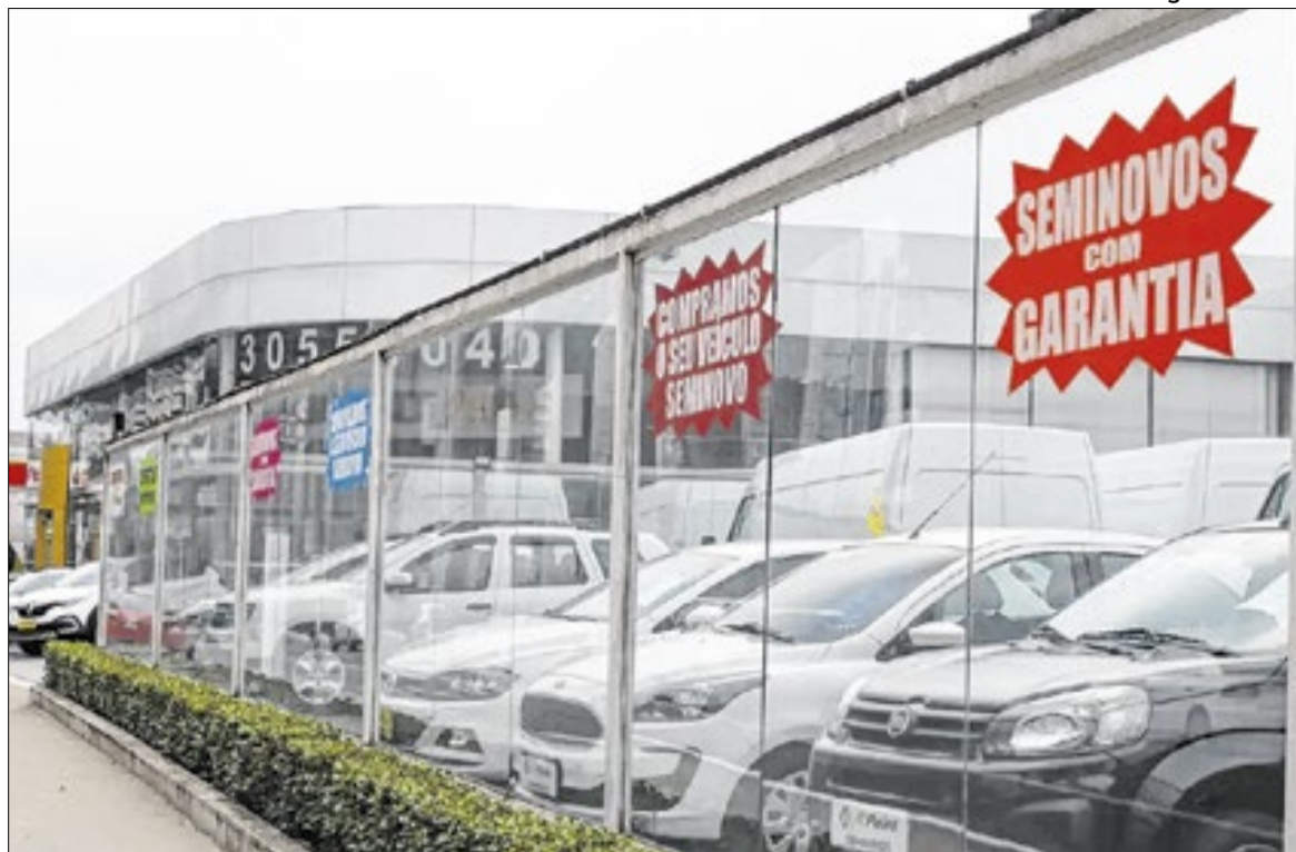
Vendas de automóveis despencaram na pandemia, mas voltaram a crescer nos anos seguintes

No mercado de usados, o primeiro trimestre alcançou 4.378.062 unidades vendidas, alta de 12,7% sobre igual período de 2025. Já o segmento de veículos novos acumulou mais de 1,25 milhão de unidades emplacadas entre janeiro e março, configurando um dos melhores inícios de ano da história do setor.