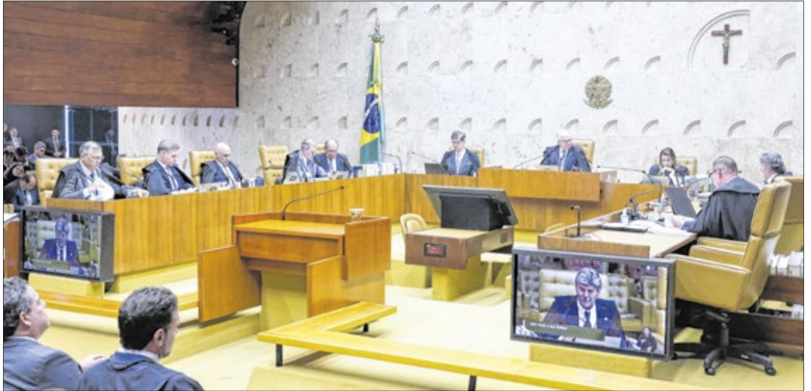
Julgamento retoma hoje com voto de Flávio Dino

De acordo com o Código Eleitoral, um processo de votação indireta ocorre caso a vacância ocorrer a menos de seis meses do final do mandato, o que não é o caso de Cláudio Castro. Por outro lado, a Constituição do Estado do Rio de Janeiro prevê uma eleição indireta quando a dupla vacância acontecer dentro de dois anos do final do