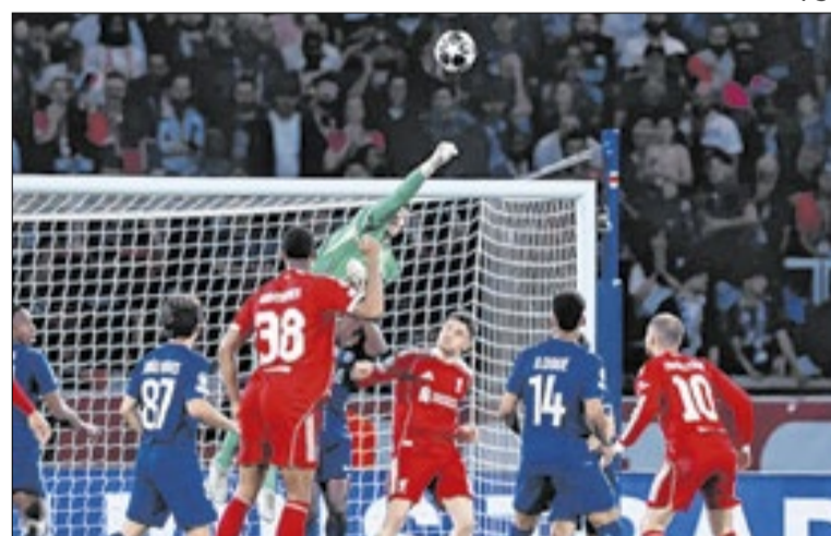
O PSG foi dominante na vitória por 2 a 0 sobre o Liverpool

Do outro lado da chave, também nesta quarta-feira, o atual campeão PSG recebeu o Liverpool no Parc des Princes. O jogo foi amplamente dominado pelos franceses, que pressionaram os ingleses e venceram por 2 a 0. Ao apito final, ficou a sensação de que o placar