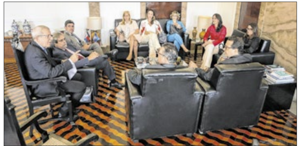
Reunião tratou de prerrogativas da advocacia, uso de celulares em audiência e melhorias estruturais na Justiça do Trabalho

também sugerida a definição de um horário limite para o término das audiências, alinhado ao que prevê a legislação trabalhista, especialmente por questões de segurança.