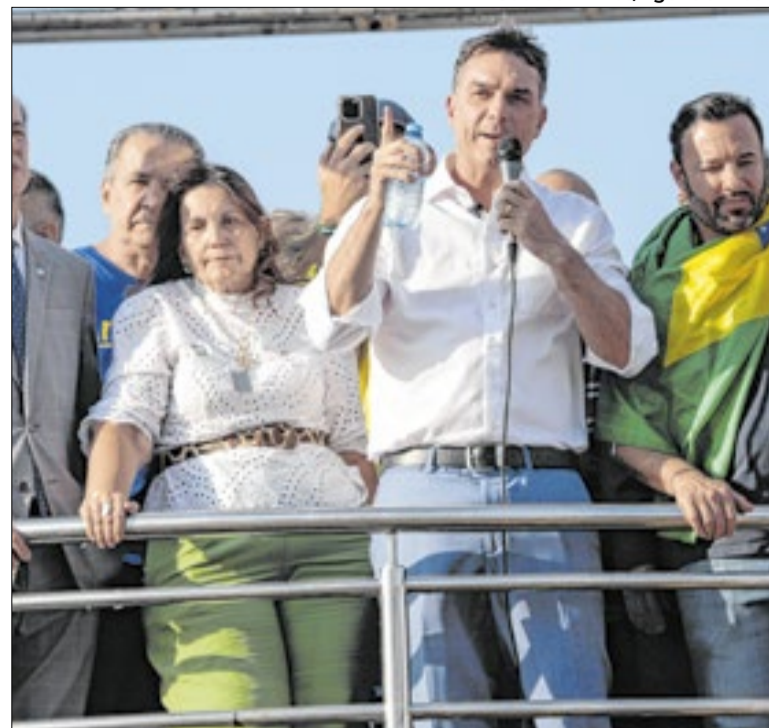
60% afirmam não ter certeza se votarão em Flávio Bolsonaro

A decisão indica que o STF não vai abrir mão da perda de posto e patente de Jair Bolsonaro e dos oficiais gerais com ele condenados. Isso, mesmo que o Superior Tribunal Militar decida o contrário. Para Moraes, essa punição é automática em caso de penas superiores a quatro anos de prisão.