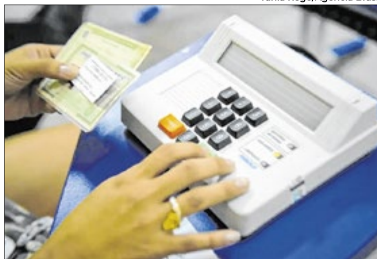
A participação é bem abaixo da média nacional entre jovens

No cenário nacional, o Brasil conta com cerca de 5,8 milhões de adolescentes entre 16 e 17 anos, mas apenas cerca de 1,8 milhão haviam tirado o tí-