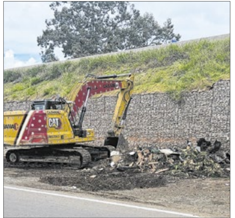
Trator que demoliu moradias às margens da Miguel Melhado

Entretanto, o fato da proposta ter sido retirada de pauta no último momento demonstra que ainda existe um prudência no plenário, embora a simples existência do projeto revele um problema maior. O mandato parlamentar não deve legitimar comportamentos que desafiem a lei.