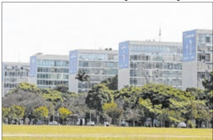
Servidores da União tiveram Vale Transporte reajustado