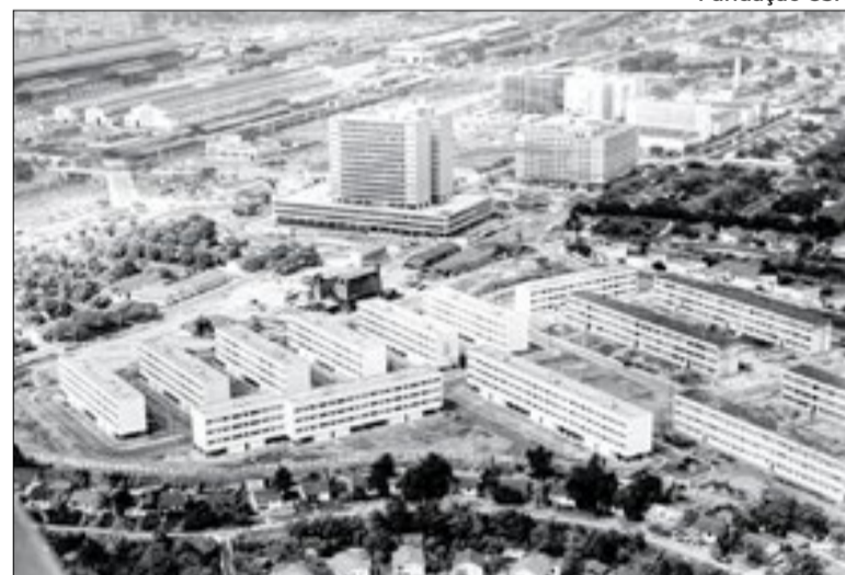
Volta Redonda foi idealizada como modelo 'cidade-empresa'

"A usina foi idealizada como uma 'company-town' (cidade-empresa), com moradias subsidiadas e uma ampla rede de serviços urbanos, que seriam referência da modernidade industrial e do progresso social do Brasil. Com a CSN o governo queria afirmar a possibilidade de relações