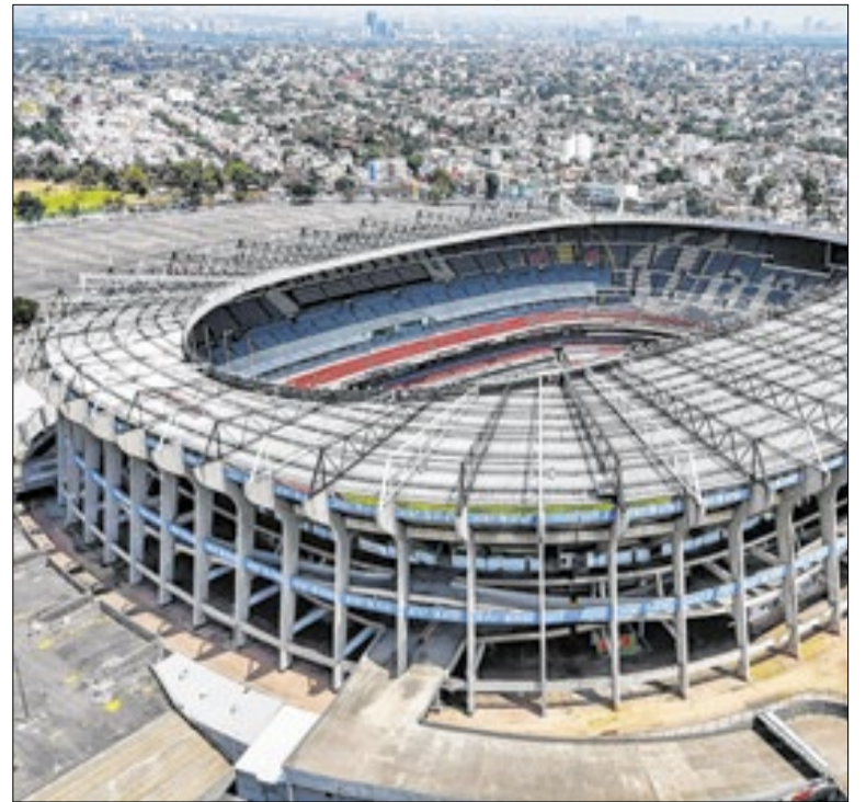
Azteca será o principal estádio da Copa do Mundo no México

Ainda assim, não chegaram a quebrar. As imagens foram conseguidas pelo jornalista David Reverter, do Sport. O lançamento das pedras aconteceu na rua anterior à entrada do Camp Nou, por vários torcedores que estavam nas calçadas. O ônibus do Atlético estava sendo escoltado pela polícia.