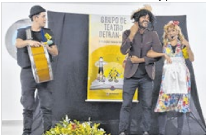
Formação aborda como falar do trânsito na sala de aula