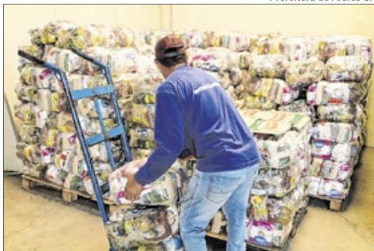
São Paulo tem a cesta básica mais cara do país: R$ 883,94.

Entre os principais responsáveis pelo aumento está o feijão, que apresentou alta em todas as cidades pesquisadas. Segundo o Dieese, "a elevação ocorreu devido à restrição na oferta provocada por dificuldades na colheita". O feijão preto registrou aumentos nas capitais do Sul, além do Rio de Janeiro e Vitória, enquanto o feijão carioca teve variações em outras regiões do país. Além do grão, produtos importantes da alimentação diária também ficaram mais caros, como tomate, carne bovina de primeira e leite integral, aumentando o impacto no custo final da cesta.