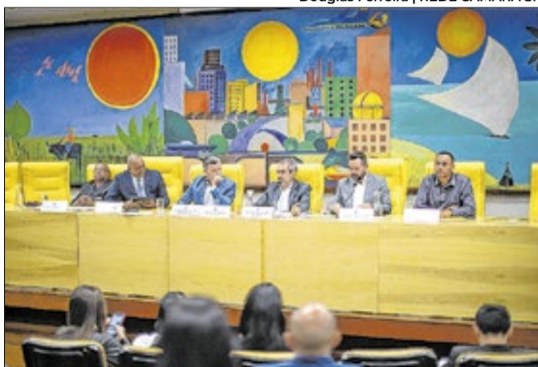
Pauta tinha 20 itens; algumas propostas foram aprovadas

Outro projeto que avançou foi o que estabelece normas para a comercialização de celulares usados. A proposta prevê a obrigatoriedade de comprovação de origem dos aparelhos, incluindo o registro do