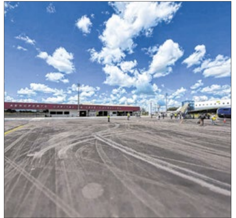
Aeroporto de Cacoal é um dos que teve voos ampliados