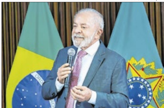
Presidente Luiz Inácio Lula da Silva (PT)