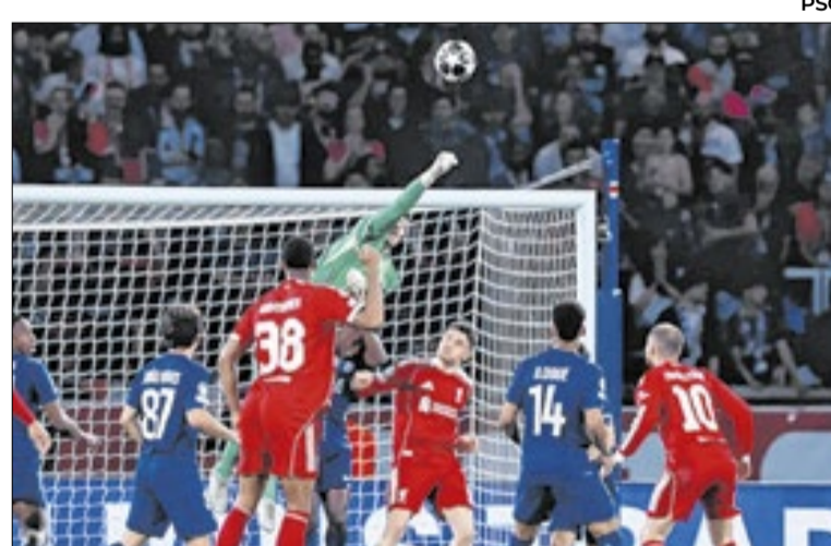
O PSG foi dominante na vitória por 2 a 0 sobre o Liverpool

Do outro lado da chave, também nesta quarta-feira, o atual campeão PSG recebeu o Liverpool no Parc des Princes. O jogo foi amplamente dominado pelos franceses, que pressionaram os ingleses e venceram por 2 a 0. Ao apito final, ficou a sensação de que o placar