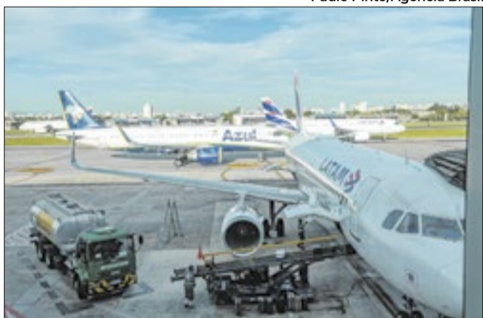
Governo zera tributo, mas efeito nas tarifas é incerto