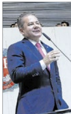
Durante a Sessão Solene, o deputado federal Cezinha de Madureira