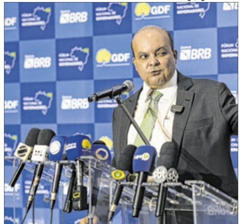
Ibaneis faltou duas vezes a audiências na CPI