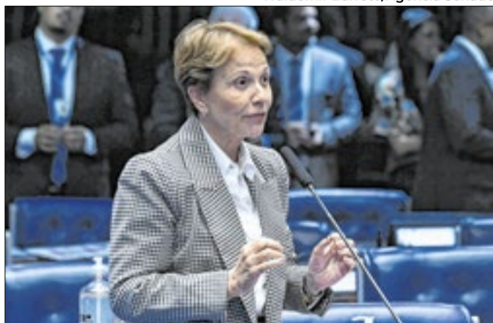
Tereza Cristina sobre os riscos da guerra: "A crise é grave"