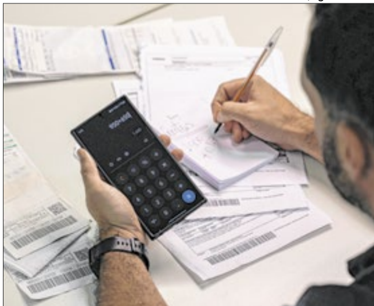
Comprometimento com dívida impede percepção de melhora