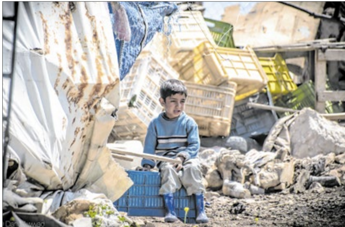
Migrantes relatam dificuldades para obter acesso à ajuda humanitária ou voltar ao país de origem