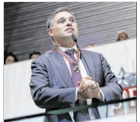
André Mendonça durante discurso após receber o Colar de Honra ao Mérito Legislativo