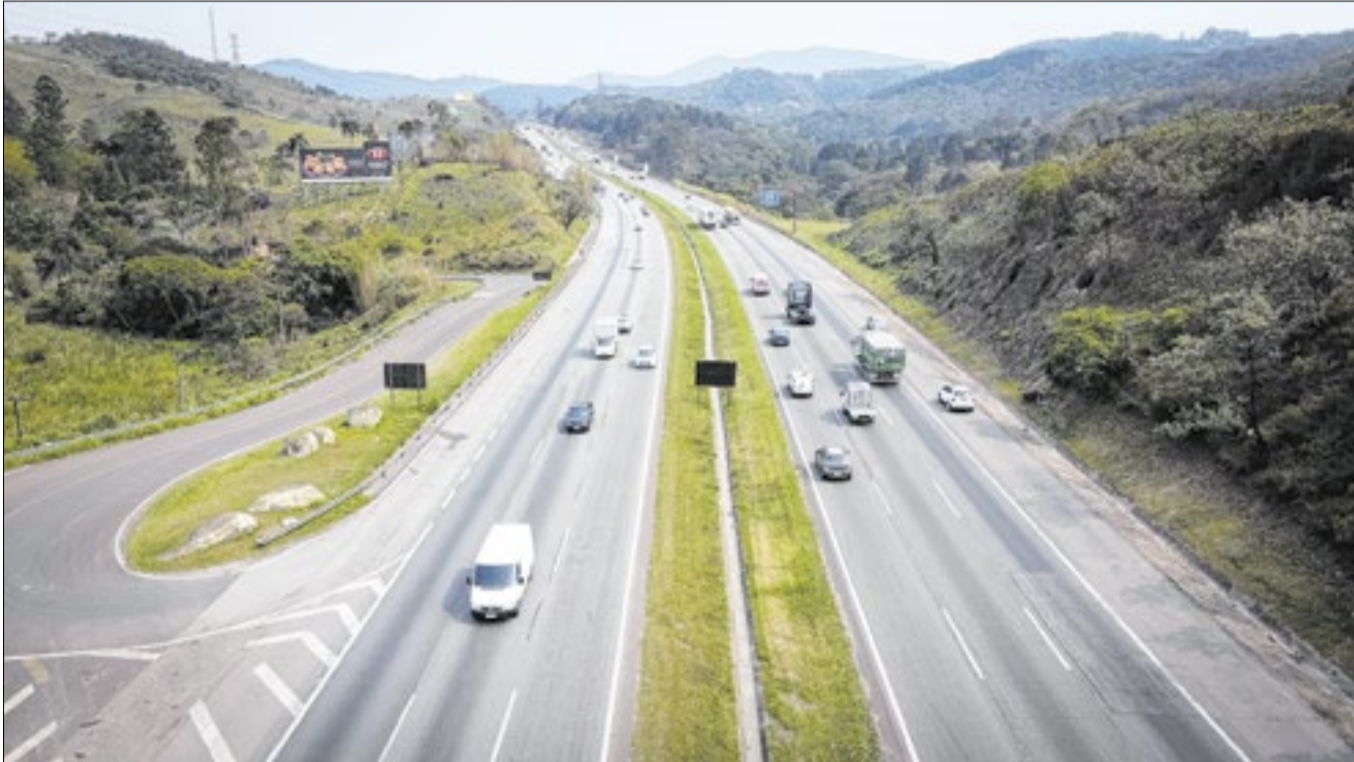
As concessões integram estratégia de requalificação dos principais corredores logísticos

O avanço também se reflete na modernização da sinalização e da infraestrutura, com milha-