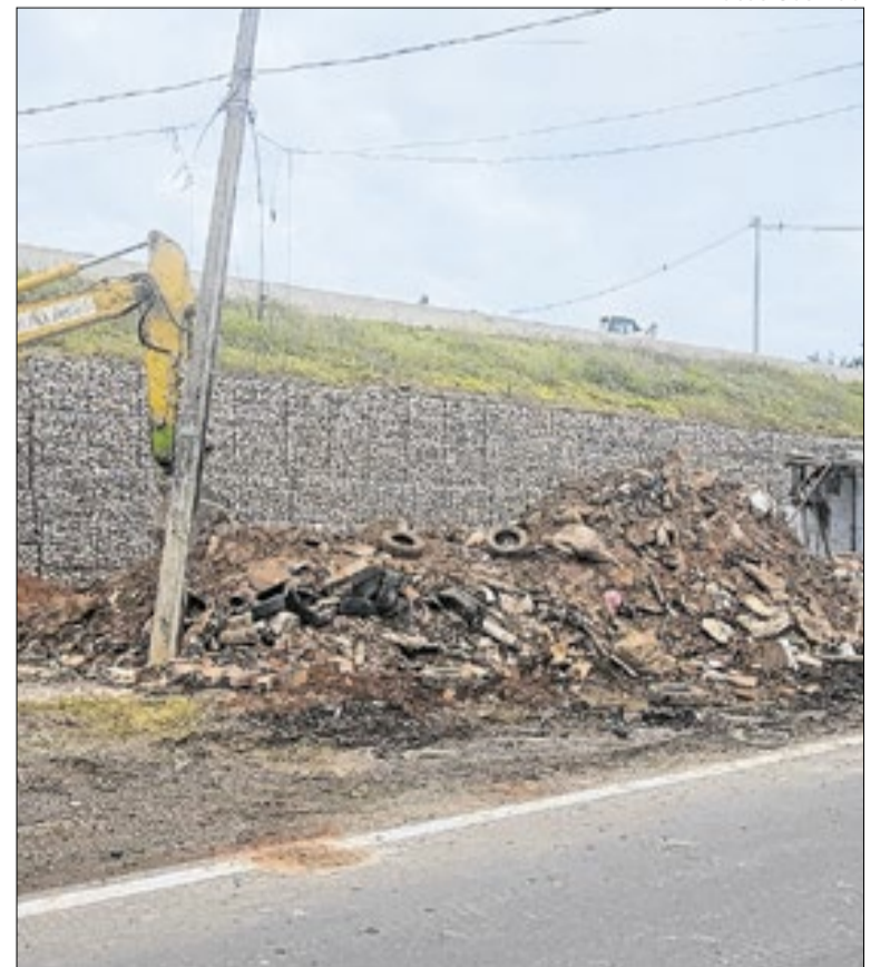
Moradias, às margens da Miguel Melhado, foram removidas

A estrada foi duplicada, e às margens, onde os moradores foram desalojados, será construída uma ciclovia. O Correio da Manhã entrou em contato com o órgão, mas, até o fechamento desta reportagem, não obteve resposta. Já a Prefeitura - em relação ao papel social - informou que, “por meio da Secretaria de Habitação, ofereceu auxílio-moradia às famílias que precisaram deixar a área”.