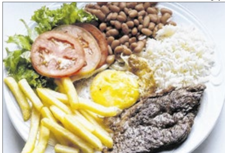
Paulistano gasta entre R$ 36,74 e R$ 71,39 no self-service.