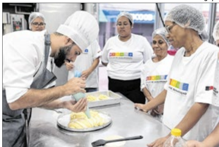
Programa foca na descentralização do ensino técnico

O programa já percorreu 11 regiões administrativas e segue transformando vidas através do conhecimento. Nesta etapa, a ação contempla os municípios de