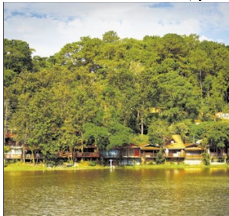
Iniciativa conecta campo, renda e experiência turística

Curitiba conquistou o selo internacional de Destino Turístico Inteligente, concedido pela Rede Ibero-americana e válido até 2028. O reconhecimento destaca governança, inovação e sustentabilidade na gestão do turismo, reforçando o posicionamento da cidade e o uso de tecnologia para qualificar a experiência.