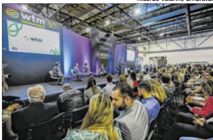
Feira internacional reúne cadeia produtiva em São Paulo