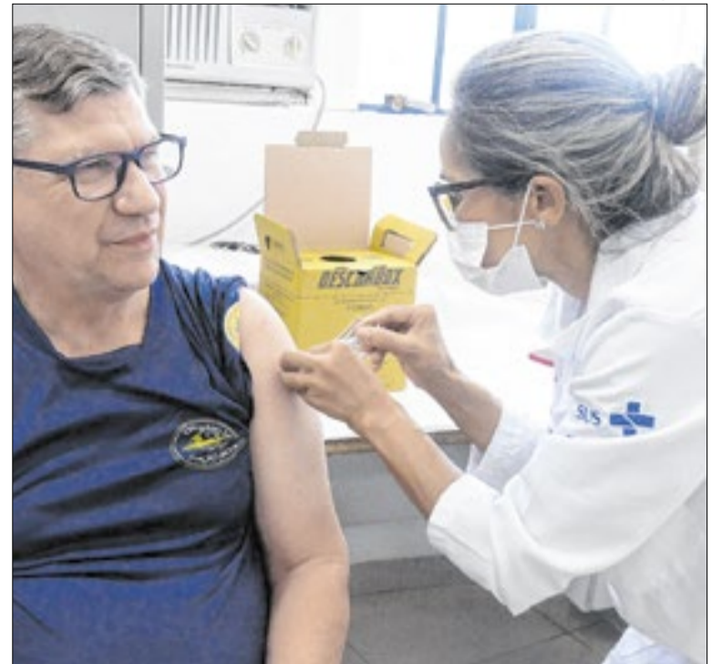
Imunizante está disponível nos Centros de Saúde (CSs)