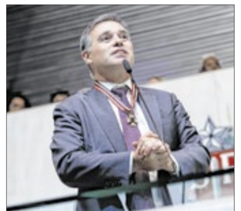
André Mendonça durante discurso após receber o Colar de Honra ao Mérito Legislativo