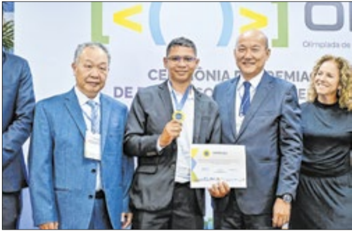
Professor participará de um intercâmbio