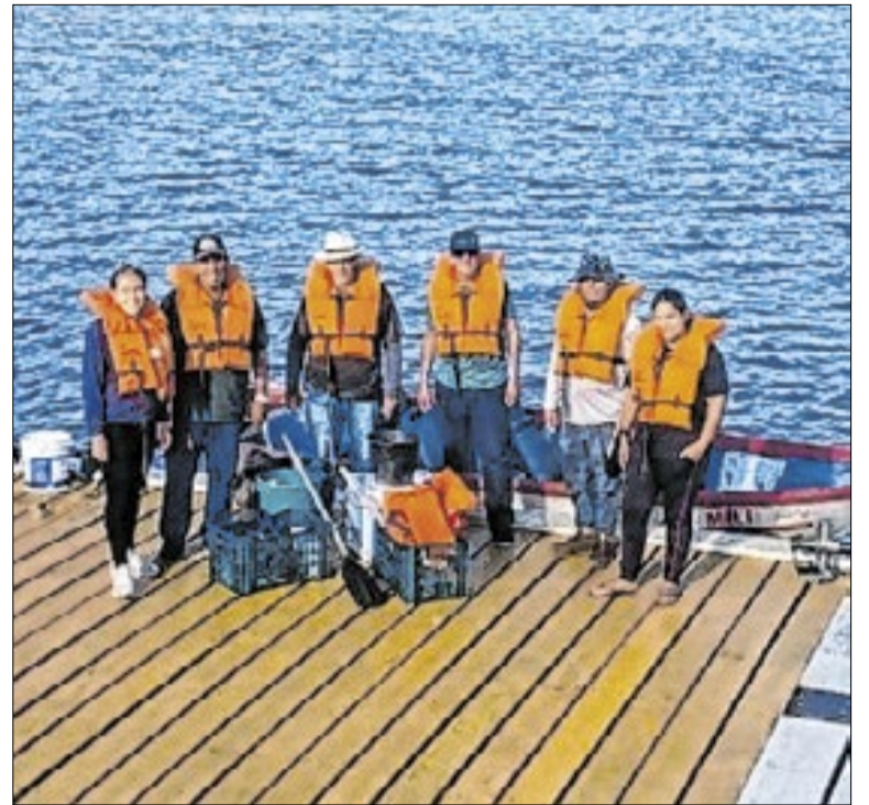
Monitoramento garante segurança na produção de ostras