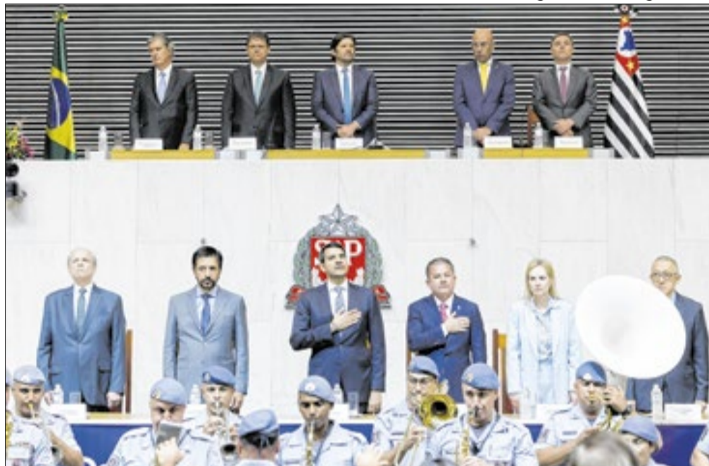
Ao lado das maiores autoridades paulistas, André Mendonça disse sentir a necessidade de, diante de discursos tão elogiosos, firmar um compromisso para fazer jus às homenagens