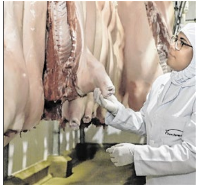
Carne suína é um dos produtos que o Acre exporta

A prefeitura de Porto Velho (RO), por meio da Secretaria Municipal de Segurança, Trânsito e Mobilidade (Semtran), apresenta seu projeto de mobilidade urbana com ônibus elétricos em um dos principais encontros da América Latina sobre mobilidade sustentável, o LATAM Mobility & Net Zero Brazil 2026.