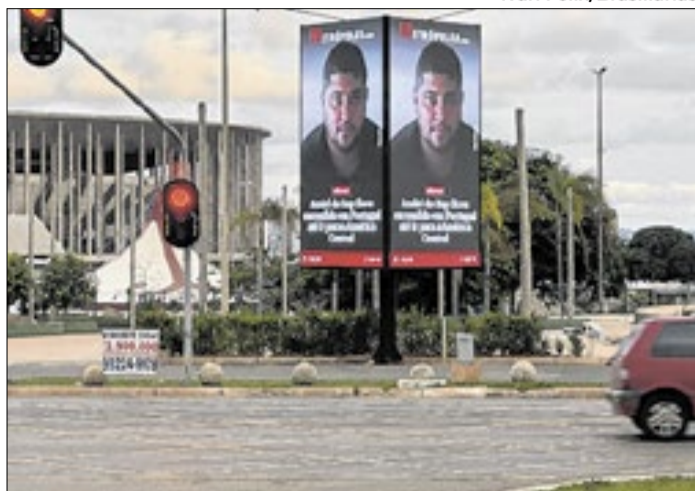
Painéis de LED irregulares, como esses do Metrôpoles