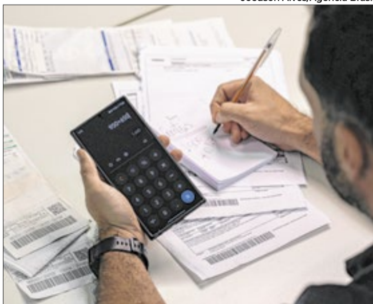
Comprometimento com dívida impede percepção de melhora