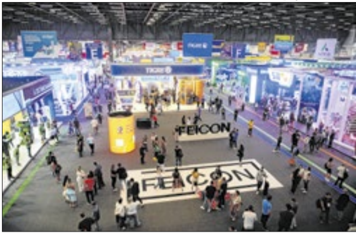
Feira da Construção Civil deve receber 100 mil pessoas