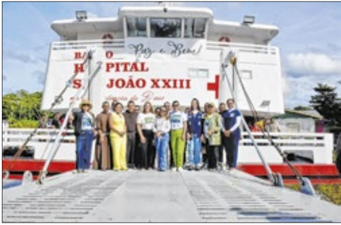
Semana de Saúde é promovida pelo CNJ