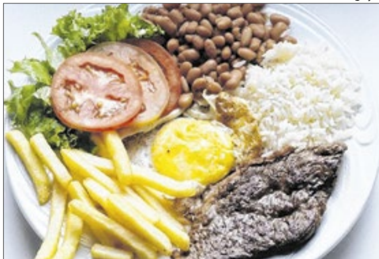
Paulistano gasta entre R$ 36,74 e R$ 71,39 no self-service.