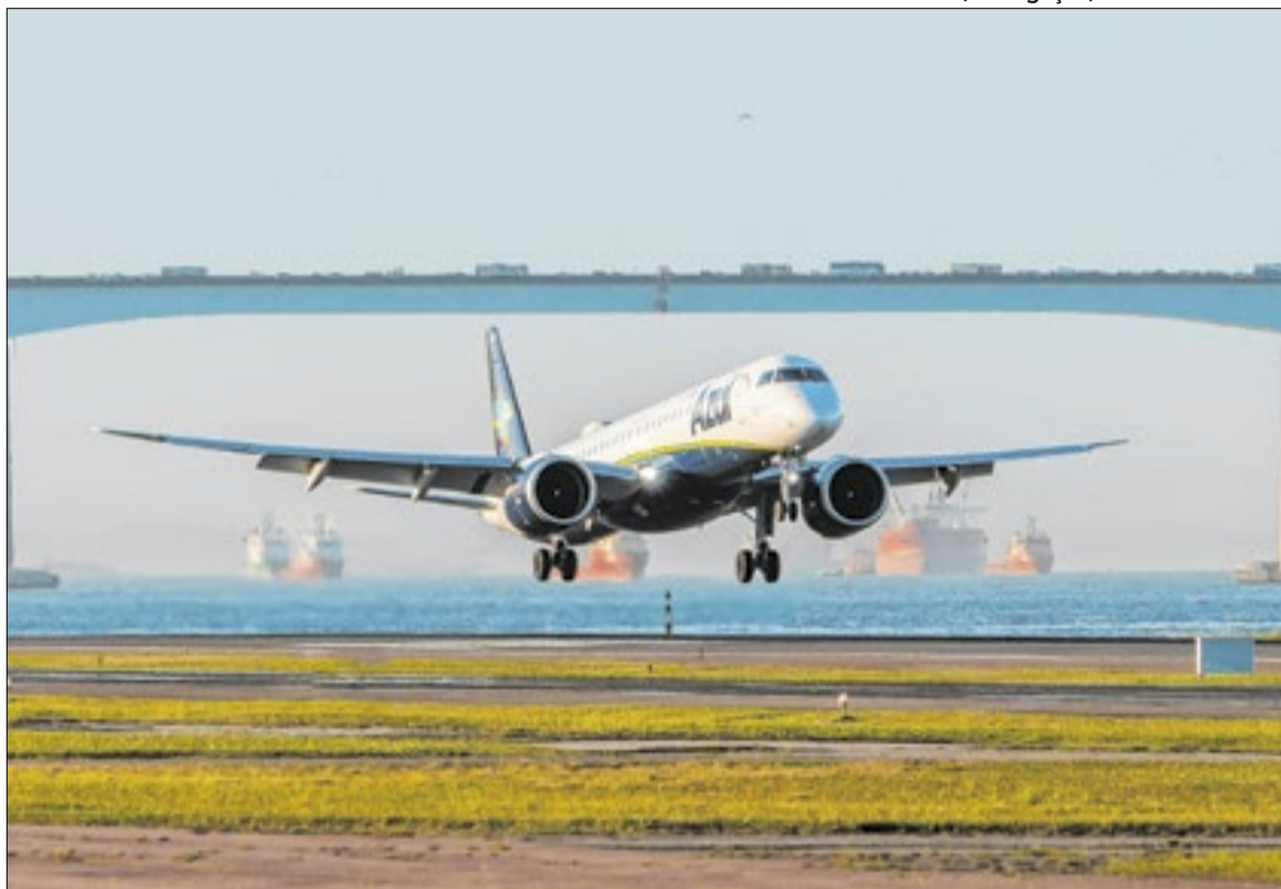
E2, fabricado no Brasil pela Embraer, é operado pela companhia aérea Azul

O mercado reagiu positivamente à mudança, projetando efeitos restritos para a Embraer, mas melhora na gestão econô-