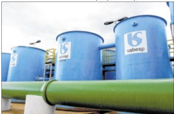
Estação de tratamento de água no Rio Jundiá

Gilberto Marques (30.06.2009) / Governo de SP