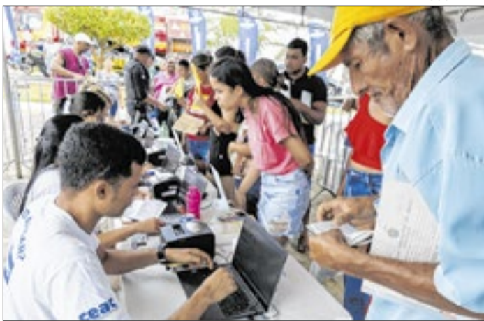
Caravana itinerante já percorreu 70 dos 75 municípios