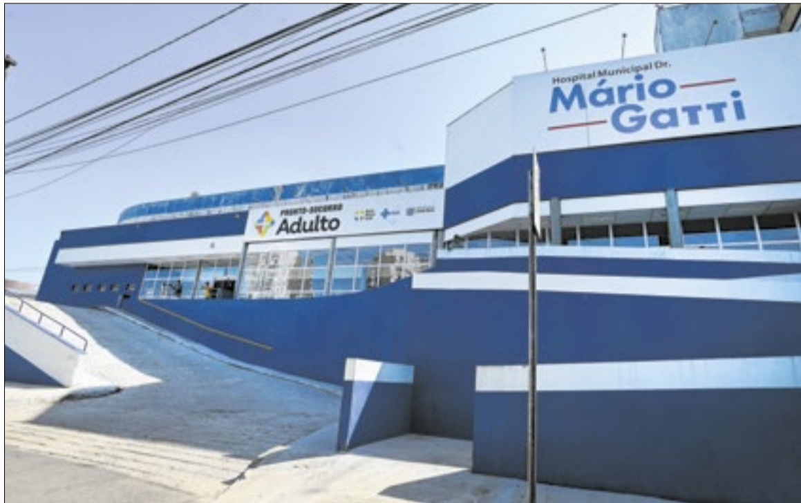
Carlos Bassan/Prefeitura de Campinas

De acordo com a Rede Mário Gatti, a normalização do atendimento está prevista para ocorrer em até 30 dias, prazo que começou a contar em 14 de março, quando tiveram início as obras de reforma da UTI. A intervenção já está na segunda fase: um setor com sete leitos foi concluído, enquanto os trabalhos avançam