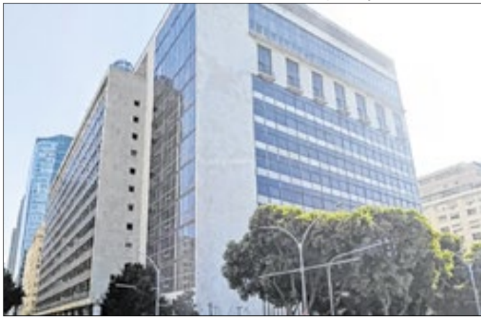
Prédio do Jockey, usado na quitação de dívida com a prefeitura