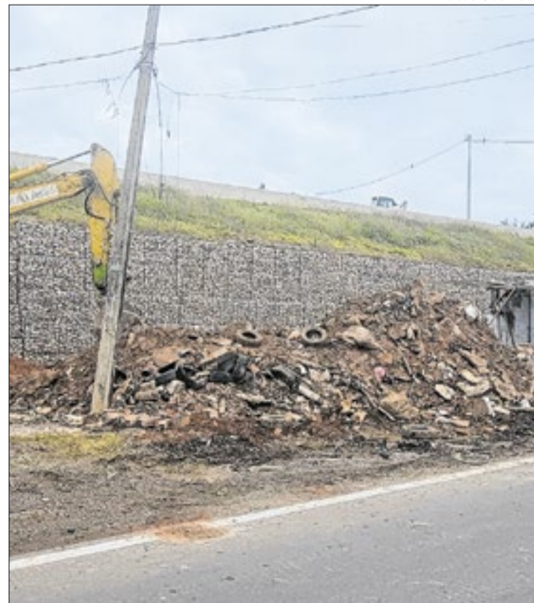
Moradias, às margens da Miguel Melhado, foram removidas

A estrada foi duplicada, e às margens, onde os moradores foram desalojados, será construída uma ciclovia. O Correio da Manhã entrou em contato com o órgão, mas, até o fechamento desta reportagem, não obteve resposta. Já a Prefeitura - em relação ao papel social - informou que, “por meio da Secretaria de Habitação, ofereceu auxílio-moradia às famílias que precisaram deixar a área”.