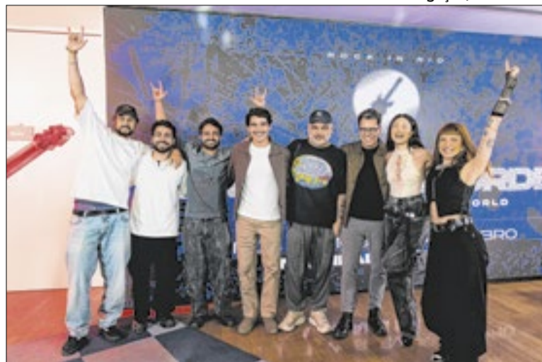
Coletiva anunciou as atrações do palco eletrônico

O line-up foi pensado para manter a energia da pista do início ao fim de cada noite, com uma novidade nesta edição: os Special Openings,