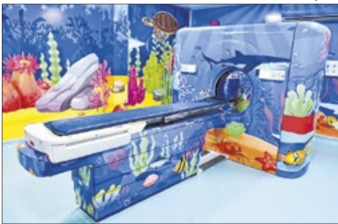
Sala de Tomografia remete ao fundo do mar