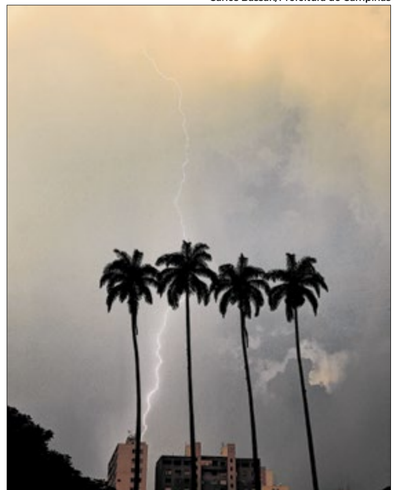
Temporal com raios atingiu Campinas na noite desta segunda

“A Terra já aqueceu quase 1,5°C nos últimos 100 anos. Então, quanto mais quente estiver o ambiente, maior a chance de formar tempestades e, assim, aumentar a atividade de raios”, afirma o pesquisador do INPE Kleber Naccarato. Estimativas atualizadas da unidade de pesquisa do Ministério da Ciência, Tecnologia e Inovação indicam que, para cada 1°C de aumento na temperatura média global, a incidência de raios pode crescer de 15% a 40%. Segundo Naccarato, um raio pode causar parada cardiorespiratória em pessoas expostas, incêndios em áreas de vegetação, danos a linhas de transmissão e distribuição, equipamentos, além de interromper serviços como fornecimento de energia e tráfego aéreo.