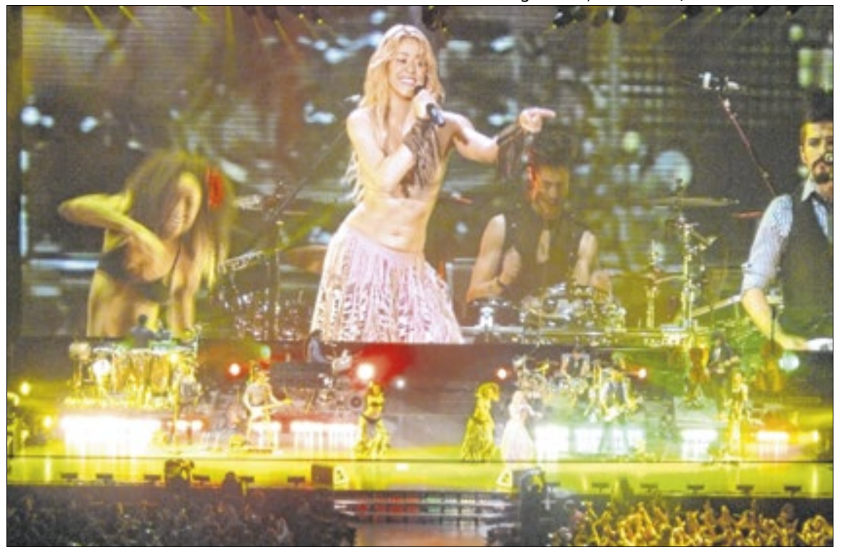
Artista colombiana se apresenta no 'Todo Mundo no Rio', em maio

Ao longo da faixa de areia, na área em frente ao palco, também serão instaladas 16 torres com som e vídeo, permitindo que a apresentação seja acompanhada por quem estiver mais distante da estrutura principal. Cada telão de LED terá 45 metros quadrados, ampliando a visibilidade do espetáculo para os fãs espalhados por toda a praia.