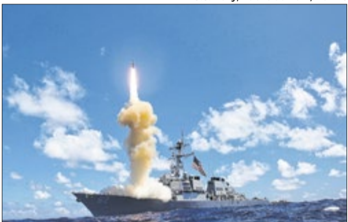
Guerra ao Irã impactará agricultura