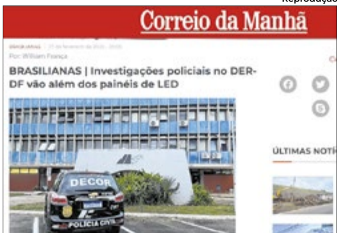
Uma das páginas de "Brasilianas", no portal do CM