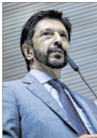
Ricardo Nunes, prefeito de São Paulo, esteve presente na homenagem