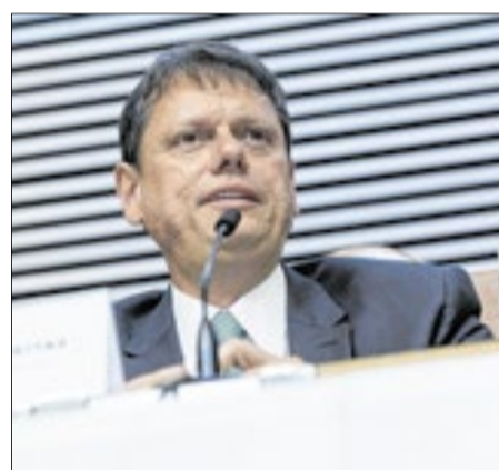
O governador de São Paulo, Tarcísio de Freitas, enfatizou o papel do sistema de justiça no progresso e no desenvolvimento do país