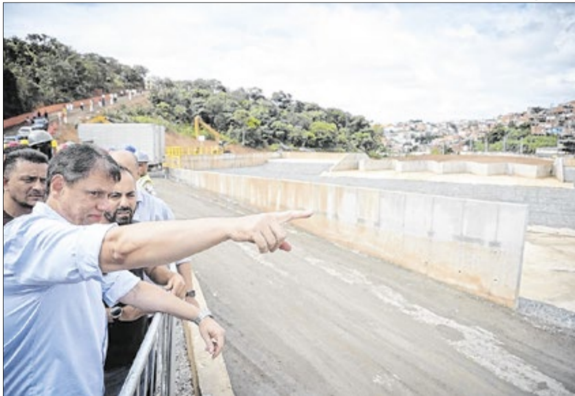
Estrutura do reservatório terá capacidade para armazenar 340 mil metros cúbicos de água

“Entregamos hoje o reservatório TG-09, depois de inaugurarmos dois piscinões importantes, o EU-08 e o EU-09, no ano passado. O TG-09 é o maior de