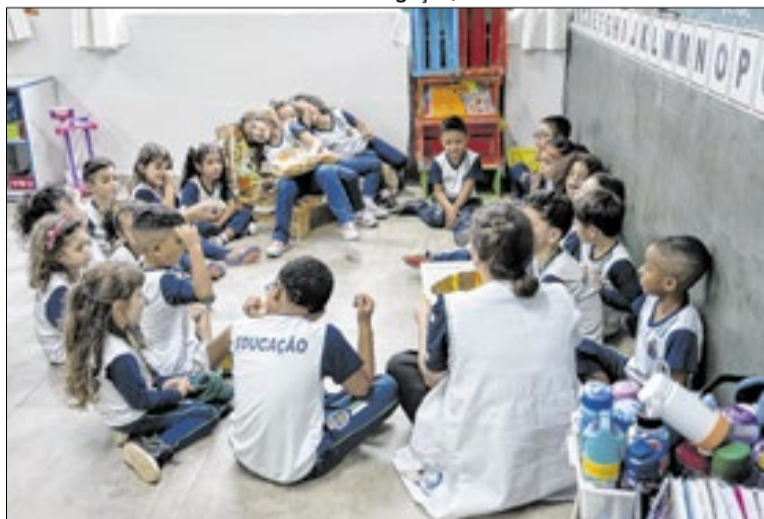
A cidade alcançou 71% de taxa de alfabetização

São Caetano também superou os resultados nacional e estadual. No cenário federal, o Brasil atingiu 66% de crianças alfabetizadas em 2025, acima da meta