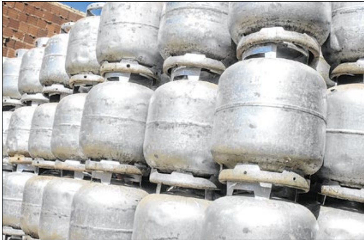
Botijão de 13kg custa, em média, R$ 110. Medida visa equiparar preço do importado ao nacional

O governo também publicou decreto zerando as alíquotas de PIS e Cofins sobre o biodiesel, que atualmente compõe 15% da mistura do diesel vendido nos postos. A medida deve gerar re-