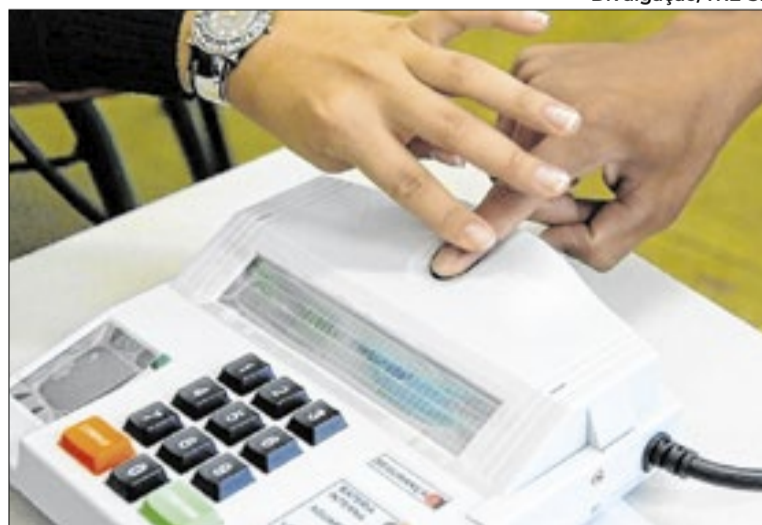
TRE-SP registrou mais de 230 mil atendimentos ao eleitorado

Em São Paulo, até 30 de abril, é possível buscar atendimento presencial para operações do título ou cadastro da biometria, mediante agendamento prévio, em qualquer cartório, independentemente da zona eleitoral à qual o documento está vinculado. Ao acessar a página, basta selecionar "Novo Agendamento", escolher o município ou realizar a busca por CEP e, com a respectiva zona eleitoral selecionada, verificar a disponibilidade de vagas. Já no período de 1º a 6 de maio, o atendimento será realizado exclusivamente por ordem de