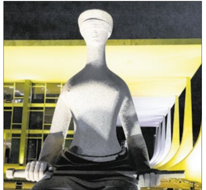
STF pode definir como serão eleições no Rio hoje

A Etiópia, por exemplo, importa mais de 90% do fertilizante que usa na sua agricultura do Golfo Pérsico. O momento do plantio é agora. Se não houver fertilizante, significará ausência de alimentos. Fome. Graves problemas humanitários. Com a experiência de ex-ministra, Tereza Cristina está preocupada.