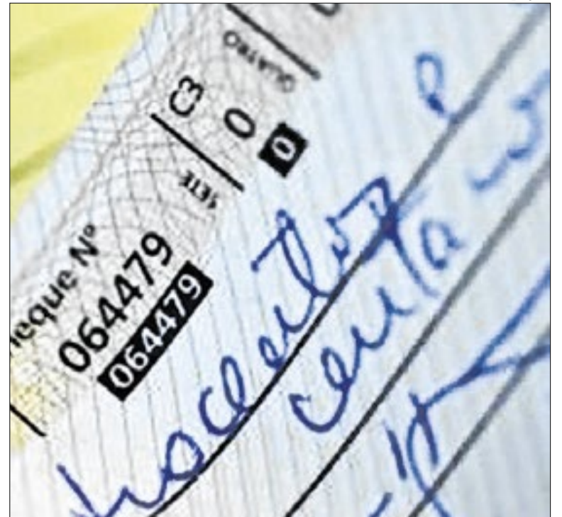
Cheque perdeu espaço para meios eletrônicos, mas segue vivo

O Tribunal de Contas da União (TCU) aprovou a prorrogação da concessão da Light, no Rio de Janeiro, por mais 30 anos. O contrato atual foi firmado em 1996 e tem validade até junho de 2026. A nova concessão prevê movimentação econômica de quase R$ 600 bi, ainda sujeita ao aval final do Ministério de Minas e Energia.