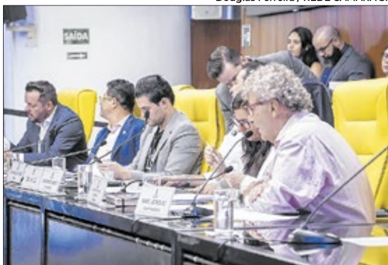
Relator deve enviar informações ao Ministério Público

O depoente afirmou que a maior parte das unidades foi adquirida por famílias interessadas na casa própria, embora também tenham ocorrido vendas para investidores, especialmente em