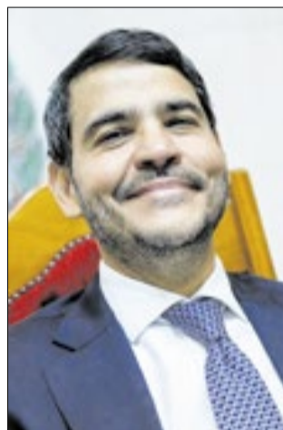
Ministro da Advocacia-Geral da União, Jorge Messias prestigiou a homenagem