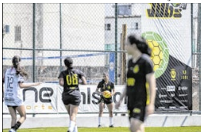
Maior competição de futebol universitário começou