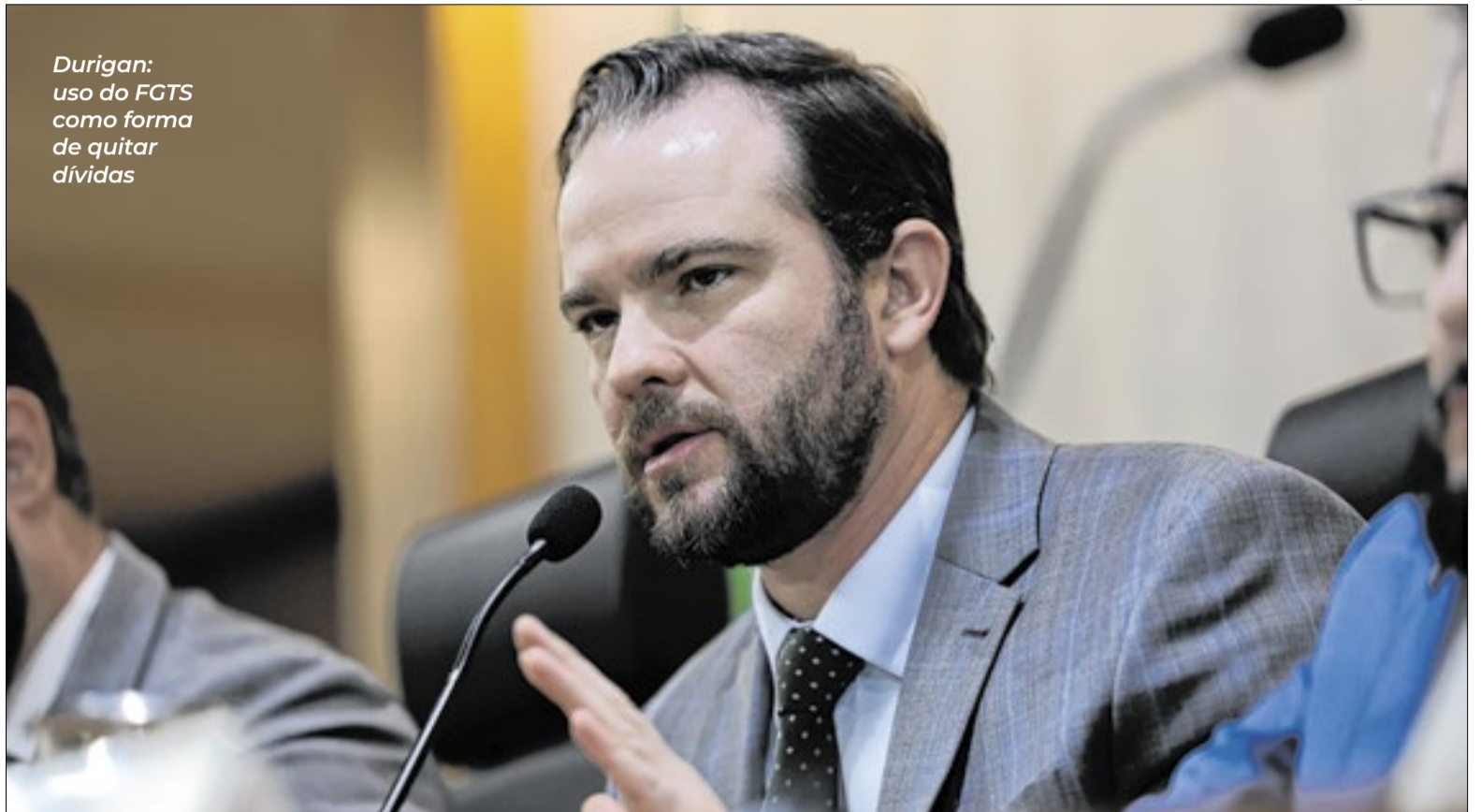
Durigan: uso do FGTS como forma de quitar dívidas

No entanto, o governo tem focado em medidas de cunho econômico porque passam a ter efeito imediato na vida da população, diferentemente de ações para melhorar na segurança pública, que exigem planejamento e execução com prazos maiores”, ele avaliou.