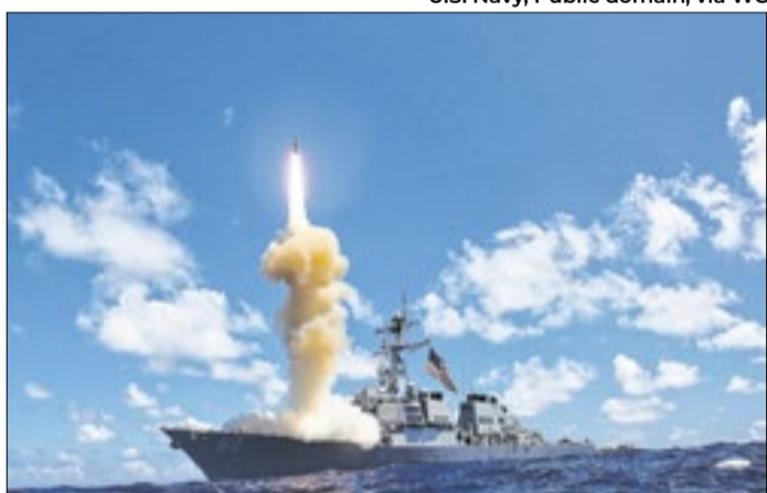
Guerra ao Irã impactará agricultura