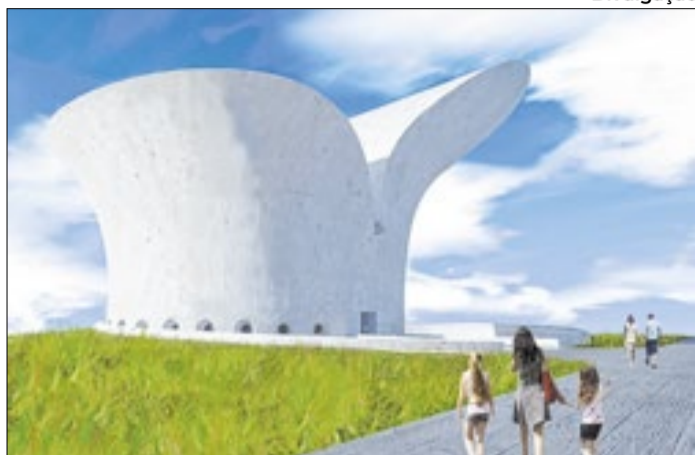
O projeto arquitetônico do Museu da Bíblia