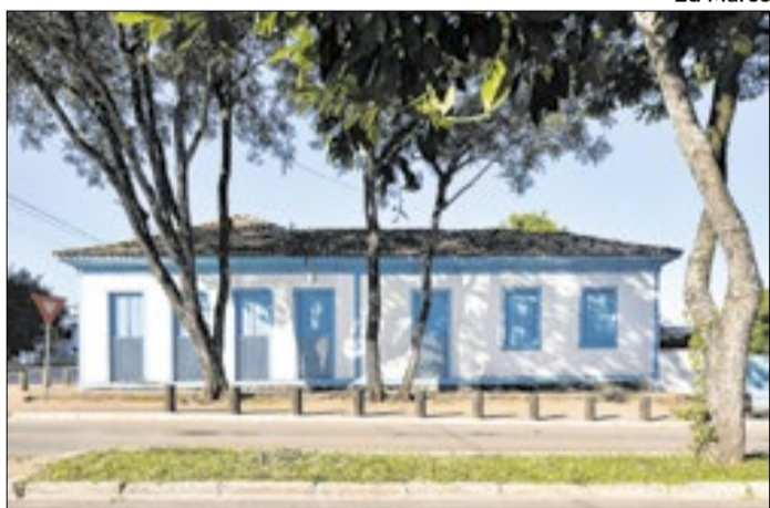
O Museu Histórico e Artístico de Planaltina (MHAP)