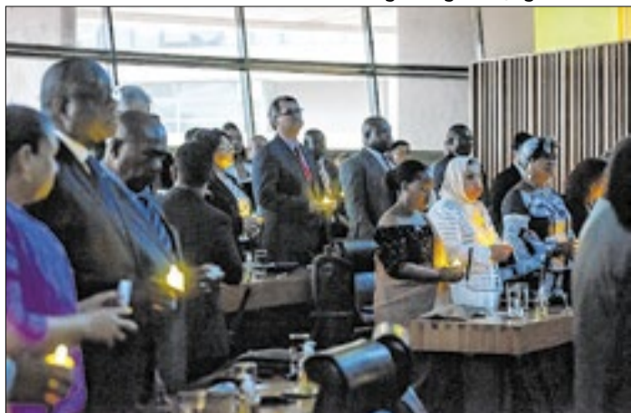
Sessão marca os 32 anos do massacre tutsi