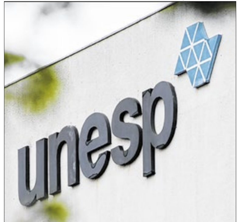
O Manual do Candidato traz as informações necessárias

A Seduc-SP lançou o Almoxarifado Virtual, sistema online para pedidos e gestão de materiais nas escolas estaduais. Inspirado em plataformas de comércio eletrônico, permite solicitar produtos de limpeza, escritório e gêneros alimentícios com mais agilidade e transparência. Primeiros pedidos vão de 1º a 9 de abril.