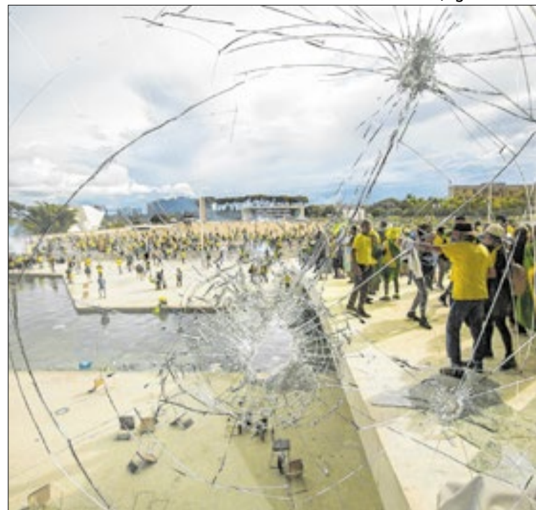
Condenação reabre a polémica sobre o 8 de janeiro

No fim, é mais um capítulo de cada vez maior impasse entre proteção ambiental e desenvolvimento. Durante anos, o mundo avançou sem se preocupar com isso. Paga hoje o preço real da destruição. Por um lado, tenta pisar no freio. Por outro, considera manter o acelerador. No meio disso tudo, nós, os seres humanos.