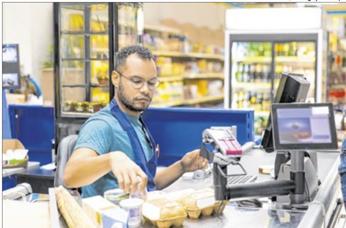
Caixa de Supermercado

Segundo a entidade, “a indústria tende a ser um dos seg-