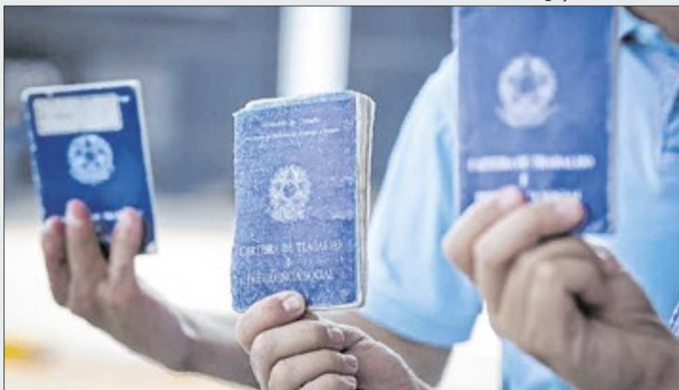
Estado criou 37,5% do total de vagas com carteira assinada do país em fevereiro

São Paulo criou quase 96 mil oportunidades de emprego com carteira assinada em fevereiro, o equivalente a 3,4 mil vagas por dia. Os dados são da Fundação Seade, com informações do Caged.