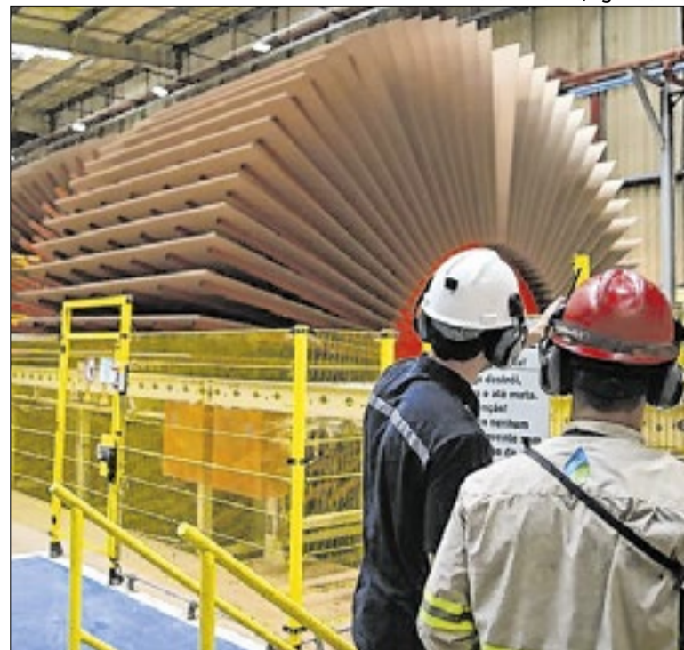
Campo Grande lidera as contratações entre os municípios

A prefeitura de Três Lagoas (MS) lançará, na quarta-feira (8), às 8h, no Sebrae, o Programa Pró-Inova Três Lagoas, voltado ao estímulo ao empreendedorismo e à inovação. A ação inclui assinatura de projeto de lei que cria política municipal para apoiar startups, novos negócios e iniciativas de tecnologia.