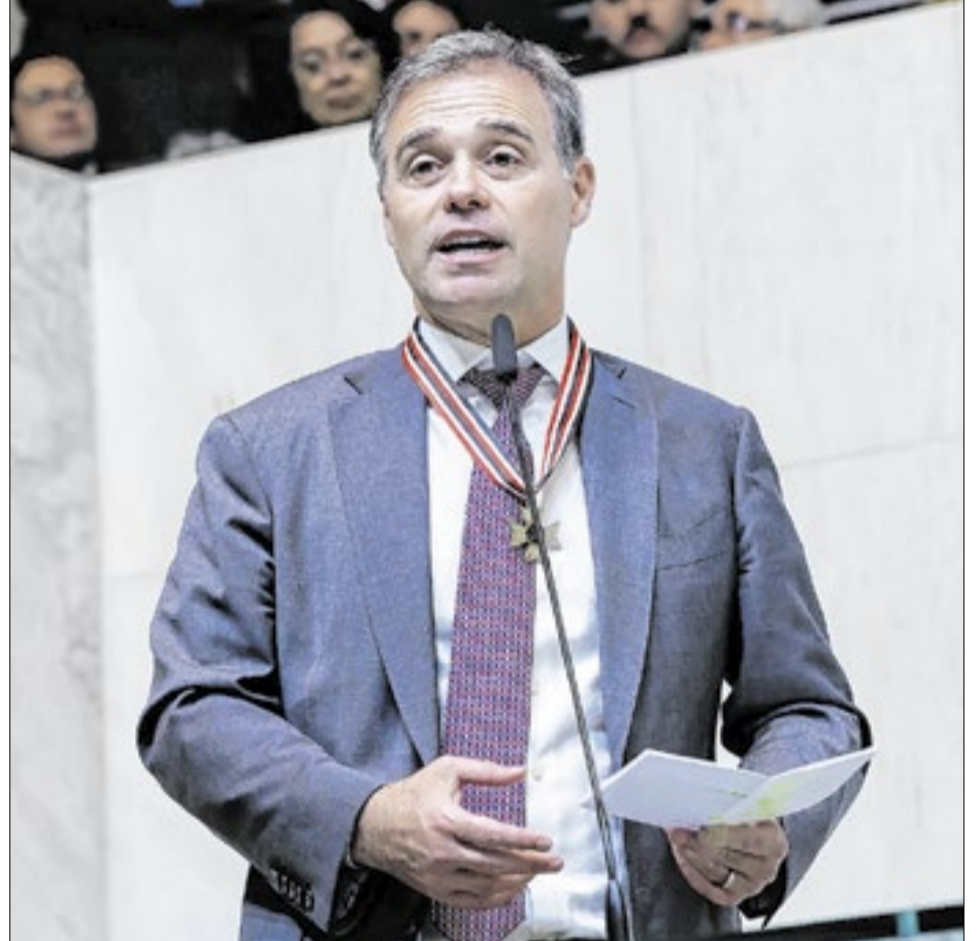
Sessão Solene reuniu autoridades no plenário da Assembleia