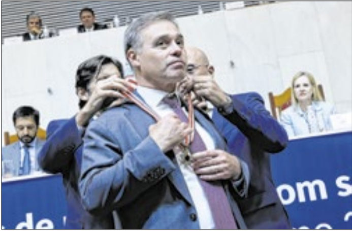
Ministro André Mendonça recebe honraria da Alesp