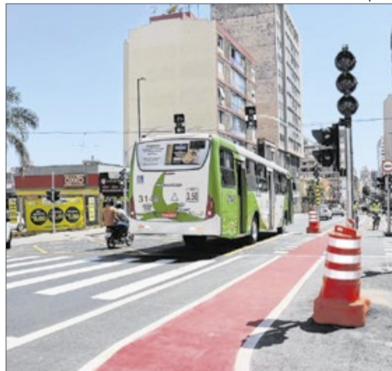
Colegiado critica extensão contratual por até três anos

A população de Campinas assiste, atônita, a essa política miúda, onde as secretarias viram moeda de troca e o plenário vira palco de homenagens vazias, enquanto os problemas estruturais da cidade permanecem intocados. Será que há consciência do que fazem?