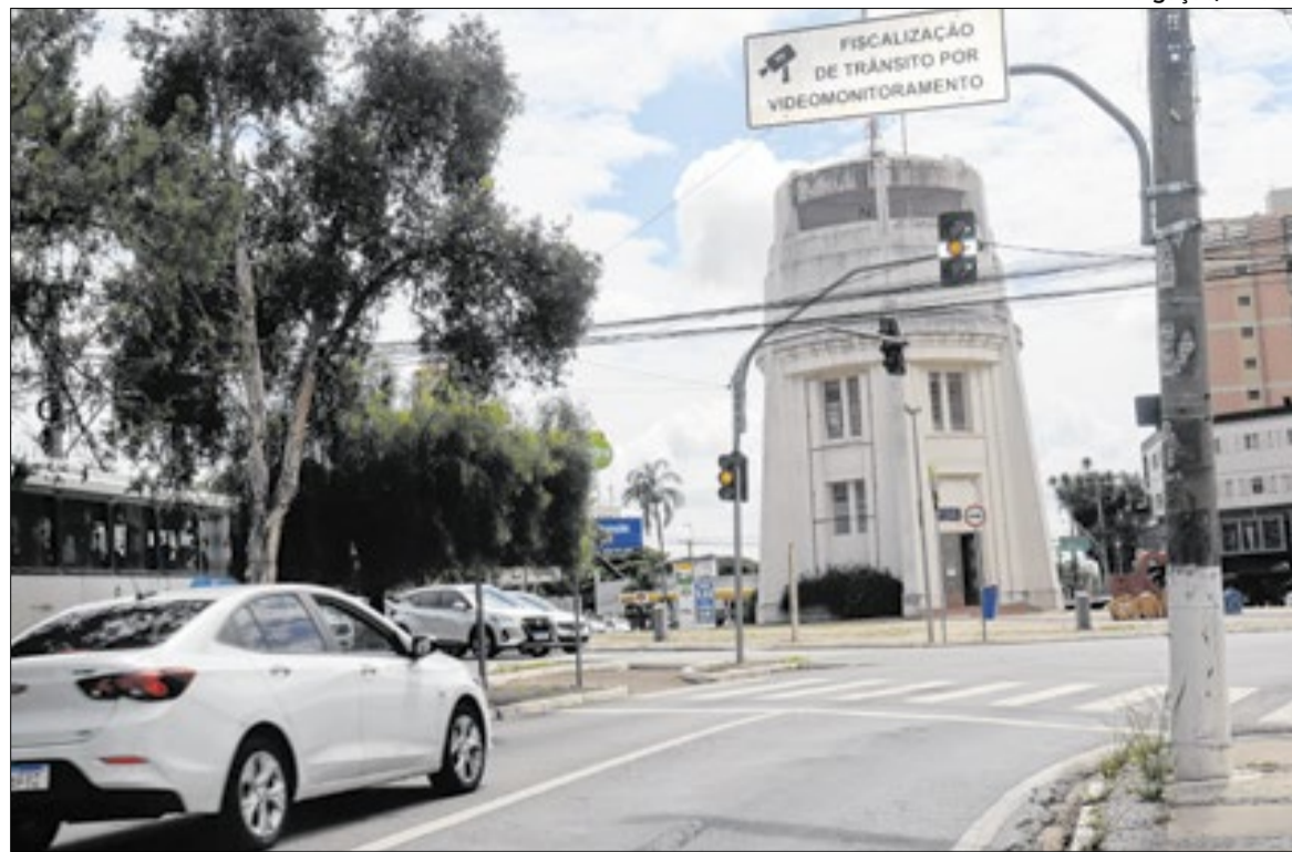
Câmeras e fiscalização eletrônica monitoram irregularidades em pontos estratégicos

Além da fiscalização, o sistema de câmeras também permite o monitoramento em tempo real das condições viárias. Entre as ocorrências acompanhadas estão falhas na infraestrutura, necessidade de manutenção semaforica, veículos quebrados e registros de sinistros de trânsito. Empatia e respeito regem os direitos de idosos e pessoas com deficiência.