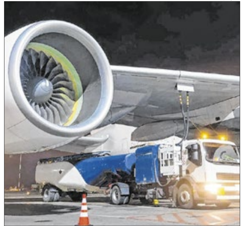
Governo também anunciou créditos de R$ 3,5 bi para aéreas

A Raia Drogasil anunciou a distribuição de R$ 150,4 milhões em juros sobre capital próprio (JCP) aos acionistas. O valor bruto será de R$ 0,08 por ação, sem atualização monetária, e será pago até 1º de dezembro de 2026, com data exata a ser definida. A data para ter direito ao provento é 06 de abril.