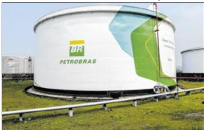
Diesel é vendido a 77% abaixo do valor internacional