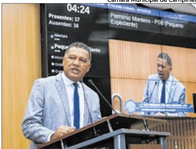
Para Permissão, medida é necessária para inclusão