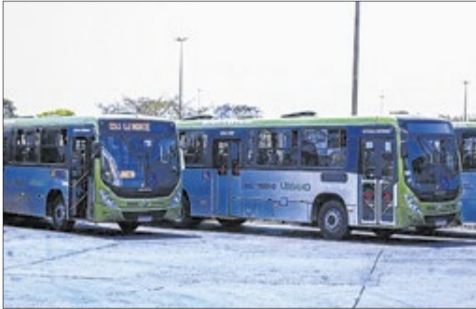
Investimento prevê 65 ônibus Euro 6 e 83 ônibus elétricos