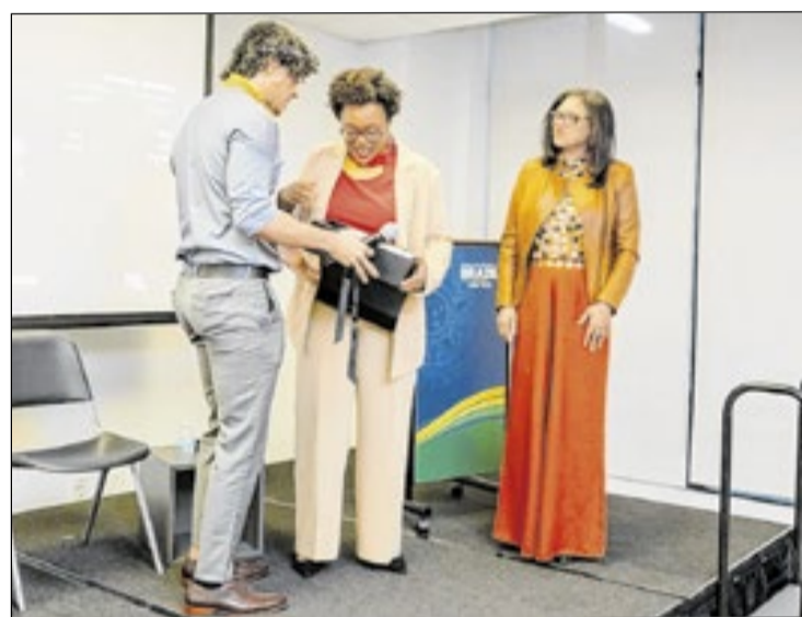
A vereadora foi homenageada em evento que reconhece lideranças negras brasileiras com projeção internacional