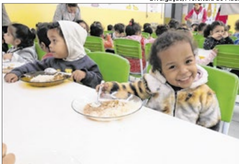
Ação visa abordar a importância de uma alimentação saudável

Durante esse período, o cardápio das escolas vai passar a contar com novidades, como a inclusão do jiló e da goiaba vermelha. Os alimentos escolhidos procuram incentivar a diversificação alimentar e ampliar o repertório nutricional dos alunos. O jiló será a guarnição das refeições. Já a goiaba vermelha será servida na forma de vitamina para os alunos.