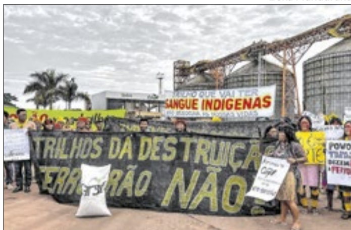
Indígenas protestam contra a Ferrogrão