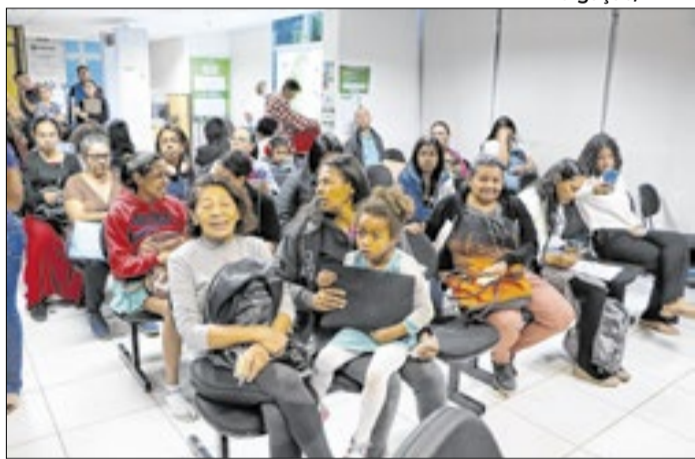
Ação da Defensoria oferece serviços gratuitos nesta terça