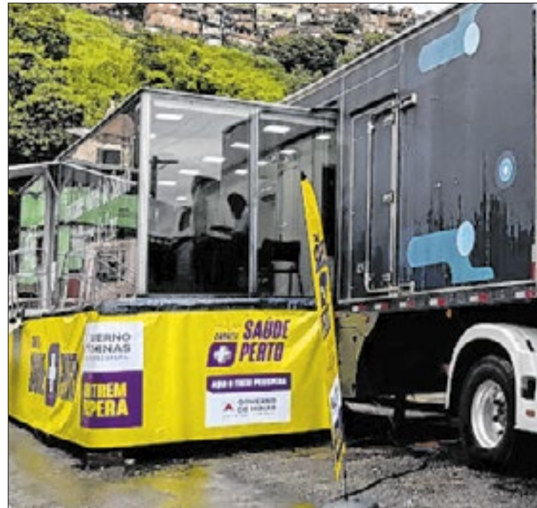
Estratégia visa aproximar atendimento da população

Já no indicador de vítimas fatais, houve uma redução de 18,75%, passando de 16 vítimas para 13. Já para os casos de infrações por embriaguez ao volante houve crescimento no número de condutores autuados, passando de 535 para 669 (25,05%), sendo que 12 deles foram presos em flagrante.