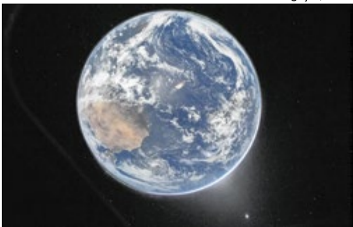
Planeta Terra foi fotografado pela tripulação da Artemis II