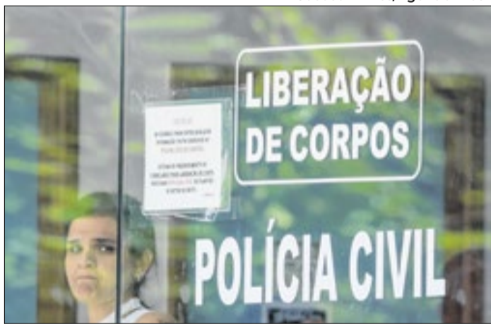
Corporação será responsável pela perícia do material