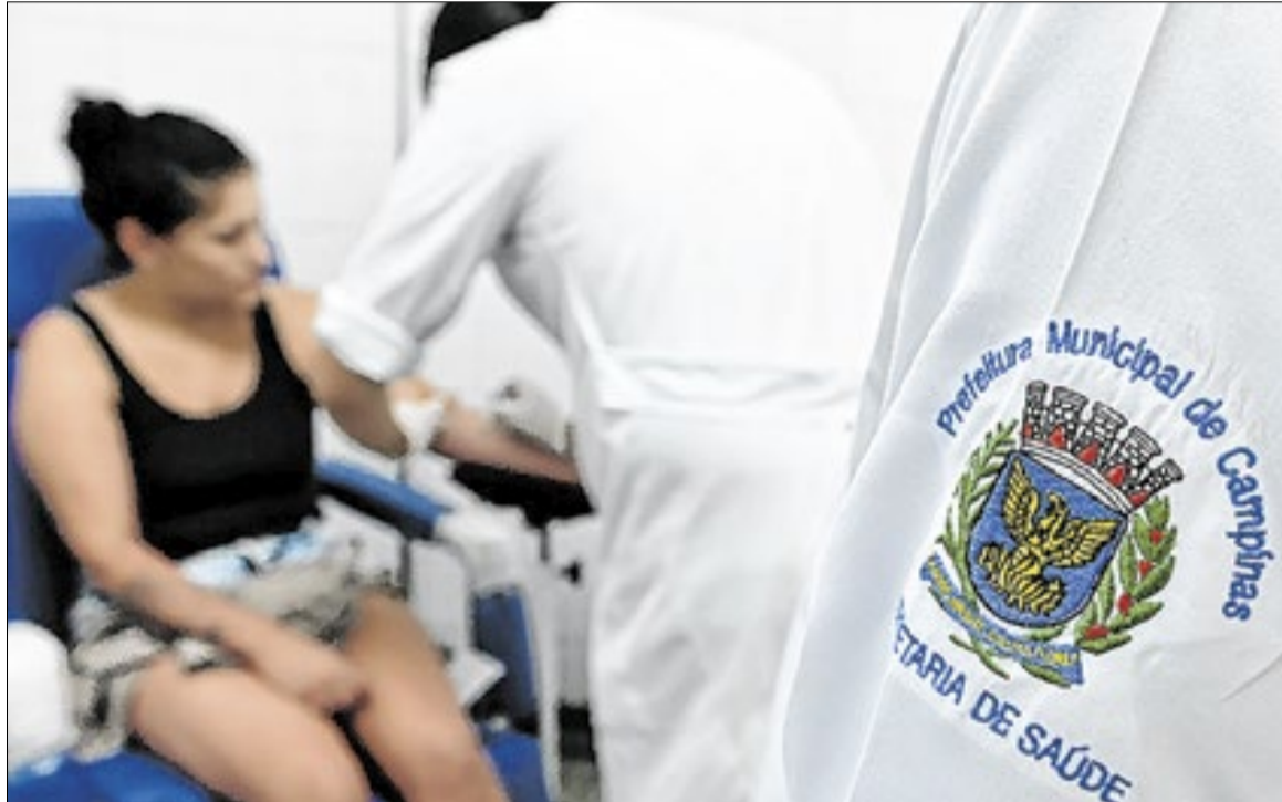
Experiências em Campinas ajudaram a inspirar a criação do Sistema Único de Saúde