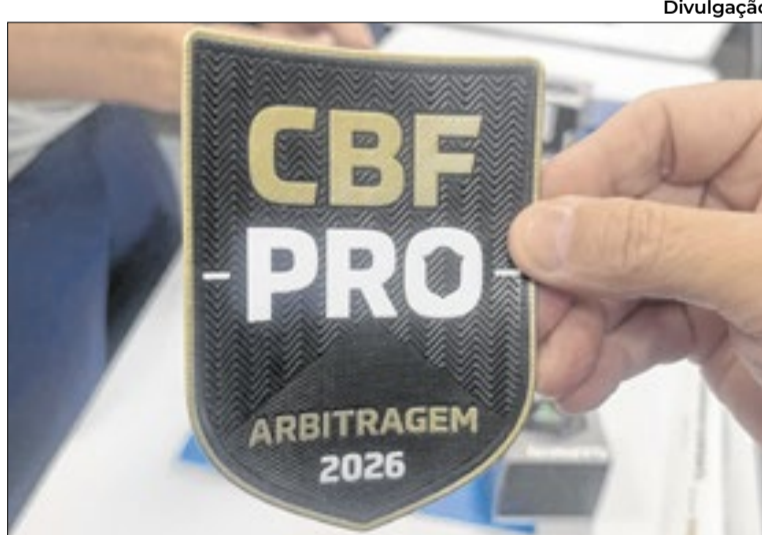
Último final de semana foi histórico para a arbitragem brasileira

Desde a última terça-feira (31/3), os profissionais da Arbitra-