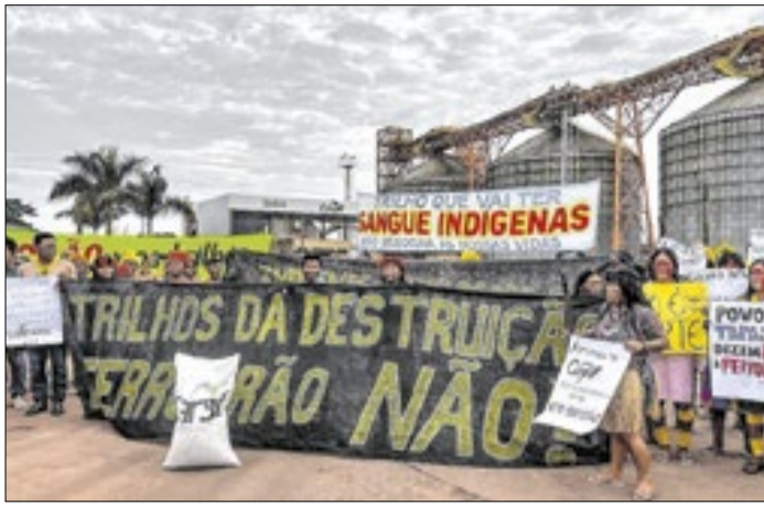
Indígenas protestam contra a Ferrogrão