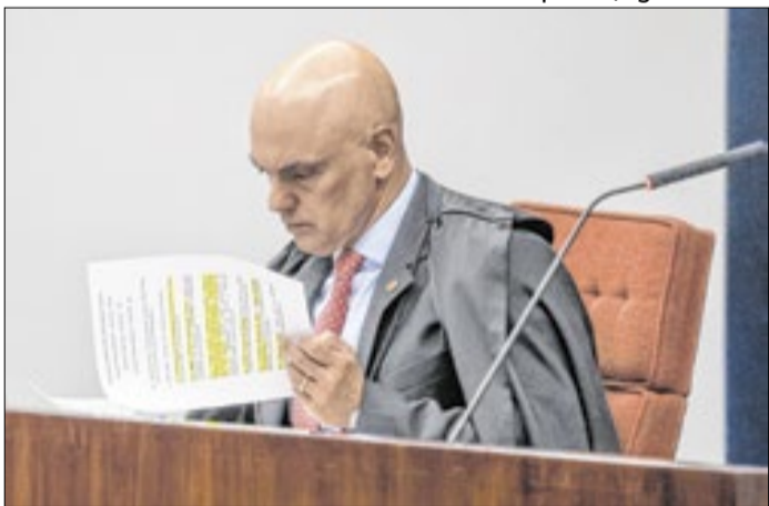
Moraes posicionou-se a favor da redução do parque