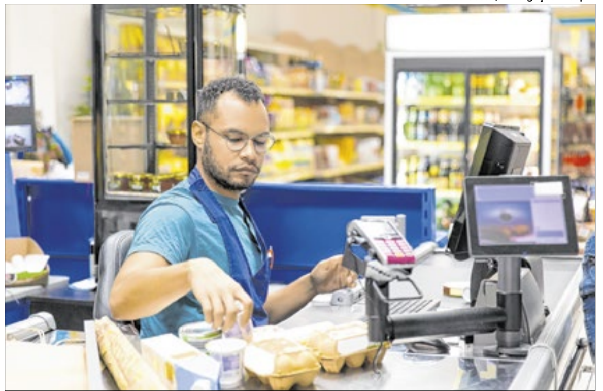
Caixa de Supermercado

Segundo a entidade, “a indústria tende a ser um dos seg-