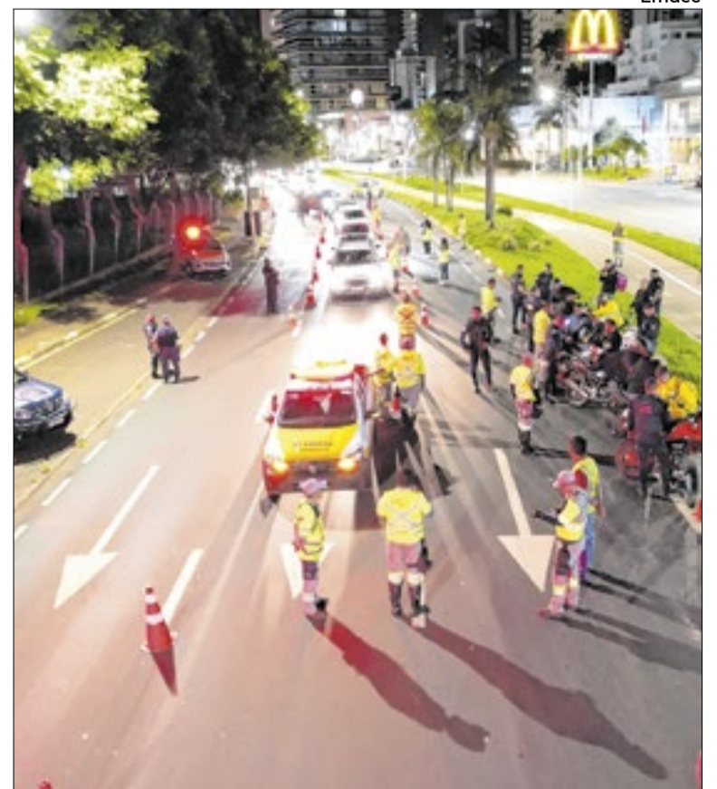
Das 152 autuações, quatro por direção sob influência de álcool

A intensificação do monitoramento nas vias de Campinas fundamenta-se nos indicadores de fatalidade colhidos em 2025. O levantamento sobre as mortes em vias urbanas demonstrou que o consumo de álcool associado à condução de veículos foi o fator de risco com maior incidência nos óbitos analisados, superando o excesso de velocidade. As operações de bloqueio visam o controle dessas condutas para a redução de colisões e o aumento da segurança para pedestres e motoristas no perímetro municipal.