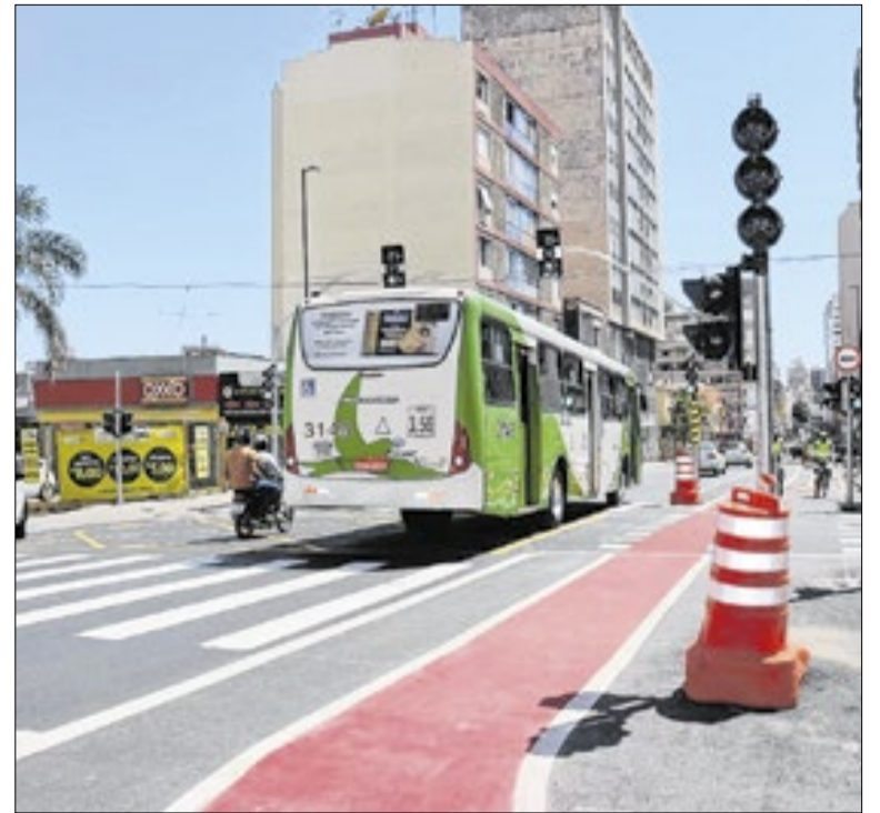
Colegiado critica extensão contratual por até três anos

A população de Campinas assiste, atônita, a essa política miúda, onde as secretarias viram moeda de troca e o plenário vira palco de homenagens vazias, enquanto os problemas estruturais da cidade permanecem intocados. Será que há consciência do que fazem?