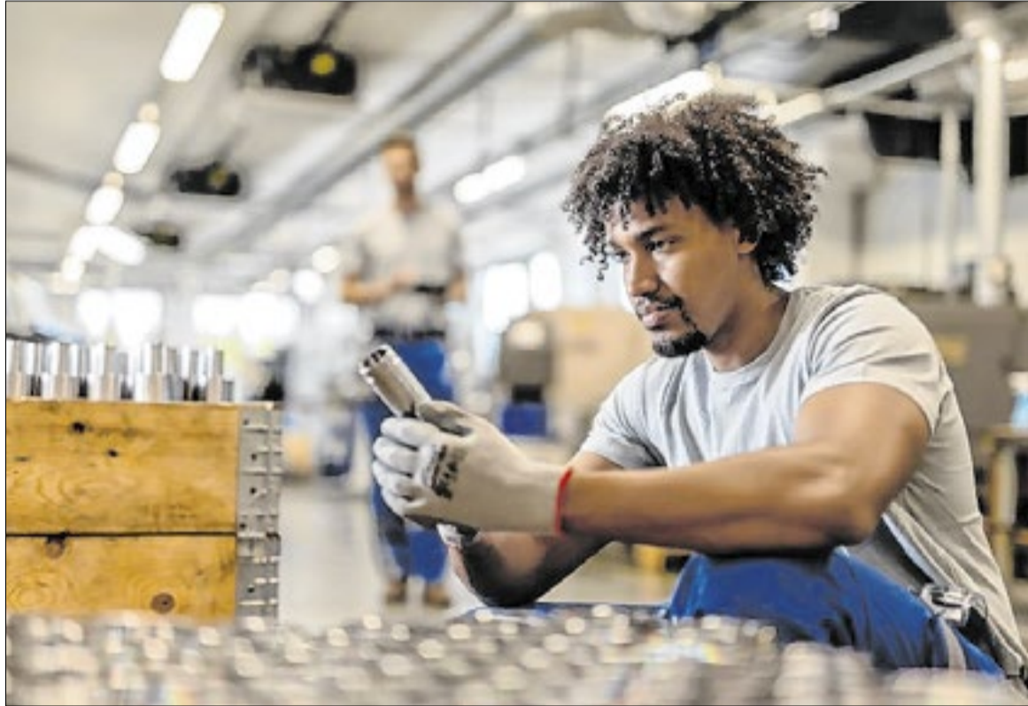
Em fevereiro, São Paulo respondeu por 37,5% das vagas com carteira assinada criadas no país

Os números também evidenciam o protagonismo do estado no cenário nacional. Em fevereiro, São Paulo respondeu por 37,5% de todas as vagas com carteira assinada criadas no país. No acumulado do primeiro bi-