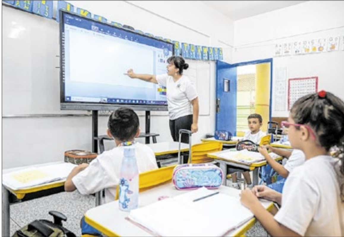
Profissionais da educação serão beneficiados com o pagamento de R$ 33 milhões de dívida

A Prefeitura pretende gastar cerca de R$ 46 milhões para conseguir quitar essa dívida. Nesse valor estão incluídos agentes da GCM (Guarda Civil Municipal), além de servidores da ativa e aposentados que passaram a ter direito à progressão em 2024 e 2025. Parte desses pagamentos já começou em fevereiro. A maior parte desse valor está relacionada ao congelamento das progressões dos professores, que agora começam a receber os valores que fica-