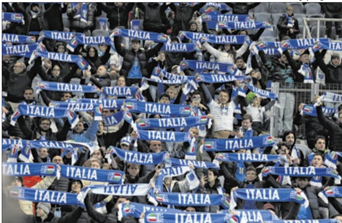
‘Toda essa mitologia da Itália nas Copas parece algo impossível’, diz torcedor de 14 anos

“Foi uma sensação de desilusão, mas não de tristeza. No fundo, sabia que não venceríamos. Quando me