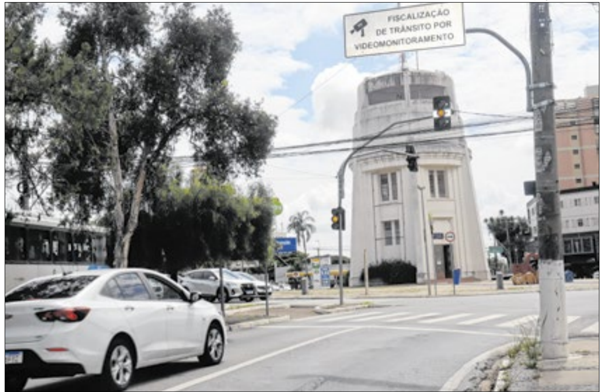
Câmeras e fiscalização eletrônica monitoram irregularidades em pontos estratégicos

Fiscalização se concentra em vias com alto fluxo e pontos críticos da cidade