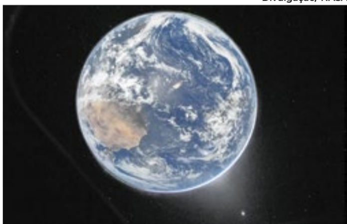
Planeta Terra foi fotografado pela tripulação da Artemis II