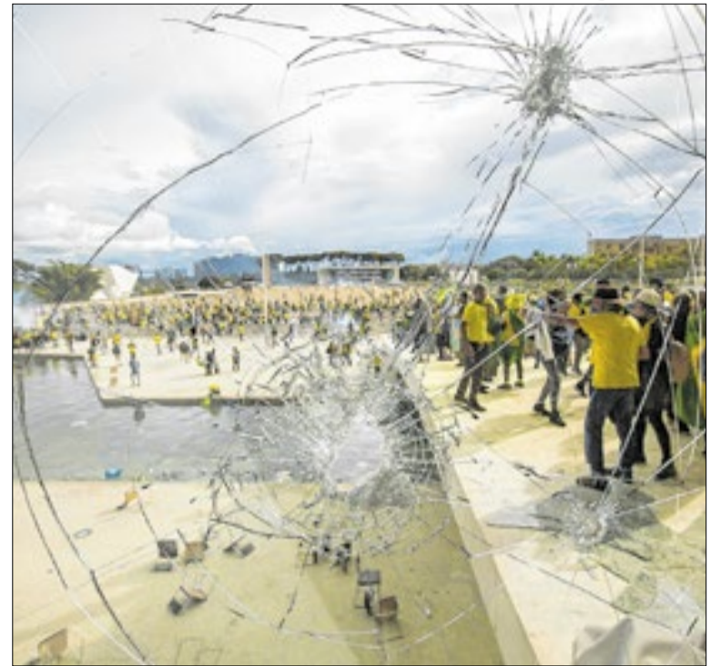
Condenação reabre a polémica sobre o 8 de janeiro

No fim, é mais um capítulo do cada vez maior impasse entre proteção ambiental e desenvolvimento. Durante anos, o mundo avançou sem se preocupar com isso. Paga hoje o preço real da destruição. Por um lado, tenta pisar no freio. Por outro, considera manter o acelerador. No meio disso tudo, nós, os seres humanos.