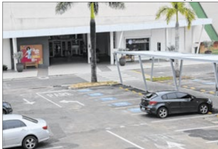
Empatia e respeito são os princípios que regem os direitos

Empatia e respeito são princípios que regem os direitos dos idosos e das pessoas com deficiência no trânsito. Para garantir que essas pessoas tenham seus direitos de deslocamentos garantidos, a Empresa Municipal de Desenvolvimento de Campinas (Emdec) realiza a fiscalização do uso das vagas exclusivas.