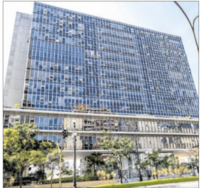
Audiência pública na Câmara será na próxima quarta (8)