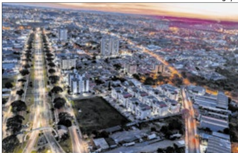
Município é a 7ª mais feliz do país e 2ª do Estado de São Paulo

O levantamento adaptou indicadores internacionais à realidade brasileira para avaliar qualidade de vida e bem-estar. Foram considerados fatores como renda, saúde, segurança, apoio social, liberdade de escolha, confiança nas instituições, participação comunitária e condições urbanas. Americana obteve nota 8,84, avanço significativo em relação