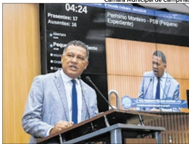
Para Permínio, medida é necessária para inclusão