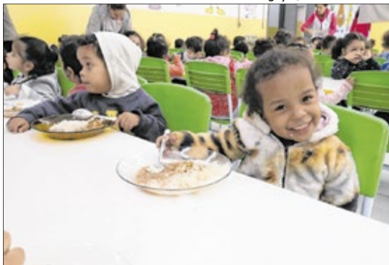
Ação visa abordar a importância de uma alimentação saudável

Durante esse período, o cardápio das escolas vai passar a contar com novidades, como a inclusão do jiló e da goiaba vermelha. Os alimentos escolhidos procuram incentivar a diversificação alimentar e ampliar o repertório nutricional dos alunos. O jiló será a guarnição das refeições. Já a goiaba vermelha será servida na forma de vitamina para os alunos.