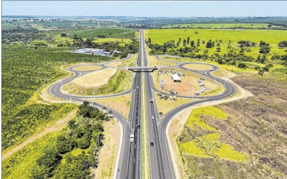
Projeto deve gerar cerca de 11 mil empregos e beneficiar 22 municípios da região de Campinas

A criação da ciclovia surgiu a partir de sugestões apresentadas durante consultas e audiências públicas realizadas no processo de concessão. As contribuições de moradores, gestores públicos e especialistas foram avaliadas por órgãos como a Artesp e incorporadas ao projeto final. A iniciativa busca incentivar o uso da bicicleta como meio de transporte, promovendo deslocamentos mais sustentáveis e seguros.