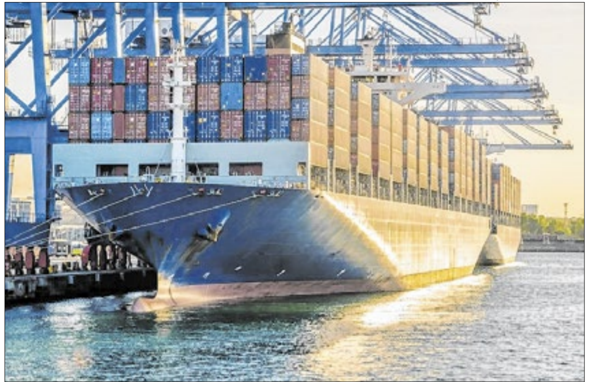
A exportação do agro tem se consolidado pela diversidade e principalmente pela excelência

O destaque dos produtos agrícolas, exportados à Índia, fi-