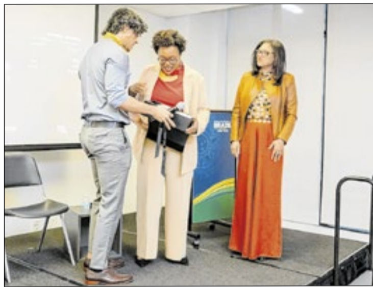
A vereadora foi homenageada em evento que reconhece lideranças negras brasileiras com projeção internacional