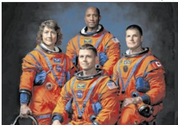
Astronautas são os que mais se afastaram da Terra