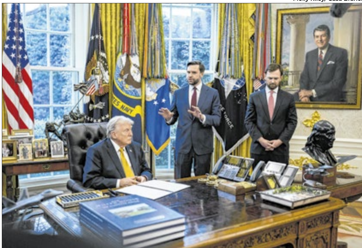
Trump estica o prazo para a reabertura do estreito de Hormuz, prometendo ‘explodir tudo’

Mas os entraves seguem os mesmos que levaram Trump a deixar o acordo em 2018: os ira-