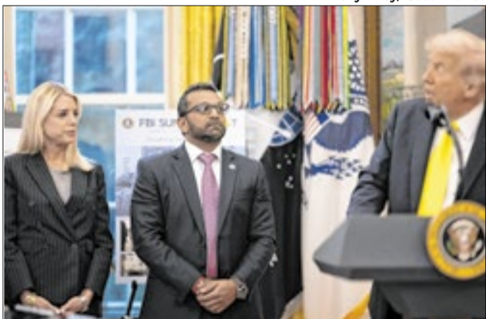
Demissão de Bondi já era especulada há um tempo