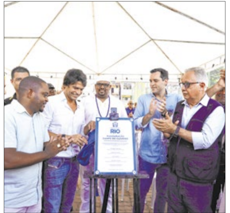
Cavaliere entrega mais uma obra na Zona Oeste

No interior, os municípios que apresentam as melhores taxas de ocupação, de acordo com a ABIH-RJ, foram: Miguel Pereira (91,20%), Paraty (89,60%), Angra dos Reis (89,20%), Arraial do Cabo (86,10%), Petrópolis (84,50%), Nova Friburgo e Barra do Pirai/ Ipiabas (84,10%), Teresópolis (82,30%), Itatiaia/ Penedo (81,40%).