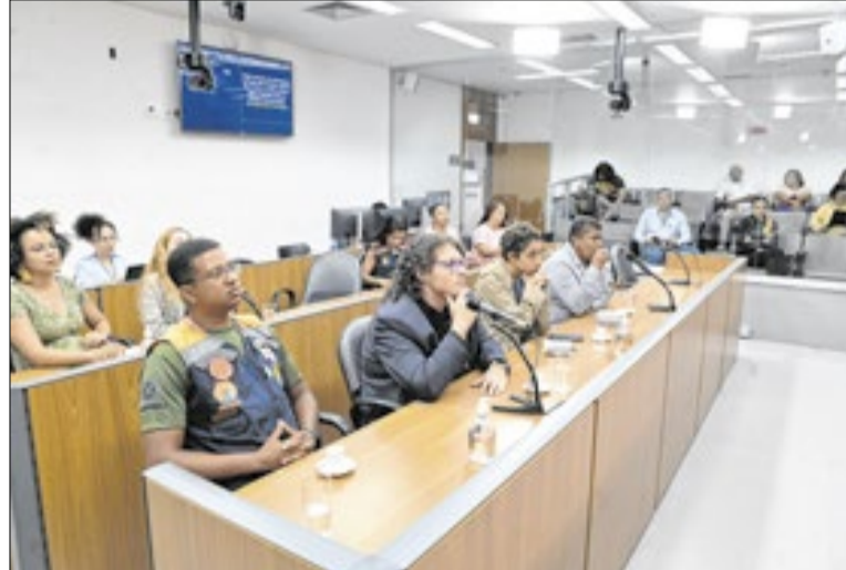
Extravasamentos e falhas motivaram reunião na terça (31)