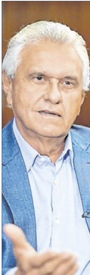
Ronaldo Caiado deixou o Governo do Estado de Goiás e é pré-candidato