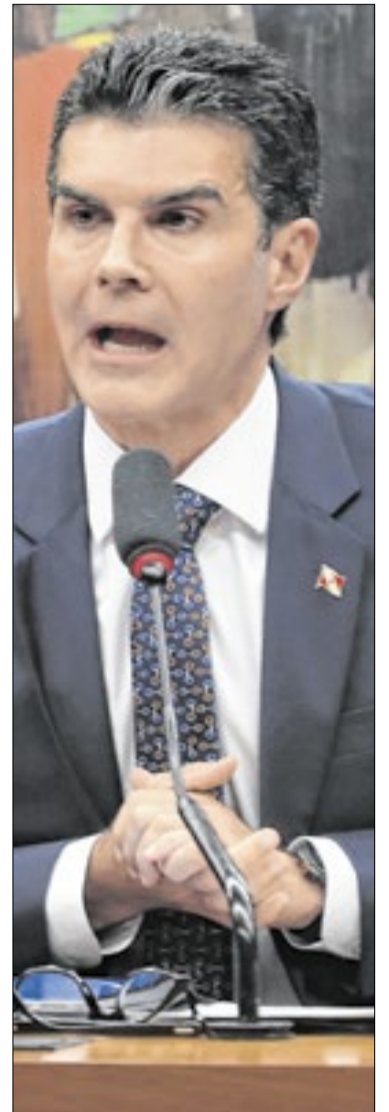
Helder Barbalho renunciou ao cargo de governador do estado do Pará