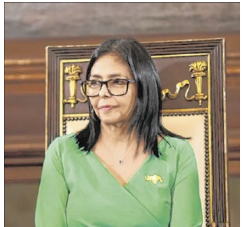
Trump tenta nova aproximação com regime da Venezuela