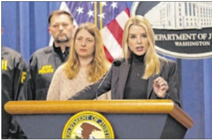
Trump está insatisfeito com a condução do Caso Epstein