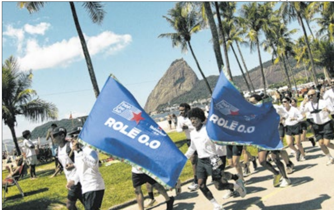
Rolê 0.0 deste ano levou o grupo para um percurso de 5 km pelo tradicional bairro da Glória

E qual cidade tem um "lifestyle" tão de acordo com essa meta se não o Rio de Janeiro? Pensando nessa integração, a Heineken vem aumentando a realização ações na Cidade Ma-