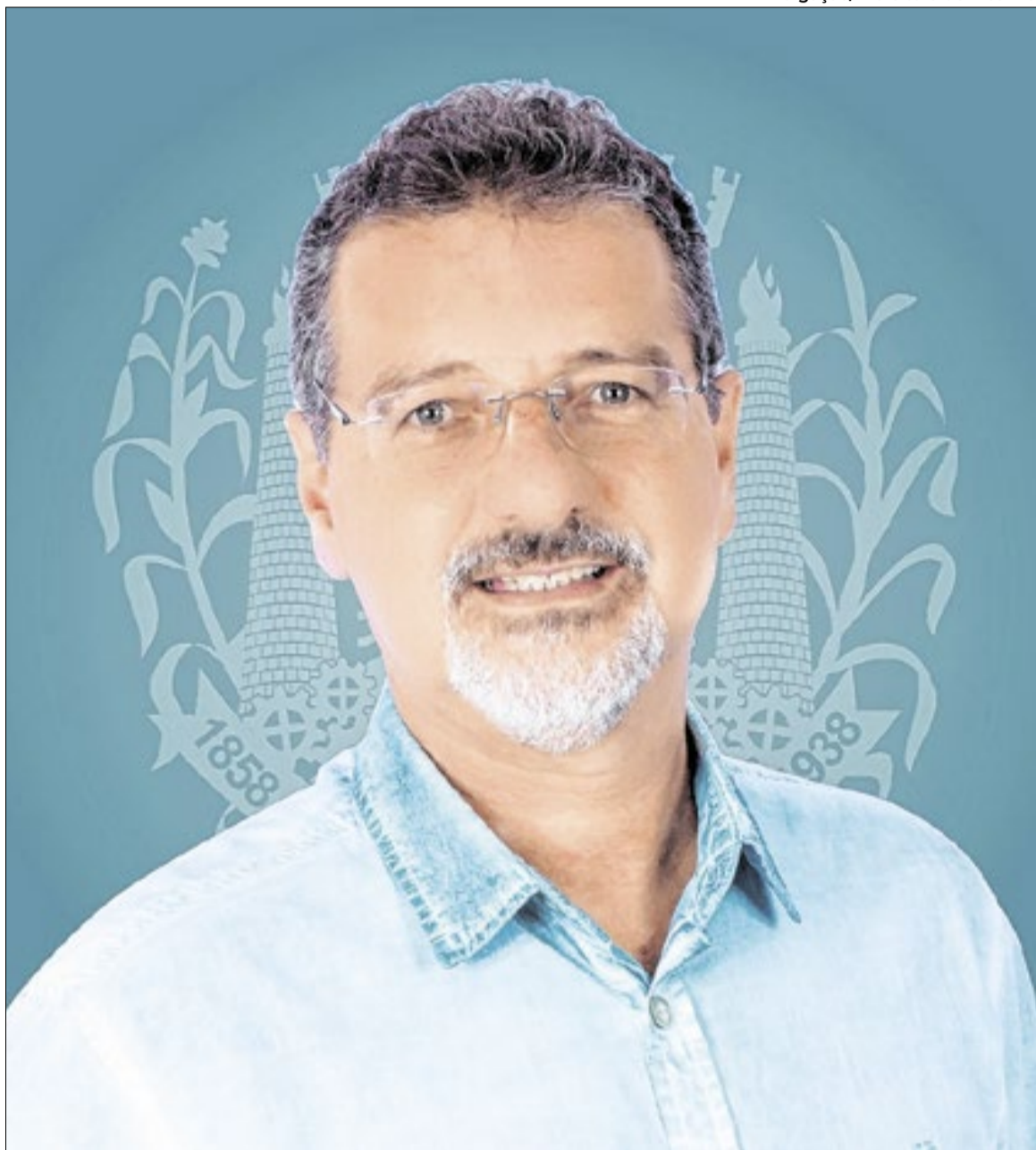
Apesar da aprovação, TCE orientou medidas para melhorar a “sobra de caixa”