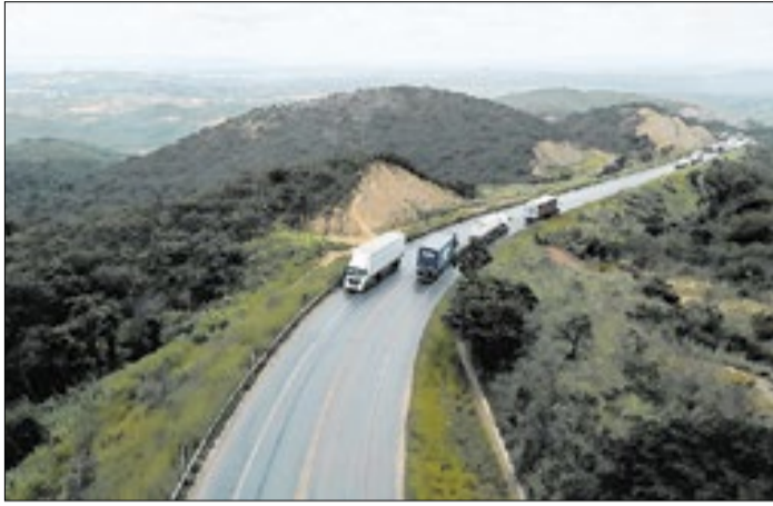
Rota das Gerais, entre MG e BA, deve receber melhorias