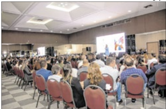
Evento deve reunir empresários do setor imobiliário