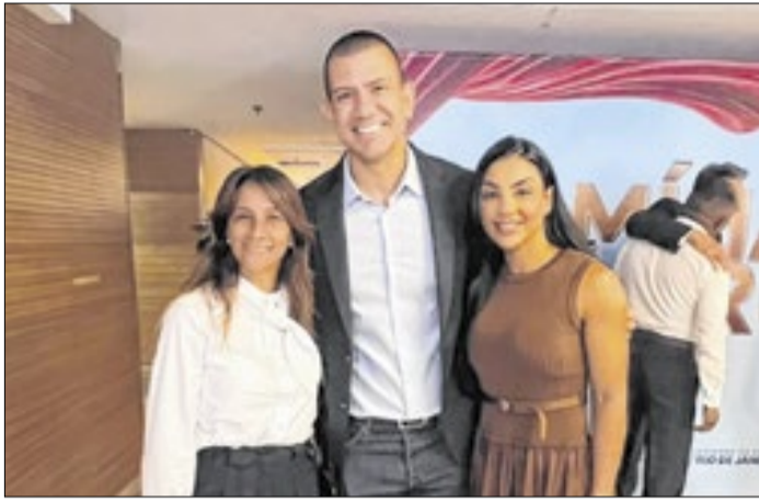
Prefeita de Barra do Piraí registrou o momento