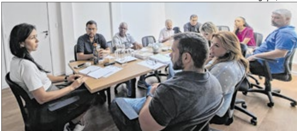
Iniciativa reforça o compromisso com a modernização das políticas ambientais

A iniciativa reforça o compromisso da gestão municipal com a modernização das políticas públicas ambientais, promovendo a revisão do plano de forma técnica, colaborativa e alinhada às demandas atuais da cidade, com foco na melhoria da gestão de resíduos.