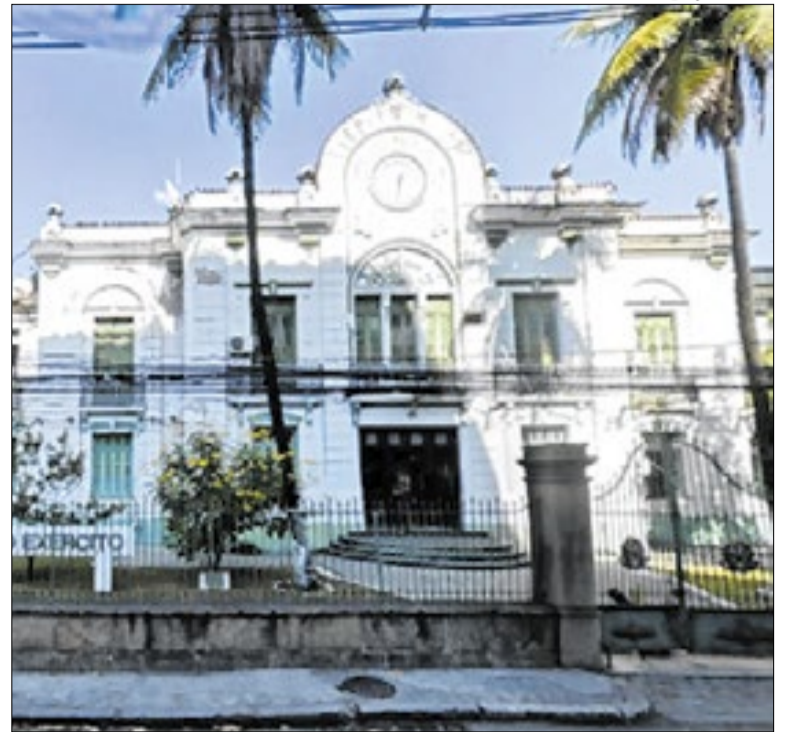
Prédio do antigo DOI-Codi, no Rio, pertence ao Exército

Durante a operação, autoridades identificaram fraudes em itens típicos da Páscoa, como bacalhau, azeite e bebidas comercializadas sem registro ou com origem irregular. As plataformas foram notificadas a remover os anúncios e preservar dados dos vendedores para responsabilização civil e criminal dos envolvidos.