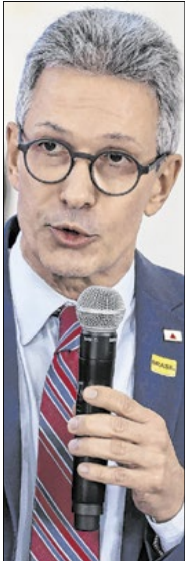
Romeu Zema, deixou o Governo do Estado de Minas Gerais e é pré-candidato