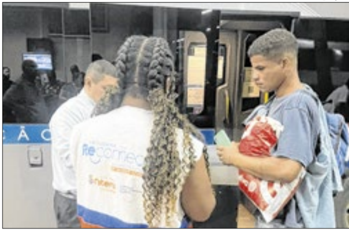
Prefeitura dá assistência aos recambiados