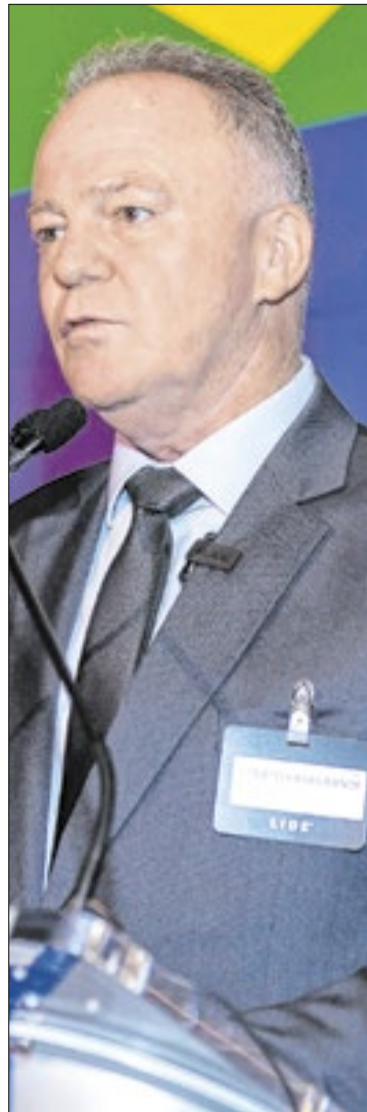
Renato Casagrande deixou o governo do Estado do Espírito Santo