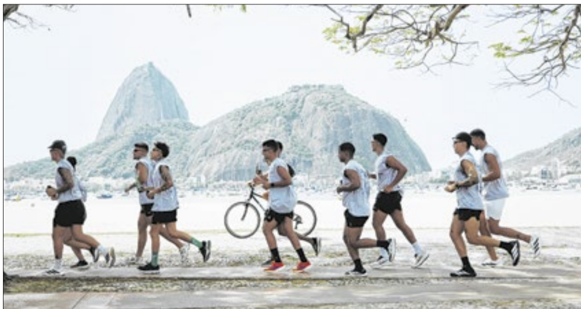
Marca estreou seus eventos "fit" no Rio em 2025 com uma caminhada pela orla de Botafogo