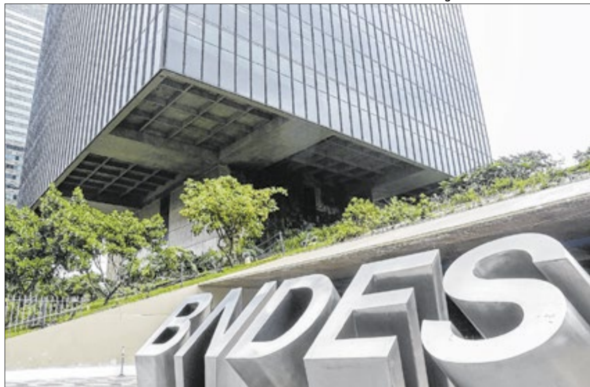
Crédito do BNDES apoiará produção de equipamentos sustentáveis no país.

Também estão incluídas máquinas utilizadas em projetos de energia limpa e iniciativas voltadas à redução de impactos ambientais na produção. As operações poderão ser contratadas diretamente com o banco ou por meio de instituições financeiras credenciadas. Os recursos não serão liberados de forma imediata nem em parcela única. Segundo o BNDES, o crédito ficará dispo-