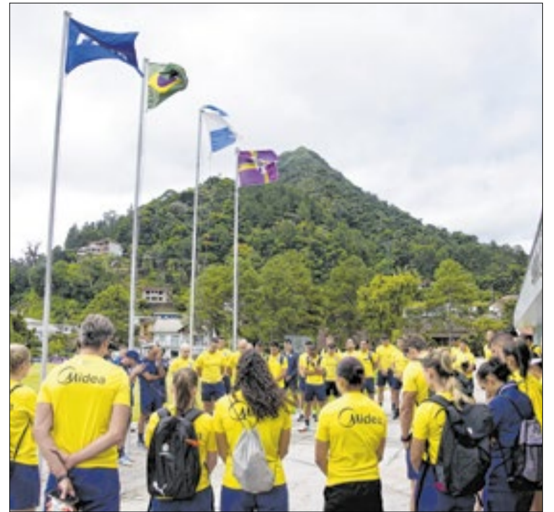
Primeira etapa do evento foi realizada na Granja Comary