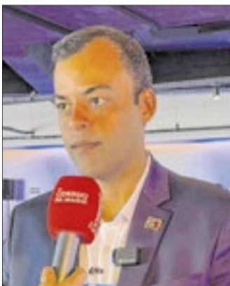
O novo secretário de Estado de Turismo do RJ, Lucas Alves