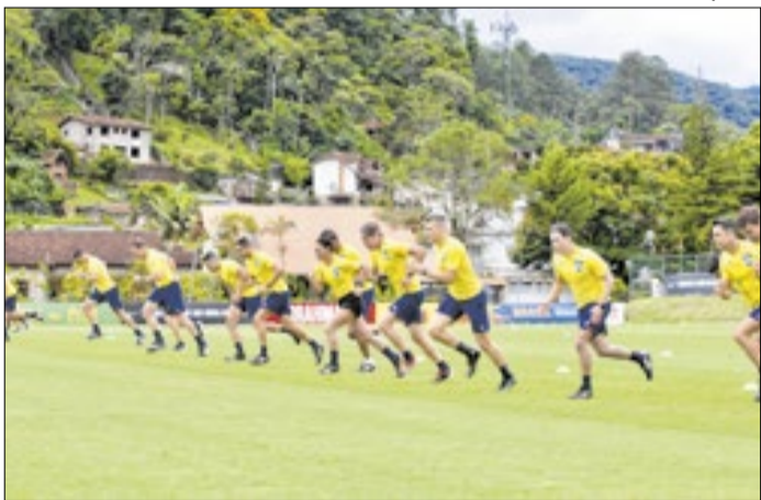
Árbitros iniciaram os treinamentos na Granja Comary