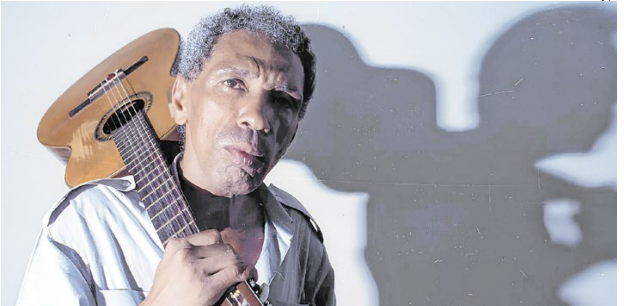
Cassiano formou com Tim Maia e Hyldon a santíssima trindade do soul brasileiro: o cantor e compositor morreu em 2021, vítima da covid