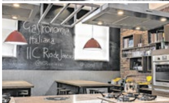
A cozinha enogastrômica do IIC é uma das novidades do prédio