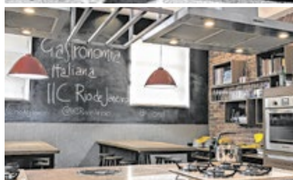
A cozinha enogastrônômica do IIC é uma das novidades do prédio