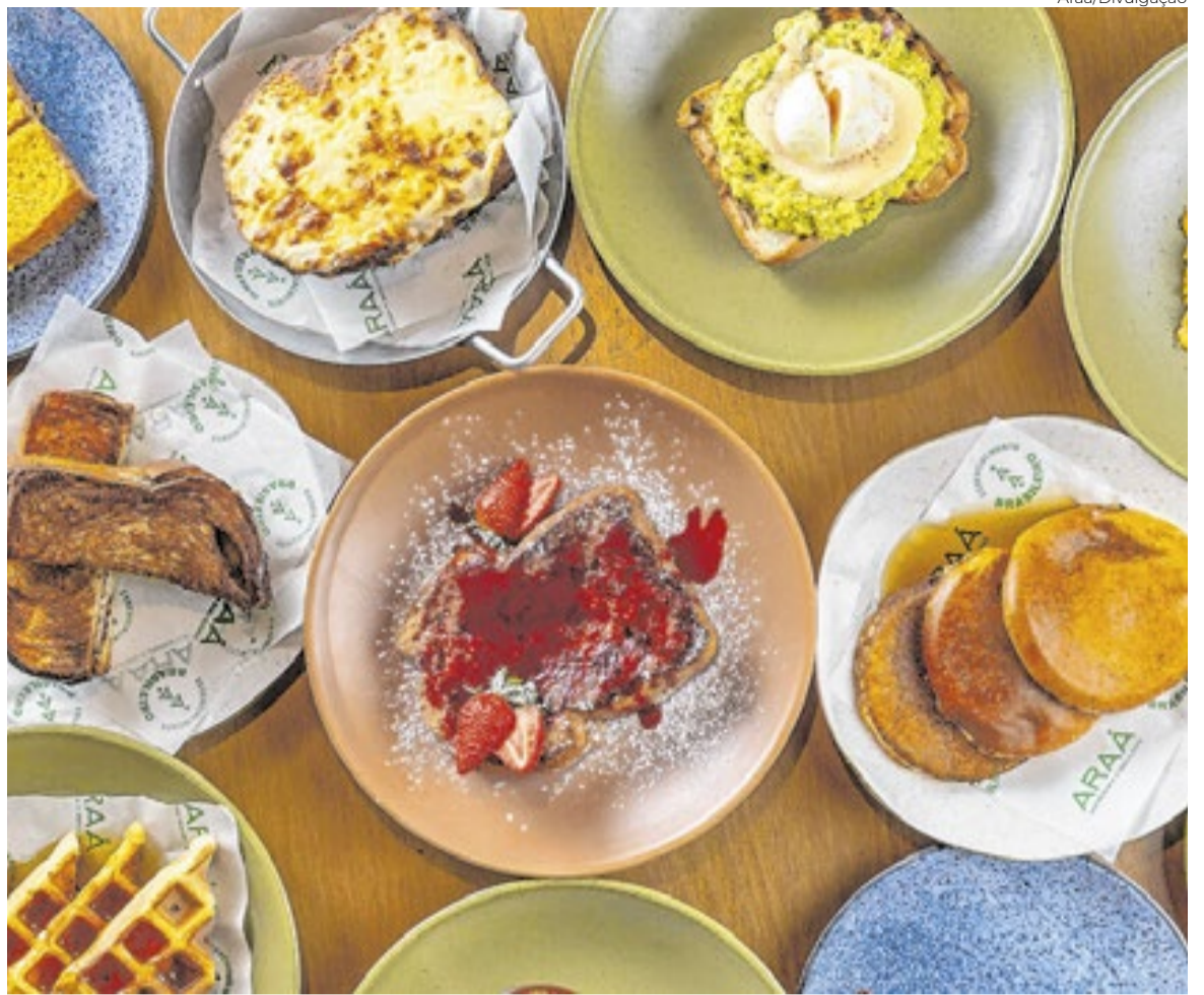
Com vista icônica do Rio, o Araá, no Morro da Urca, participa do Breakfast Weekend combina natureza, gastronomia e contemplação