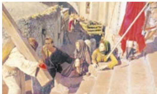
Imagem do grandioso set de filmagens da produção de US$ 15 milhões na época (aproximadamente US$ 160 milhões nos dias de hoje)