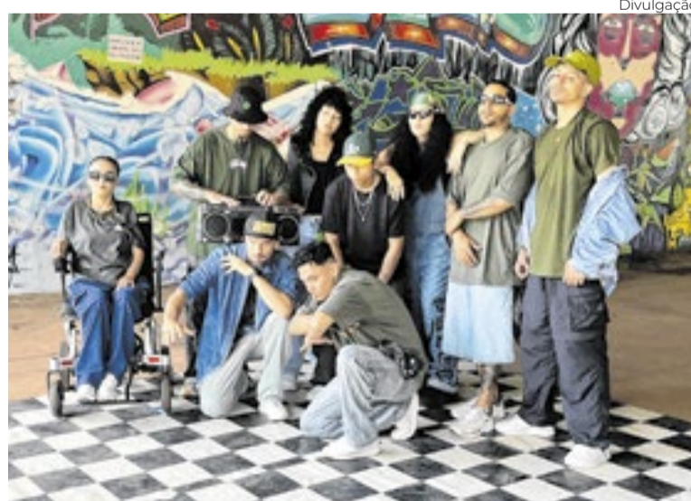
Coletivo acumula participações em importantes competições

“A cultura pode ser um instrumento de expressão, pertencimento e construção de futuro. Acreditamos que muitos jovens estão apenas esperando uma oportunidade, uma referência, um ponto de partida, assim como aconteceu comigo. A escola foi esse lugar para mim e pode ser para tantos outros. Nosso objetivo é que cada participante reconheça no hip hop uma forma de resistir, de existir e de construir sua própria