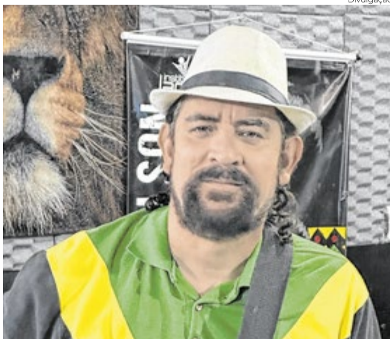
Corpo-Memória: Residência Artística em Teatro e Dança Negra abre inscrições