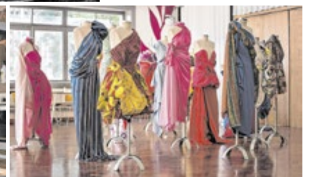
A moda é uma das grandes expressões da cultura italiana