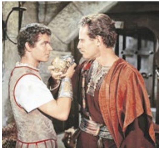
Stephen Boyd (Messala) e Charlton Heston (Judah Ben-Hur) são amigos de infância que se tornam rivais mortais por uma questão de fé de Ben-Hur em Jesus (abaixo)

Ganhador de 11 Oscars, o fenômeno pop ‘Ben-Hur’, com Charlton Heston, retorna às telas em versão restaurada, com todo o seu esplendor no diálogo com o Evangelho de Jesus