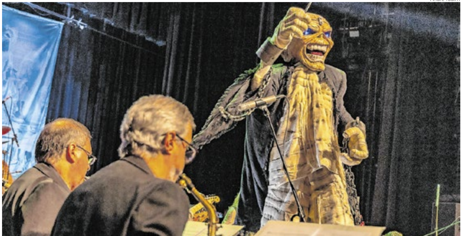
Brasília recebe “Iron Maiden Symphonic”, maior tributo ao Iron Maiden do mundo