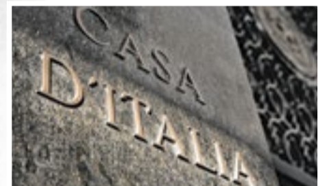
Detalhe da fachada do prédio

SERVIÇO CASA D'ITALIA DO RIO DE JANEIRO: 90 ANOS