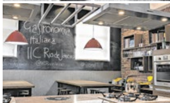
A cozinha enogastrômica do IIC é uma das novidades do prédio