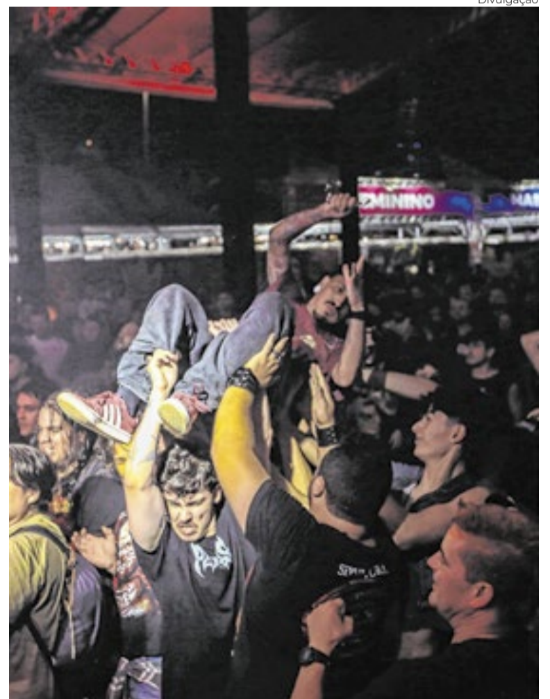
A iniciativa abre espaço para bandas autorais