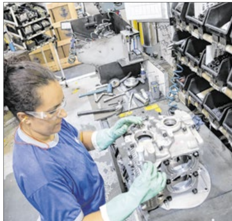
Mulheres estão mais concentradas nas faixas de menor renda