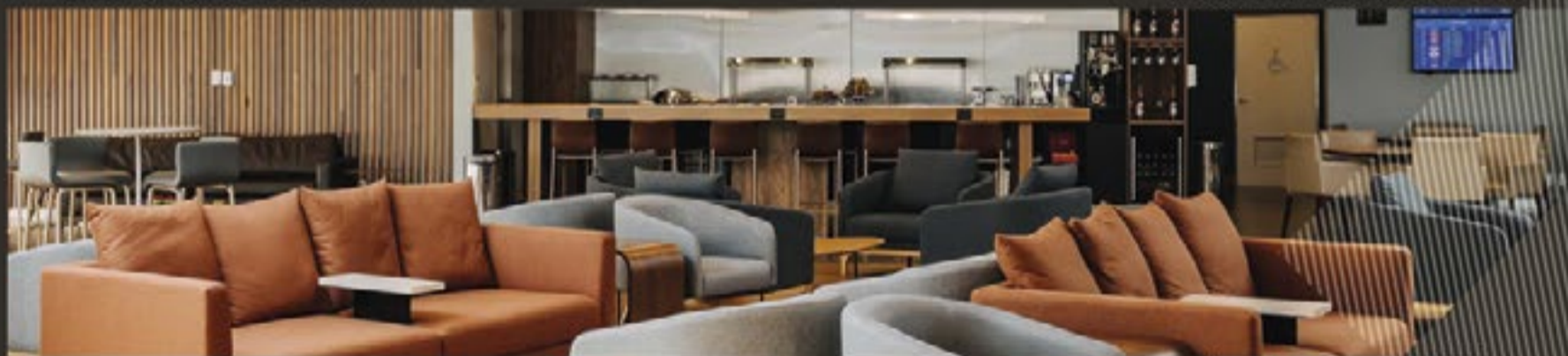
SALA VIP INTERNACIONAL