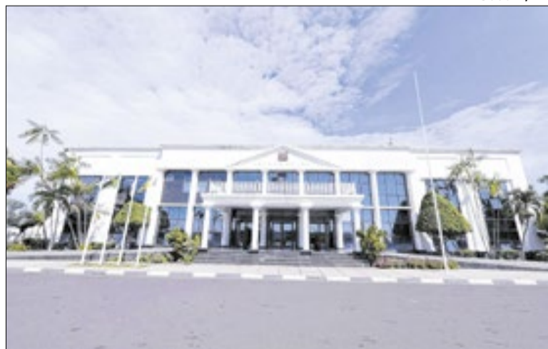
Regras visam acelerar solução de litígios

rador-geral do Estado, Tyrone Mourão, a medida é um avanço na modernização da atuação jurídica do Estado, ao priorizar soluções consensuais e mais céleres para a resolução de conflitos administrativos e judiciais.