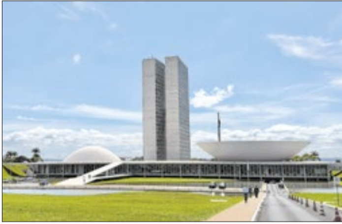
Servidores que vão disputar eleições devem deixar cargos