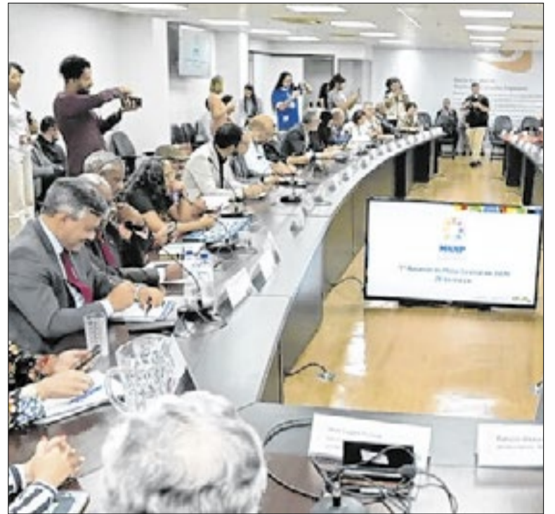
Mesa Nacional de Negociação Permanente realizada em março

O governo do Rio de Janeiro decidiu antecipar o pagamento do salário dos servidores estaduais na Semana Santa. A medida permitiu que os trabalhadores recebessem os valores no dia 2 de abril, antes do feriado prolongado, para possibilitar a programação das compras durante o período de Páscoa.