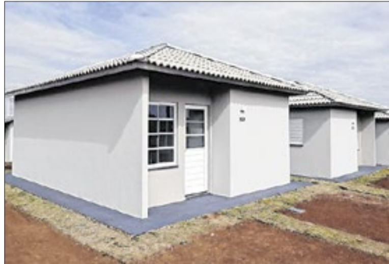
200 mil famílias saíram de moradias precárias em 2024

O estudo detalha ainda a queda nos três componentes do déficit: o ônus excessivo com aluguel urbano, a coabitação (quando mais de uma família divide o mesmo domicílio) e a habitação precária. O número de famílias com gasto superior a 30% da renda em aluguel caiu de 3,66 milhões para 3,58 milhões. Já a coabitação passou de 1,29 milhão para 1,03 milhão de domicílios, e a habitação precária caiu de 1,24 milhão para 1,15 milhão.