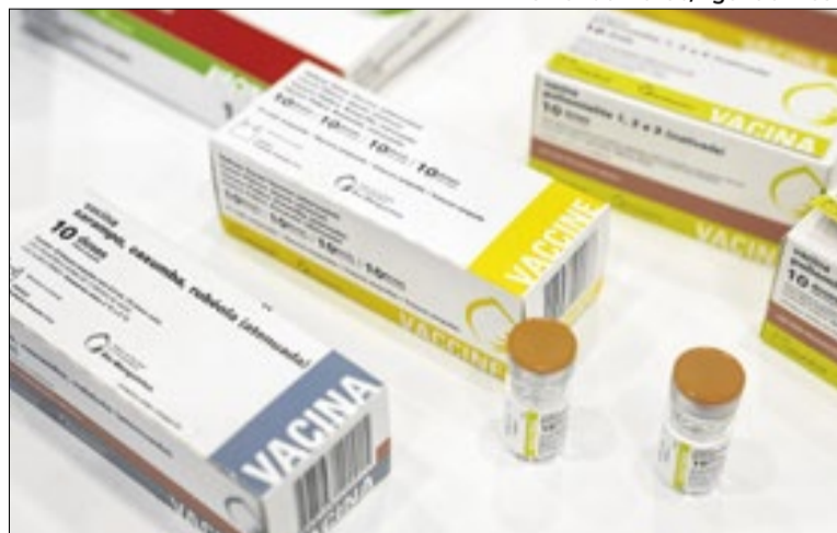
Paciente é mulher de 22 anos sem registro de vacinação

Este é o segundo caso de sarampo registrado no Brasil em