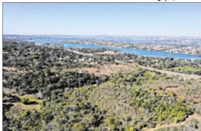
A área da Serrinha do Paranoá fica em local estratégico