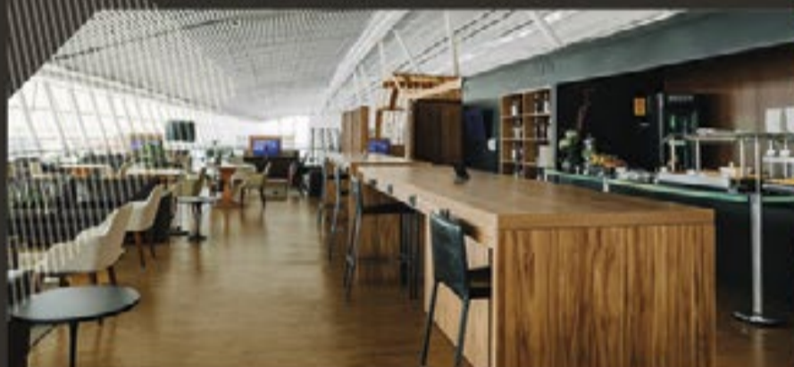
SALA VIP EXPRESS SUL