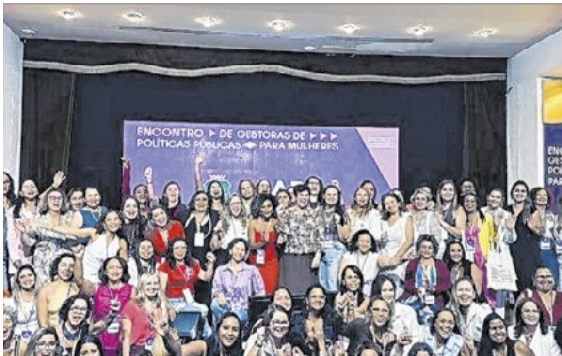
Encontro de Gestoras de Políticas para as Mulheres

“O feminicídio é algo que nós não queremos diminuir; queremos acabar. Nenhum país vai se desenvolver e crescer com esse tipo de violência