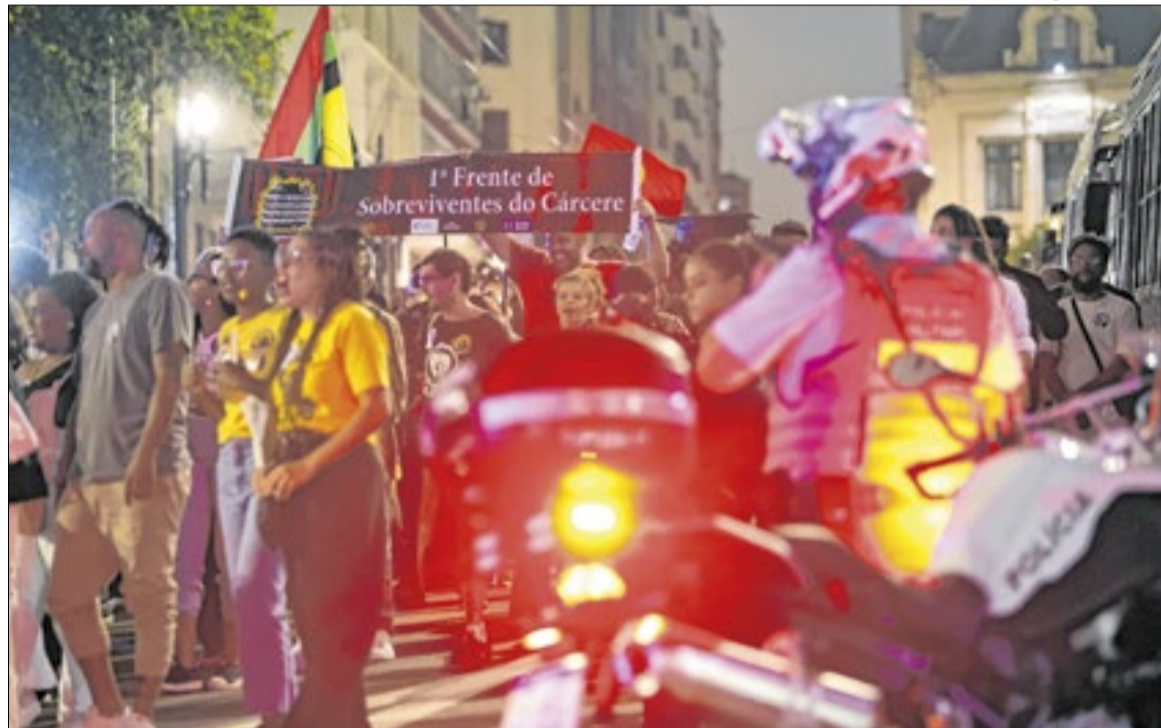
Os dados foram reunidos pela Agência Brasil, nesta quarta-feira (1º)

O número de mortes cometidas por policiais militares em serviço teve uma trajetória de queda no governo anterior, de 2019 até 2022. Os registros passaram de 720 para 262, no período, o que representou queda de 63,6%, segundo os dados do