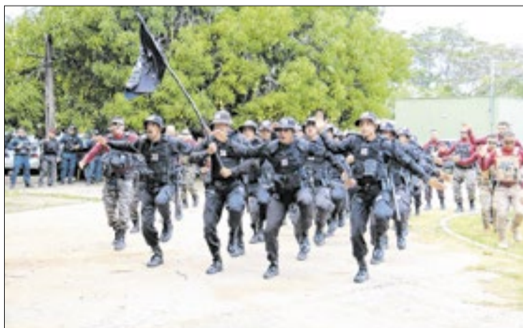
A formatura foi realizada pela Secretaria de Justiça

A formação de elite contou com instruções das forças de se-