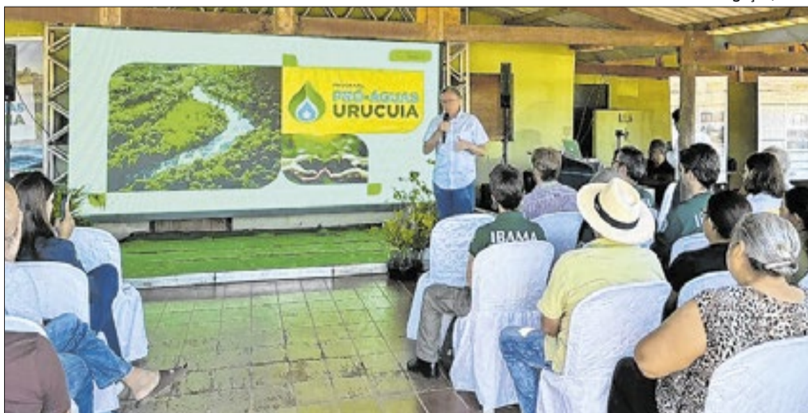
Projeto Pró-Águas Urucuia fortalece a segurança hídrica

Inserido na plataforma “Semeadando Água”, coordenada pela Secretaria Nacional de Segurança Hídrica (SNSH), do Ministério da Integração e do Desenvolvimento Regional, o programa foi oficialmente lançado nesta terça-feira (31), em uma cerimônia em Arinos (MG) — um dos 14 municípios que abrangem a Bacia do Rio Urucuia. A iniciativa