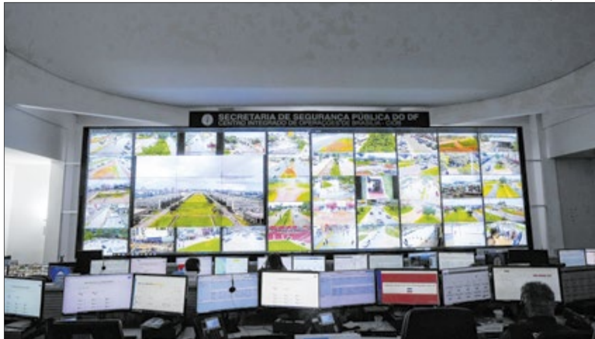
monitoramento é realizado de forma integrada entre as forças de segurança

A iniciativa permite que as forças de segurança acessem as imagens também por meio das Centrais de Monitoramento Remoto (CMRs). Até este momen-