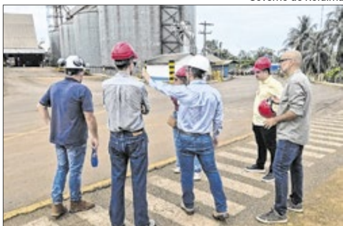
Estudos avaliam ampliar capacidade do porto