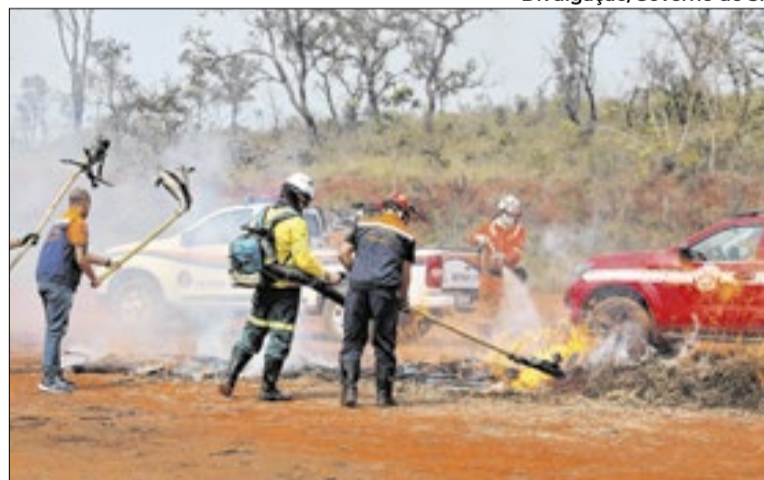
Agentes realizam uma série de capacitações em todo estado

Um dos destaques desta edição é a capacitação voltada ao atendimento de animais atingidos por queimadas, conduzida por médicos veterinários volun-