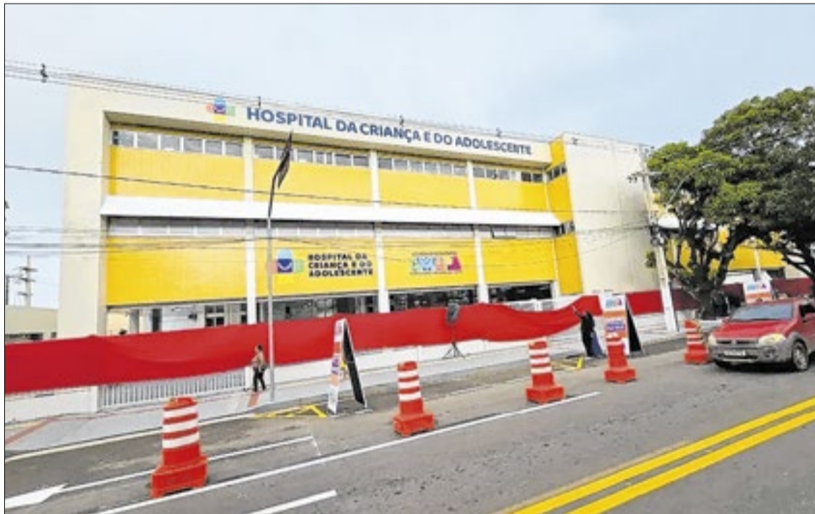
Totalmente reconstruído, hospital ficou 16 anos em obras

“Nós saímos de 74 leitos para 192 leitos no HCA. Mas o principal é com uma equipe bem preparada e apaixonada