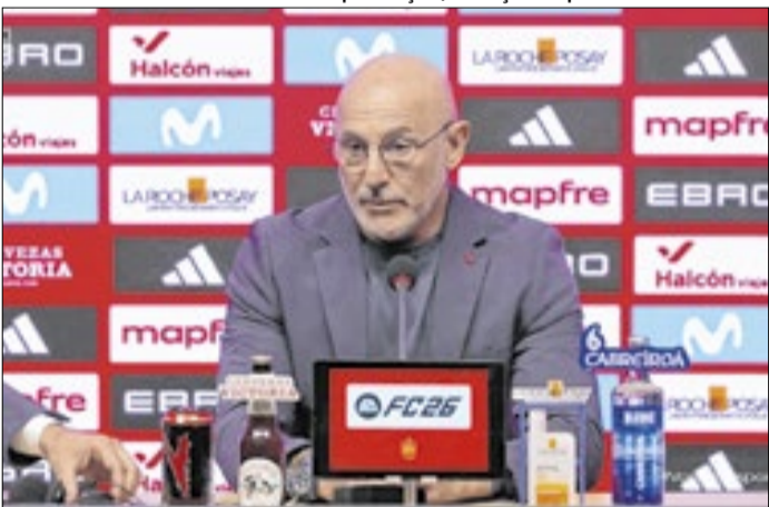
Técnico da Espanha, Luis de la Fuente condenou cânticos