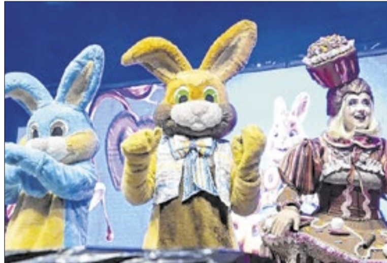
Taxa de ocupação hoteleira, deve ficar em 58,5% no Estado

Além do impacto no turismo, a Páscoa também impulsiona o comércio, especialmente nas vendas de ovos de chocolate e pescados, itens tradicionais do pe-