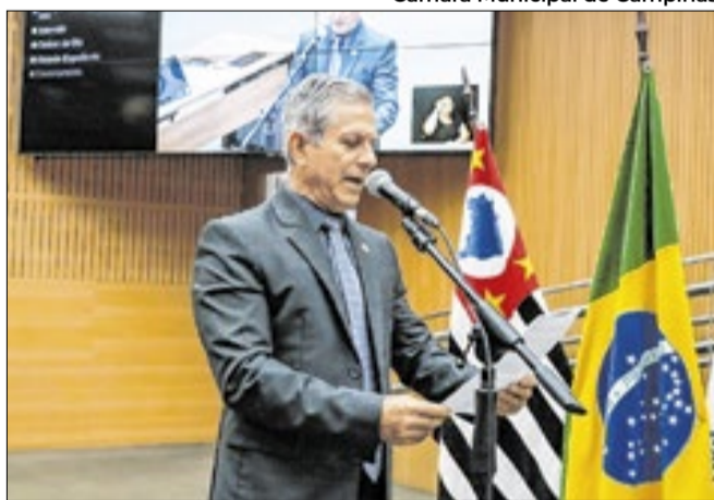
Fiscalização popular deve ser incentivada e premiada