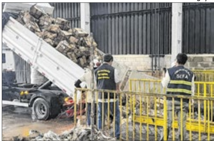
Nove toneladas de camarão foram inutilizadas