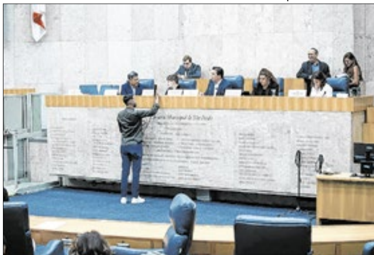
Presidente da CPI acredita em exploração das festas

vanato apontou falhas no atendimento de ocorrências, inconsistências em depoimentos e limitações na aplicação da legislação municipal conhecida como Lei do Psiu. O documento também sugere maior integração entre órgãos públicos e monitoramento das ações adotadas.