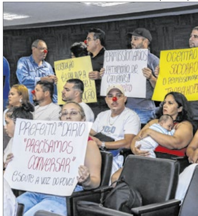
Polêmica chegou à Câmara e conta com apoio dos vereadores

Caso o objetivo do TCE-SP seja, de fato, o fortalecimento da transparência e o diálogo com a população de Campinas, existem inúmeros locais neutros na cidade capazes de abrigar tal evento. A democracia ganha quando as fronteiras entre quem fiscaliza e quem é fiscalizado permanecem claras e respeitadas.