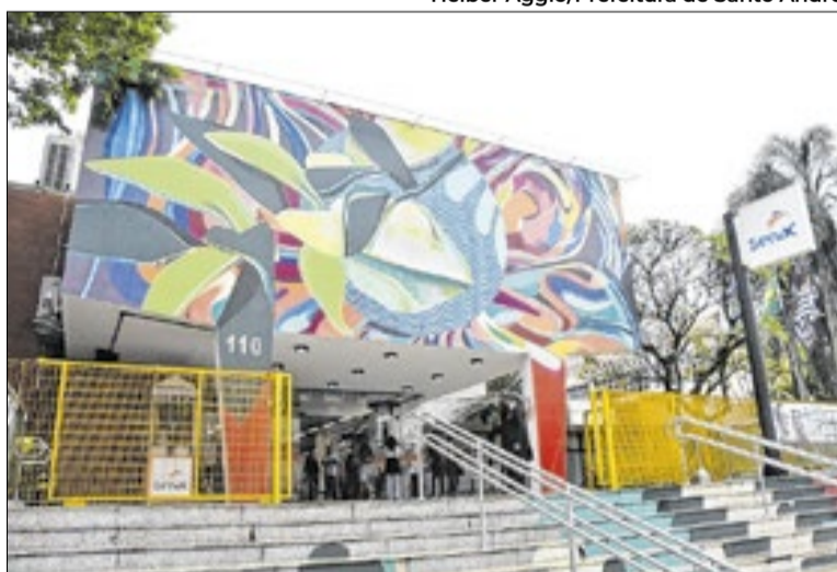
Aulas serão presenciais em unidades de ensino da cidade

Os cursos que serão oferecidos são de assistente de logística, porteiro e vigia, assistente de recursos humanos, inglês básico, maquiador, auxiliar de serviços contábeis, auxiliar de cozinha,