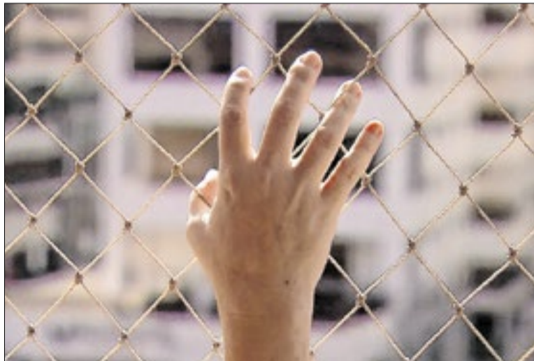
Dados foram divulgados pela Secretaria da Segurança Pública

Já os homicídios dolosos apresentaram redução, com 179 ocorrências em fevereiro, queda de 11% na comparação anual. No bimestre, foram 369 casos, 11,3% a menos que em 2025. Os latro-