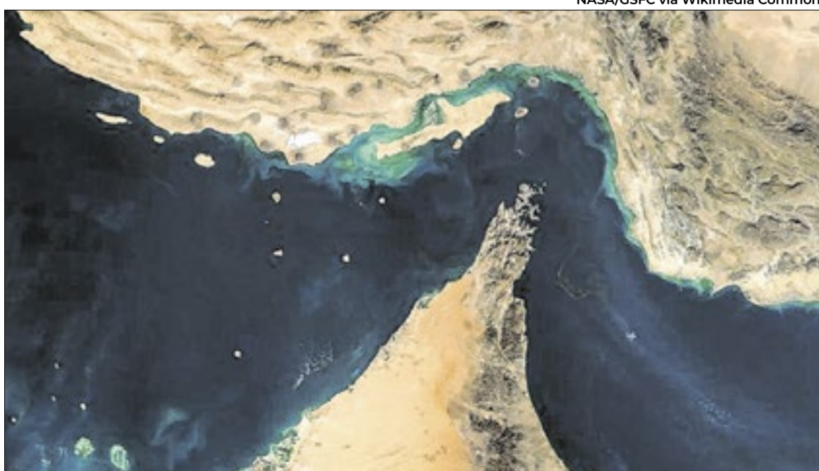
Estreito de Hormuz continua no centro da polêmica entre Estados Unidos, Israel e Irã no momento