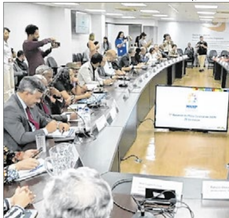
Mesa Nacional de Negociação Permanente realizada em março

O governo do Rio de Janeiro decidiu antecipar o pagamento do salário dos servidores estaduais na Semana Santa. A medida permitiu que os trabalhadores recebessem os valores no dia 2 de abril, antes do feriado prolongado, para possibilitar a programação das compras durante o período de Páscoa.