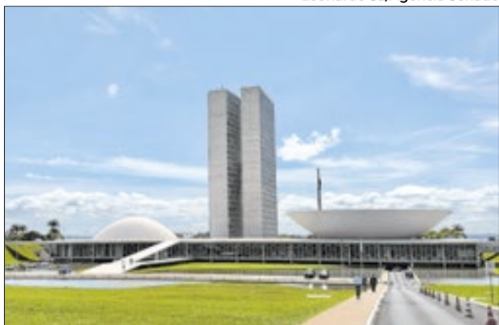
Servidores que vão disputar eleições devem deixar cargos