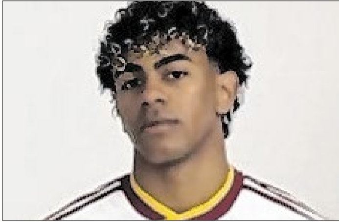
Muçulmano, Lamine Yamal protestou contra a torcida