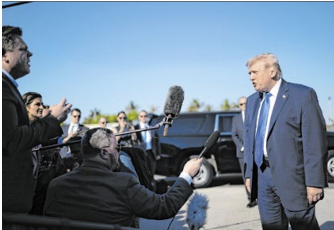
Presidente americano, Trump considera retirar país da Otan por falta de apoio no conflito

Questionado pela agência Reuters sobre quando os EUA considerariam a guerra no Irã encerrada, Trump respondeu: “Não posso dizer exatamente... vamos sair bem rapidamente. Eles [Irã] não terão uma arma nuclear porque agora são incapazes disso, e então eu vou sair, levarei todos conosco, e, se for preciso, voltaremos para realizar ataques pontuais”, acrescentou.