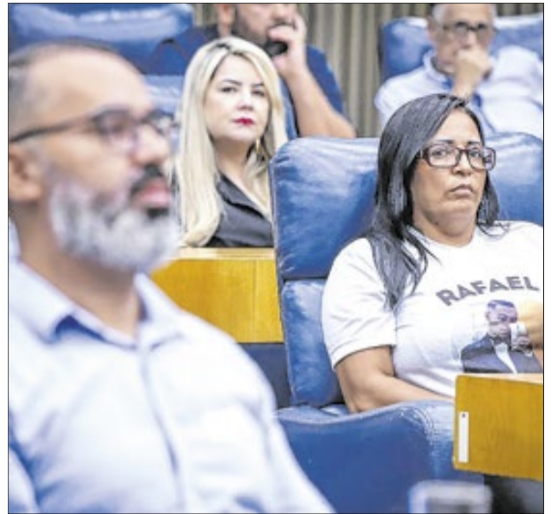
Comissão apura procedência de bebidas alcoólicas em SP

O valor investido foi de R$ 193,4 milhões. São 704 unidades no conjunto Lajeado e 440 no Bauru. Apartamentos têm entre 40 m² e 49 m², em 11 torres de 14 andares, todas com elevadores. As unidades contam com dois dormitórios, sala, cozinha e banheiro. A região dos empreendimentos tem unidades educacionais.