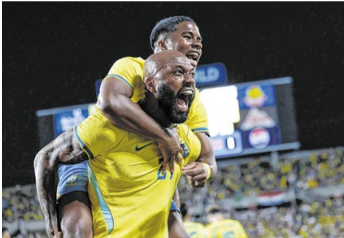
Endrick tornou qualquer chance de não ser convocado em possível vexame para Ancelotti

O retrospecto positivo e a grande comunidade brasileira presente em Orlando ajudaram a construir um clima positivo para a Seleção enfrentar a Croácia, grande carrasco do Brasil na Copa do Mundo de 2022.