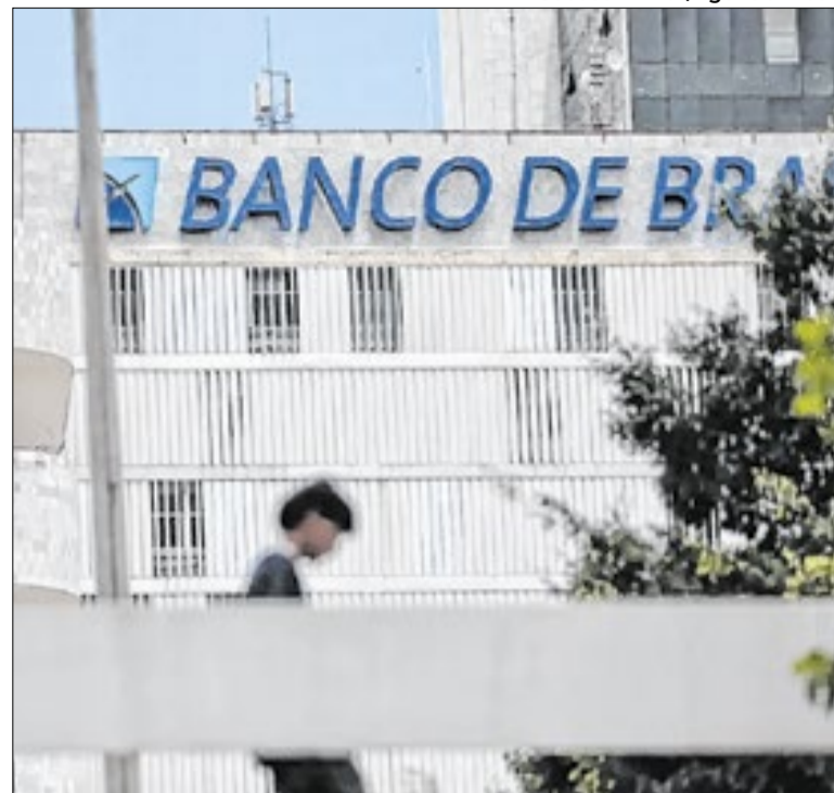
Atraso pode complicar situação do BRB

Em Santa Catarina, a direita deverá ficar com as duas vagas no Senado, mas, mesmo assim, a esquerda vibrou com o resultado da pesquisa. É que Carlos Bolsonaro (PL) ficou em terceiro lugar, atrás de Carol de Toni (PL) e de Esperidião Amin (PP). A torcida contra Carluxo é muito grande.