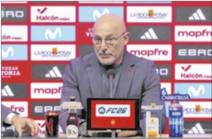
Técnico da Espanha, Luis de la Fuente condenou cânticos

Reprodução/ Seleção Espanhola de Futebol