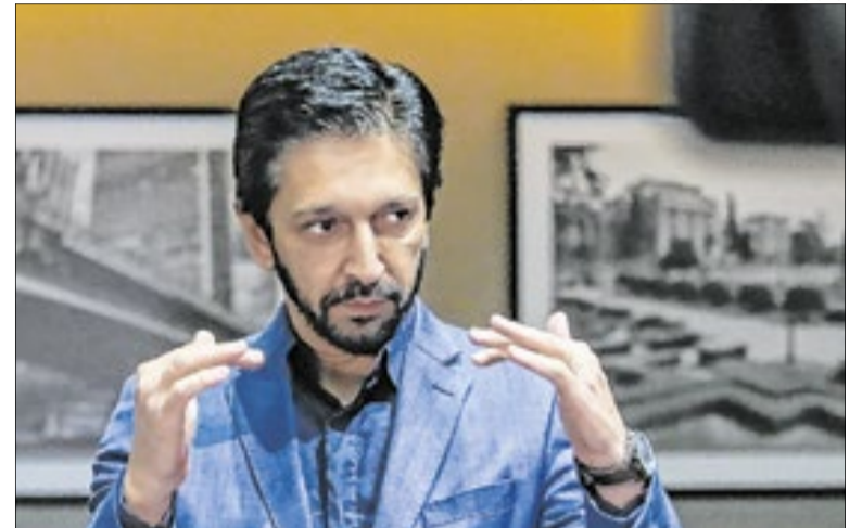
Mudanças são na Casa Civil, Esportes, entre outras pastas