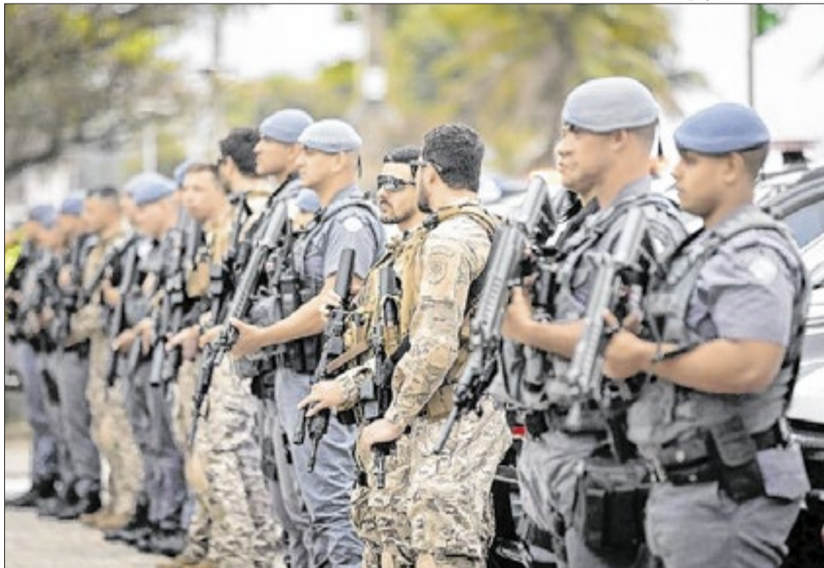
Projetos aprovados preveem aumento salarial e novas regras de carreira para civis e militares

No caso da Polícia Militar, o texto reorganiza a estrutura de