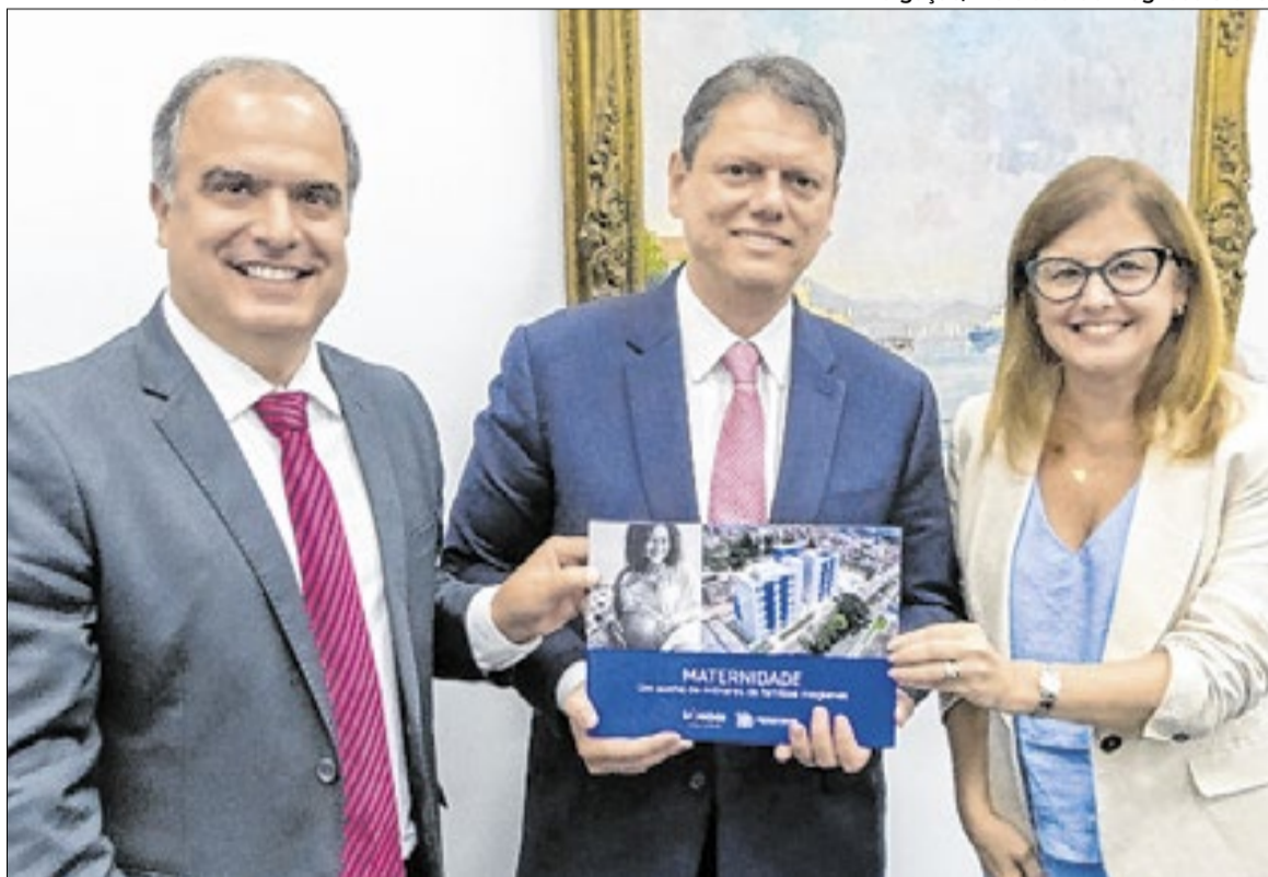
Tarcísio firma parceria e, em reunião com prefeita e vice-prefeito, acata outras demandas

Contando com sete pavimentos, 90 leitos e Unidades de Tera-