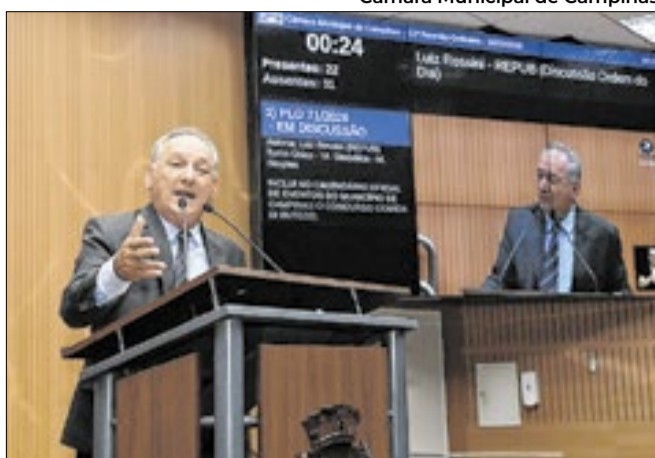
Sessão será transmitida ao vivo pela TV Câmara