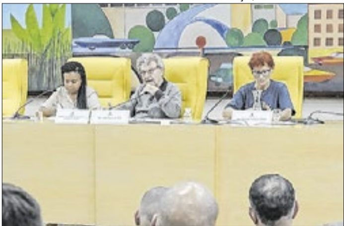
Proposta recebeu aval dos vereadores da Comissão