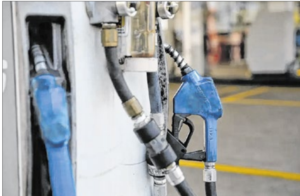
União compensaria metade da perda de arrecadação, ou seja, cerca de R$1,5 bilhão

A adesão dos estados é considerada essencial para que a queda do preço chegue ao consumidor final. Segundo o governo federal, mais de 80% das unidades da federação manifestaram apoio à proposta durante as negociações, mas a participação depende de formalização individual após a publicação das regras oficiais. Governadores do Nordeste e do Norte foram os primeiros a sinalizar concordância com o modelo apre-