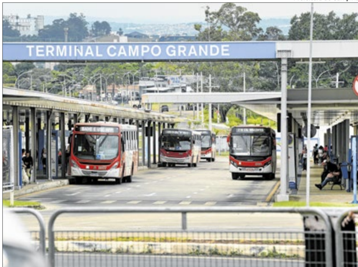
Prefeitura de Campinas

Com a contratação dos projetos executivos será possível licitar posteriormente a execução das obras físicas. A previsão da administração municipal é de que, após a conclusão dos projetos técnicos, as construções possam