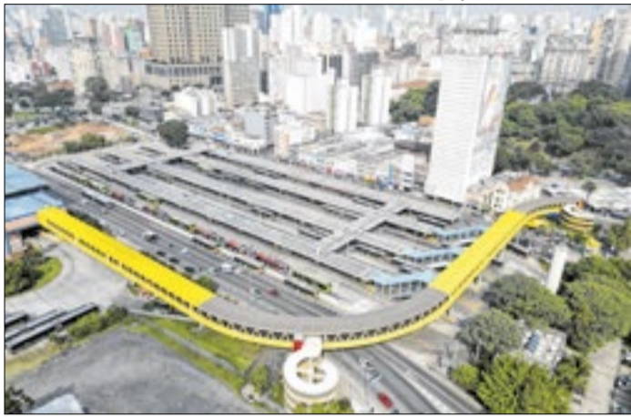
Acesso ao Novo Parque Dom Pedro II permaneça gratuito