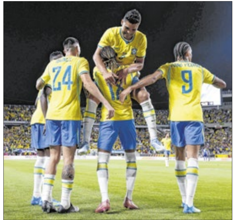
Convocação final para a Copa será divulgada em 18 de maio

Já o sistema defensivo traz muitas polêmicas. Danilo (Flamengo), Wesley (Roma), Alex Sandro (Flamengo), Douglas Santos (Zenit), Marquinhos (PSG), Gabriel Magalhães (Arsenal), Eder Militão (Real Madrid), Bremer (Juventus) e Léo Pereira (Flamengo) seriam os convocados. São opções mais ‘experientes e ‘pesadas’.