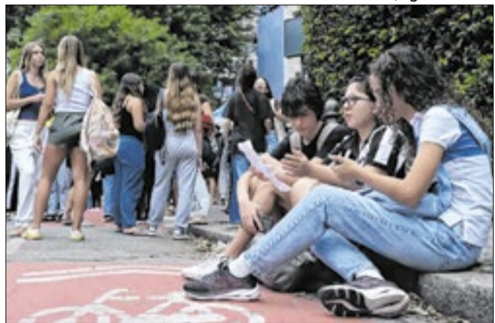
SP tem 3,5 milhões de estudantes na rede estadual