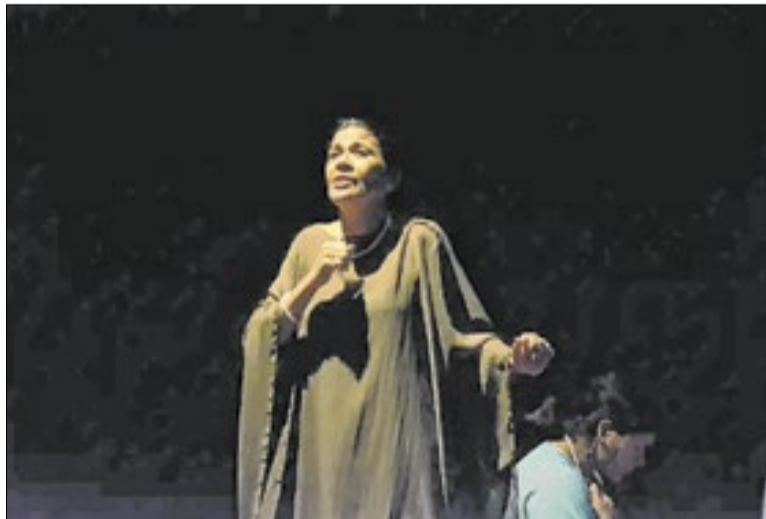
Márcia do Carmo/GEA

O Circuito das Artes se destaca por seu formato de fluxo contínuo e caráter não competitivo, permitindo que artistas, produtores culturais, organizações da sociedade civil e microempreendedores individuais (MEI) submetam projetos a qualquer