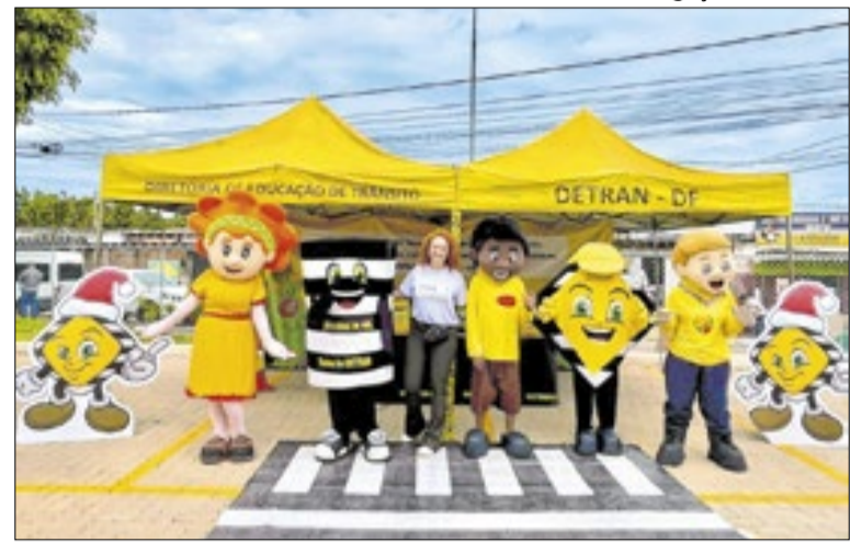
O Detran-DF realiza uma série de ações educativas neste mês

Ao longo de abril, estão previstas atividades educativas em vias públicas e instituições para orientar condutores e pedestres.