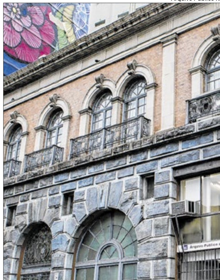
Movimentação atende a recomendação do MPF

Por suas dependências passaram nomes como a médica Nise da Silveira, o ativista Abdias Nascimento e a militante Olga Benário, entre outros perseguidos políticos.