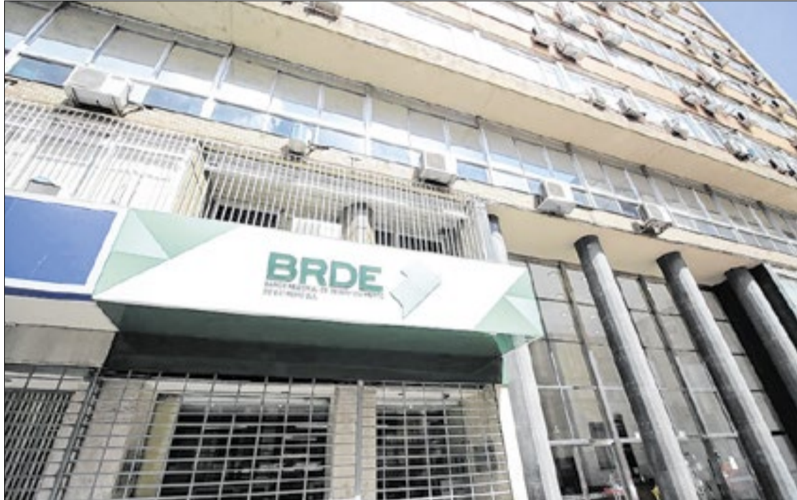
A atuação do BRDE alcançou municípios e ampliou o acesso ao crédito em diferentes regiões

clientes ativos, com operações em 1,2 mil municípios.