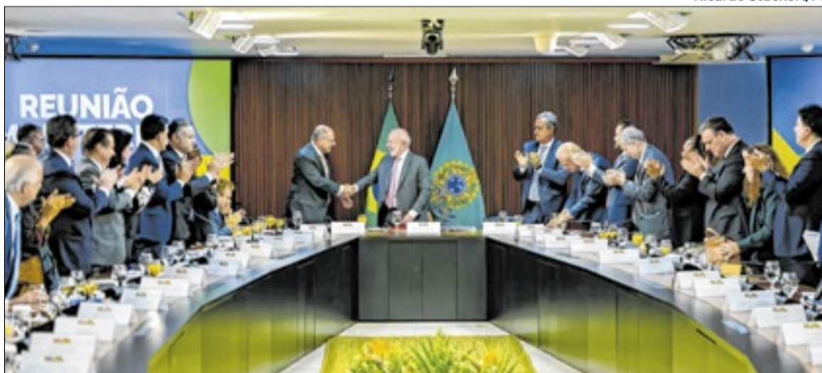
Reunião marcou definição sobre quem sai e quem fica

presidencial e que envolveria algum partido mais ao centro, em especial o PSD de Gilberto Kassab. Então optou-se por essa manutenção da atual chapa”, ele ponderou.