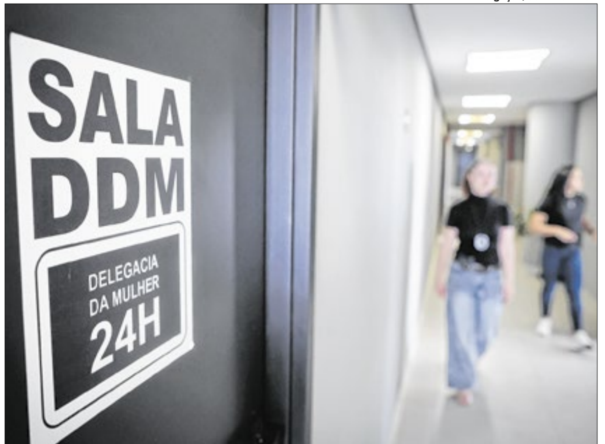
Salas DDM oferecem escuta qualificada, orientações e encaminhamento para a rede de apoio

No interior, a expansão contempla dezenas de municípios em todas as regiões administrativas do estado, incluindo cidades como Guarulhos, Santo André, Campinas, Sorocaba, Ribeirão Preto, Bauru, Santos e Araçatuba, entre outras. As unidades