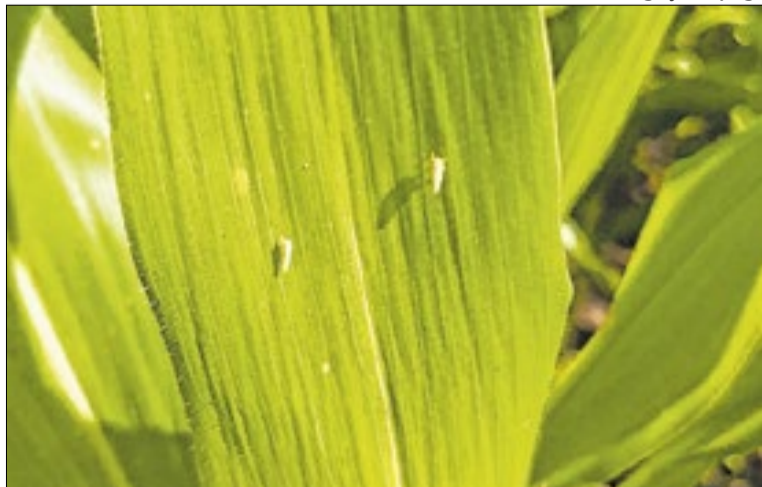
Mesmo com a redução, o índice ainda exige atenção

Parte das áreas já está na fase reprodutiva, etapa em que o risco de danos tende a ser menor, pois a fase crítica para transmissão de enfezamentos já foi superada na