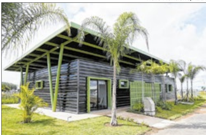
O primeiro laboratório de análise e certificação de vinhos