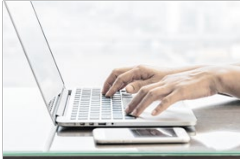
O valor total transferido em março soma R$ 3,82 bilhões

Agência de Notícias do Governo do Estado de São Paulo