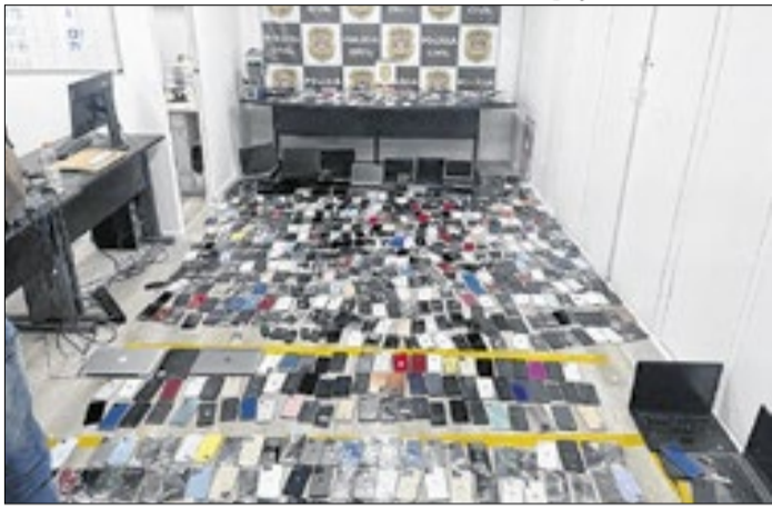
Ferramenta reunirá dados dos estados em tempo real