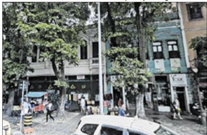
Rua do Catete, nº 182 e 184, no Rio de Janeiro (RJ)