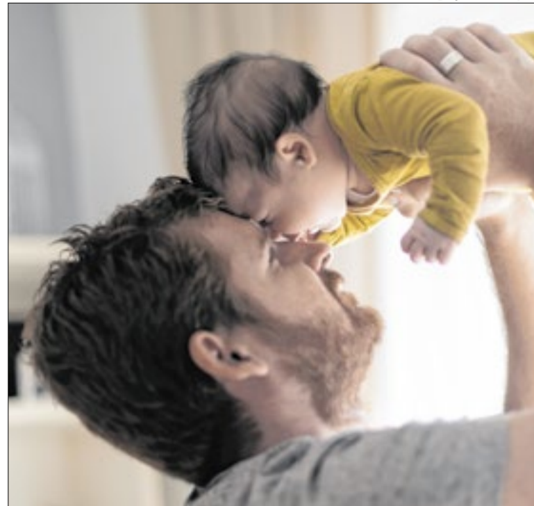
Licença paternidade vai aumentar forma progressiva, até 2029

A trabalhadora pediu demissão antes de descobrir a gravidez e avisou a empregadora depois. O TST decidiu que a saída só seria válida com assistência sindical, como prevê a CLT. Com isso, a empregada terá direito à indenização referente ao período de estabilidade gestacional. O caso aconteceu em São Paulo/SP.