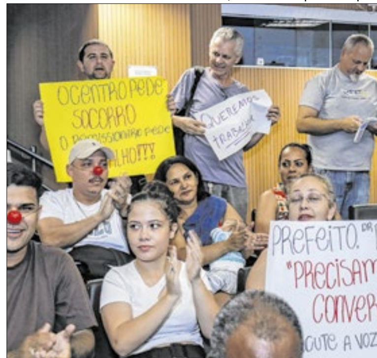
Permissionários pediram posicionamento do prefeito

A Administração tem o dever de defender os cidadãos, garantindo que a preservação do passado não sacrifique o presente de quem constrói a cidade com esforço, de quem tem dependente para sustentar e tem que preocupar com a sobrevivência acima de perfumarias.