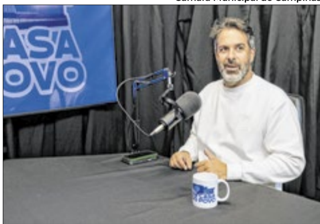
Hossri propõe alteração do Artigo 1º da Legislação