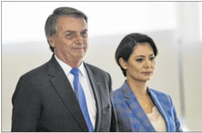
Esposa, só Michelle fala o tempo todo com Bolsonaro