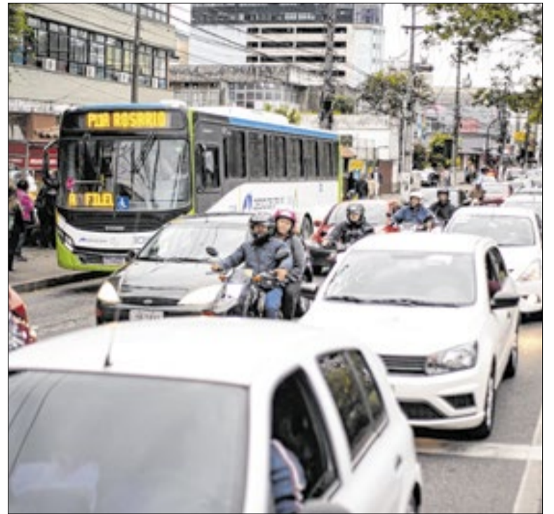
Dados foram registrados em um período marcado por obras

O Poder Executivo poderá contratar estudantes de Medicina matriculados em instituições reconhecidas pelo MEC. Esses alunos vão atuar de forma complementar nas equipes de saúde, ou seja, sem substituir médicos efetivos. Os estudantes deverão atuar sob acompanhamento contínuo de médicos da rede.