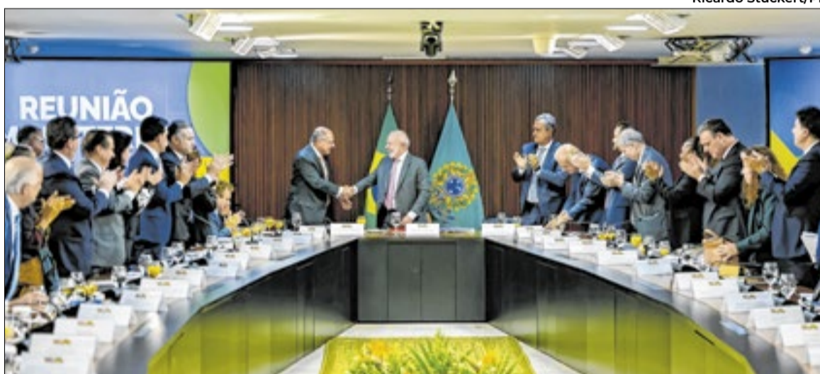
Reunião marcou definição sobre quem sai e quem fica

presidencial e que envolveria algum partido mais ao centro, em especial o PSD de Gilberto Kassab. Então optou-se por essa manutenção da atual chapa”, ele ponderou.