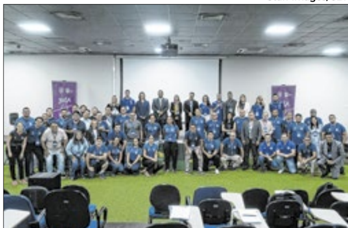
'Joga, Mina!', evento promovido pela CBF, foi sucesso