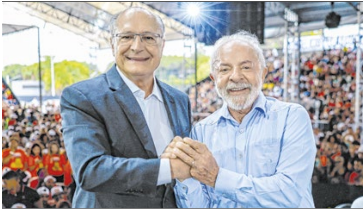
Alckmin ficará como o vice de Lula na reeleição

“Em certa medida, a medida é decorrente da frustração de não ter conseguido ampliar o leque de alianças partidárias numa chapa