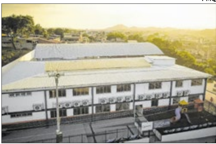
Escola estava fechada há mais de uma década