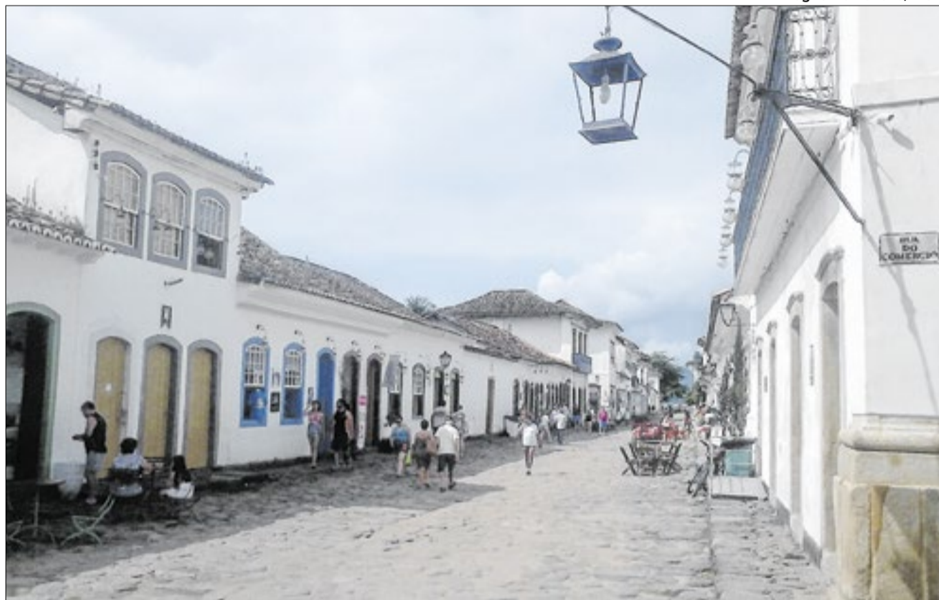
Paraty, patrimônio mundial reconhecida pela Unesco, aproxima alunos à realidade de unidade de conservação

“Nossa obrigação é mostrar para essas crianças a importância da preservação do meio ambiente, já que, na maioria das vezes, esse cuidado se inicia na localidade que te cerca. Aprender em um