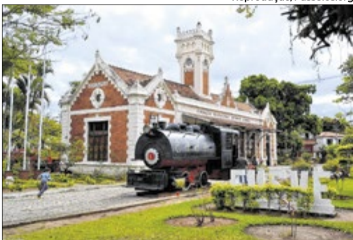
A troca dos ingressos acontece na Estação Viva