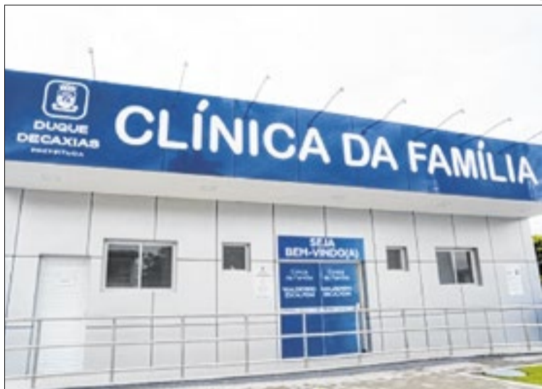
Ações reforçam o compromisso com a saúde da mulher

Apesar da existência de vacina preventiva, o câncer do colo do útero ainda está entre os que mais causam mortes. A imunização é oferecida gratuitamente na rede