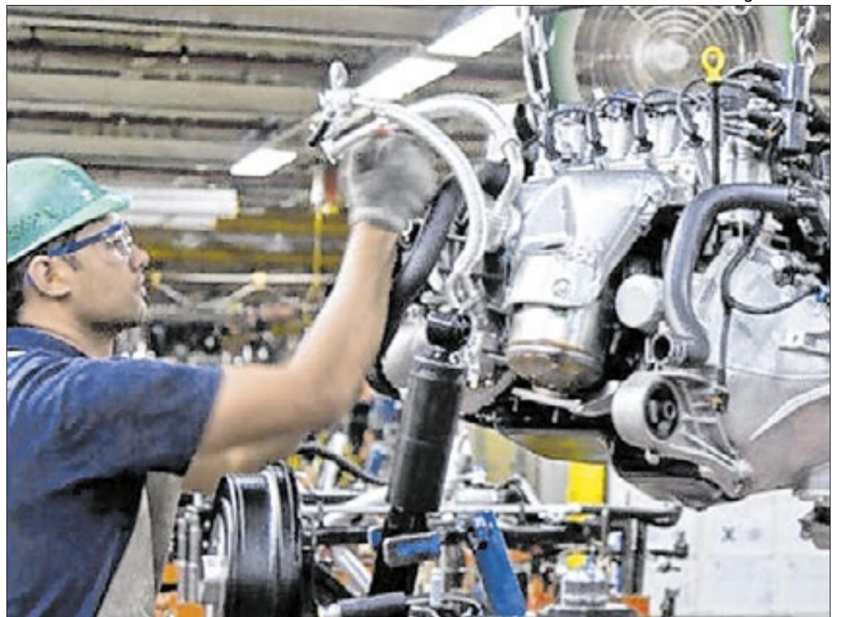
Segundo Caged, Indústria criou 32.027 postos de trabalho em fevereiro

Todos os cinco grandes setores registraram saldo positivo. O setor de Serviços foi o destaque, com 177.953 vagas, impulsionado por educação (49.013), serviços administrativos (37.972), transporte e armazenagem (17.886) e alojamento e alimentação (16.920). A Indústria criou 32.027 postos, com ênfase na fabricação de produtos de carne (5.028), processamento de fumo (4.594) e fabricação de calçados (2.273). A Construção gerou 31.099 vagas, puxadas por edifícios (12.666), obras de infraestrutura (9.382) e serviços especializados (9.051). Na Agropecuária, foram 8.123 empregos, com destaque para o cultivo de maçã (5.924) e uva (2.356). O Comércio adicionou 6.127 postos de trabalho, com resultados positivos no atacado