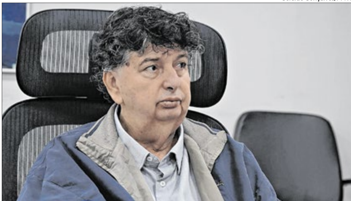
Apoio de Neto, que está no sexto mandato, é considerado de peso em todo o Estado do Rio

pelo Republicanos, a pedido, inclusive, do ex-governador Anthony Garotinho, como informa a coluna Correio do Vale nesta edição.