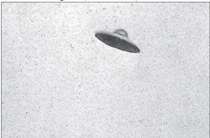
"OVNI's" surgem em momentos de polêmica do governo