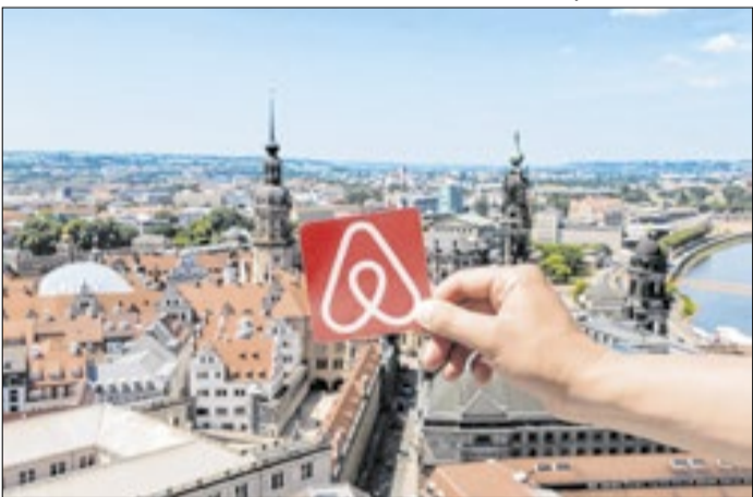
Airbnb ganha novas regras no Rio de Janeiro