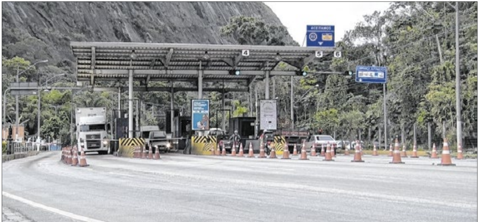
Maior movimento deve ser registrado no domingo

O Governo do Estado do Rio de Janeiro oficializou a prorrogação do contrato de concessão da RJ-116 por mais 25 anos. A medida foi publicada no Diário Oficial no dia 20 de março de 2026, por meio do Sexto Termo Aditivo ao contrato que regula a exploração da rodovia, que liga Itaboraí, Nova Friburgo, Cordeiro e Macuco. O acordo envolve o Departamento de Estradas de Rodagem do Estado do Rio de Janeiro