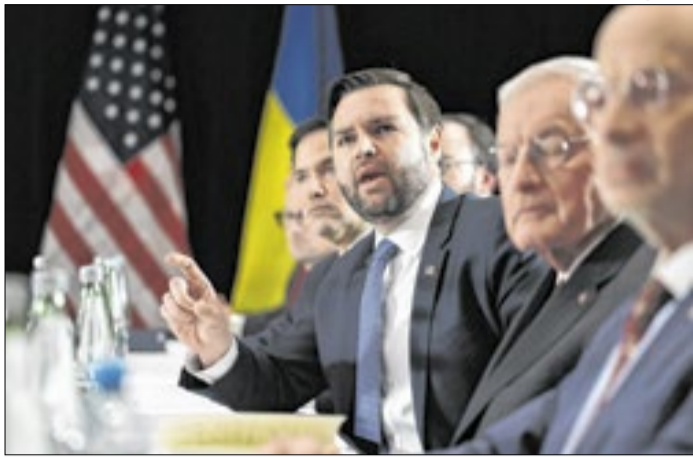
Vice-presidente dos EUA prometeu abrir investigação