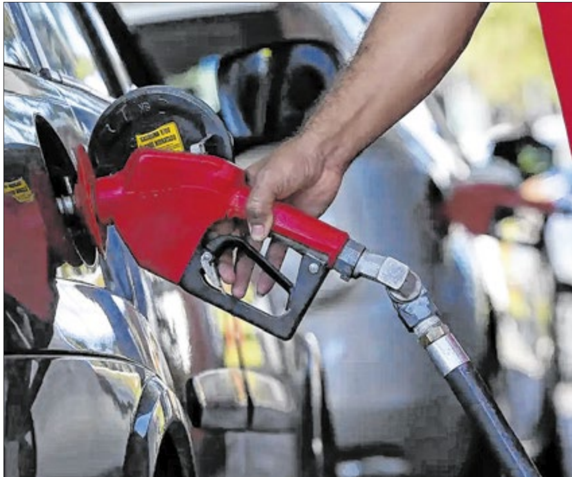
Em Petrópolis, o valor médio da gasolina comum chegou a R$ 7,19

Para ele, segurar preços artificialmente pode gerar problemas maiores, como prejuízos e falta de produto. “De uma forma ou de outra, alguém vai pagar essa conta”, enfatizou.