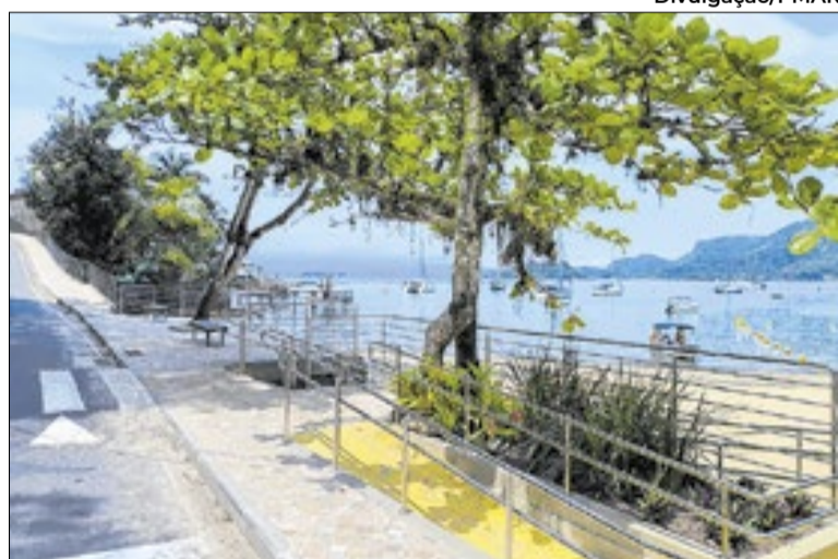
Angra dos Reis reúne gastronomia, cultura e tradição

A programação acontecerá das 9h às 19h e contará com a participação de diversos restaurantes da cidade, que irão comercializar pratos à base de peixe e banana. O público também poderá aproveitar uma programação musical diversificada ao longo de todo o dia, com grupos e DJ se revezando para animar o evento.