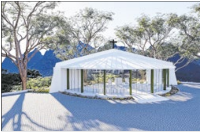
Projeto arquitetônico da construção em Teresópolis