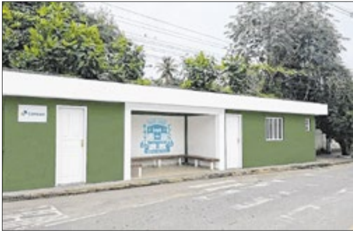
Estrutura do ponto de atendimento passa por reforma