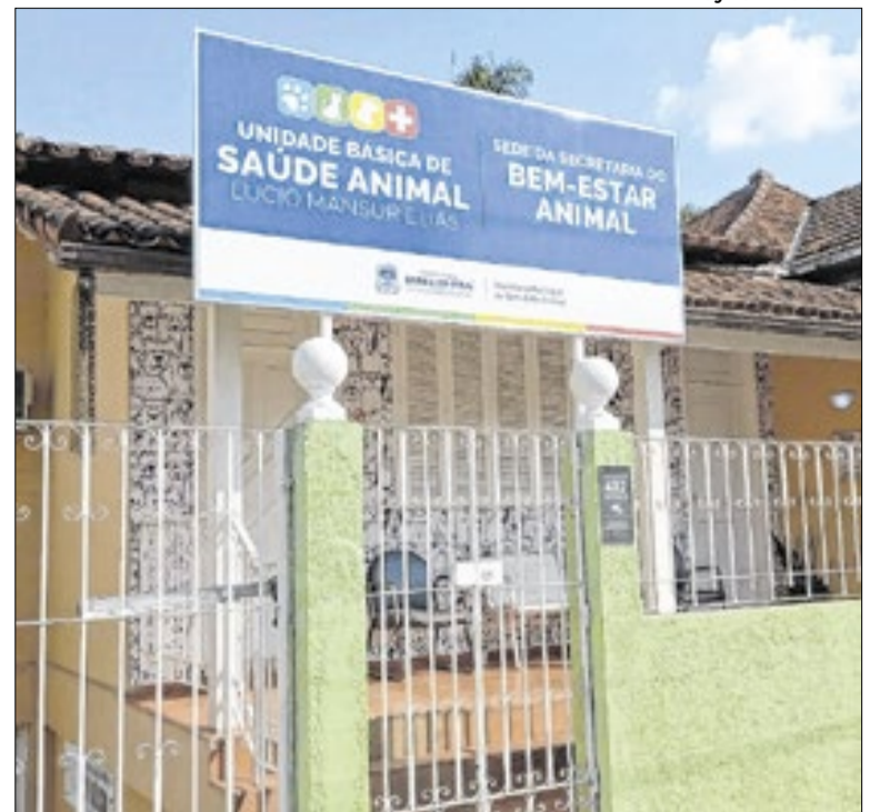
A unidade conta com salas para realizações de exames