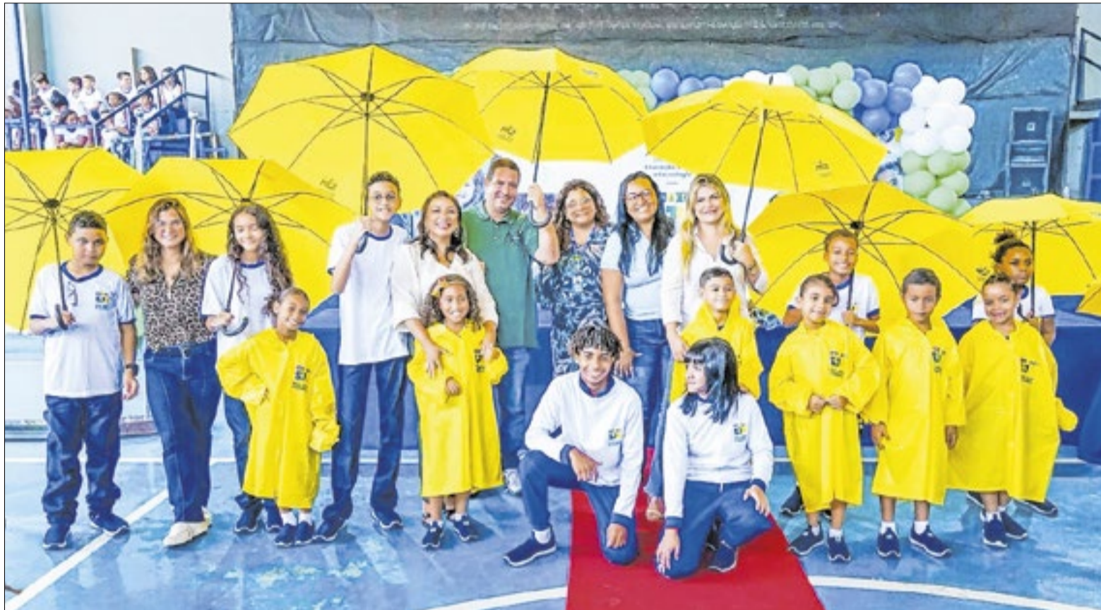
Alunos da rede municipal de Meriti desfilaram apresentando roupas de frio, capa e guarda-chuva

“Estamos cumprindo nossa promessa de entregar os novos unifor-