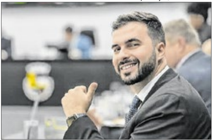
Decisão do STF será publicada no dia 8 de abril de 2026