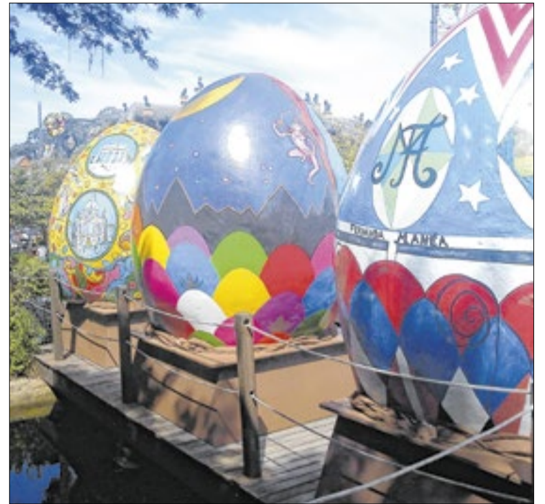
Uma das atrações é a Páscoa de Gramado, na Serra Gaúcha

O projeto prevê plataforma digital com informações dos locais certificados, facilitando o planejamento de viagens acessíveis. Segundo o parlamentar, a iniciativa amplia o acesso aos atrativos turísticos do DF e estimula novos serviços voltados ao público que demanda condições adequadas de acessibilidade.