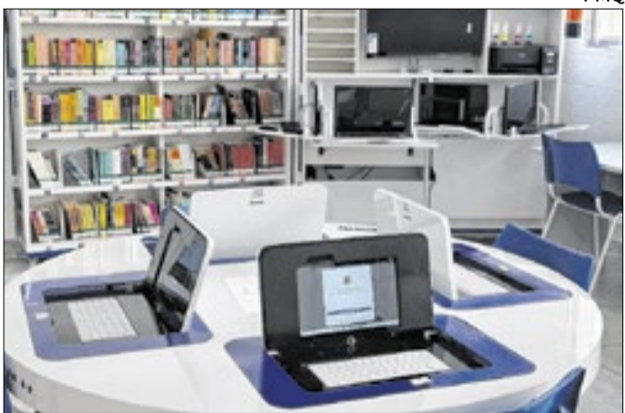
Unidade vai atender 675 alunos da educação municipal

O prefeito destacou que a entrega da unidade representa a retomada de uma obra que ficou paralisada por muitos anos.