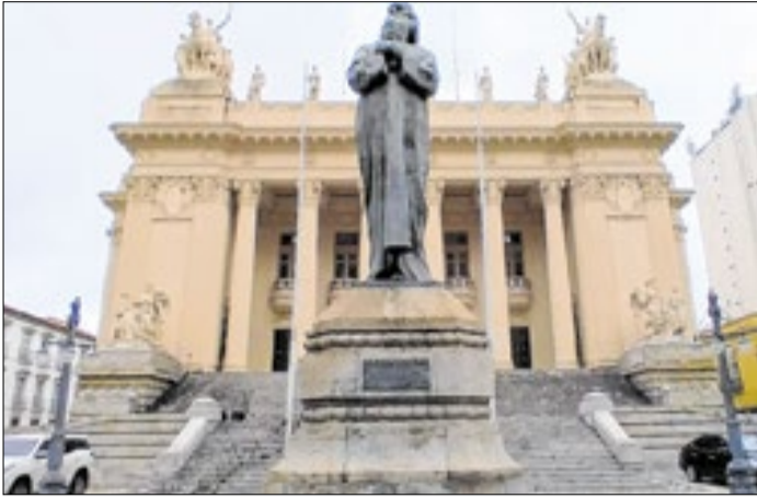
Sede da Alerj, onde será realizado o pré-vestibular social