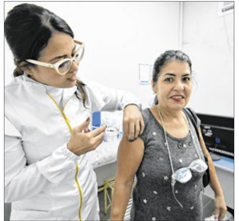
Campanha contra a gripe continua até o dia 30 de maio