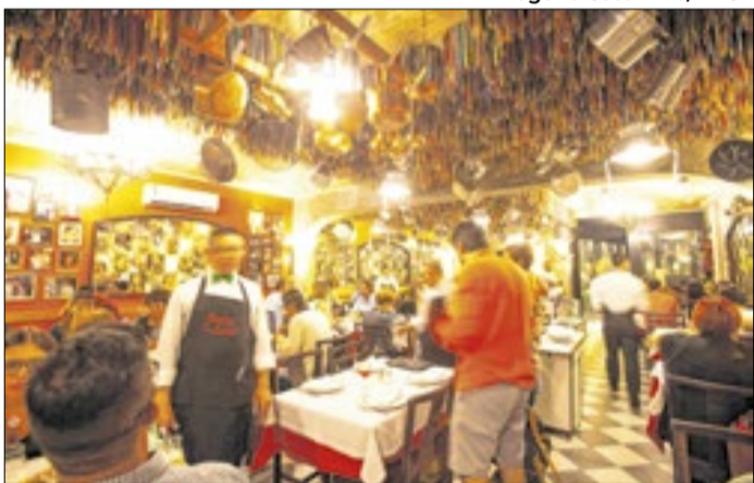
Bares e restaurantes podem ser afetados pelo fim da 6x1