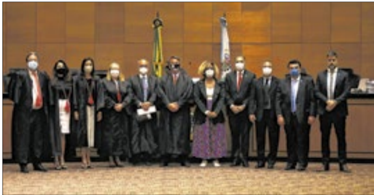
O então presidente do TJRJ, desembargador Cláudio de Mello Tavares, com os cinco desembargadores e cinco deputados estaduais que integraram o Tribunal Especial Misto (TEM) no plenário principal do TJ-RJ