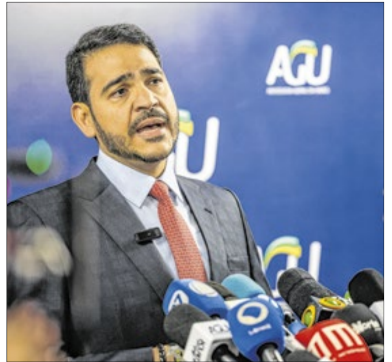
Messias acredita ter conseguido os votos para ser aprovado

É onde, então, parte do entorno do PL tema o fato de Michelle ser a única política com trânsito direto com Bolsonaro. Até onde ela se engajará na campanha do enteado? Ou desgastá-la? Em tempo: o prazo de desincompatibilização no sábado (4) é importante. Mas o jogo oficialmente só começa no meio do ano.