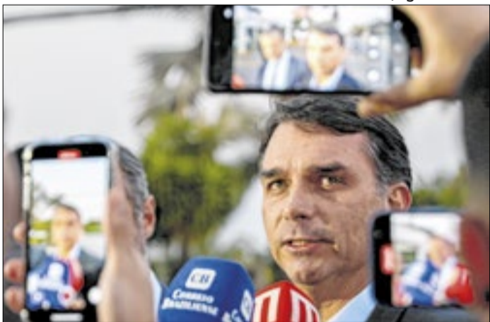
Flávio vem jogando no desgaste de Lula